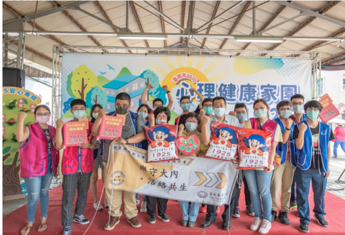
嘉藥師生參加2020心理健康家園活動與民眾一起守護健康