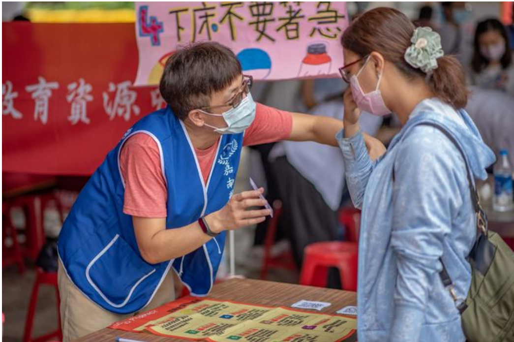
運用趣味桌遊讓民眾了解如何減少剩餘藥品。

http://www.cntimes.info 2020-09-07 20:01:28