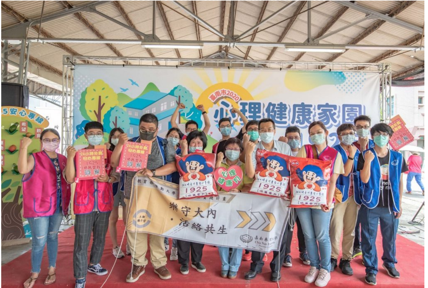
嘉藥跨領域團隊參加心理健康家園活動，與民眾一起守護健康。