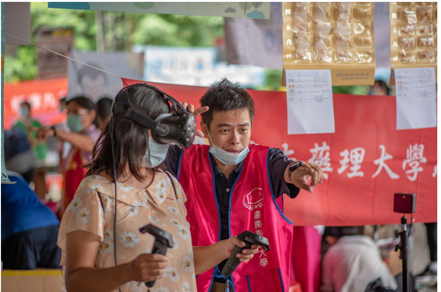
透過VR實際了解毒品對人體的傷害。