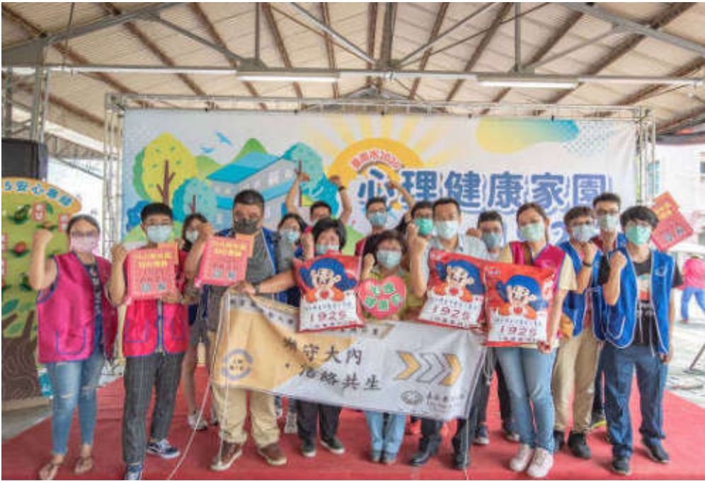
▲長者的醫療照護及衛教與嘉藥一起守護健康