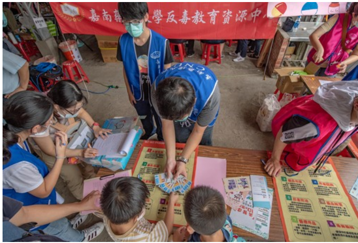
透過遊戲方式讓小朋友學習拒絕毒品的重要性