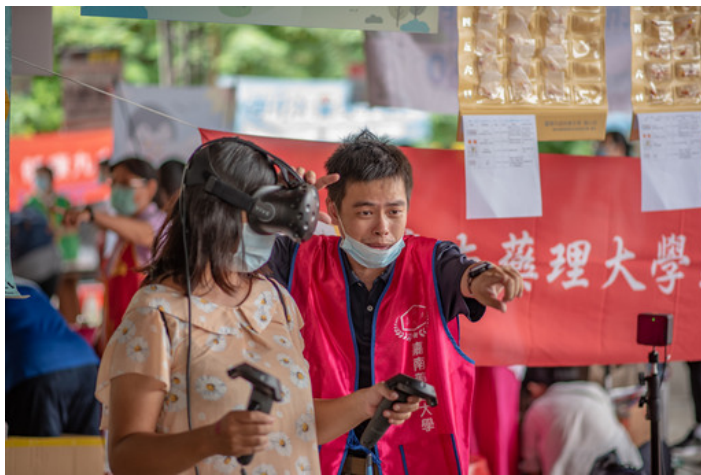
透過VR實際了解毒品對人體的傷害