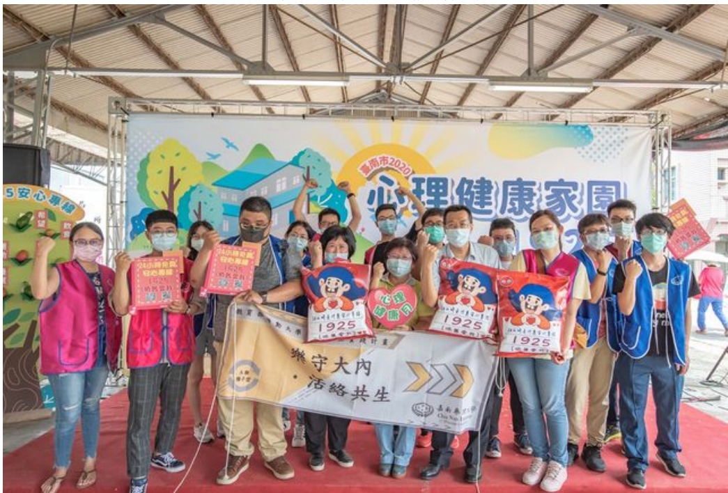
嘉藥師生參加2020心理健康家園活動與民眾一起守護健康。