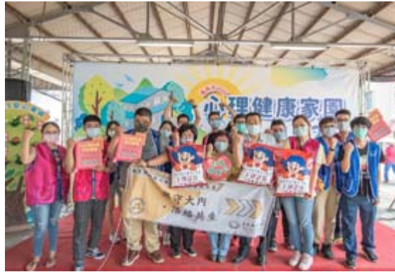
嘉藥師生參加2020心理健康家園活動與民眾一起守護健康。

【記者孫紹逸 / 南市報導】隨著高齡化社會來臨，長者的醫療照護及衛教日益重要，嘉南藥理大學藥理學院與人文暨資訊學院師生組成跨領域團隊，參加由臺南市政府衛生局在大內區青果市場舉辦的「臺南市2020心理健康家園活動」，透過有趣的桌遊及VR體驗活動來增進民眾健康照護及衛教知識，現場超過200名以上名民眾共