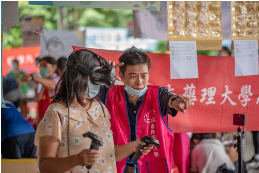
透過VR實際了解毒品對人體的傷害。