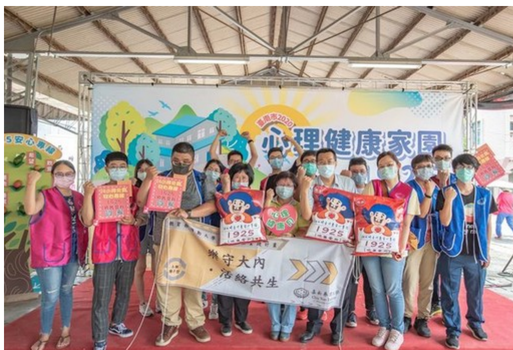
圖2：嘉藥師生參加2020心理健康家園活動與民眾一起守護健康。