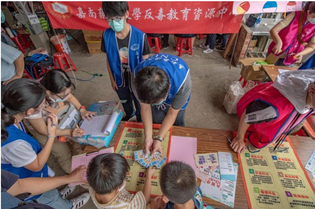
透過遊戲方式讓小朋友學習拒絕毒品的重要性。

隨著高齡化社會來臨，長者的醫療照護及衛教日益重要，嘉南藥理大學藥理學院與人文暨資訊學院師生組成跨領域團隊，參加由臺南市政府衛生局在大內區青果市場舉辦的「臺南市2020心理健康家園活動」，透過有趣的桌遊及VR體驗活動來增進民眾健康照護及衛教知識，現場超過200名以上名民眾共襄盛舉，不僅民眾大呼有趣又能學到知識，參與活動的學生也在與民眾的互動中吸收經驗，成就感滿滿。