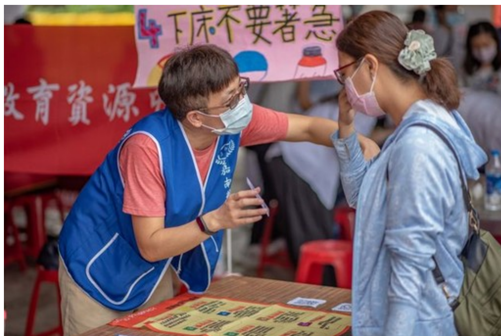
圖1：運用趣味桌遊讓民眾了解如何減少剩餘藥品。