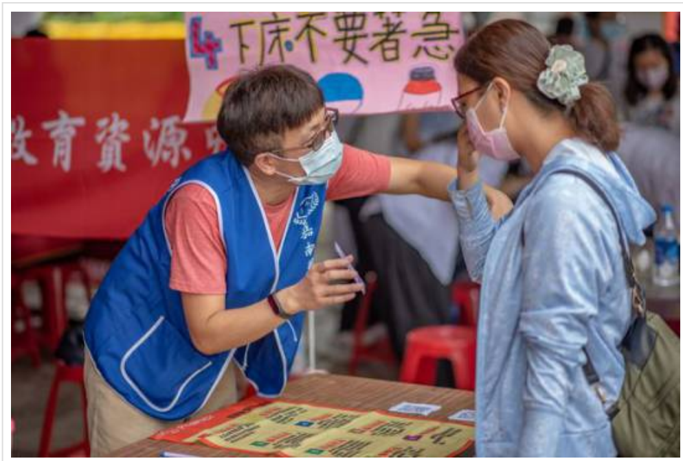
▲ 2020心理健康家園活動 與嘉藥一起守護健康

隨著高齡化社會來臨，長者的醫療照護及衛教日益重要，嘉南藥理大學藥理學院與人文暨資訊學院師生組成跨領域團隊，參加由臺南市政府衛生局在大內區青果市場舉辦的「臺南市2020心理健康家園活動」，透過有趣的桌遊及VR體驗活動來增進民眾健康照護及衛教知識，現場超過200名以上名民眾共襄盛舉，不僅民眾大呼有趣又能學到知識，參與活動的學生也在與民眾的互動中吸收經驗，成就感滿滿。