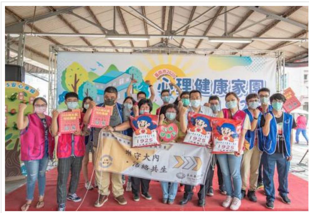
▲ 2020心理健康家園活動 與嘉藥一起守護健康