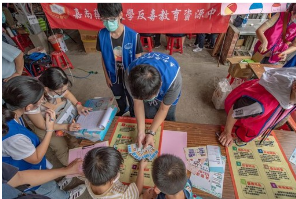
圖4：透過遊戲方式讓小朋友學習拒絕毒品的重要性。