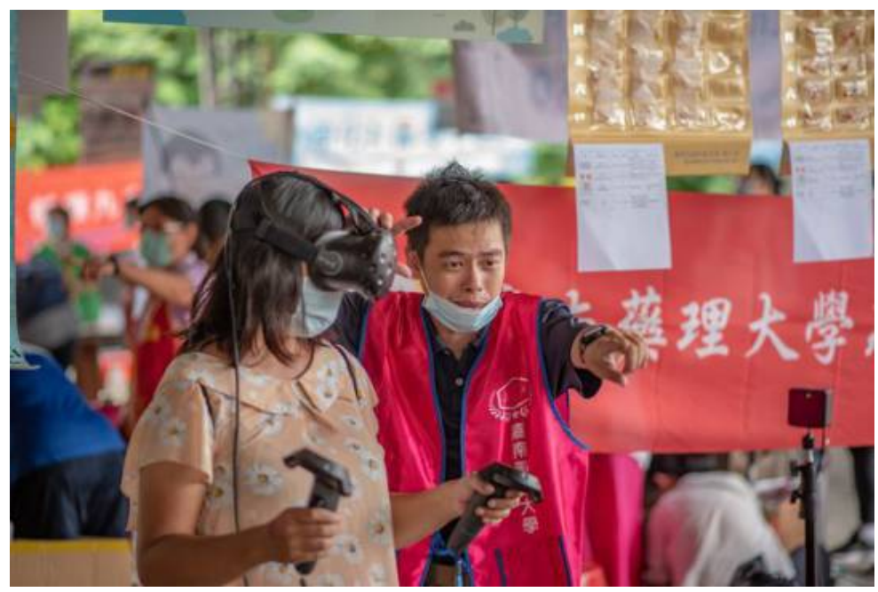
▲ 2020心理健康家園活動 與嘉藥一起守護健康