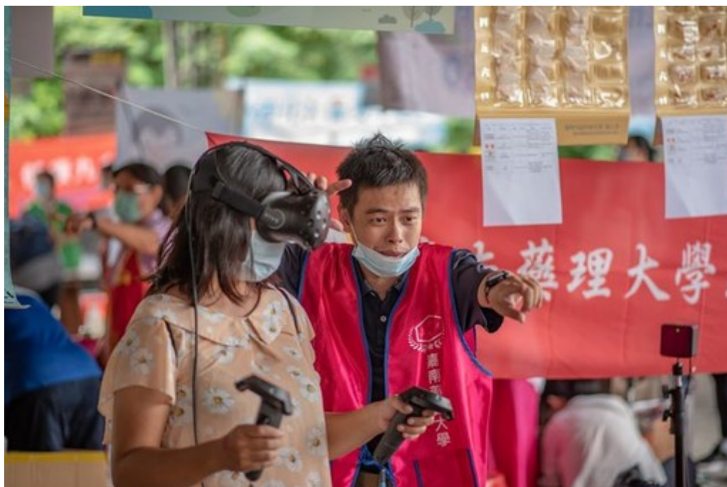
圖3：透過VR實際了解毒品對人體的傷害。