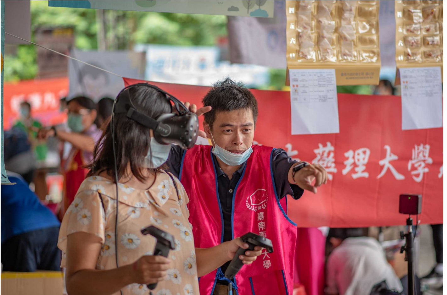
圖：嘉藥透過VR讓民眾實際了解毒品對人體的傷害。

隨著高齡化社會來臨，長者的醫療照護及衛教日益重要，嘉南藥理大學參加「台南市二〇二〇心理健康家園活動」，透過有趣的桌遊及VR體驗活動，增進民眾健康照護及衛教知識，現場超過二百名以上名民眾共襄盛舉，不僅民眾大呼有趣又能學到知識，參與活動的學生也在與民眾的互動中吸收經驗，成就感滿滿。