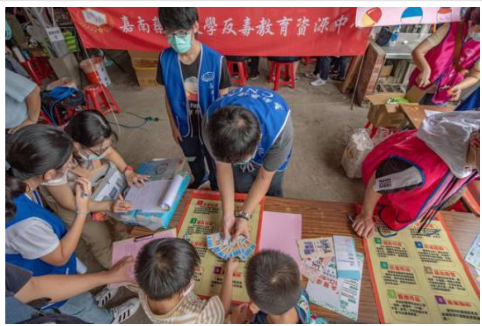
▲ 2020心理健康家園活動 與嘉藥一起守護健康