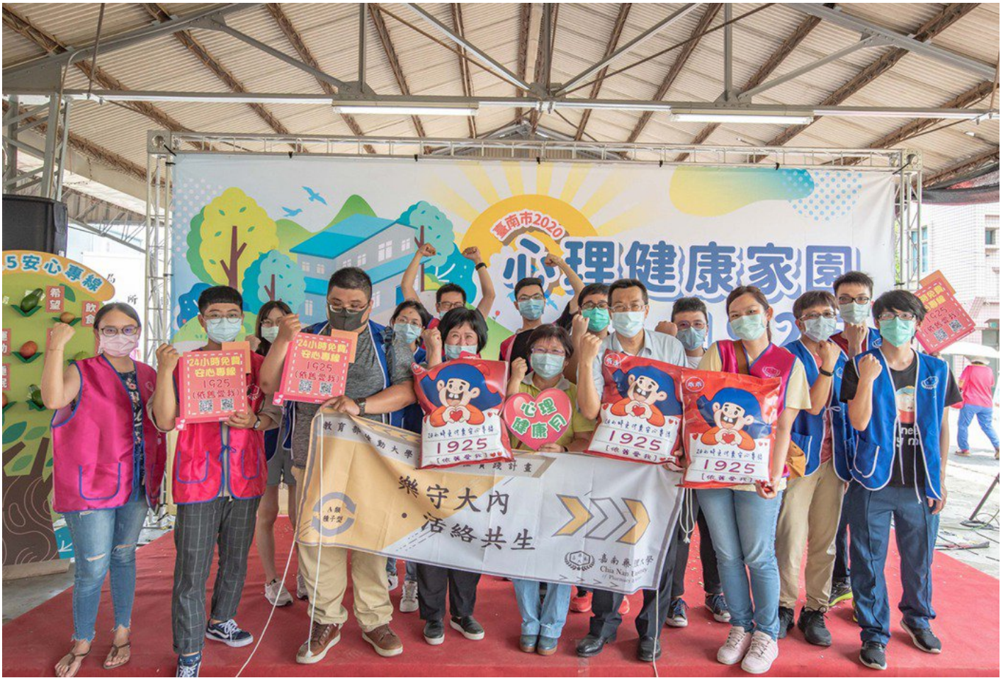
嘉藥師生參加2020心理健康家園活動與民眾一起守護健康。