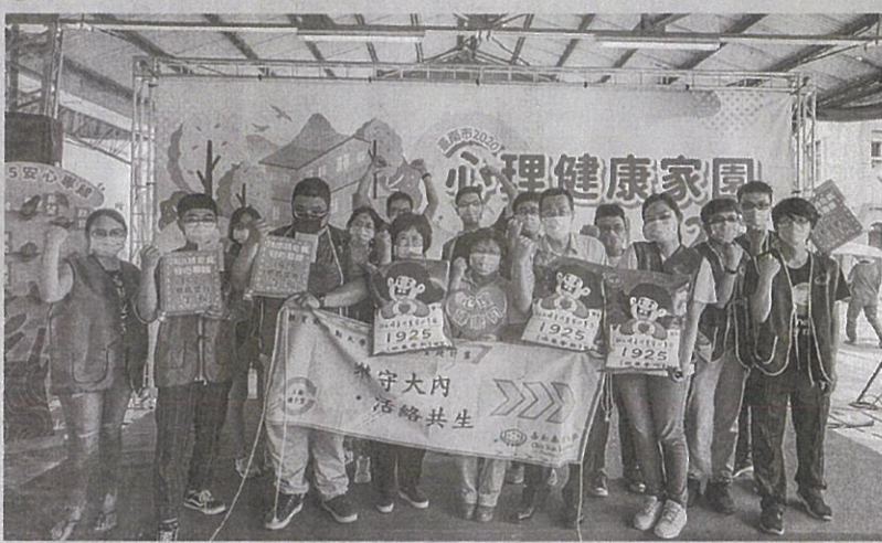
嘉藥師生參加2020心理健康家園活動與民眾一起守護健康。

【記者孫紹逸／南市報導】隨著高齡化社會來臨，長者的醫療照護及衛教日益重要，嘉南藥理大學藥理學院與人文暨資訊學院師生組成跨領域團隊，參加由臺南市政府衛生局在大內區青果市場舉辦的「臺南市2020心理健康家園活動」，透過有趣的桌遊及VR體驗活動來增進民眾健康照護及衛教知識，現場超過200名以上名民眾共襄盛舉，不僅民眾大呼有趣又能學到知識，參與活動的學生也在與民眾的互動中吸收經驗，成就感滿滿。