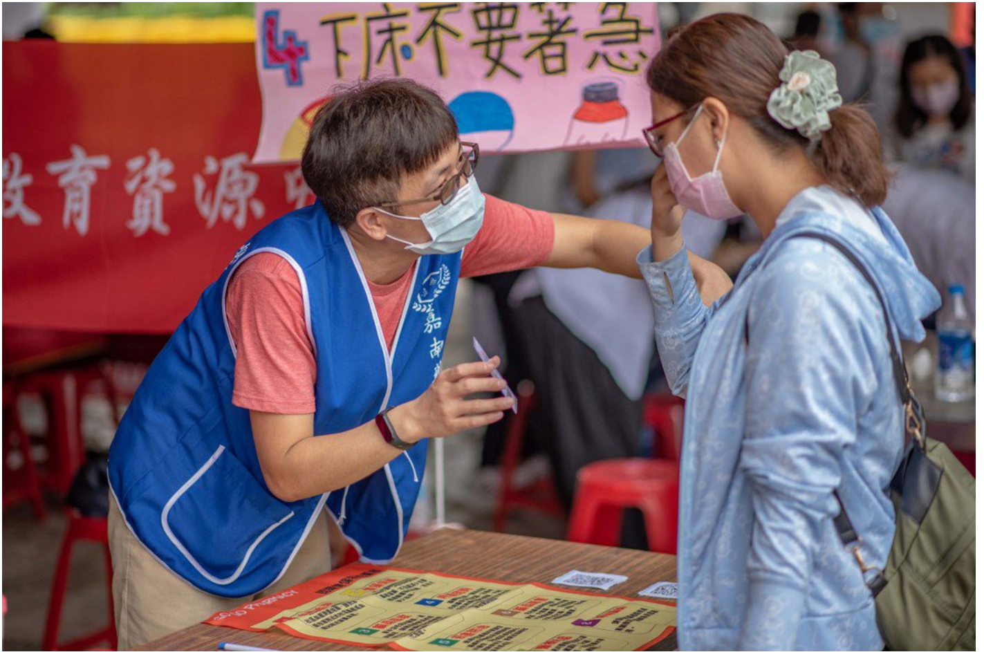
運用趣味桌遊讓民眾了解如何減少剩餘藥品。嘉藥 / 提供