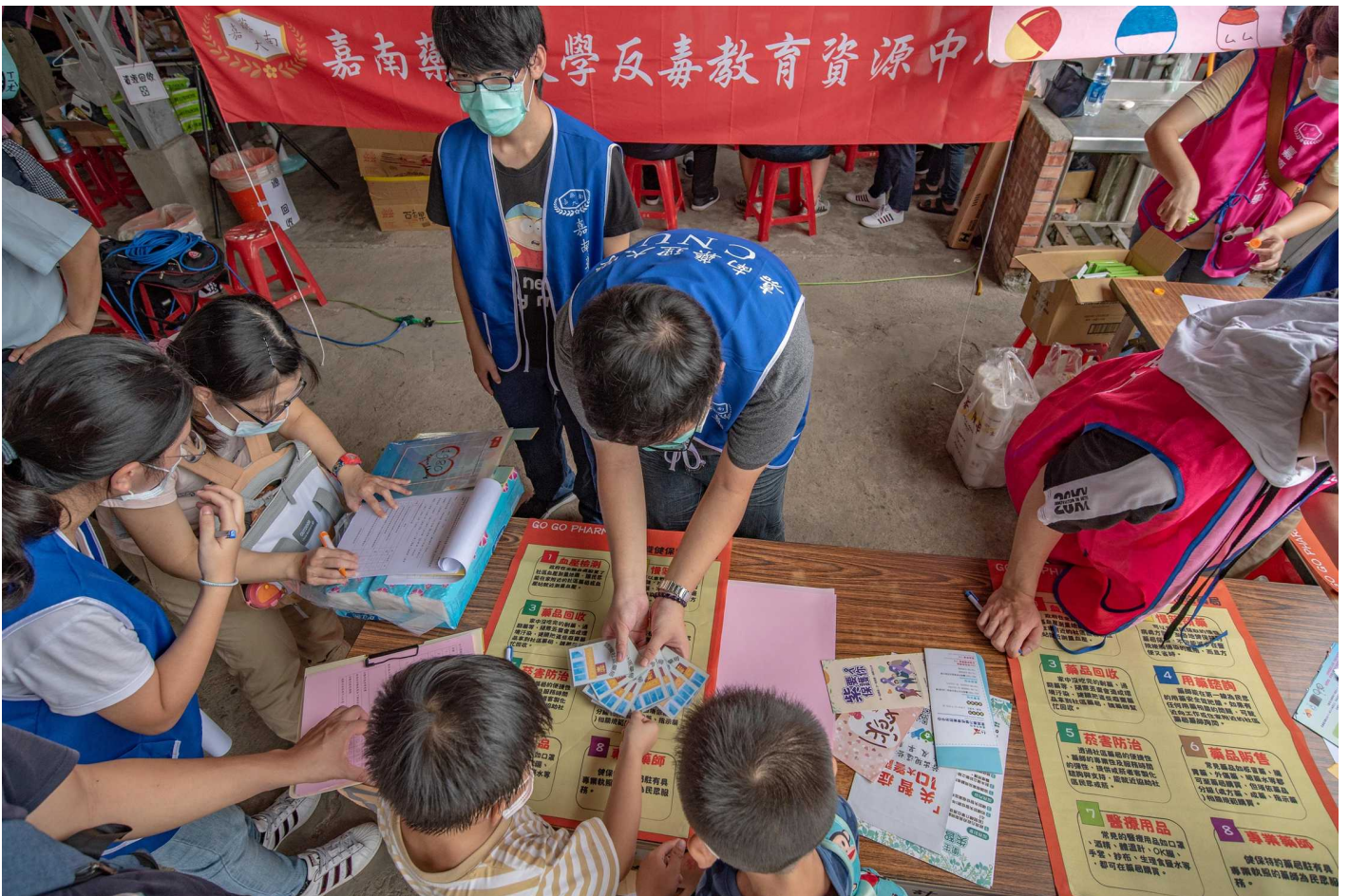
圖：嘉藥學生透過遊戲方式讓小朋友學習拒絕毒品的重要性。(記者黃鐘毅 / 攝)

嘉藥藥理學院推動「樂守內庄 活絡共生」計畫，與大內區衛生所長期合作進行多重慢性疾病長者的居家關懷，特結合人資學院，推出「VR反毒遊戲 - 打擊毒品、守護健康」及「與健保特約藥局守護你我健康」趣味桌遊與壁掛式藥袋介紹，活動則聚焦於提升民眾服藥配合度以減少剩餘藥品，除落實用藥安全教育、推廣社區健保藥局在醫療保健網所扮演角色外，同時也活化計畫社區據點。