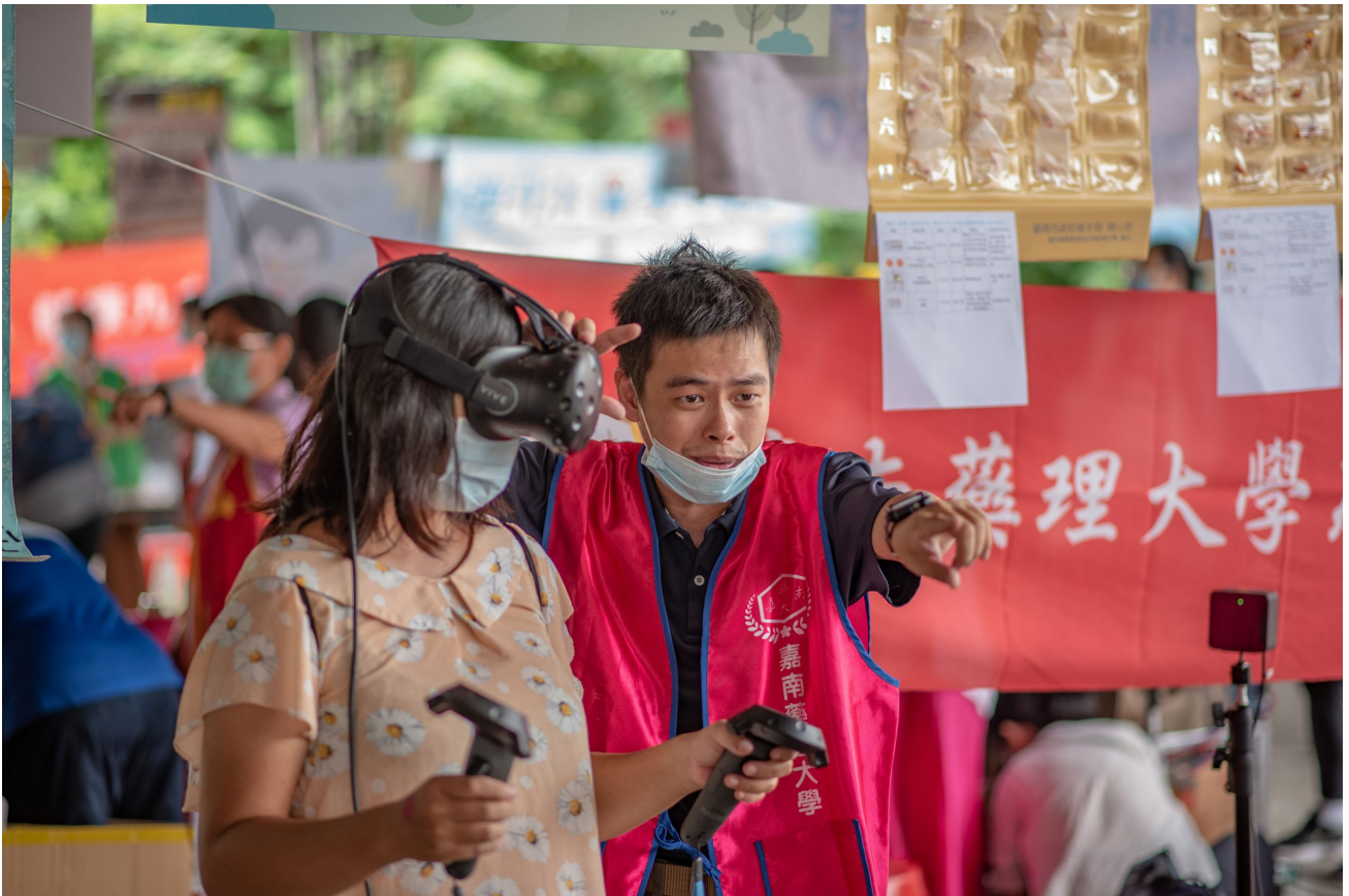
透過VR實際了解毒品對人體的傷害

為實踐大學社會責任，嘉藥藥理學院推動「樂守內庄 活絡共生」計畫，與大內區衛生所長期合作進行多重慢性疾病長者的居家關懷。「2020心理健康家園活動」選在大內舉辦，嘉藥當仁不讓，為增加活動多元與趣味性，特結合人資學院，推出「VR反毒遊戲—打擊毒品、守護健康」，結合最夯VR體驗來宣導毒品危害，守護你我健康。而「與健保特約藥局守護你我健康」趣味桌遊與壁掛式藥袋介紹活動則聚焦於提升民眾服藥配合度以減少剩餘藥品，除落實用藥安全教育、推廣社區健保藥局在醫療保健網所扮演角色外，同時也活化計畫社區據點。