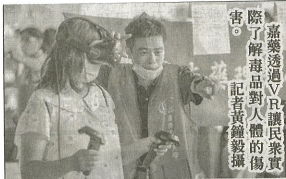
嘉藥透過VR讓民眾實際了解毒品對人體的傷害。 記者黃鐘毅攝