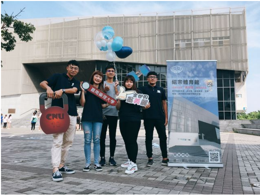
開學當天舉辦拍照上傳嘉藥臉書抽獎活動。

嘉南藥理大學昨天於該校紹宗體育館舉行新生開訓典禮，超過3000名嘉藥新鮮人在學長姐及師長迎領下，緩緩進入會場，象徵著大學生活的開始，開訓典禮以「閃亮佳人 新星耀眼」為主題，意味著每位新生都是一顆閃耀的星星，期許未來四年，這些星星們在嘉藥校園中大放光芒、快樂學習，迎向人生新階段。