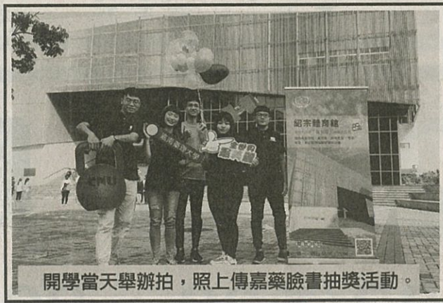
開學當天舉辦拍，照上傳嘉藥臉書抽獎活動。

李校長以搖鈴方式開啓四年的求學鐘響，象徵「上課了」寄予每位新生規劃未來四年屬於自己的大學生活，於大學四年中都能學有所成，把握機會，看見契機，成為屬於自己獨一無二的耀眼新星。