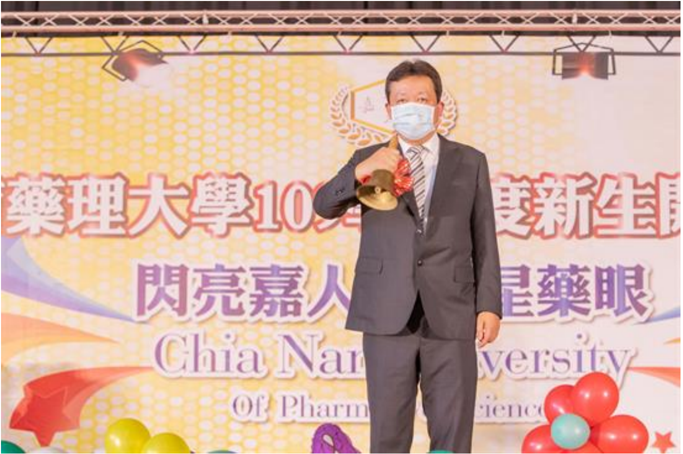
閃亮嘉人 新星藥眼 熱情迎新 新鮮人加入嘉藥大家庭

(中央社訊息服務20200914 09:23:59)嘉南藥理大學13日於紹宗體育館舉行新生開訓典禮，超過3000名嘉藥新鮮人在學長姐及師長迎領下，進入會場，象徵著大學生活的開始，開訓典禮以「閃亮佳人 新星耀眼」為主題，意味著每位新生都是一顆閃耀的星星，期許未來四年，這些星星們在嘉藥校園中大放光芒、快樂學習，迎向人生新階段。