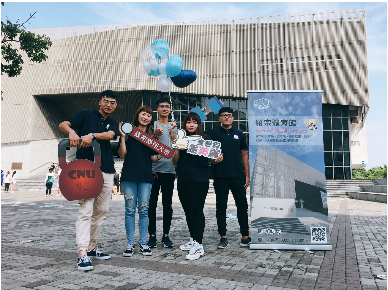
開學當天舉辦拍照上傳嘉藥臉書抽獎活動

面對3,000多位嘉藥新鮮人，校長李孫榮以「三大追求」及「三心」來勉勵新生，人生只有一次大學階段，除要善用學校資源來「快樂學習」以增進知識與強健體魄外，積極參加社團有助於「廣交志同道合好友，累積人脈」，而「勇於追求開闊視野」才立足在這地球村時代。「三心」則需要永無止境累積才能趨於豐沛，優越專業知識可以加強「自信心」，在與社會接軌後則需要培養「同理心」，逐步在人際互動中找到定位與平衡，而「平安心」是李校長對新生的期許，面對外在環境變化，懷抱一顆「平安心」，不計較得失，勇於面對挑戰，策勵未來。