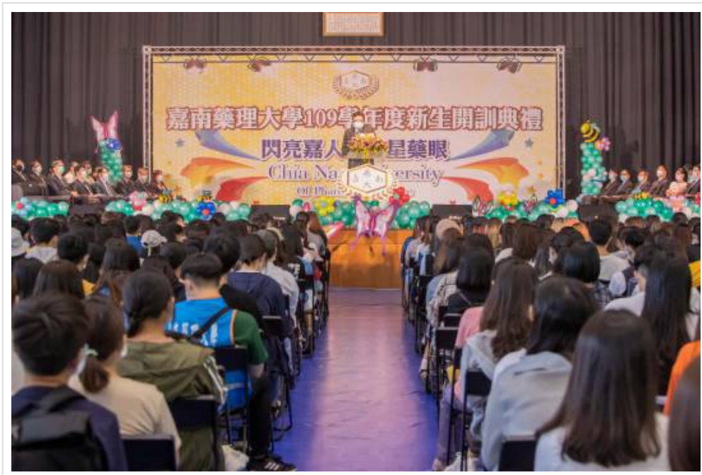
▲ 嘉南藥理大學~閃亮嘉人 新星藥眼