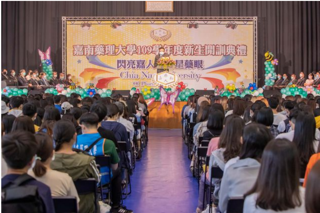
嘉南藥大昨天舉辦開學典禮歡喜迎接3,000多位嘉藥新鮮人。

http://www.cntimes.info 2020-09-14 20:00:27