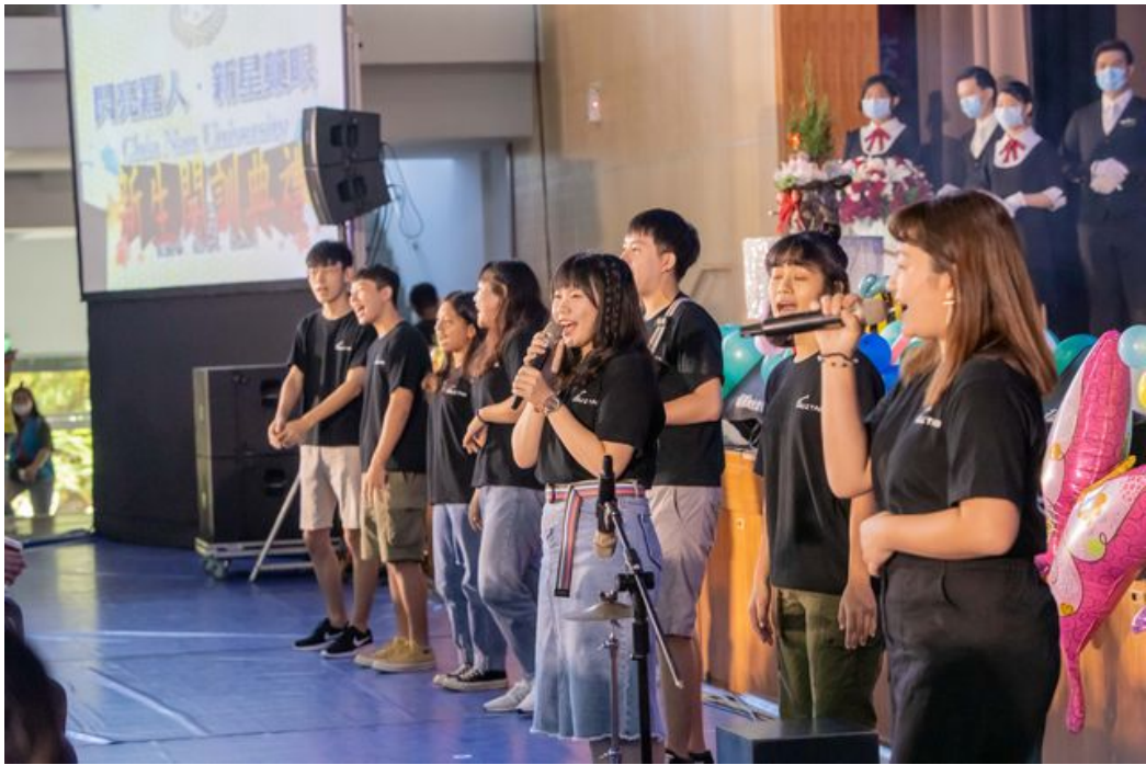
嘉藥吉他社學長姐們熱情開唱迎接新生。