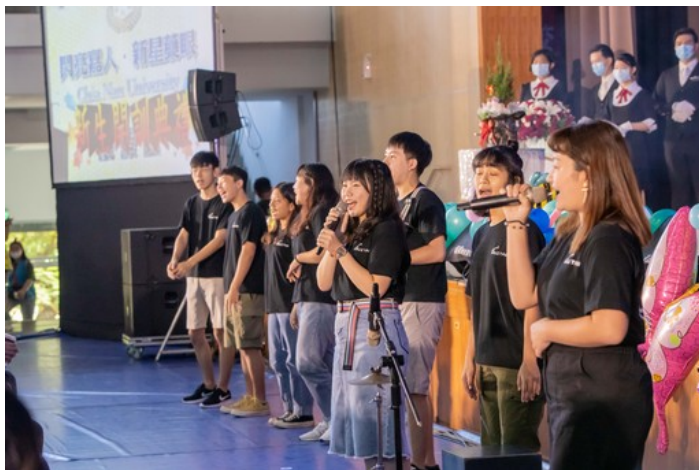
嘉藥吉他社學長姐們熱情開唱迎接新生