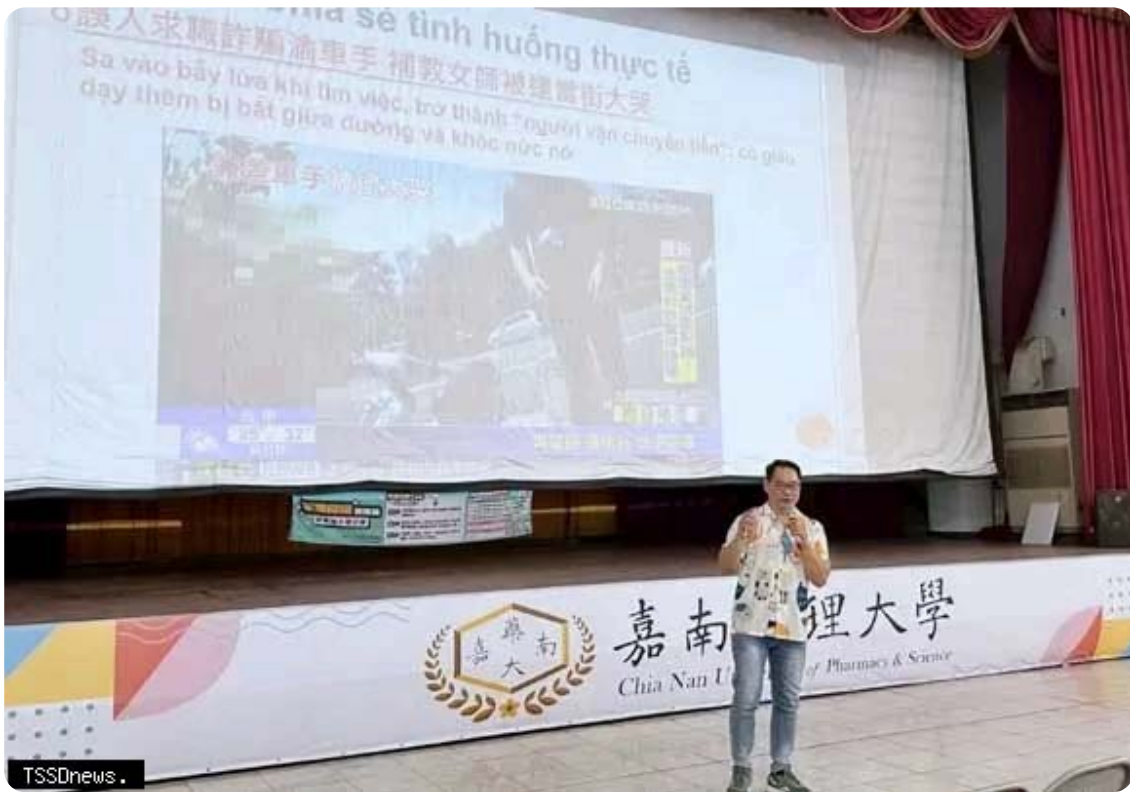
南市勞工局前進嘉南藥理大學辦境外生求職防騙校園講座 強化正確觀念確保權益。