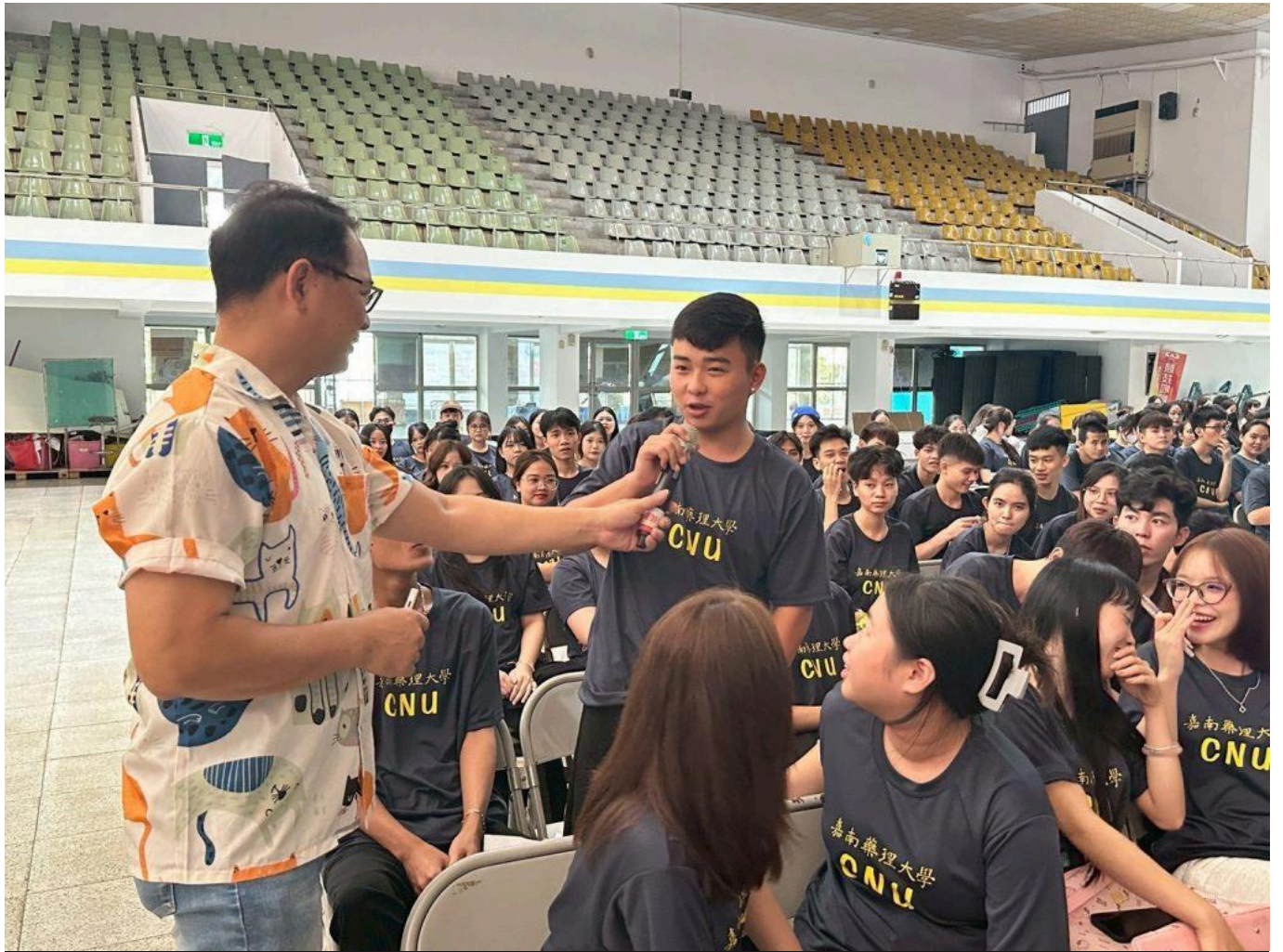
勞工局至嘉南藥理大學辦理境外生求職防騙校園講座。