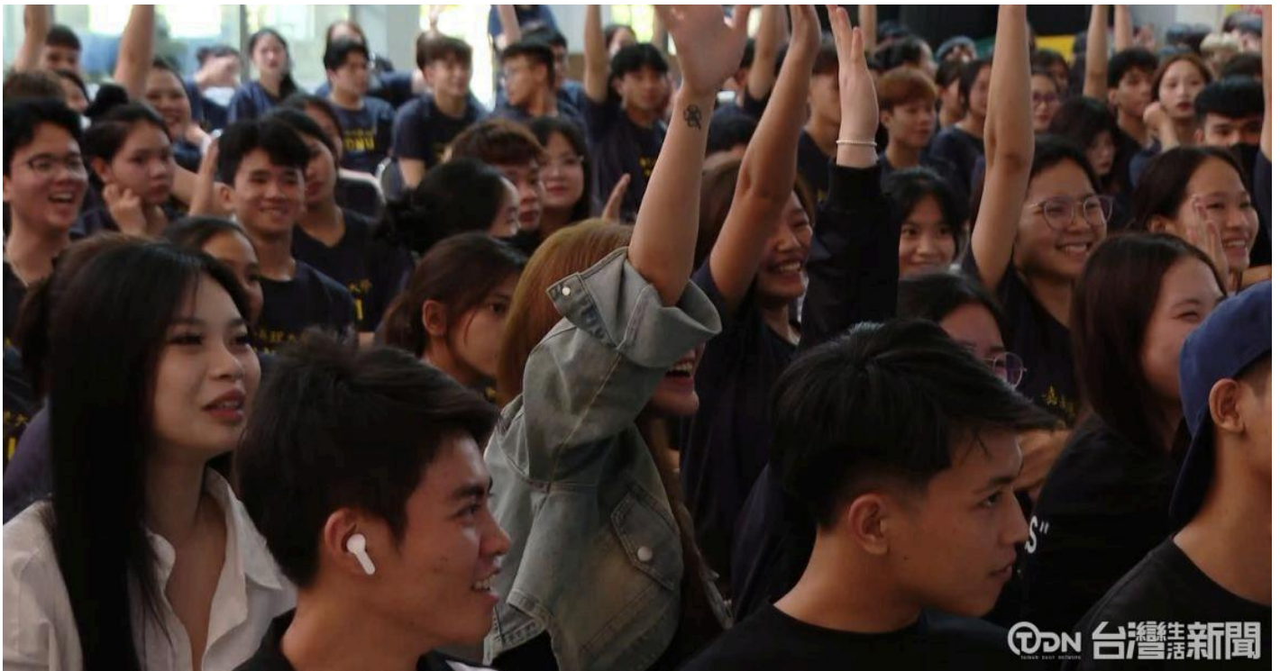
▲臺南市政府勞工局主辦的求職防騙宣導講座在嘉南藥理大學進行最後一場的校園宣導。

在宣導講座最後一個環節，過去都需要講師輸出更多能量讓學生動起來，不過在最後這場嘉南藥理大學場次，越南籍的學生面對每一個題目都非常熱烈的搶答，回答出來不只方向對，答案正確性也很高，希望這場求職防騙活動所宣導的東西，對於他們未來求職路上會有幫助。