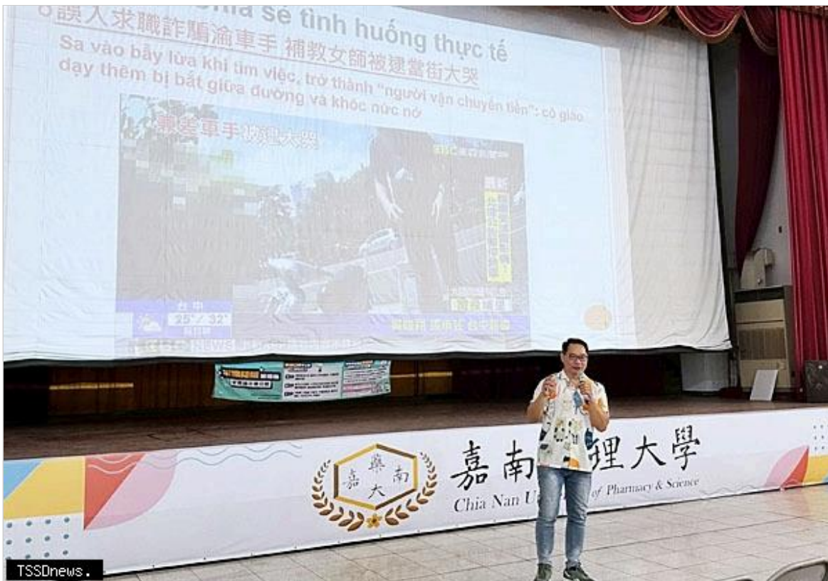
▲南市勞工局前進嘉南藥理大學辦境外生求職防騙校園講座 強化正確觀念確保權益。 (記者李嘉祥攝)

來台境外生人數逐年攀升，臺南市大專院校眾多，境外生除求學唸書習取知識，也面臨打工及未來就業問題，臺南市政府勞工局勞工局13日特至仁德區嘉南藥理大學為越