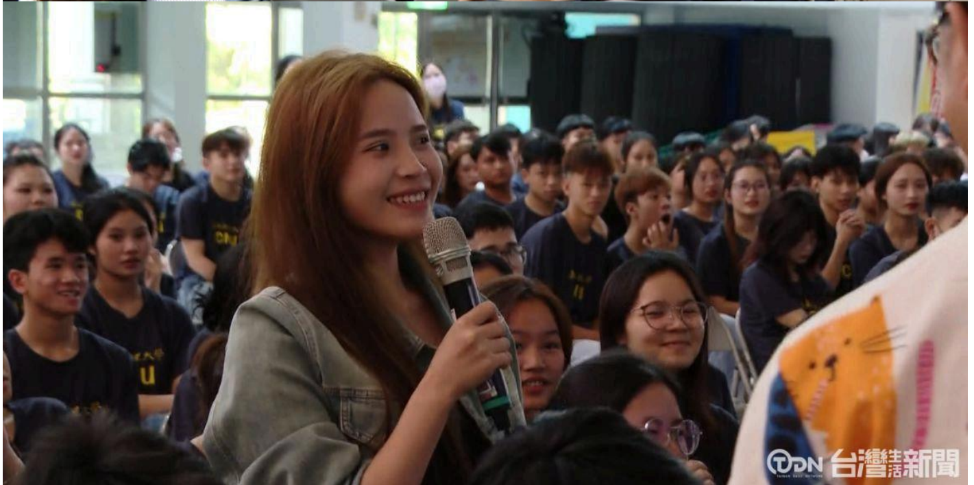
▲勞工局主辦的求職防騙宣導講座前往嘉南藥理大學。

而在台上協助翻譯整場的工作人員，是任職學校國際學生產學合作專班 也是在臺灣求學完成後，繼續留在臺灣工作生活的越南籍助理，在整場宣導講座裡面除了翻譯，也同時在吸收不一樣的新知識。