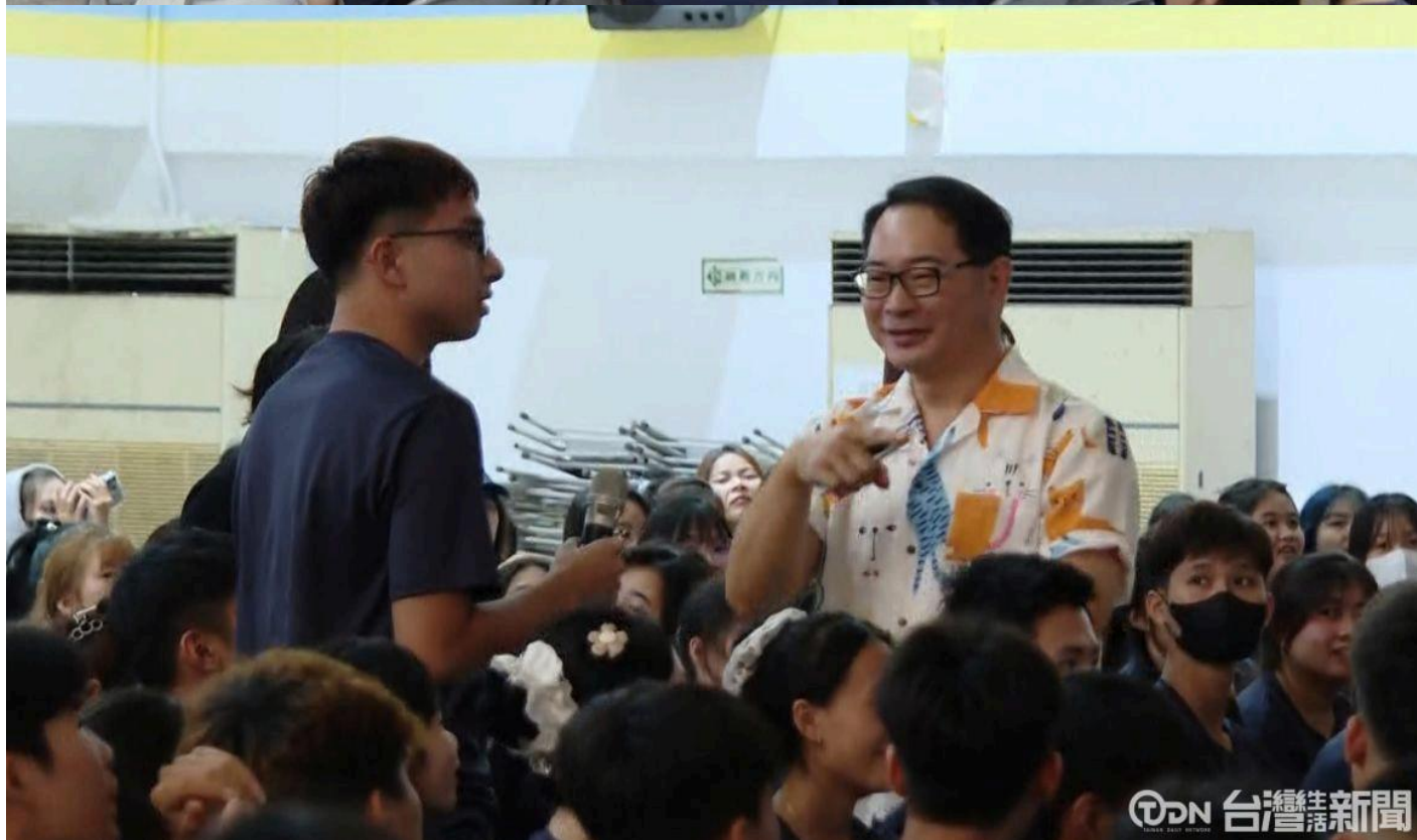
▲臺南市政府勞工局主辦的求職防騙宣導講座前往嘉南藥理大學進行最後一場的校園 宣導。

臺越語言的同步翻譯加上簡報上面也同時出現兩國的文字，讓現場的越籍學生在聽跟看都能夠接收到正確的訊息，而講師除了靜態的圖文宣導，也放了幾個有包含影片的 案例跟學生做分享，都是希望讓他們在現在求學階段就可以提早學習未來求職可能遇 到的狀況。