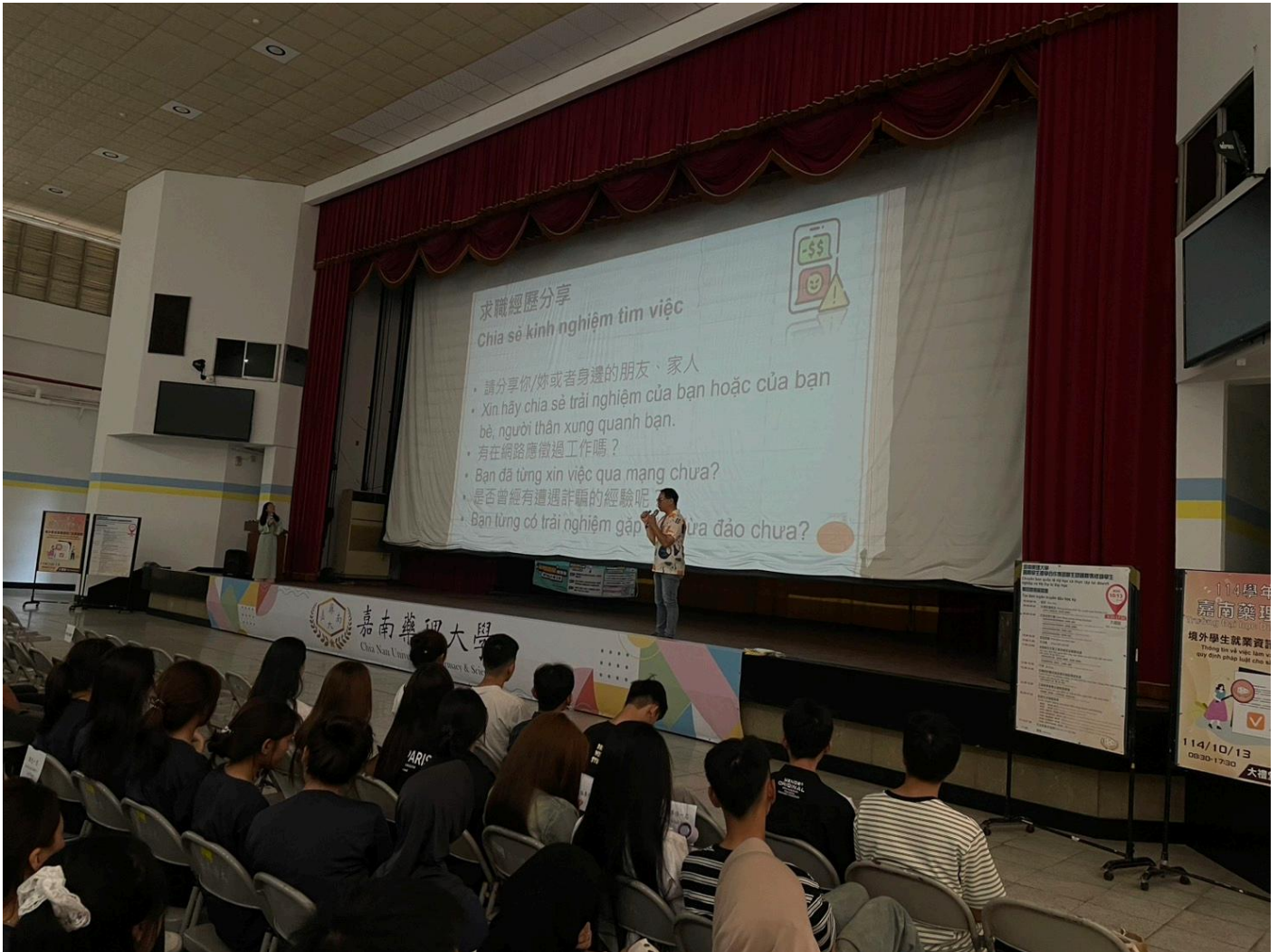
▲勞工局至嘉南藥理大學辦理境外生求職防騙校園講座。

勞工局長王鑫基表示，境外生在台求學期間有打工需求，最怕遭遇少數不良的雇主，利用境外生對當地語言及人文就業環境未能熟稔，但又迫於有經濟需求及並急需打工貼補學費及生活費用，以各種層出不窮新型的求職騙術，譬如在社群貼文可輕鬆工作入帳，誘騙強制集體軟禁居留，迫使交出個人存摺及身份證件，或另佯裝以購買材料在家工作家庭代工、或是未諳當地法令成為廉價勞工或非法工作而觸犯當地法令，協助取款擔任提款車手，並以簡化面試機會，以線上運用通訊軟體面試提供個人身份證件或帳戶等個人資料，遇到這些求職的詐騙手法，一再翻新，花招層出不窮，防不勝防。或以可斜桿兼職從事工作騙取求職人資料進行詐騙。