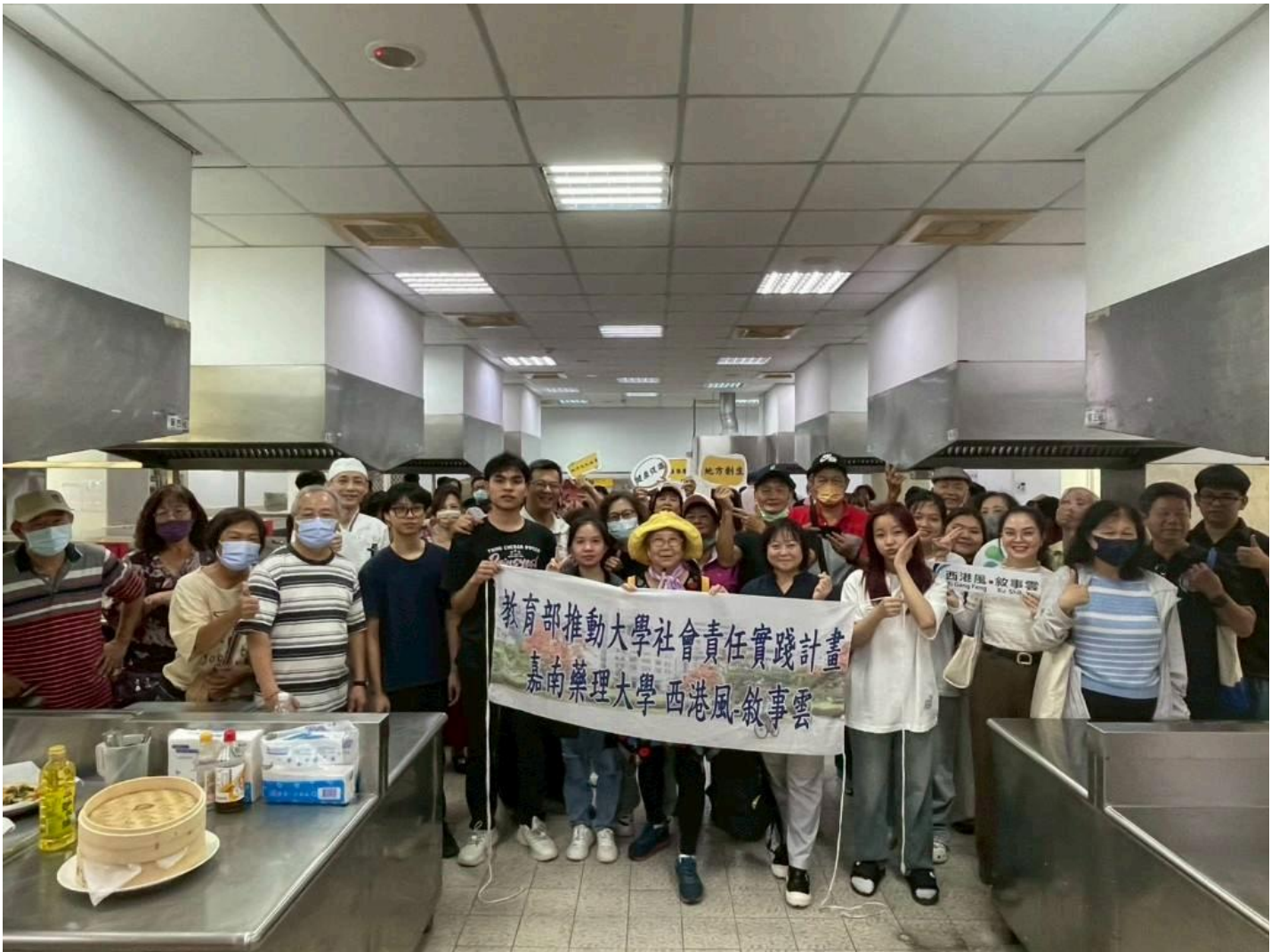
嘉南藥理大學攜手西港長輩共享重陽芝麻好食光。