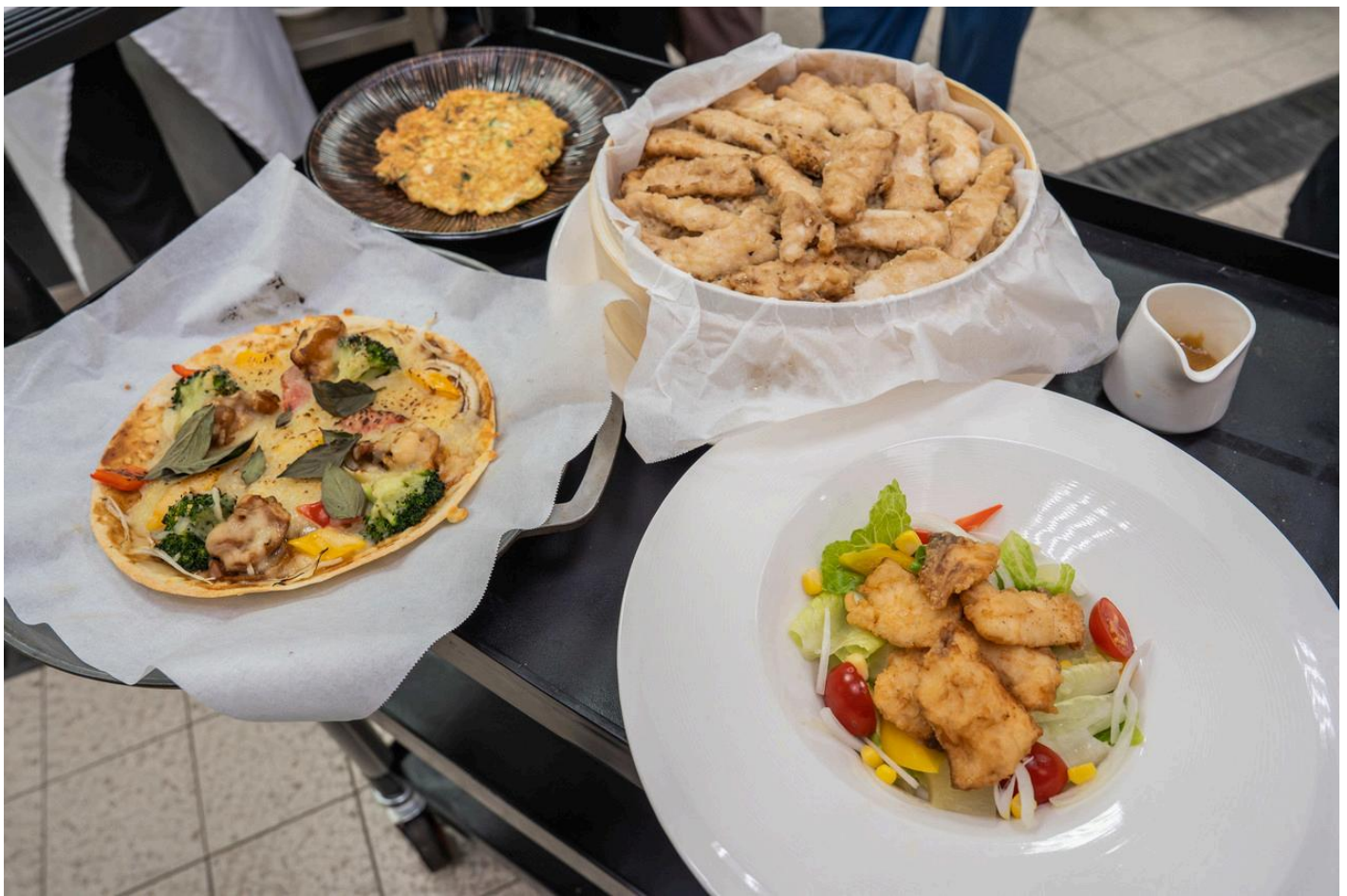
圖：嘉藥餐旅系師生烹煮五道芝麻創意料理。(記者黃鐘毅／翻攝)

除了運動體驗外，餐旅系師生以西港特產「芝麻」為主題，設計出五道創意料理，包含DIY「胡麻味噌醬」、清爽「胡麻鯛魚沙拉」、異國風「麻油雞肉墨西哥餅披薩」、結合台南特產的「麻油虱目魚柳米糕」及創意「麻油科學麵煎餅」，長輩們不僅享受美食，也從中學習芝麻的營養價值與在地農產的創新應用。