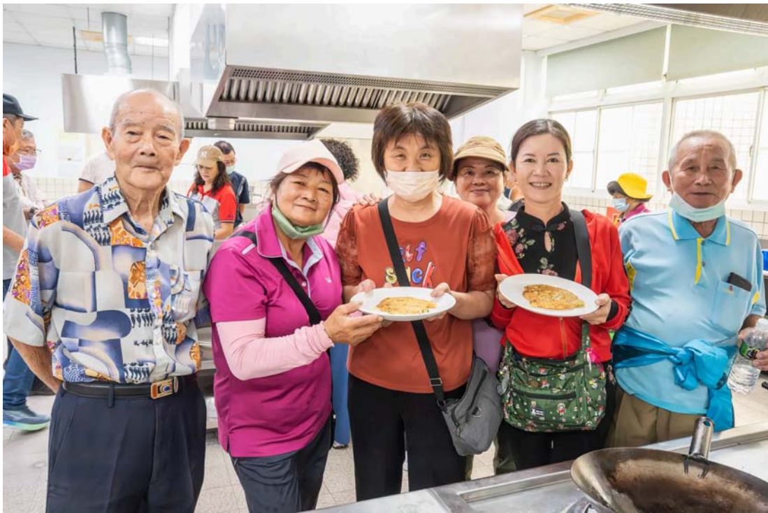
西港區長輩開心享用自己烹煮的創意料理。

誰說重陽節只能吃糕？嘉南藥理大學智慧生活學院於重陽節前夕，舉辦「重陽健身趣·芝麻好食光」活動，邀請西港區慶安里的阿公阿嬤們走入校園，在大學生及越南國際生的陪伴下，體驗「夜店風」的健身中心器材，還能享用結合在地食材的「五道芝麻創意料理」，長輩們直呼，這個重陽節，真正有「動」有「呷」足好玩！