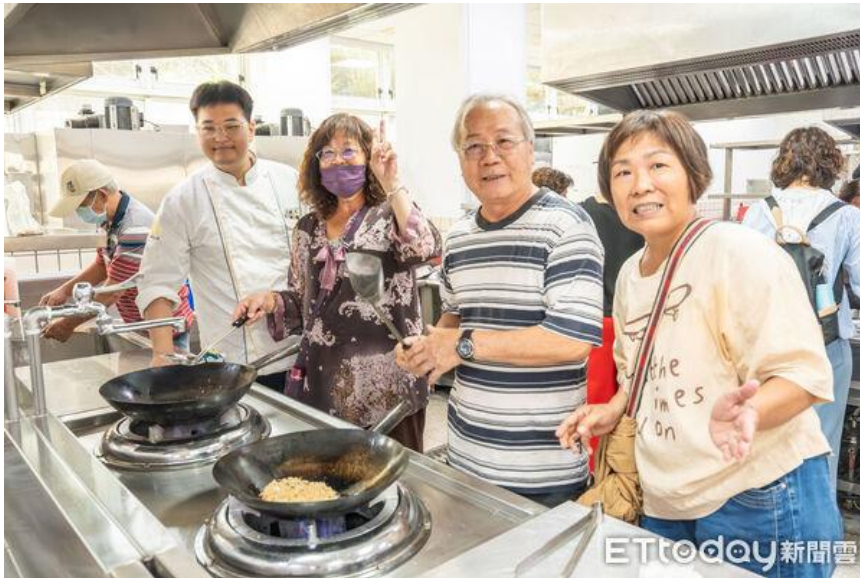
▲嘉藥邀西港長輩走進校園體驗飛輪課程，重陽節動出健康活力。