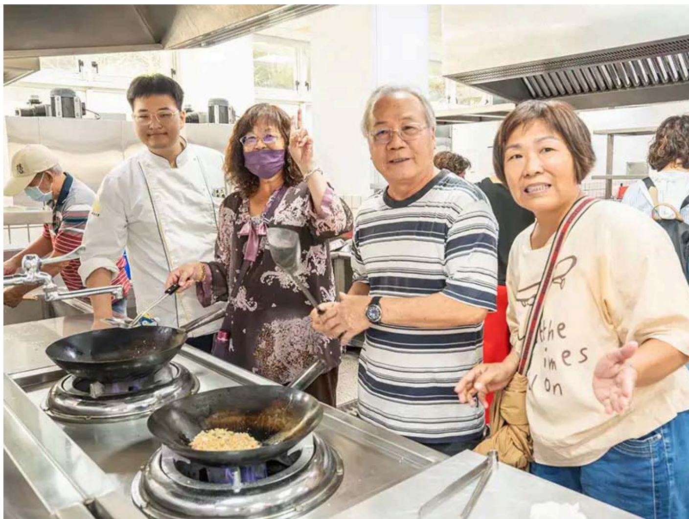
嘉藥餐旅系學生教導長輩製作創意麵煎餅。

除了運動體驗外，餐旅系師生以西港特產「芝麻」為主題，設計出五道創意料理，包含DIY「胡麻味噌醬」、清爽「胡麻鯛魚沙拉」、異國風「麻油雞肉墨西哥餅披薩」、結合台南特產的「麻油虱目魚柳米糕」及創意「麻油科學麵煎餅」，長輩們不僅享受美食，也從中學習芝麻的營養價值與在地農產的創新應用。