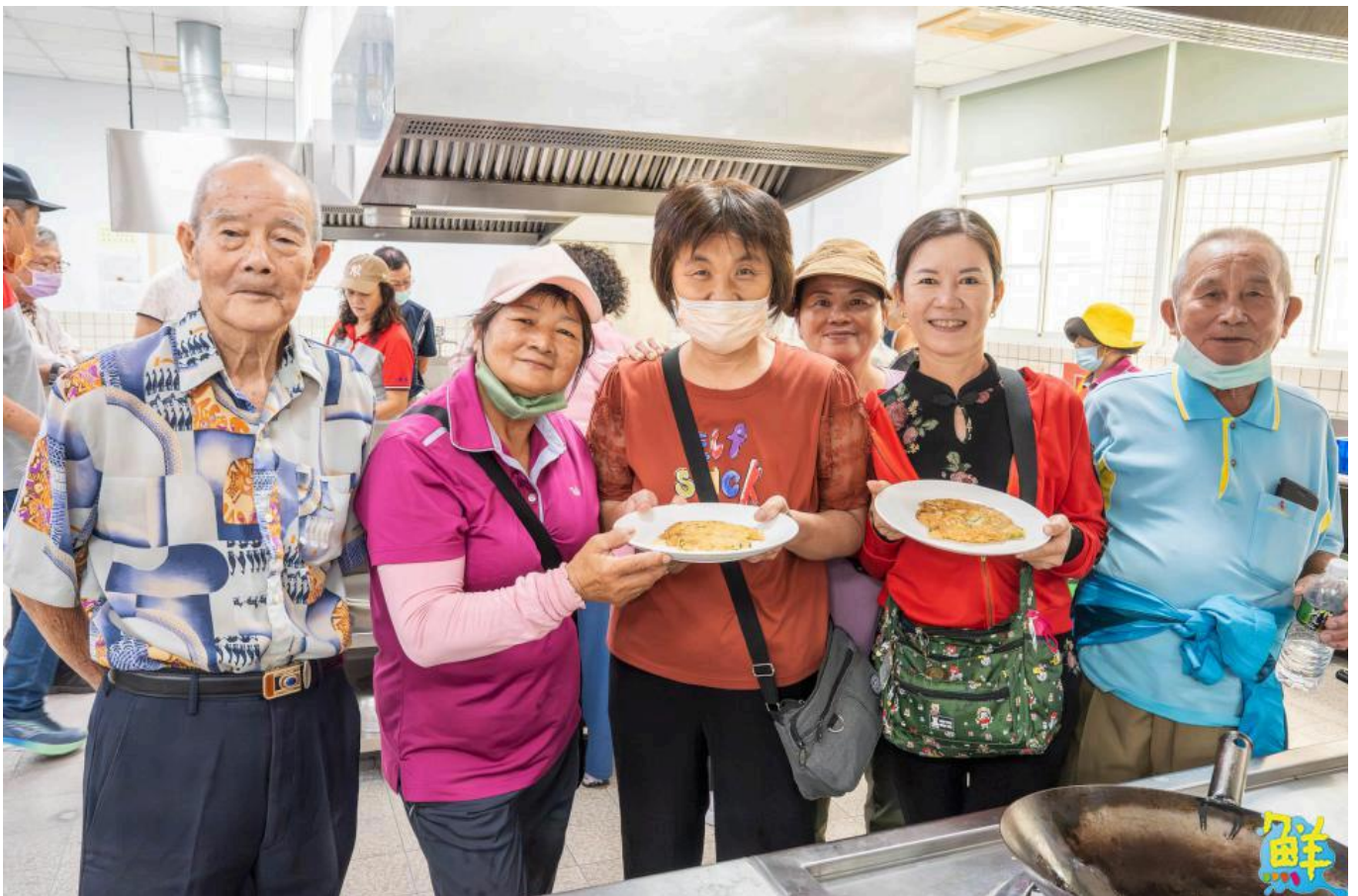
▲西港區長輩開心享用自己烹煮的創意料理