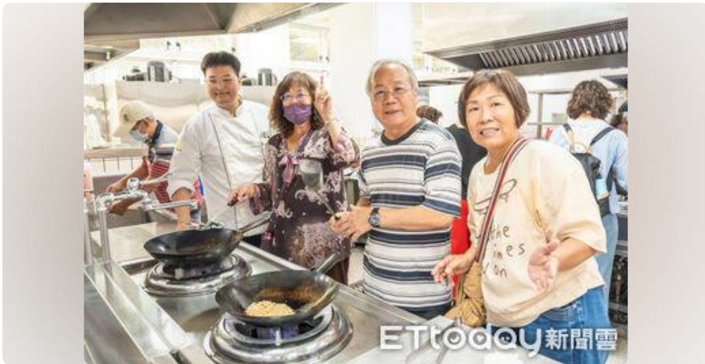
重陽不只吃糕！嘉藥揪西港長輩踩飛輪吃芝麻料理健康過節