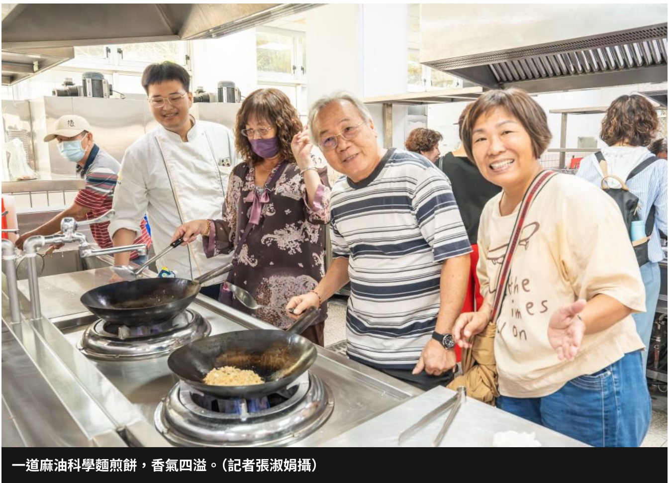
一道麻油科學麵煎餅，香氣四溢。

嘉南藥理大學攜手西港長輩共享「重陽健身趣·芝麻好食光」，不只吃創意料理，還尬飛輪。嘉藥表示，重陽節不只吃糕，還要吃在地的創意美食胡麻鯛魚沙拉和麻油虱目魚柳米糕，更有麻油科學麵煎餅，同時也體驗夜店風，由跑步機到飛輪，讓長輩吃好動好，健康滿分。