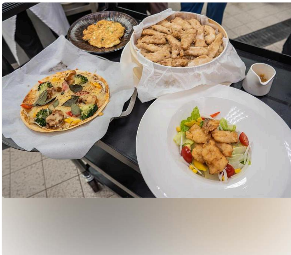
嘉藥餐旅系師生烹煮五道芝麻創意料理

除了運動體驗外，餐旅系師生以西港特產「芝麻」為主題，設計出五道創意料理，包含DIY「胡麻味噌醬」、清爽「胡麻鯛魚沙拉」、異國風「麻油雞肉墨西哥餅披薩」、結合台南特產的「麻油虱目魚柳米糕」及創意「麻油科學麵煎餅」，長輩們不僅享受美食，也從中學習芝麻的營養價值與在地農產的創新應用。