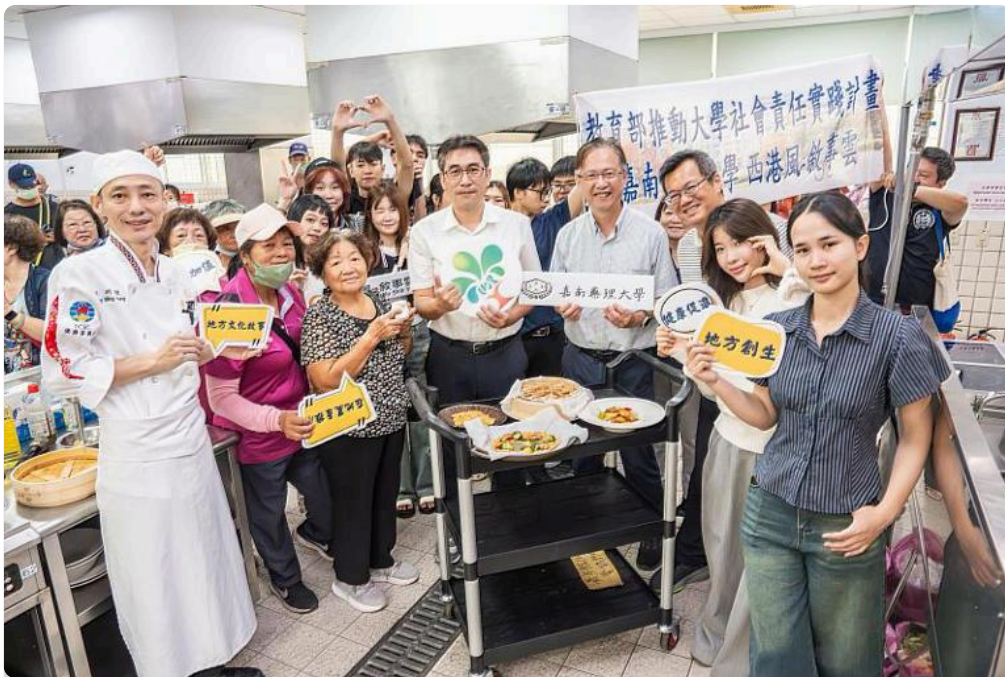
嘉藥舉辦「重陽健身趣·芝麻好食光」活動讓長輩真正有「動」有「呷」足好玩！

(中央社訊息服務20251027 10:20:57)重陽節不止能吃糕，嘉南藥理大學智慧生活學院於重陽節前夕，舉辦「重陽健身趣·芝麻好食光」活動，邀請西港區慶安里的阿公阿嬤們走入校園，在大學生及越南國際生的陪伴下，體驗「夜店風」的健身中心器材，還能享用結合在地食材的「五道芝麻創意料理」，長輩們直呼，這個重陽節，真正有「動」有「呷」足好玩！