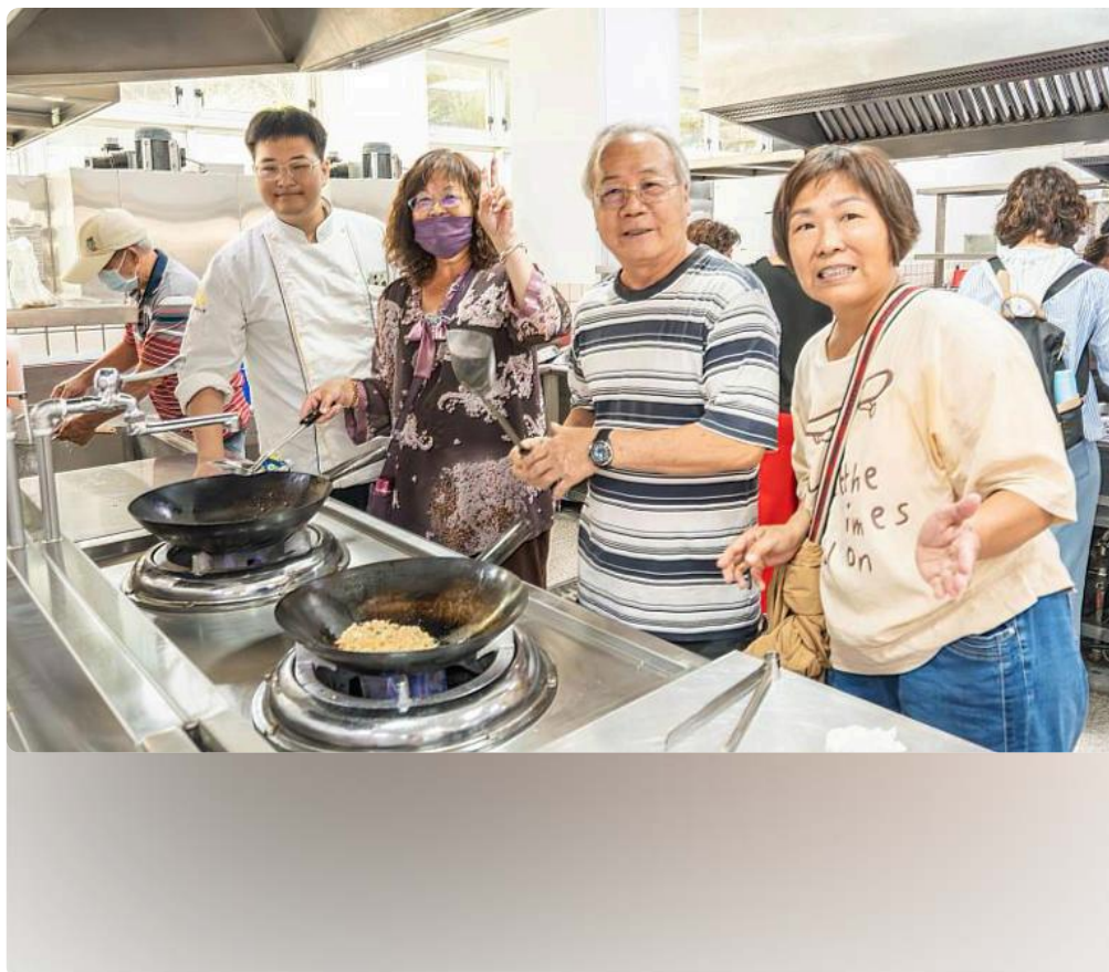
嘉藥餐旅系學生教導長輩製作創意麵煎餅