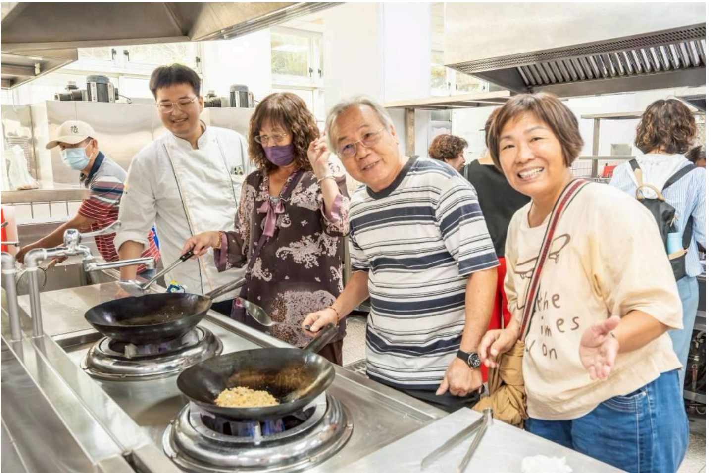
一道麻油科學麵煎餅，香氣四溢。

嘉藥智慧生活學院特別選在重陽節前夕，舉辦「重陽健身趣·芝麻好食光」活動，邀請西港區慶安里的阿公阿嬤們走入校園，在大學生及越南國際生的陪伴下，體驗「夜店風」的健身中心器材，並享用結合在地食材的「五道芝麻創意料理」，長輩們直呼，這個重陽節，真正有「動」有「呷」足好玩。