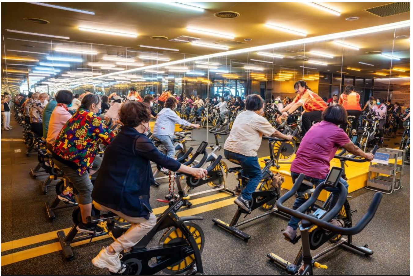
西港長輩們歡喜體驗健身器材。

除了運動體驗外，餐旅系師生更以西港特產「芝麻」為主題，設計出五道創意料理，有DIY「胡麻味噌醬」、清爽「胡麻鯛魚沙拉」、異國風「麻油雞肉墨西哥餅披薩」、台南特產的「麻油虱目魚柳米糕」及創意「麻油科學麵煎餅」，讓長輩們見識到新世代的芝麻好味道，也從中學習芝麻的營養價值與在地農產的創新應用。