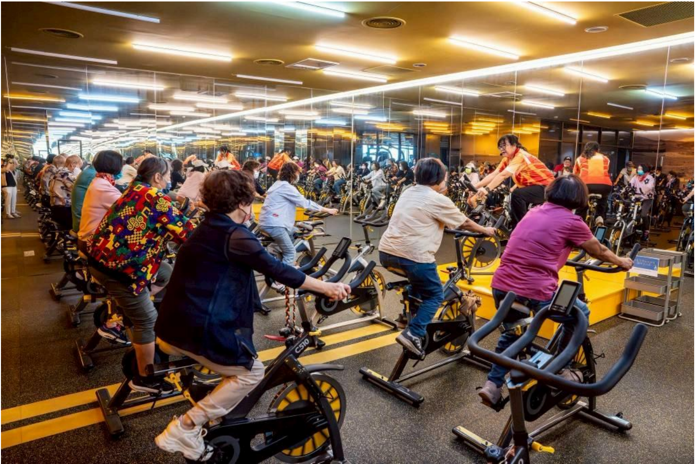
西港長輩們歡喜體驗健身器材。

副校長洪瑞祥表示，嘉藥長期推動USR計畫，以「學用合一、在地實踐」為核心，讓學生能在真實場域中應用所學，關懷社區、深化學習，活動不僅促進長輩健康意識，更讓外籍學生認識台灣地方文化，藉由共學共作體驗，實踐嘉藥「智慧生活、樂齡永續」的教育願景。