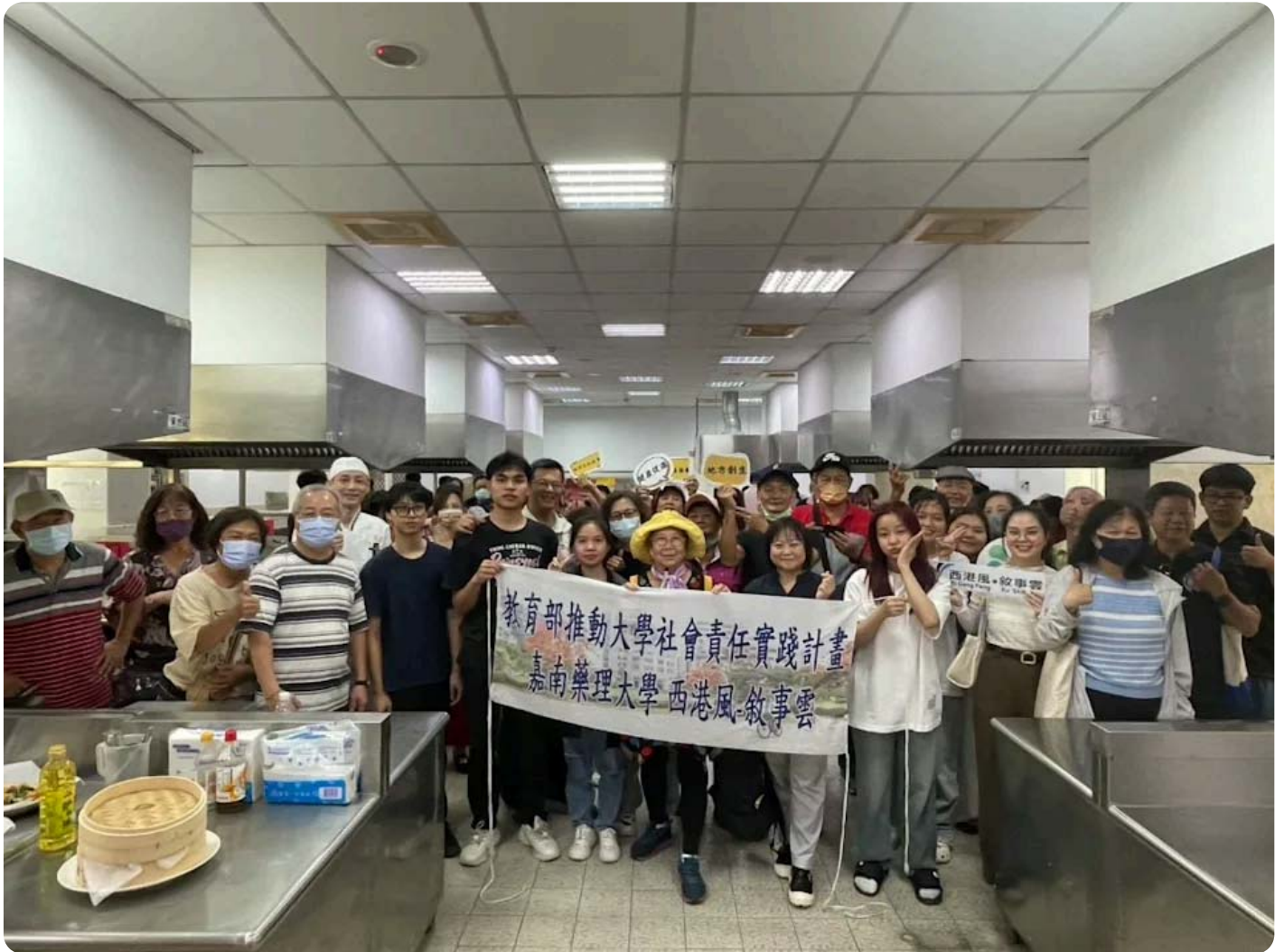
嘉南藥理大學攜手西港長輩共享重陽芝麻好食光。