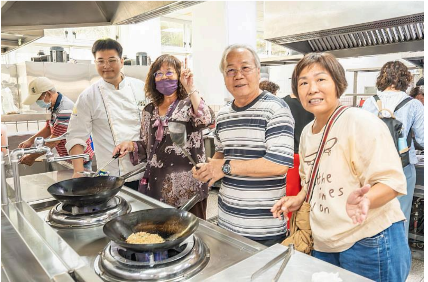
嘉藥餐旅系學生教導長輩製作創意麵煎餅