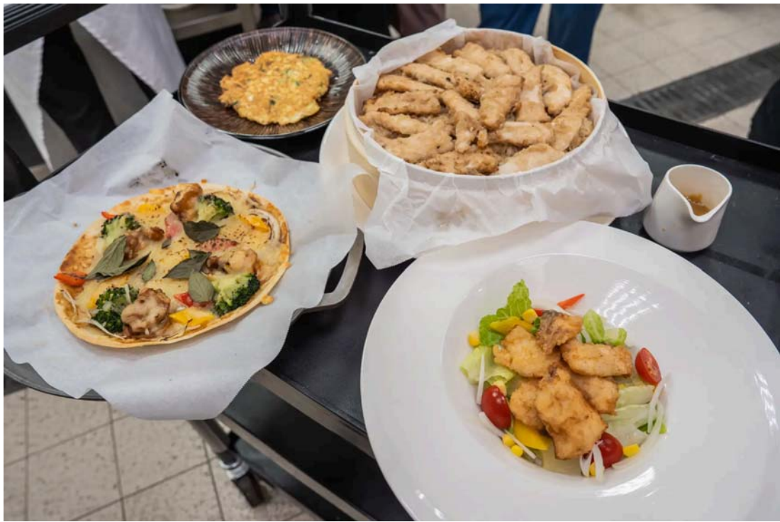
嘉藥餐旅系師生烹煮五道芝麻創意料理。