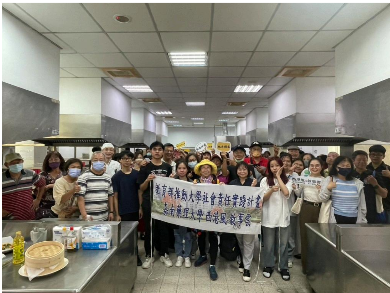
嘉南藥理大學攜手西港長輩共享重陽芝麻好食光。