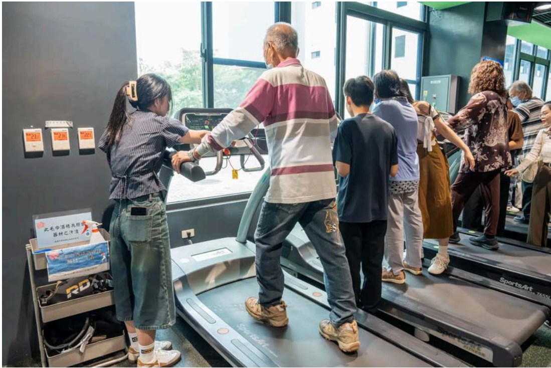
嘉藥國際生一對一陪伴長輩使用跑步機。

除了運動體驗外，餐旅系師生以西港特產「芝麻」為主題，設計出五道創意料理，包含DIY「胡麻味噌醬」、清爽「胡麻鯛魚沙拉」、異國風「麻油雞肉墨西哥餅披薩」、結合台南特產的「麻油虱目魚柳米糕」及創意「麻油科學麵煎餅」，長輩們不僅享受美食，也從中學習芝麻的營養價值與在地農產的創新應用。