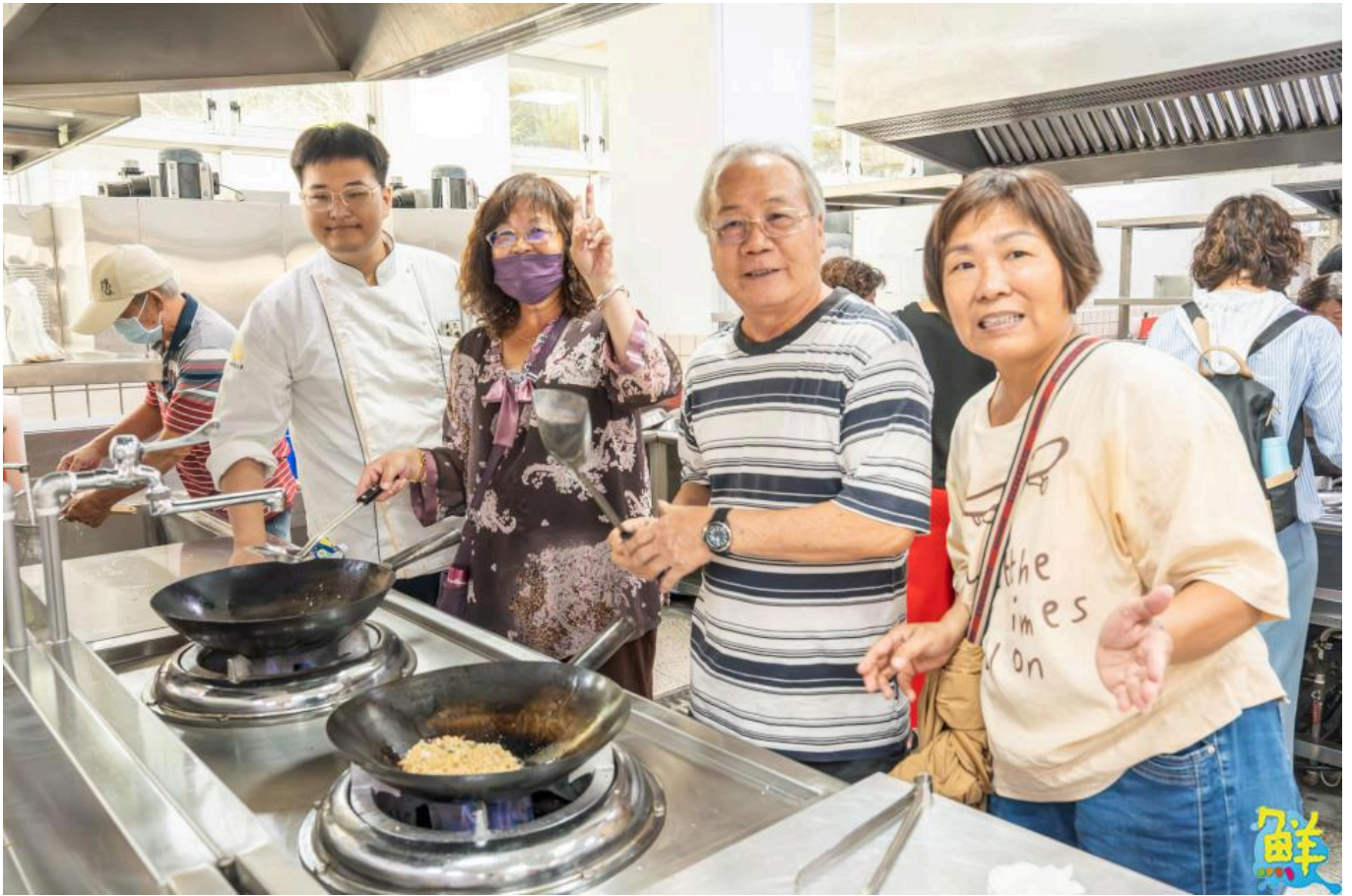
▲嘉藥餐旅系學生教導長輩製作創意麵煎餅