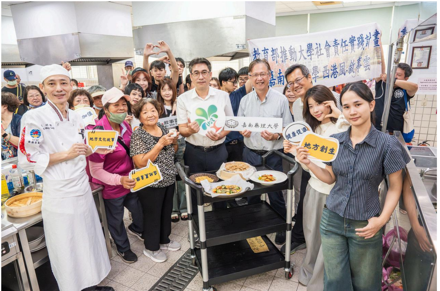
圖：嘉南藥理大學攜手西港長輩共享重陽芝麻好食光。

【記者黃鐘毅／台南報導】嘉南藥理大學於重陽節前夕，舉辦「重陽健身趣·芝麻好食光」活動，邀請西港區慶安里的阿公阿嬤們走入校園，在大學生及越南國際生的陪伴下，體驗「夜店風」的健身中心器材，還能享用結合在地食材的「五道芝麻創意料理」，長輩們直呼，這個重陽節，真正有「動」有「呷」足好玩。