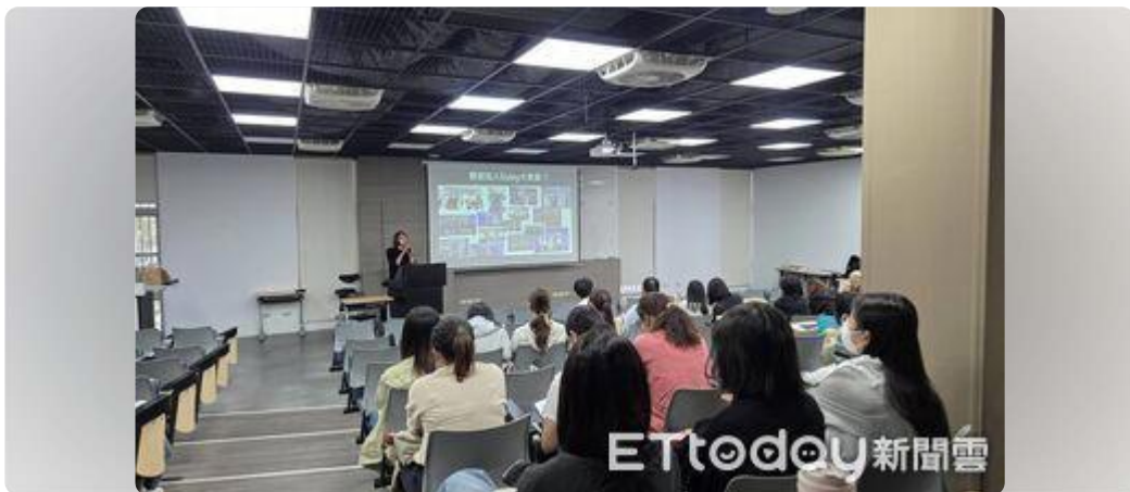
嘉藥粧品系攜手30家知名企業 釋出300職缺助學生接軌國際職場