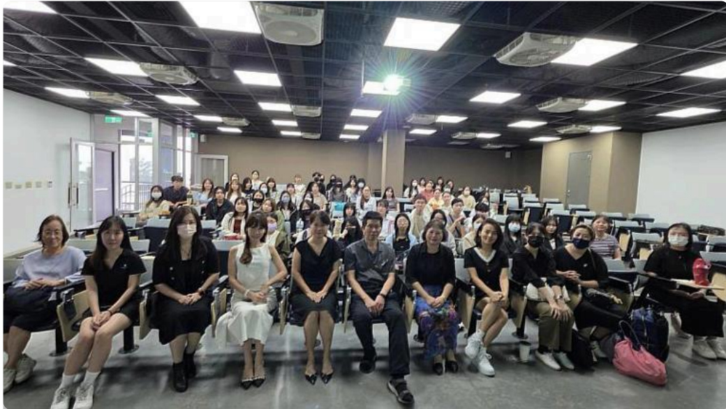
嘉藥舉辦「化粧品產業實習說明會」助學生入職場

(中央社訊息服務20251105 09:57:21)為強化學生專業實務與就業競爭力，嘉南藥理大學化粧品應用與管理系於日前舉辦「化粧品產業實習說明會」，邀集涵蓋醫學美容連鎖診所、化粧品製造廠、生技保健廠、國際專櫃、美容芳療與美髮造型等30家企業共襄盛舉，提供超過300個實習名額，現場吸引近百位學生熱情參與，場面熱絡非凡。