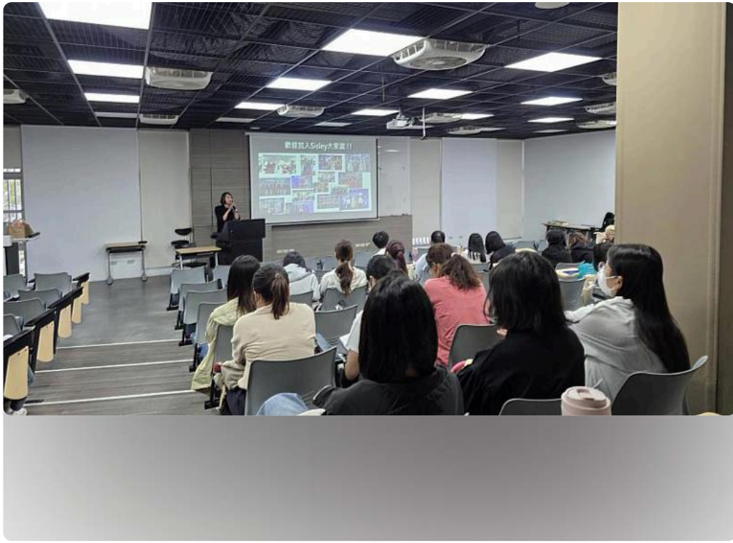
化粧品產業實習說明會吸引超過300位學生參加