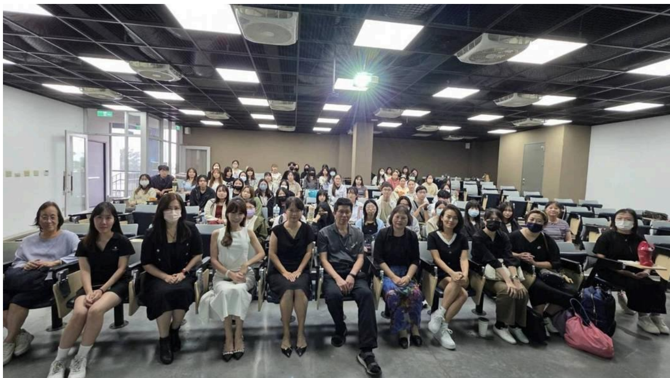
嘉藥舉辦「化粧品產業實習說明會」助學生入職場。

務，校園與業界的緊密鏈結，讓學生在學期間即能累積豐富的實作經驗與專業能力，順利銜接職場需求，為粧品產業注入嶄新的創意與活力。