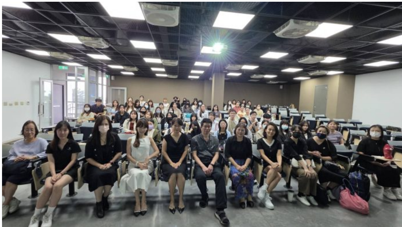
嘉藥粧品系攜手30家知名企業打造300職缺 助學生接軌國際職場