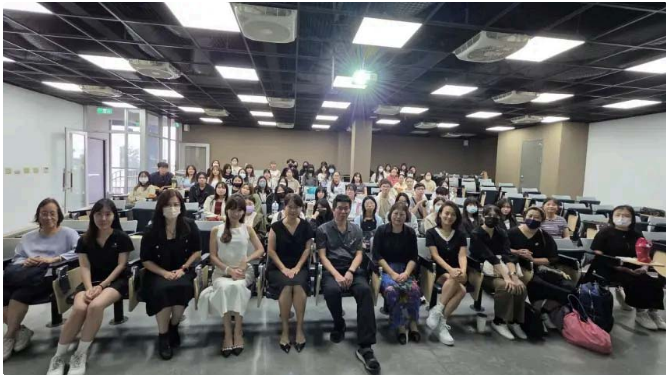
嘉藥粧品系攜手30家知名企業打造300職缺 助學生接軌國際職場