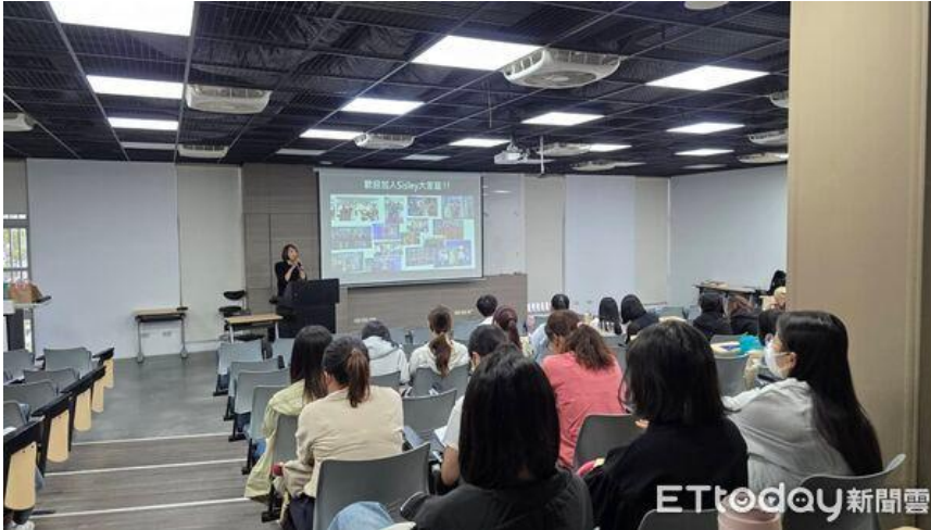
▲嘉藥粧品系舉辦化粧品產業實習說明會，30家企業共釋出300個實習名額。