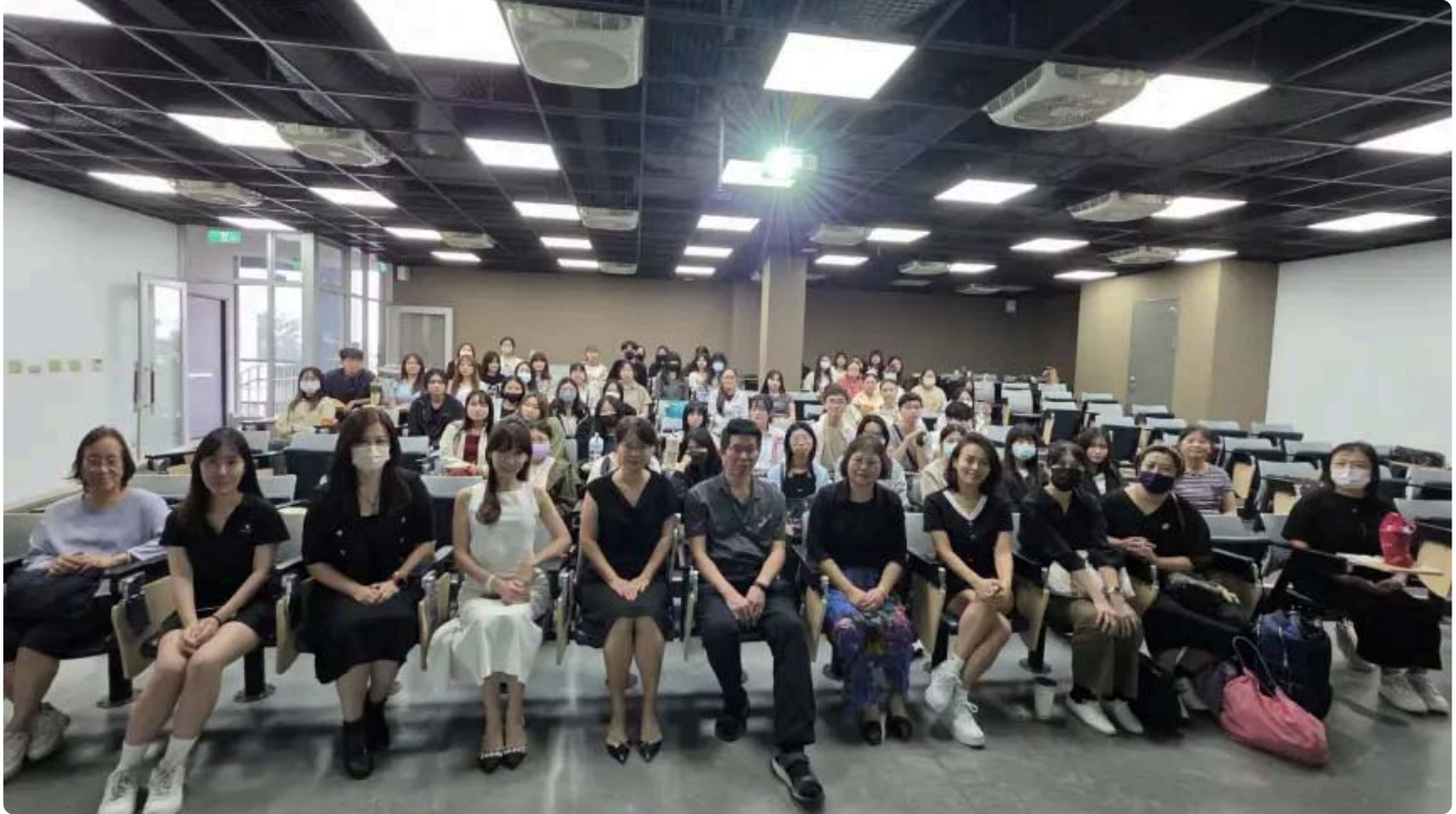
嘉藥粧品系攜手30家知名企業打造300職缺 助學生接軌國際職場