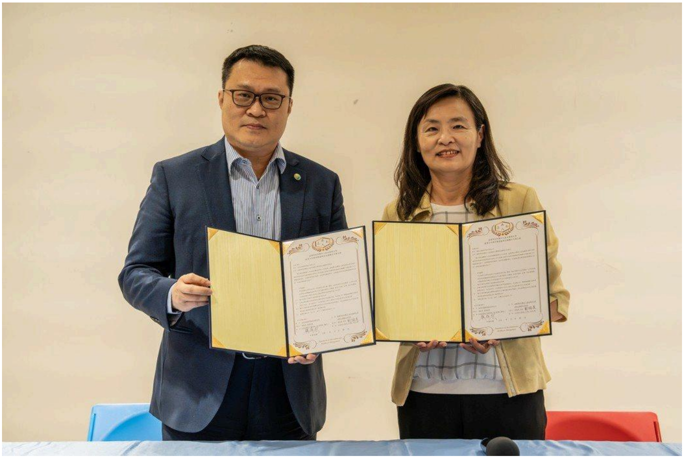
嘉藥環境永續暨休閒學院與南紡簽署MOU。