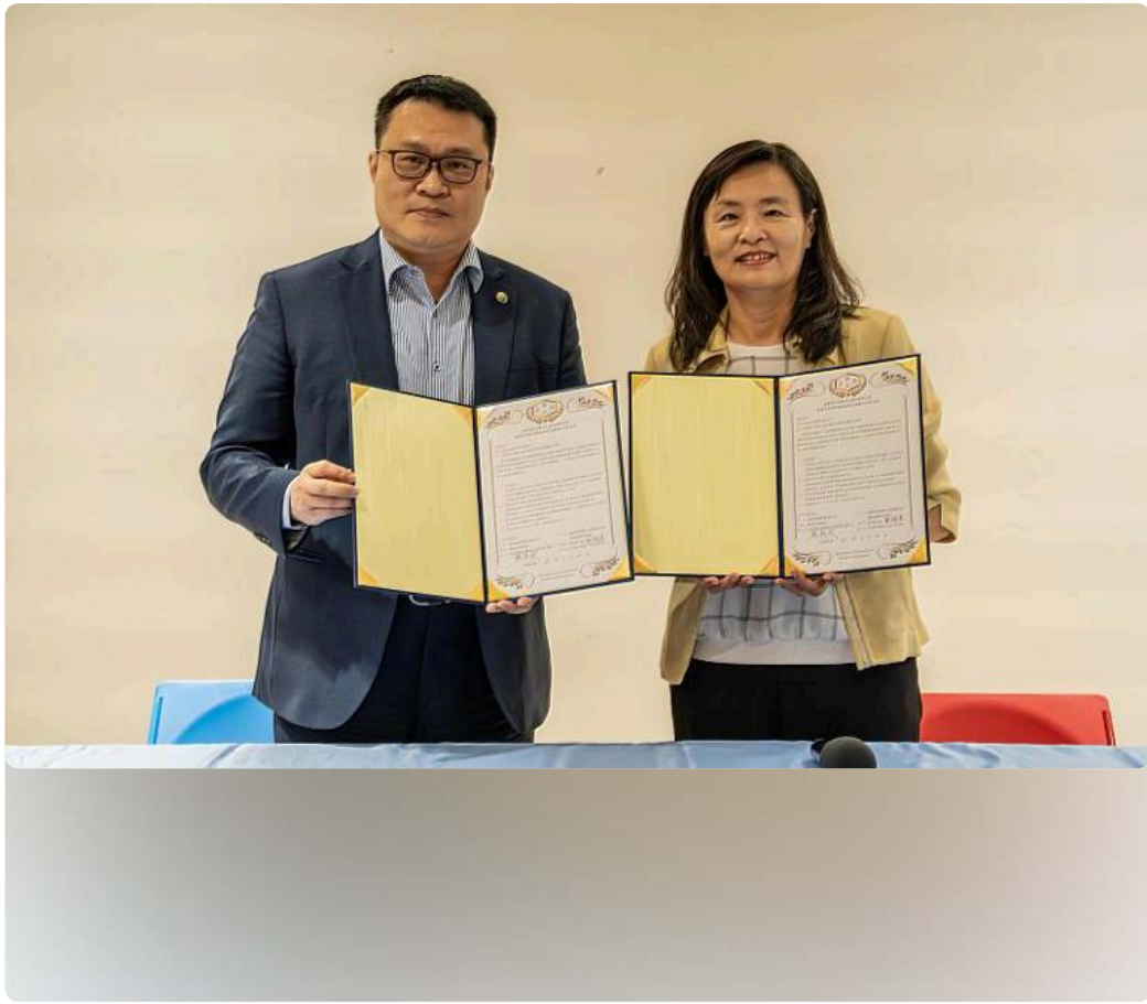
嘉藥環境永續暨休閒學院與南紡簽署MOU