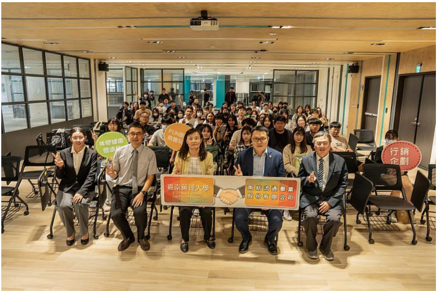
嘉藥環境永續暨休閒學院與南紡簽署MOU 開創產學合作新里程碑

(中央社訊息服務20251107 09:53:39)嘉南藥理大學環境永續暨休閒學院於11月6日上午在該校創客基地，與南紡流通事業股份有限公司簽署合作備忘錄（MOU），攜手推動產學共創，為校企協作開啟嶄新篇章，共同培育新世代休閒與行銷服務人才。