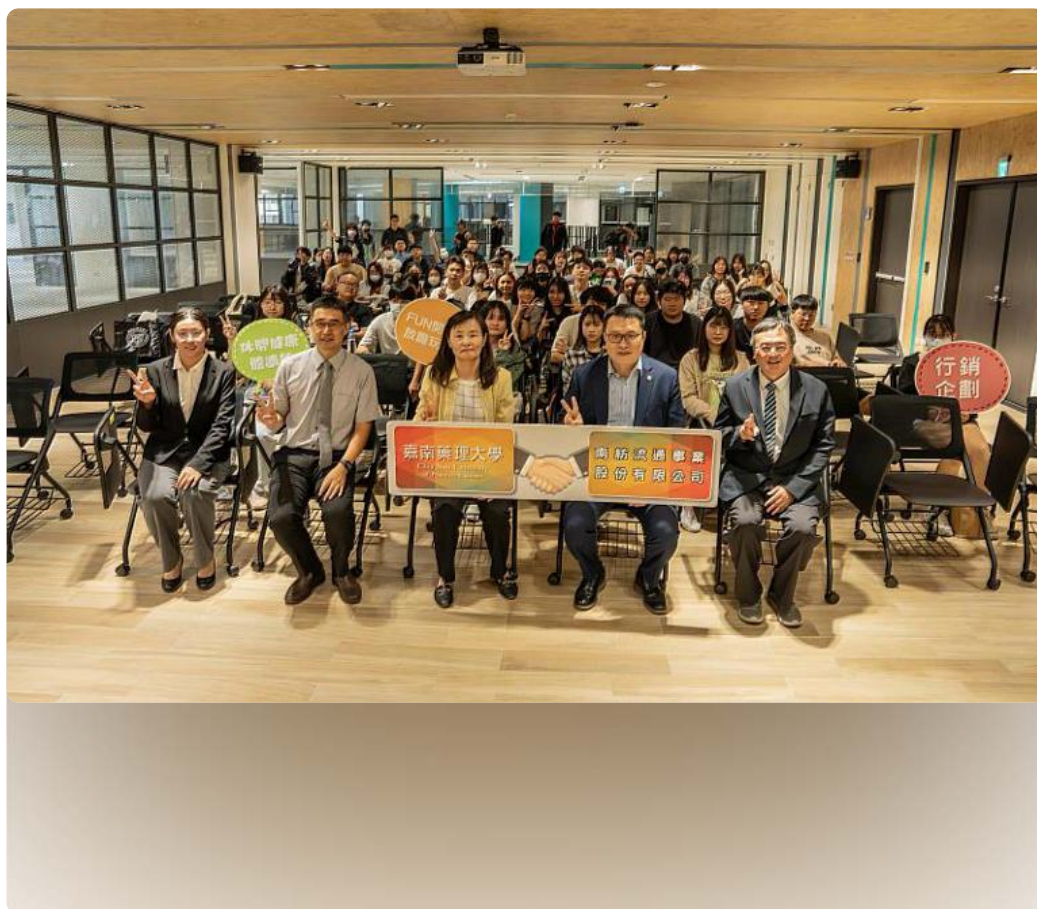
嘉藥環境永續暨休閒學院與南紡簽署MOU 開創產學合作新里程碑

(中央社訊息服務20251107 09:53:39)嘉南藥理大學環境永續暨休閒學院於11月6日上午在該校創客基地，與南紡流通事業股份有限公司簽署合作備忘錄 (MOU)，攜手推動產學共創，為校企協作開啟嶄新篇章，共同培育新世代休閒與行銷服務人才。