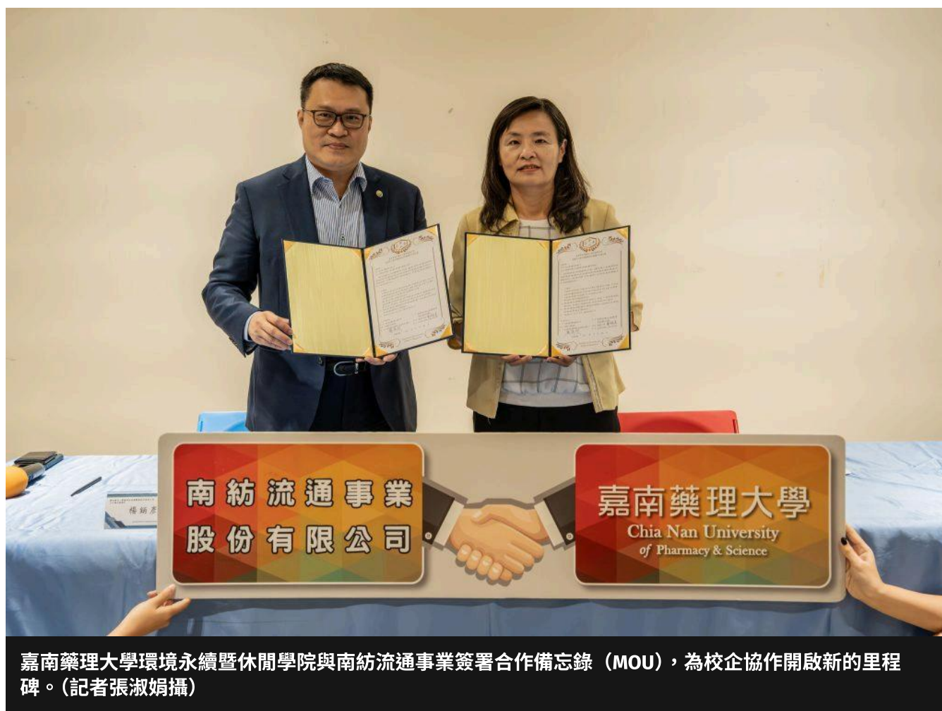
嘉南藥理大學環境永續暨休閒學院與南紡流通事業簽署合作備忘錄 (MOU)，為校企協作開啟新的里程碑。(記者張淑娟攝)