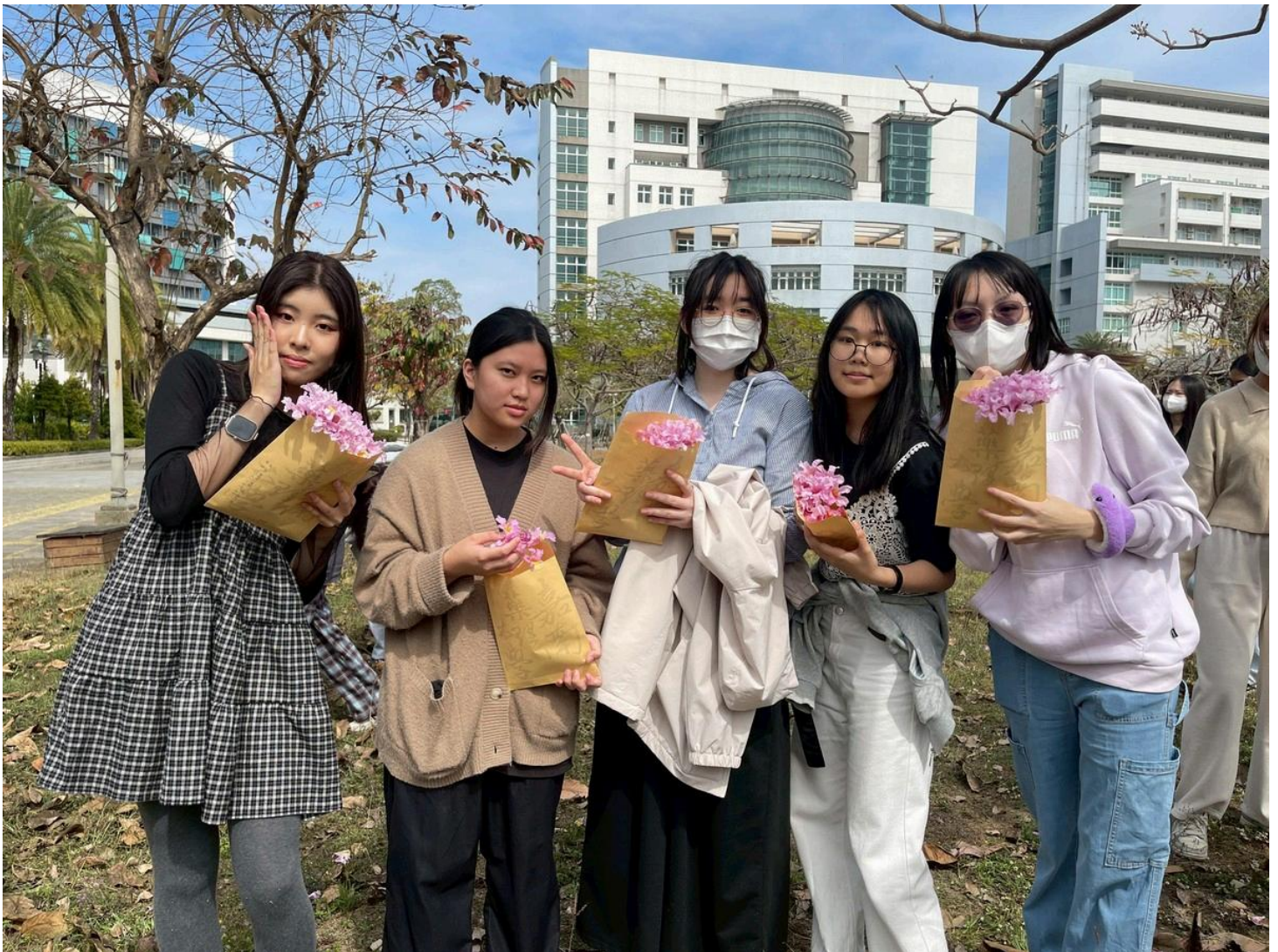
圖：學員們採集風鈴花準備回實驗室做出專屬自己的保養品。

營隊最大亮點在於「植物採集」與「植物萃取」課程，嘉南藥理大學擁有廣大的綠色校園環境，此次美粧科學創意營特地讓學員們化身植物學家漫步校園，親手採集銀花莧、九重葛及風鈴花等植物樣本，隨後將採集的植物帶回實驗室進行水萃取，並將這份新鮮的「植萃」精華加入親手調製的美白保濕乳液中，完成個人專屬的保養品。