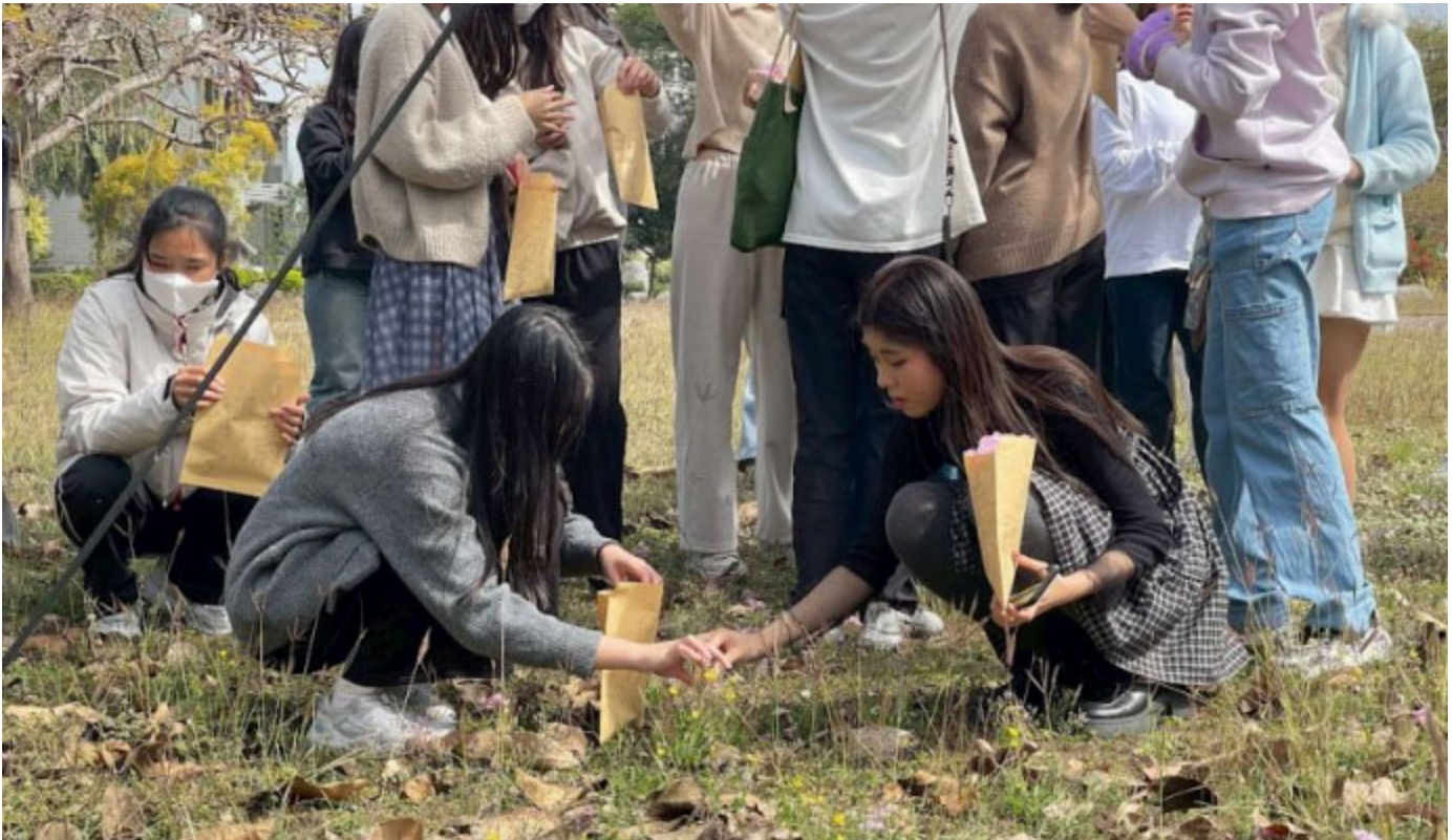
參與學員在嘉藥校園採集植物現做保養品。

第一次參與創意營的陳同學表示，沒想到平時路上常見的植物居然可以做出保養品來，以前覺得化學很枯燥，但今天從採集植物到做成乳液，才發現原來科學可以這麼生活化、這麼有趣！