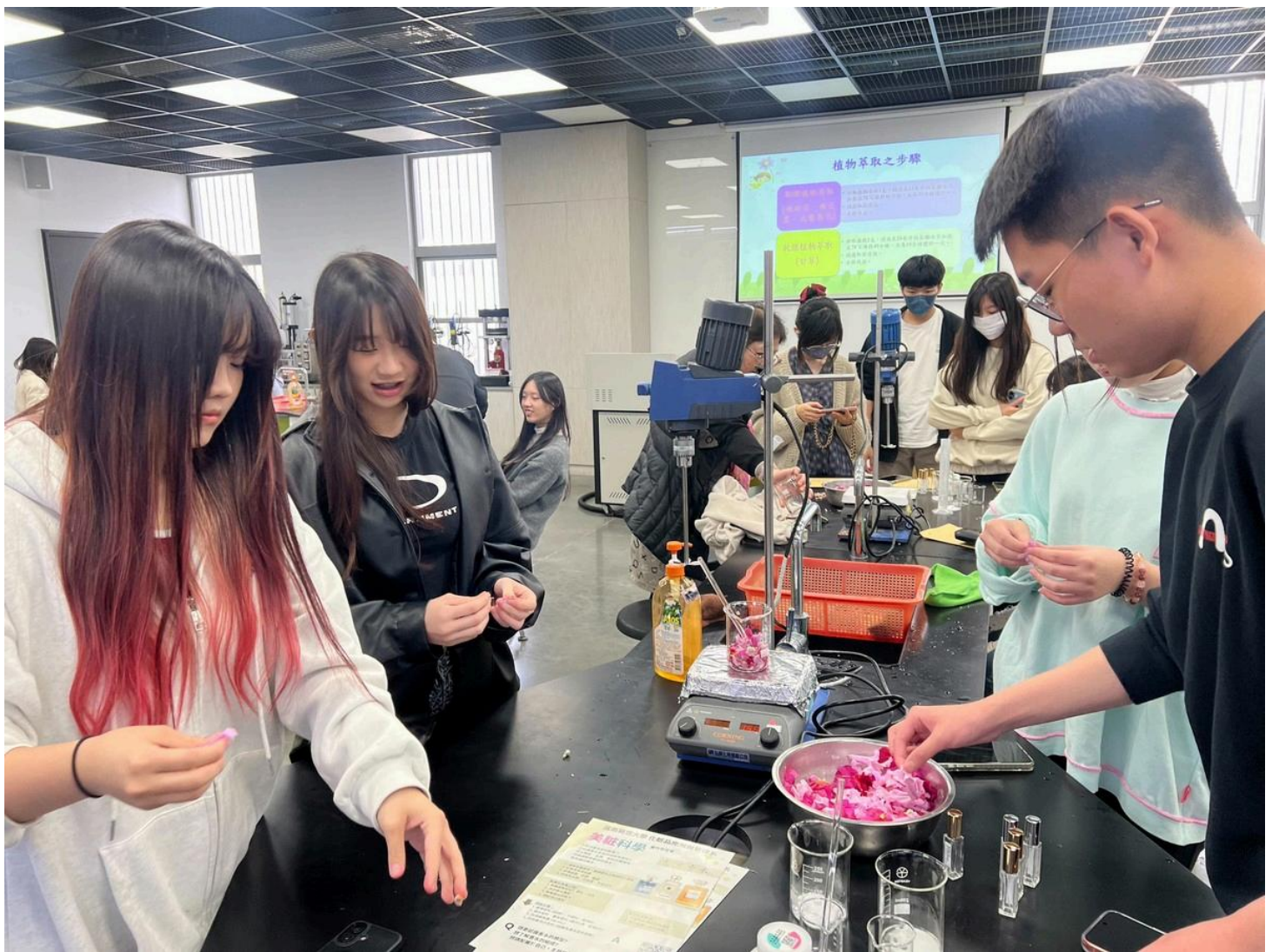
圖：回到實驗室學員們以水粹方式萃取出植物精華。（校方提供）

除了科學實作外，課程也結合時下年輕人最愛的心理測驗話題，推出「五官交響曲：調香藝術」課程，學生透過嗅覺、視覺與觸覺的五感體驗，調製出符合自己人格特質的「靈魂香氣」。下午的「顏上青春」課程，由專業老師傳授流行時尚妝容技巧，教導學生如何展現自信與自然美，讓學員從內而外散發自信。