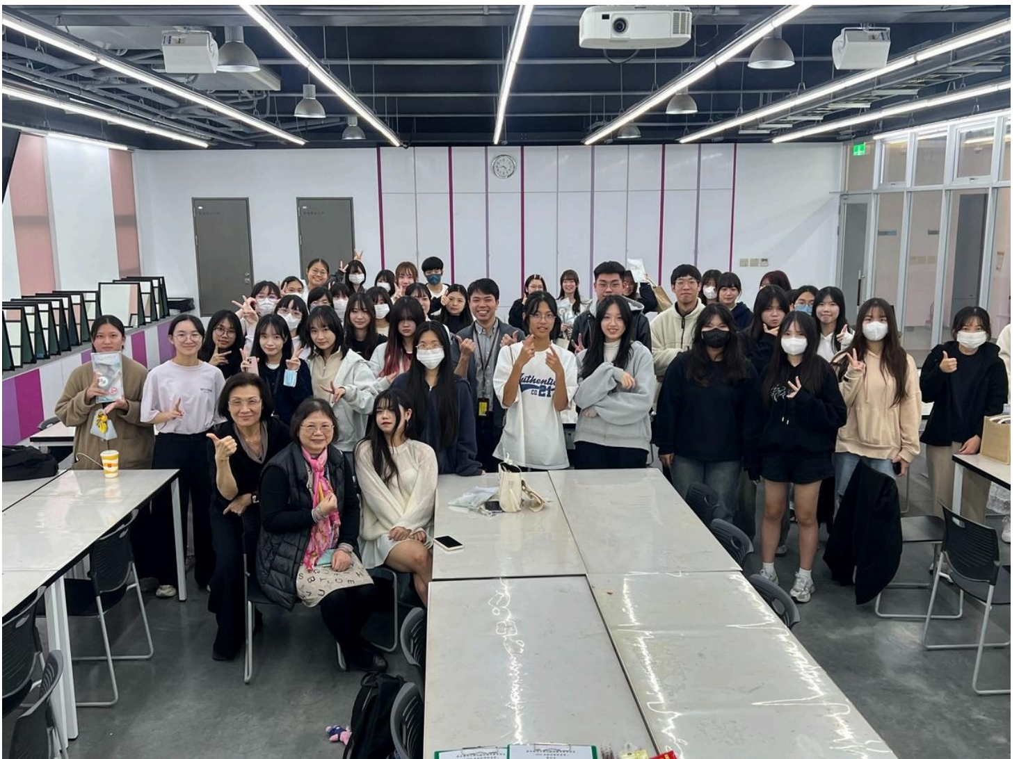
圖：嘉藥粧品系舉辦「2026美粧科學創意營：一日變身美粧科學家」活動，吸引眾多高中職生報名參加。