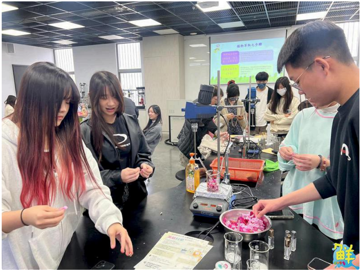
▲回到實驗室學員們以水粹方式萃取出植物精華