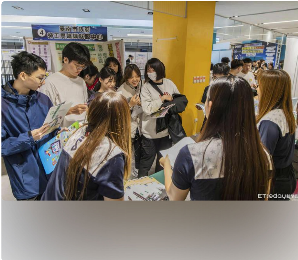
嘉藥60週年徵才博覽會登場! 135企業釋出近3000職缺 天天都有新機會