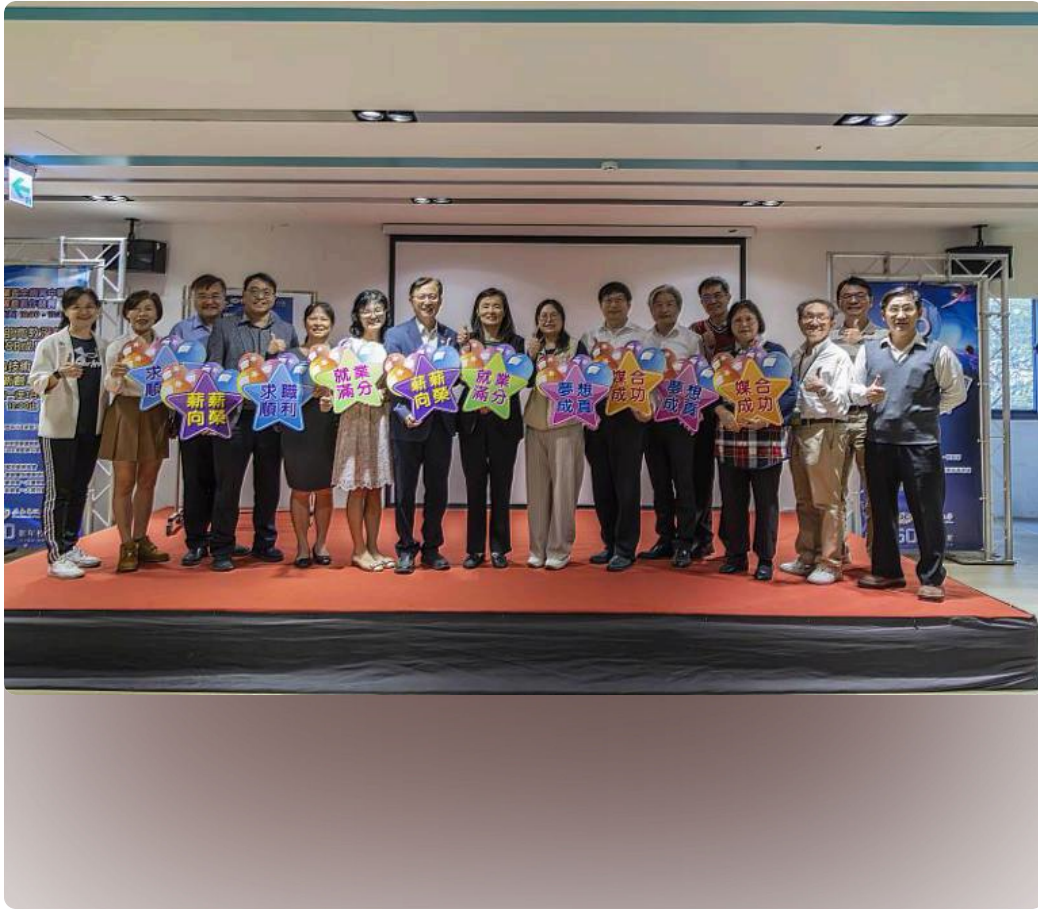
嘉藥60週年就業博覽會近3,000個職缺助學生職涯起飛。