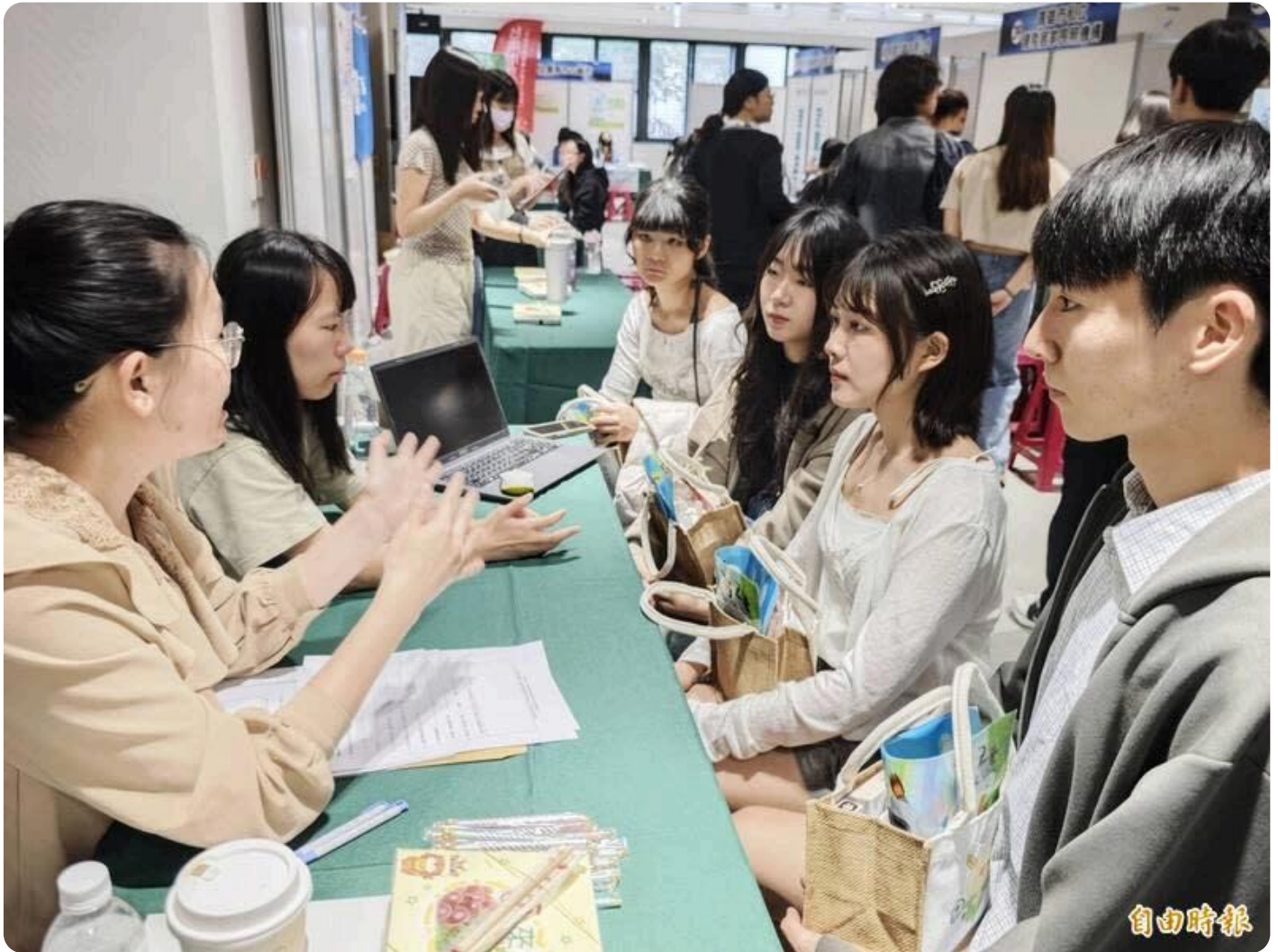
勞發署雲嘉南分署舉辦今年首場校園徵才活動，氣氛熱烈。

〔記者吳俊鋒／台南報導〕畢業季將至，政府先幫忙「找頭路」，勞動力發展署今天攜手嘉南藥理大學合作舉辦校園徵才，上百家廠商參與，提供近3千個工作機會，讓應屆生可以順利接軌職場，人潮湧入，氣氛熱烈。