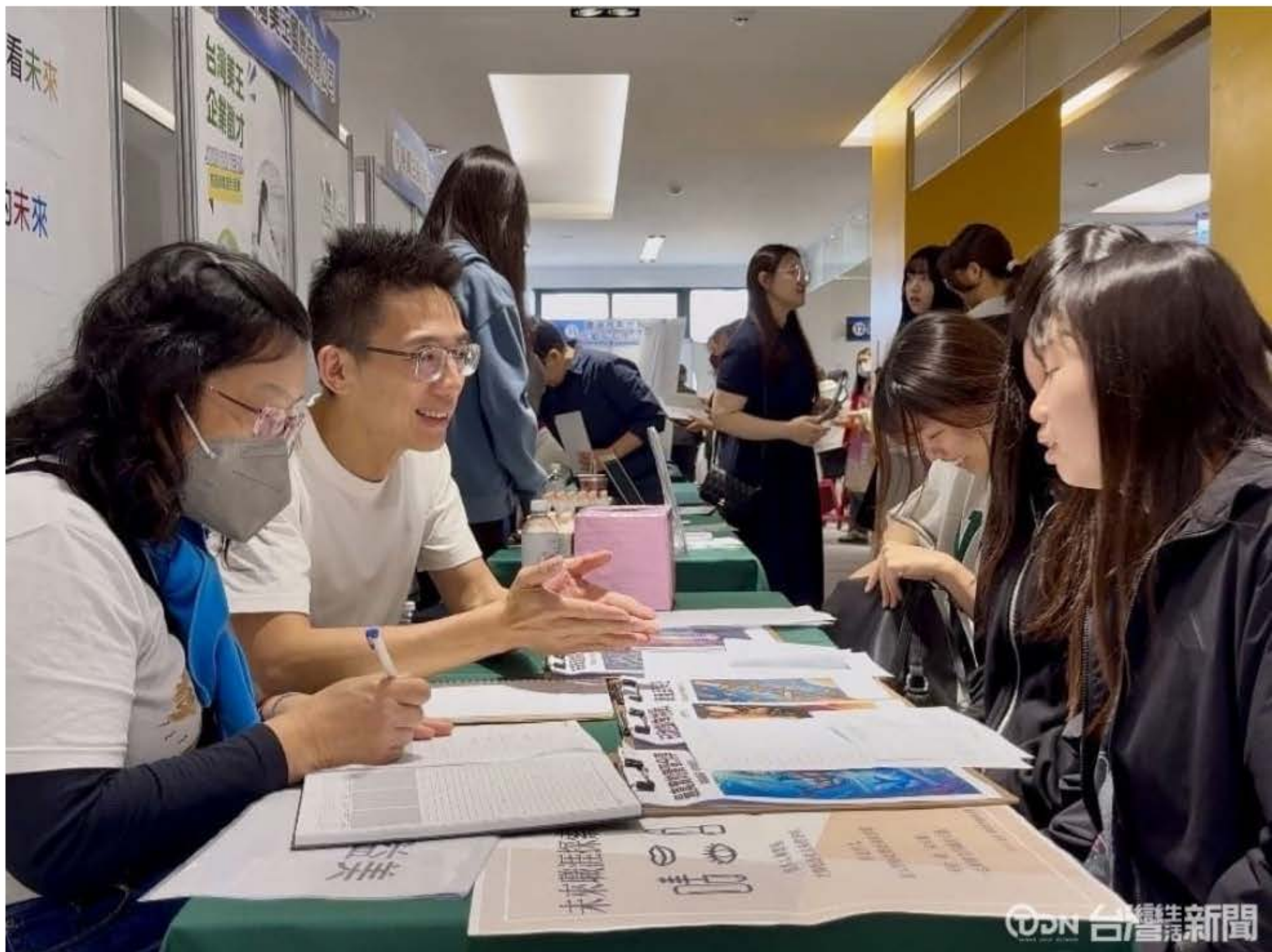
▲嘉南藥理大學辦理2026就業徵才博覽會，連續三日有上百家廠商入校徵才。

嘉南藥理大學，在60週年的校慶活動週，辦理「2026就業徵才博覽會」，每天都有不同的廠商輪流進駐，希望透過活動，讓學校不只是學習的場域，更可以成為求職平台，讓校內的學生們可以安全、多元的探索職涯。