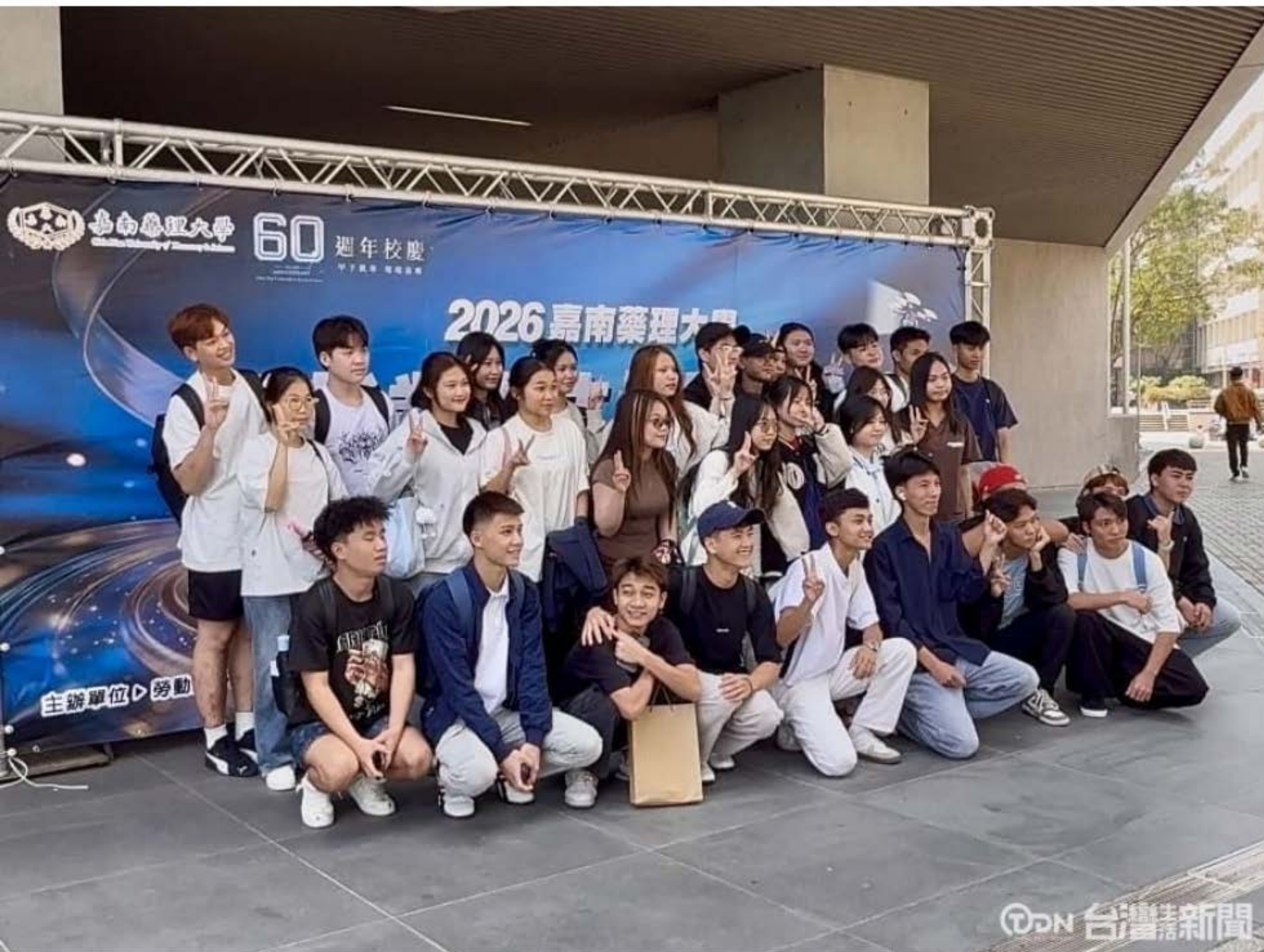
▲2026就業徵才博覽會，更提供千名友善外籍學生的工作機會。

現場參觀的學生非常的多，各家的廠商也提供清楚的說明，或是安排有趣的活動，讓學生可以在參觀的過程當中，認識更多的職業選擇。「2026就業徵才博覽會」會一直到19日為止，現場有醫療、美妝及餐旅等多元的廠商，開出將近3000個職缺，更包含了1250個友善外籍生的職缺，希望可讓每一個學生，都有探索不同職涯的新選擇。