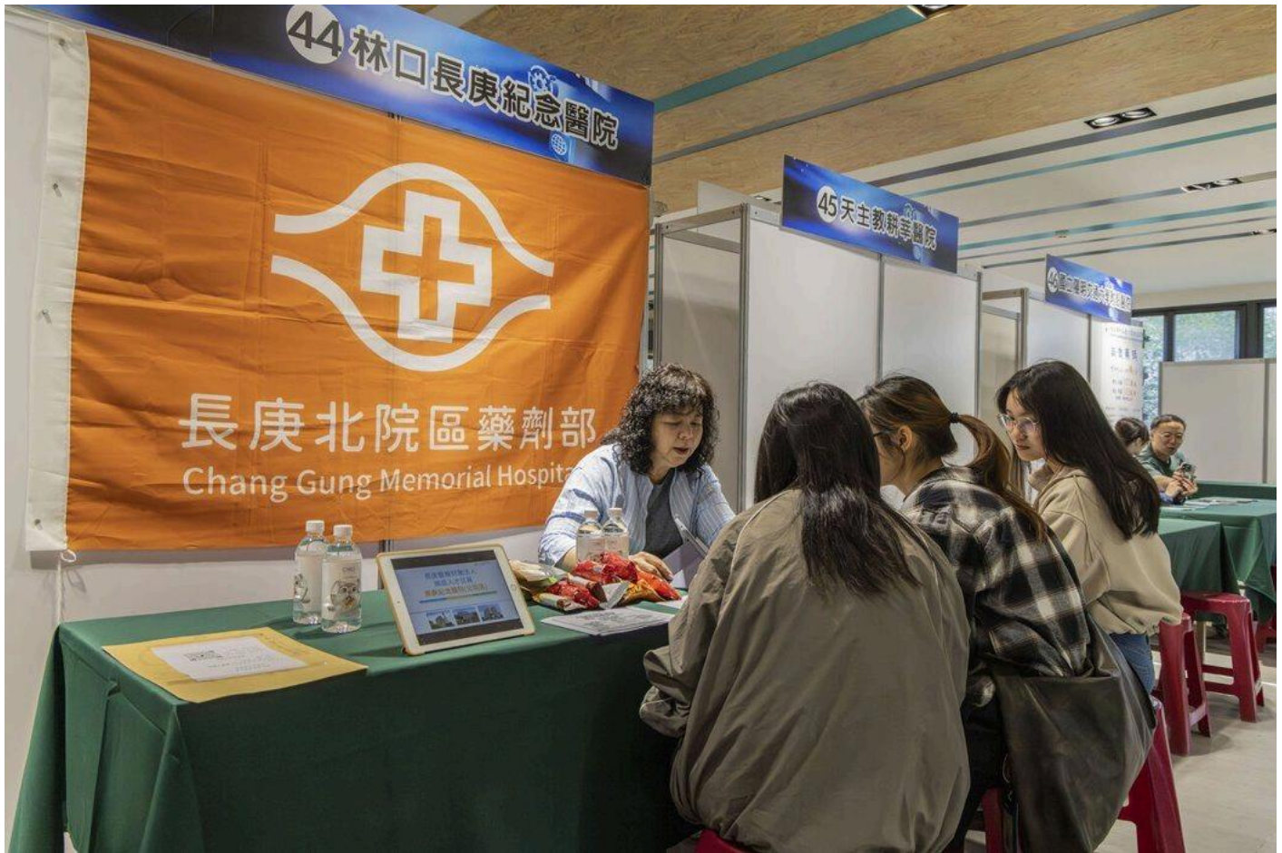
提供職缺的廠商對學生們詳盡的介紹職缺內容。