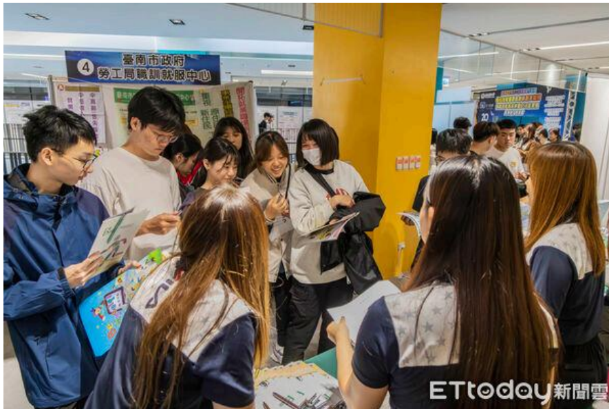
▲嘉南藥理大學舉辦60週年就業博覽會，吸引135家企業設攤徵才。