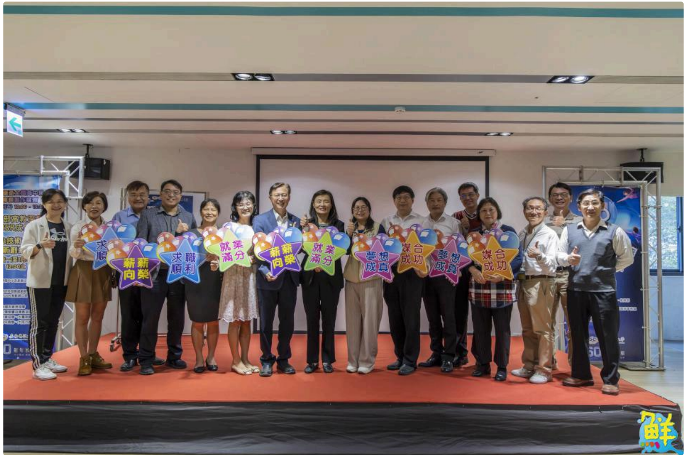
▲嘉藥60週年就業博覽會近3,000個職缺助學生職涯起飛