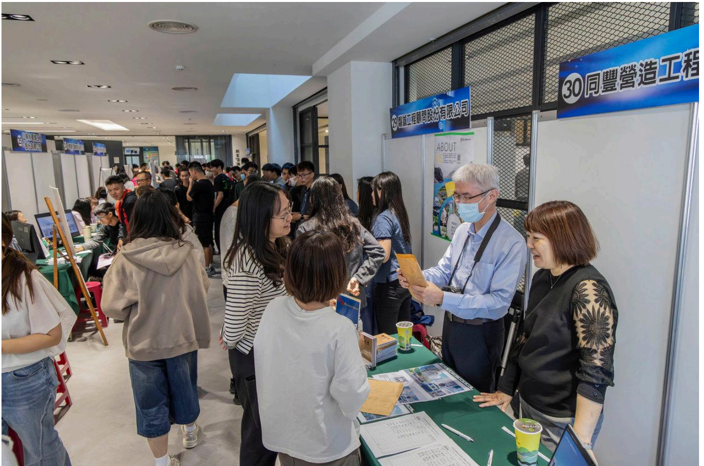
圖：嘉藥校園徵才活動，吸引眾多學生爭相面試。