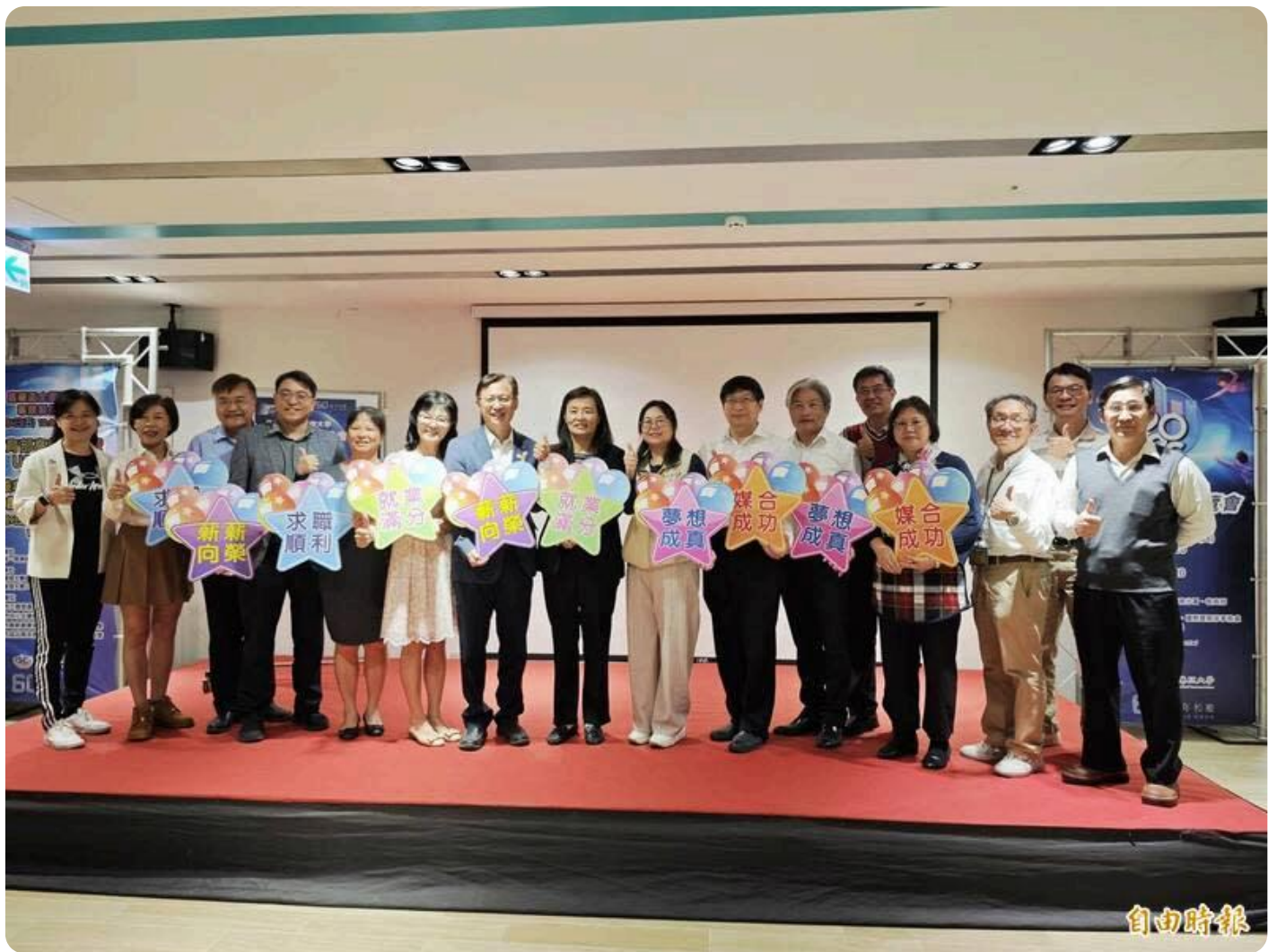
嘉南藥理大學結合勞動力發展署一起舉辦校園徵才活動。