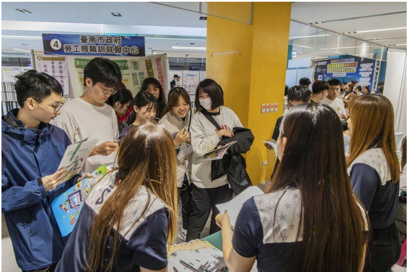
同學找到適合的職缺進行瞭解用心聆聽。

副校長劉瑞美表示，嘉藥長期致力深化「教學、產業、國際」三大面向的整合，不僅傾力打造完善的實作與實習場域，更積極廣納國際資源，讓同學在校期間即可具備全球視野並無縫接軌職場標準。未來，嘉藥將持續與政府單位及產業界緊密協作，為學生開拓更寬廣的發展舞台。期盼企業夥伴與同學們都能把握此次媒合與交流的良機，順利尋得最佳的職涯夥伴，創造雙贏。