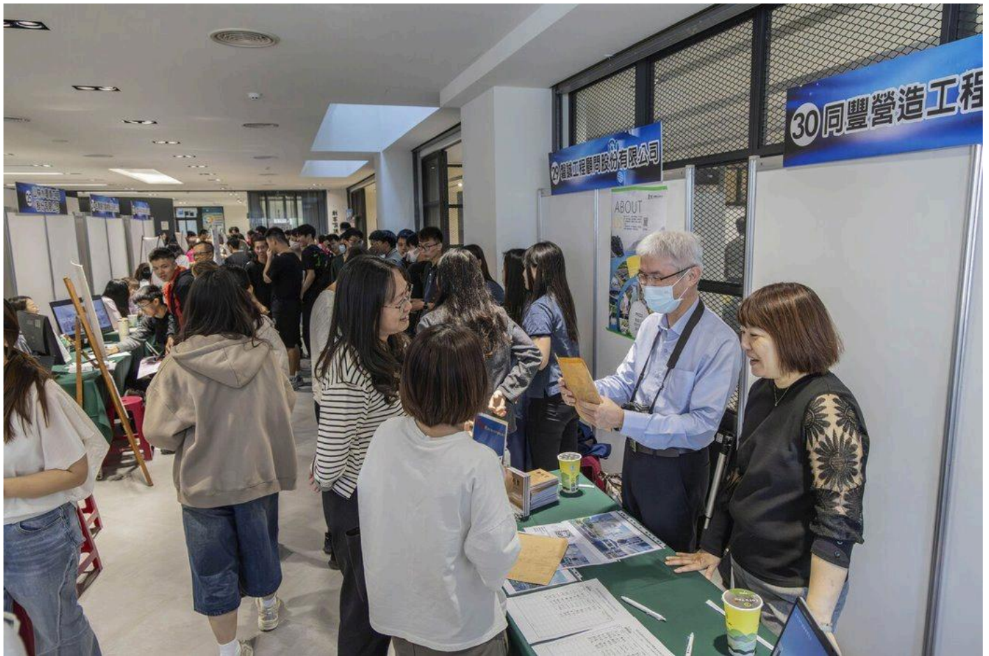
嘉藥「2026就業徵才博覽會」吸引破百位學生爭相來面試。