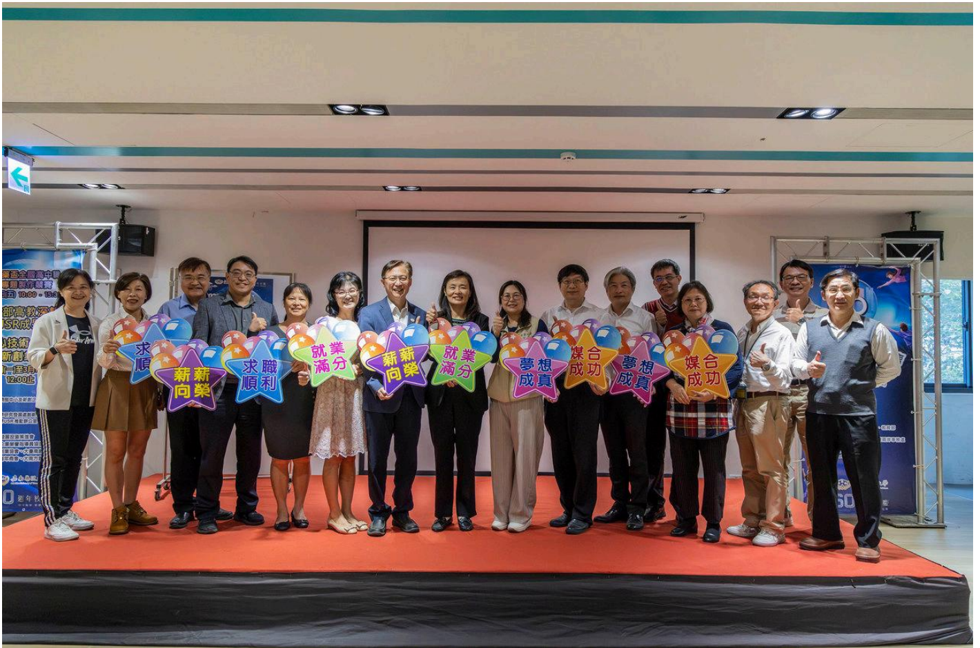
圖：嘉南藥理大學結合勞動部雲嘉南分署舉辦校園徵才活動。

【記者黃鐘毅 / 台南報導】歡慶創校60週年，嘉南藥理大學18日舉辦「2026就業徵才博覽會」，集結醫療、長照、美妝及餐旅等多元領域，上膾炙人口知名企業釋出近3000個職缺，其中包含1250個友善外籍生的職缺，讓應屆生可以順利接軌職場，人潮湧入，氣氛熱烈。