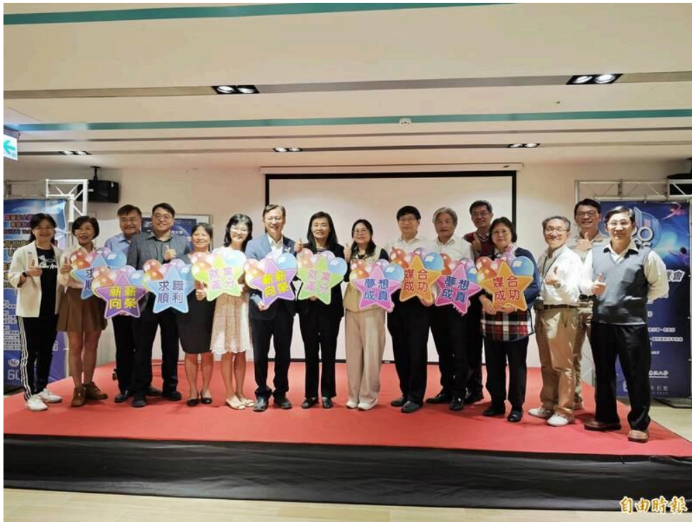
嘉南藥理大學結合勞動力發展署一起舉辦校園徵才活動。

現場也有「履歷健診」、「職涯測驗」的協助，藉由專家的分析與建議，讓學生在面試前精準掌握自身優勢，並凸顯專業亮點，展現強韌的就業競爭力。