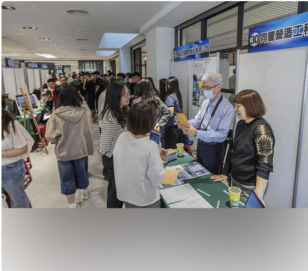
嘉藥「2026就業徵才博覽會」吸引破百位學生爭相來面試。

大新竹分院、門諾及羅東聖母醫院等眾多區域以上級別醫院；藥妝美容、餐旅與工程科技業同樣精銳盡出，包含媚登峯、屈臣氏、丁丁與大樹藥局，以及漢來、寒舍、摩斯漢堡、爭鮮、臻鼎集團、通力電梯與欣達環工等各大知名品牌，皆前來設攤延攬優秀人才。除了提供多元職缺外，現場特別設置「履歷健診」及「職涯測驗」專區，藉由專家的分析與建議，協助學生在面試前精準掌握自身優勢、釐清職涯方向並凸顯專業亮點，從遞出履歷的那一刻起便展現強韌的就業競爭力。