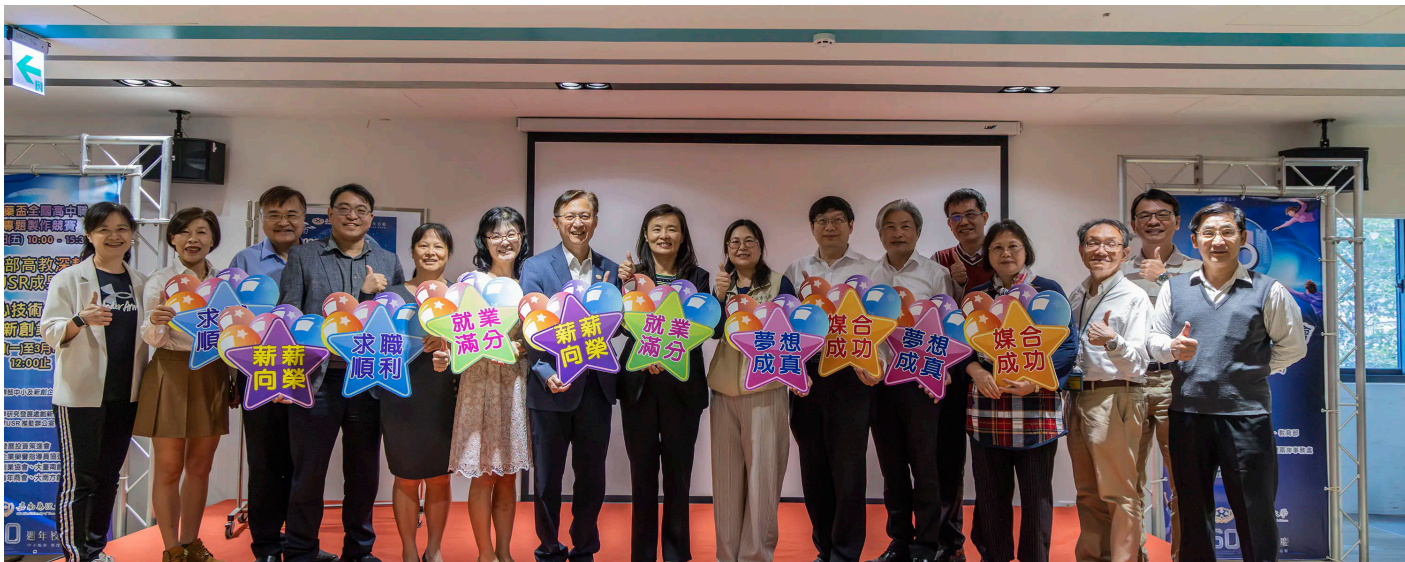
2026-03-18 墨新聞 墨新聞, 合作媒體