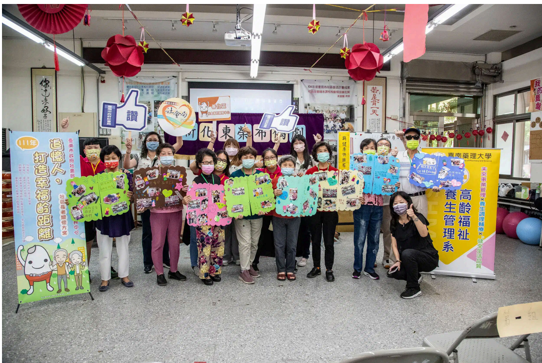
受到超高齡社會銀髮族商機帶動，嘉藥高福系今年報名人數較去年成長近三倍

115學年度四技申請入學第一階段於31日上午放榜，創校60年的嘉南藥理大學再度繳出亮眼成績單！今年共吸引4,671人報名第一階段，爭取全校僅有的475個名額，錄取率約僅10.2%。在少子化的嚴峻挑戰下，嘉藥依然強勢開出紅盤。