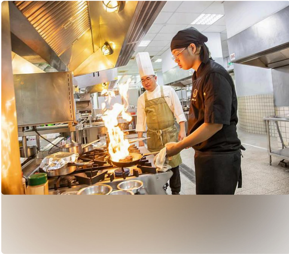
嘉藥餐旅系今年深受高中生青睞，通過人數與招生人數比率高達31.5。