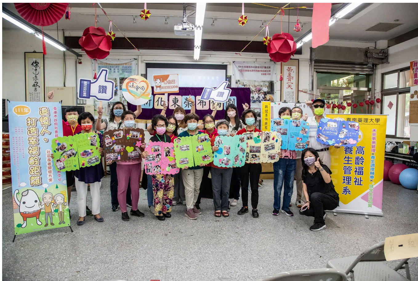
—— 受到超高齡社會銀髮族商機帶動，嘉藥高福系今年報名人數較去年成長近三倍

作為嘉藥的「金字招牌」，藥學系今年依舊熱度破表，共吸引2,418人報名，搶攻200個名額，穩坐全國技職科系之冠，除了藥學系表現亮眼，因應高齡化社會與大健康產業趨勢的相關學系也展現強大吸票能力，包含社會工作系、化粧品應用與管理系、環境工程與科學系及醫務管理系，皆吸引超過200名學子報名。