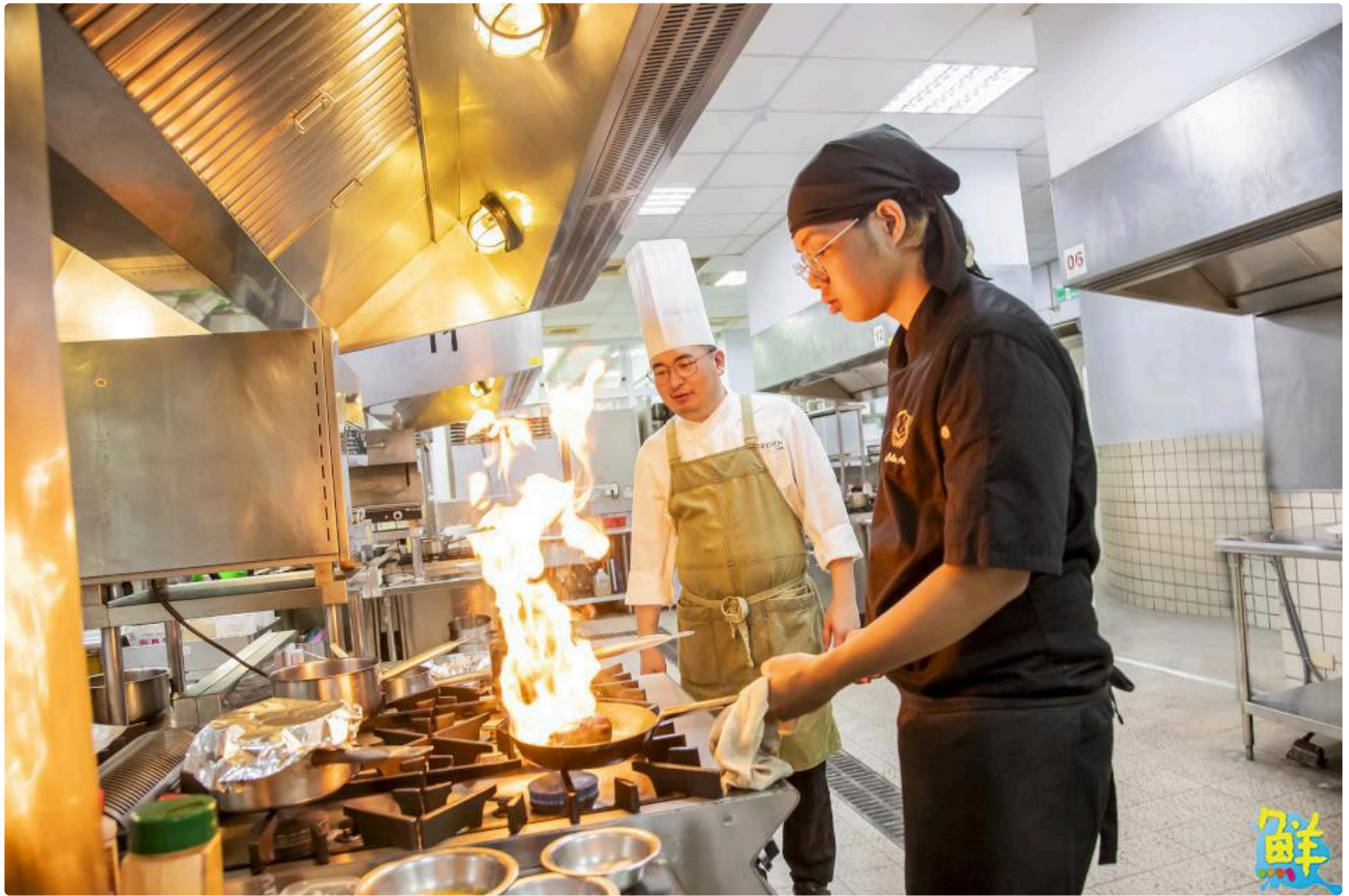
▲嘉藥餐旅系今年深受高中生青睞，通過人數與招生人數比率高達31.5