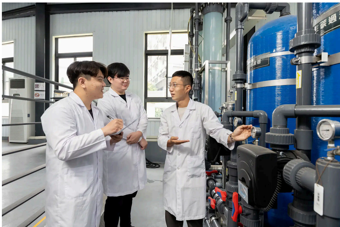
呼應全球環境永續發展與淨零碳排趨勢，嘉藥環工系今年四技申請一階吸引超過200位高中生報名

近年來嘉藥在各項評比與表現上皆大放異彩，不僅在2026年「遠見雜誌」企業最愛大學生暨實習生調查榮獲南部私立技專校院第一；在「大學問」評比中，藥學系更榮獲高中生最愛科大熱門校系全國榜首。此外，2025年藥師國考中嘉藥取得高於全國平均兩倍的通過率，第二階段應屆畢業生更創下百分百通過率，甚至囊括全國榜眼及第五名，再度彰顯嘉藥卓越的醫藥與健康教育實力。