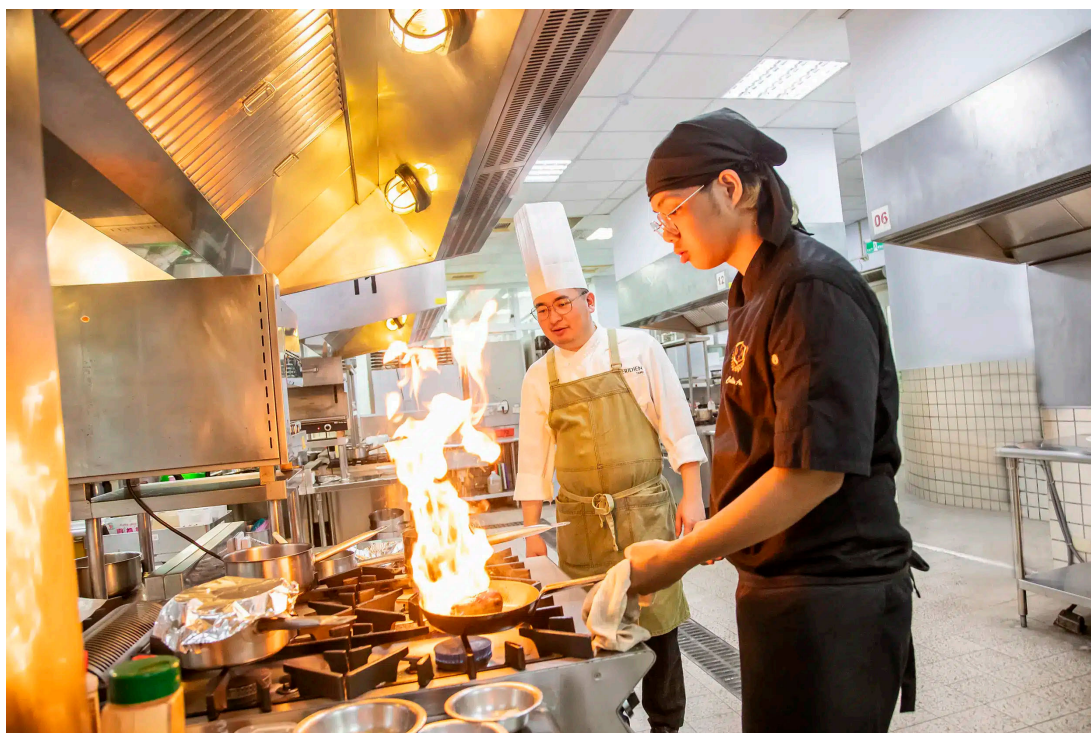
嘉藥餐旅系今年深受高中生青睞，通過人數與招生人數比率高達31.5

作為嘉藥的「金字招牌」，藥學系今年依舊熱度破表，共吸引2,418人報名，搶攻200個名額，穩坐全國技職科系之冠，除了藥學系表現亮眼，因應高齡化社會與大健康產業趨勢的相關學系也展現強大吸票能力，包含社會工作系、化粧品應用與管理系、環境工程與科學系及醫務管理系，皆吸引超過200名學子報名。