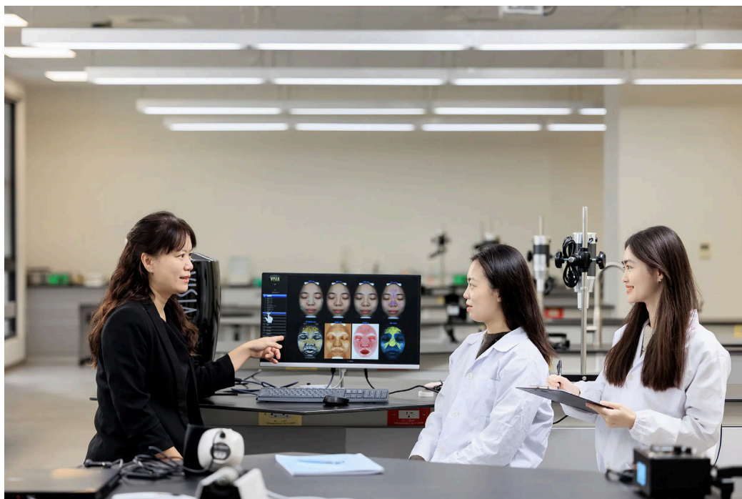
嘉藥粧品系著重實務操作與創新研發，學生於實驗室進行膚質檢測

順應疫後民眾消費習慣轉移至體驗服務及微型創業的熱潮，餐旅管理系一階通過人數與招生人數比高達31.5，競爭相當激烈；此外，受到超高齡社會銀髮族商機影響，高齡福祉養生管理系報名人數更較去年呈現近三倍成長，突顯學子對於未來就業市場趨勢的敏銳度。