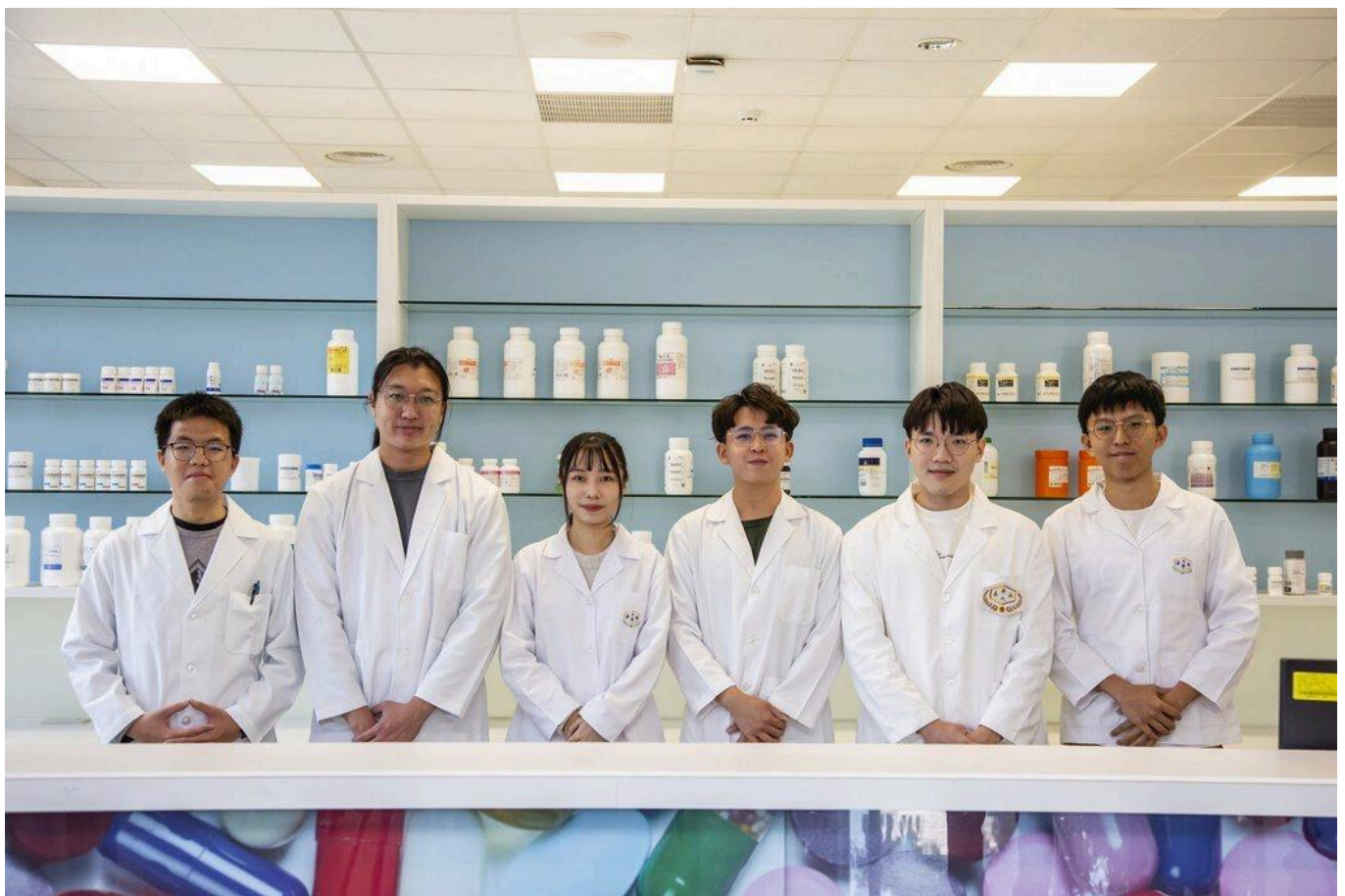
穩坐全國技職科系之冠的嘉藥藥學系，今年吸引2,418人報名，搶攻200個名額。