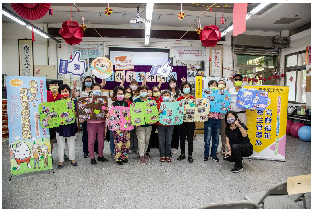
受到超高齡社會銀髮族商機帶動，嘉藥高福系今年報名人數較去年成長近三倍

作為嘉藥的「金字招牌」，藥學系今年依舊熱度破表，共吸引2,418人報名，搶攻200個名額，穩坐全國技職科系之冠，除了藥學系表現亮眼，因應高齡化社會與大健康產業趨勢的相關學系也展現強大吸票能力，包含社會工作系、化粧品應用與管理系、環境工程與科學系及醫務管理系，皆吸引超過200名學子報名。