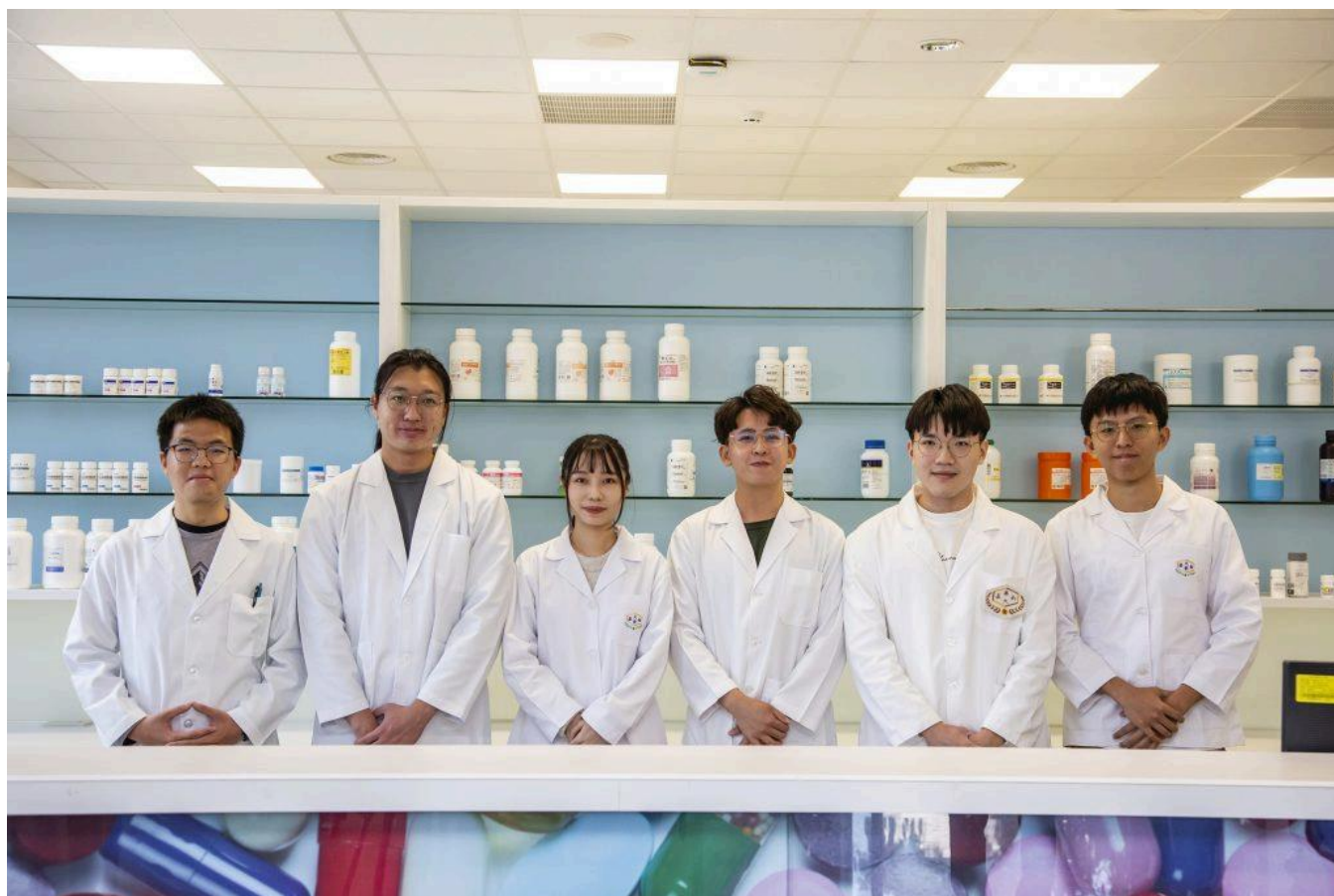
嘉藥藥學系相當搶手，今年四技申請吸引二千四百多人報名，爭取二百個名額。(記者黃文記攝)