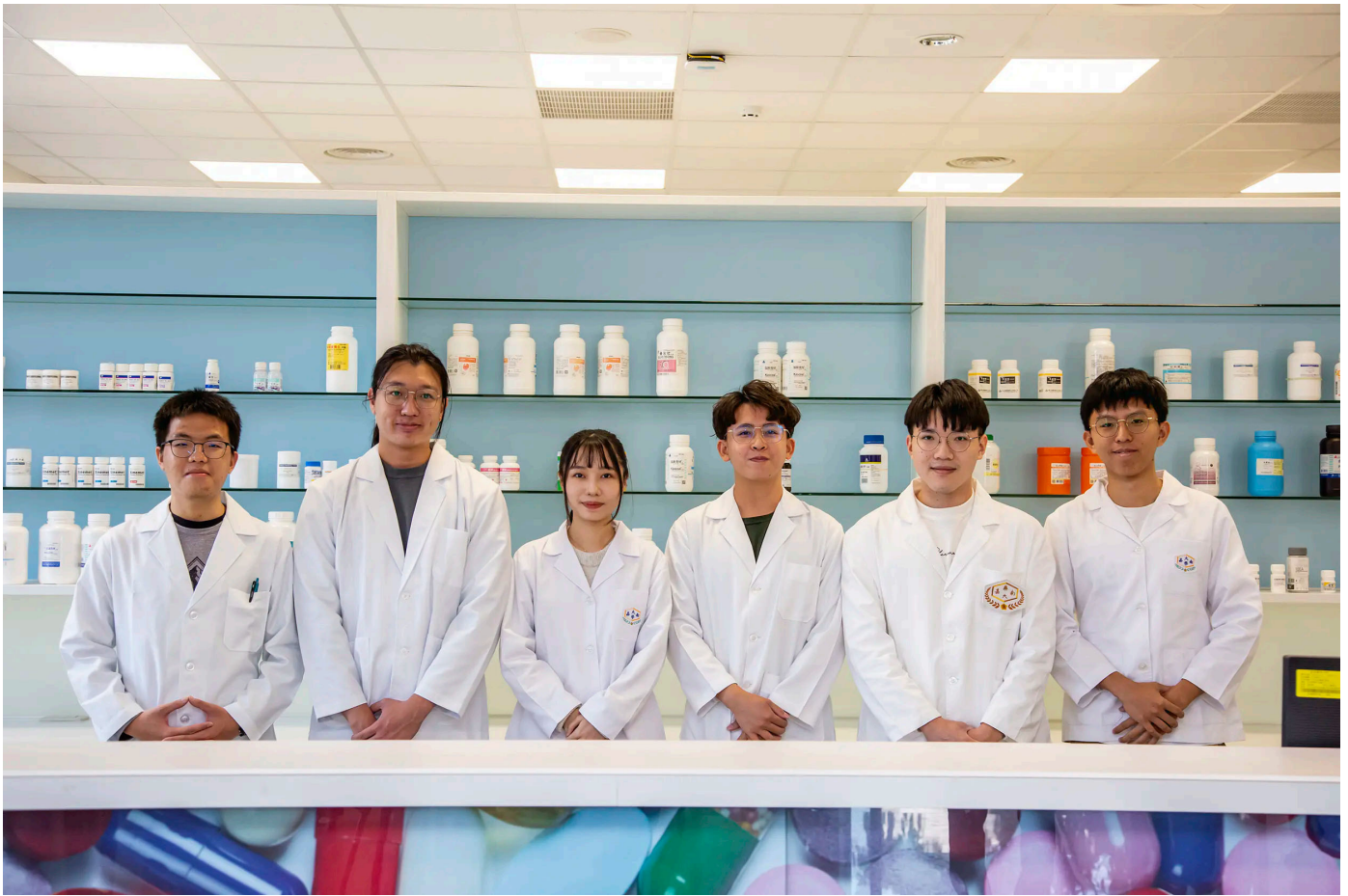
墨新聞 | 記者宋秉祥 / 台南報導