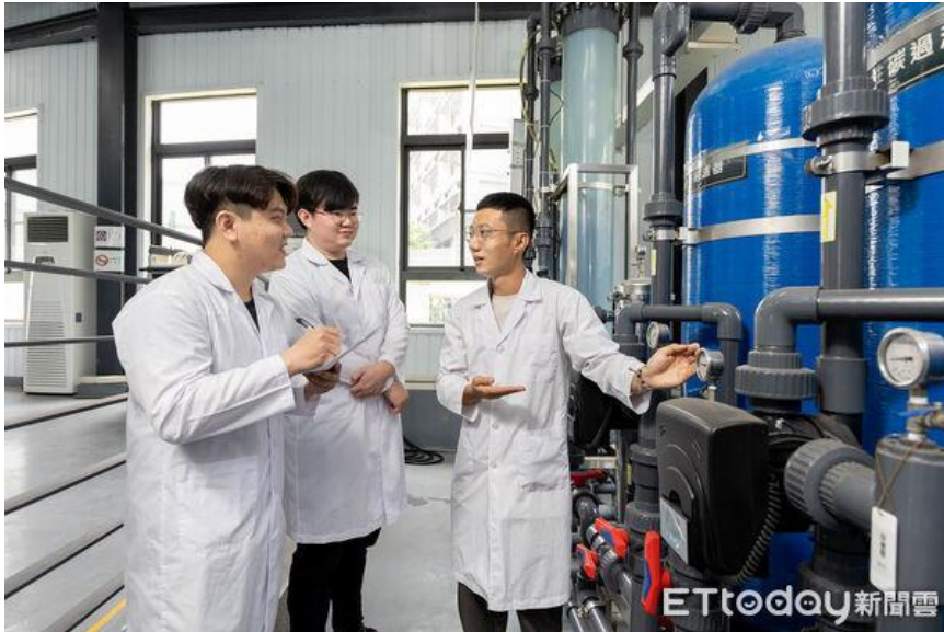
▲嘉南藥理大學四技申請一階放榜，吸引逾4600人報名。