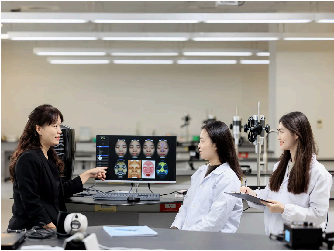
嘉藥粧品系著重實務操作與創新研發，學生於實驗室進行膚質檢測

餐旅管理系亦因應疫後體驗經濟與創業趨勢，報名熱度攀升，一階通過人數與招生名額比高達31.5倍；高齡福祉養生管理系則受銀髮產業帶動，報名人數較去年大幅成長近三倍，顯示學生對未來就業市場的高度關注。