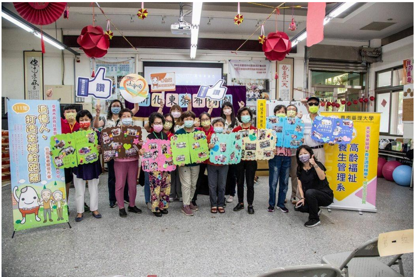
受到超高齡社會銀髮族商機帶動，嘉藥高福系今年報名人數較去年成長近三倍。