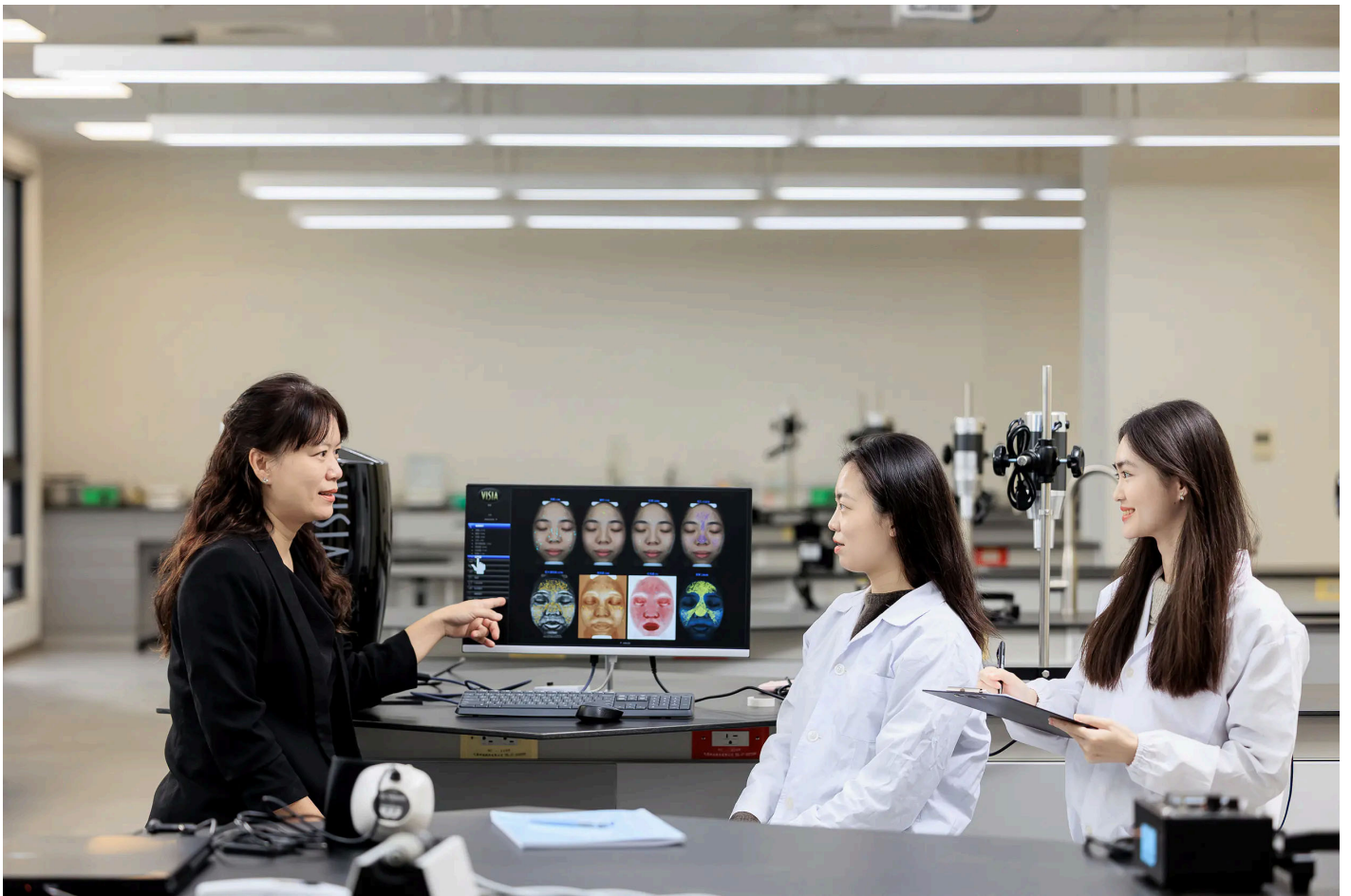
嘉藥粧品系著重實務操作與創新研發，學生於實驗室進行膚質檢測

近年來嘉藥在各項評比與表現上皆大放異彩，不僅在2026年「遠見雜誌」企業最愛大學生暨實習生調查榮獲南部私立技專校院第一；在「大學問」評比中，藥學系更榮獲高中生最愛科大熱門校系全國榜首。此外，2025年藥師國考中嘉藥取得高於全國平均兩倍的通過率，第二階段應屆畢業生更創下百分百通過率，甚至囊括全國榜眼及第五名，再度彰顯嘉藥卓越的醫藥與健康教育實力。