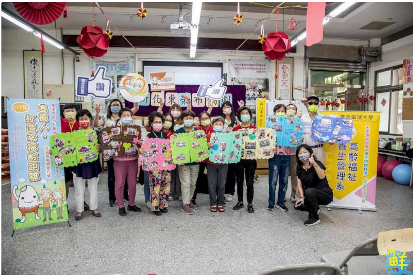
▲受到超高齡社會銀髮族商機帶動，嘉藥高福系今年報名人數較去年成長近三倍