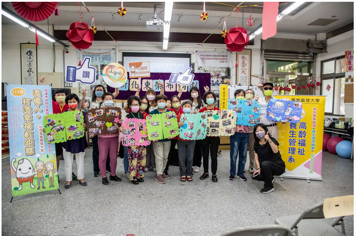
受到超高齡社會銀髮族商機帶動，嘉藥高福系今年報名人數較去年成長近三倍

115學年度四技申請入學第一階段於31日上午放榜，創校60年的嘉南藥理大學再度繳出亮眼成績單！今年共吸引4,671人報名第一階段，爭取全校僅有的475個名額，錄取率約僅10.2%。在少子化的嚴峻挑戰下，嘉藥依然強勢開出紅盤。