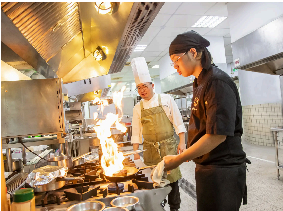
嘉藥餐旅系今年深受高中生青睞，通過人數與招生人數比率高達31.5

餐旅管理系亦因應疫後體驗經濟與創業趨勢，報名熱度攀升，一階通過人數與招生名額比高達31.5倍；高齡福祉養生管理系則受銀髮產業帶動，報名人數較去年大幅成長近三倍，顯示學生對未來就業市場的高度關注。