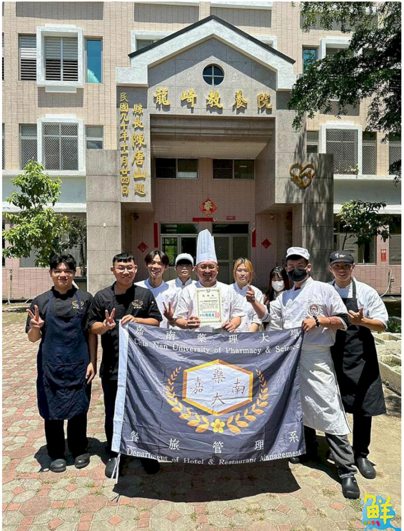
▲嘉藥餐旅系師生「嘉倍溫馨 餐旅傳愛」愛心送餐活動圓滿完成