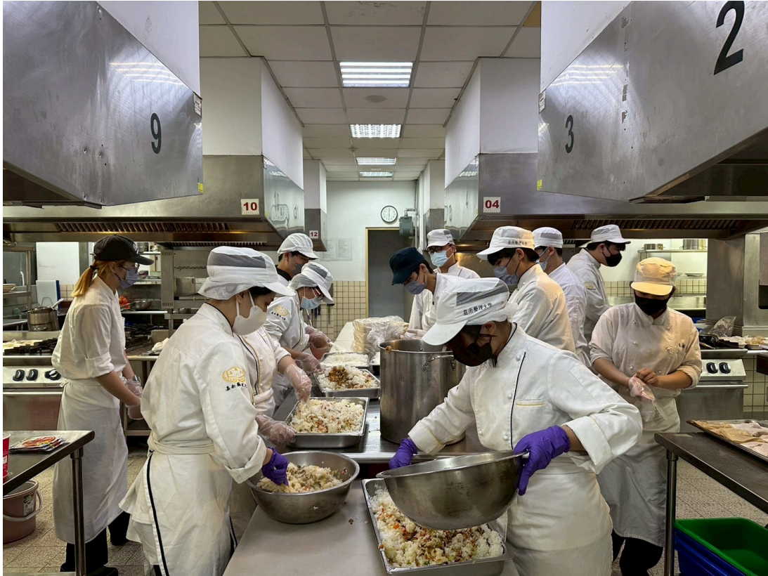
餐旅系學生於專業廚房分工製作愛心餐盒

又到鳳凰花開的畢業季，嘉南藥理大學餐旅管理系應屆畢業生於6日舉辦「嘉倍溫馨 餐旅傳愛」愛心送餐活動，精心製作200份專為高齡及身心障礙者設計的營養便當，親自送往鄰近的龍崎教養院及五甲教養院，此次活動不僅是畢業專題的成果展現，更是嘉藥學子們踏入職場前，以實際行動對社會最誠摯的回饋。