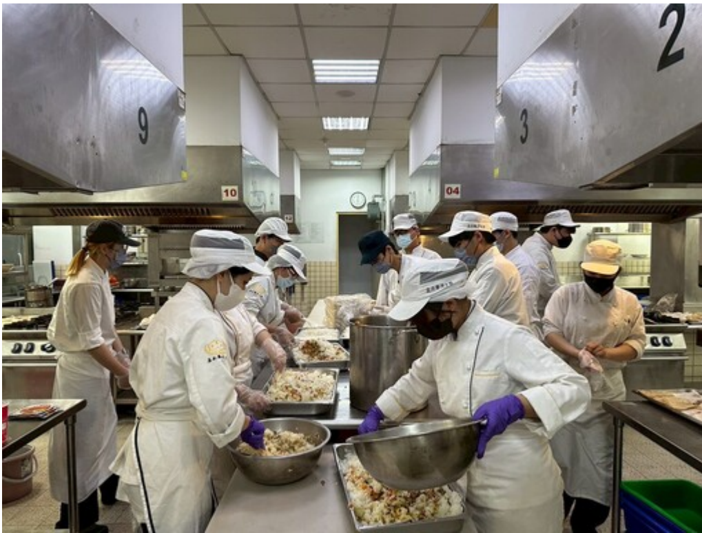
餐旅系學生於專業廚房分工製作愛心餐盒

為了讓餐點更貼近院友需求，學生團隊在規劃菜單前，特別深入了解教養院院友的需求，考慮到長者與特殊院友在咀嚼與吞嚥上的困難，以「軟嫩好入口、營養均衡」為核心理念設計餐食。菜色兼顧美味與健康，包含日式綜合炊飯、紙包檸香魚、軟爛入味滷排骨、黃金玉子燒、番茄炒蛋及絲瓜蛤蜊等，涵蓋蛋白質、膳食纖維與多種營養元素，讓院友享用不同於日常的精緻餐點。