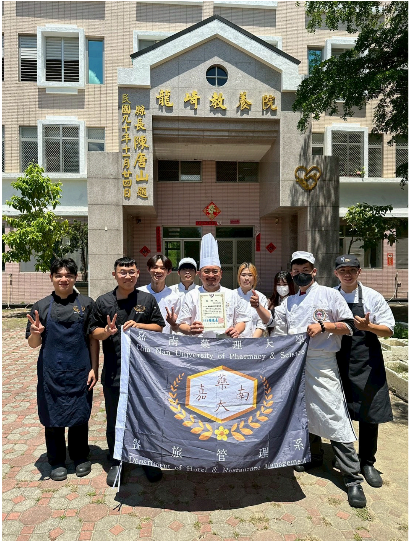
—— 嘉藥餐旅系師生「嘉倍溫馨 餐旅傳愛」愛心送餐活動圓滿完成

與「長時燉煮」等技法，確保營養不流失，口感軟嫩好吞嚥，讓嘉藥人的愛心不只看得到，更是「吃得到」。