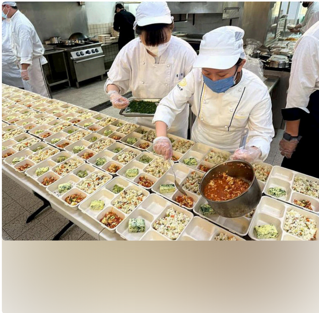
學生團隊深入瞭解院友需求，設計營養均衡軟嫩好入口的菜單。