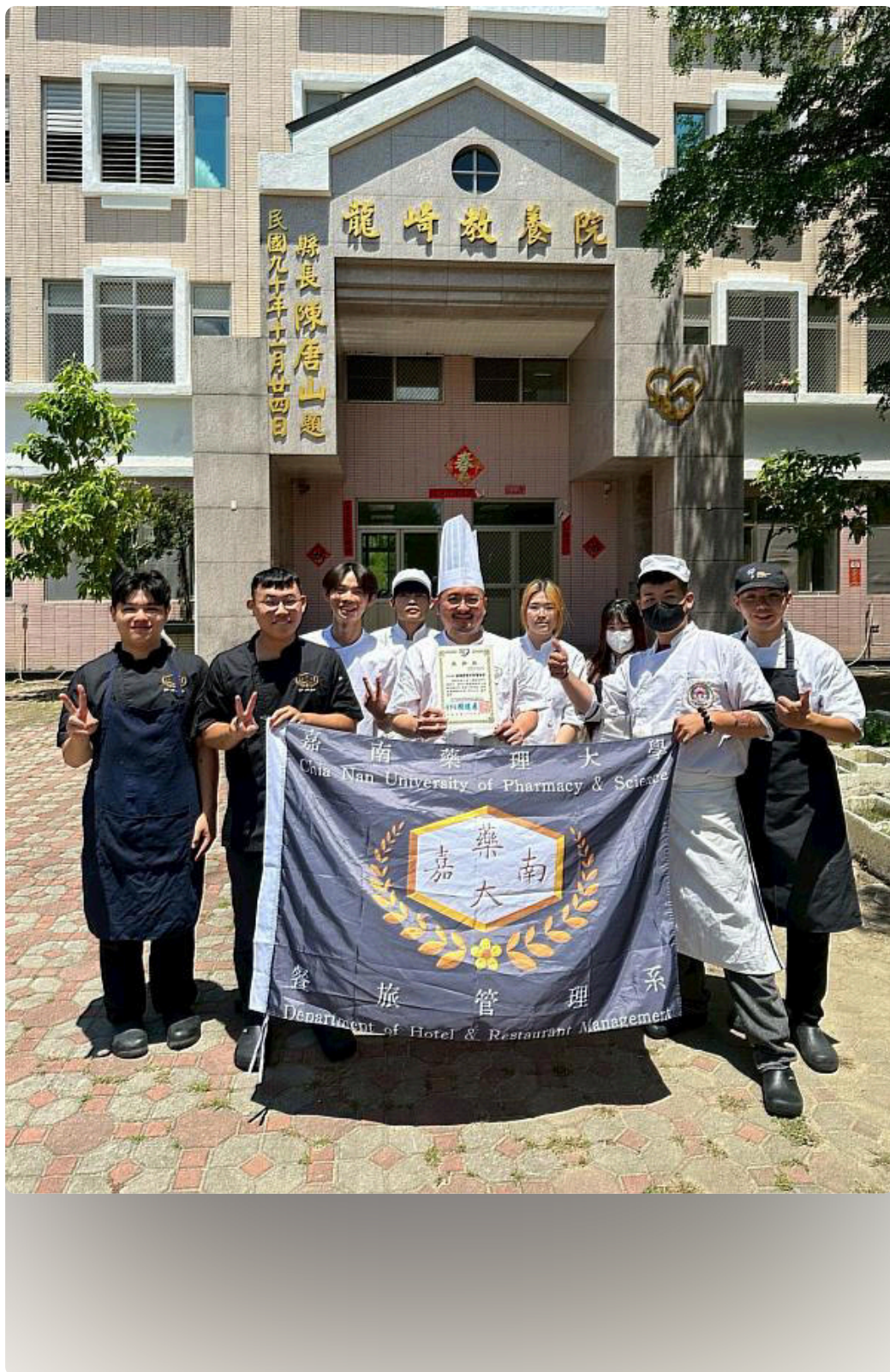
嘉藥餐旅系師生「嘉倍溫馨 餐旅傳愛」愛心送餐活動圓滿完成。