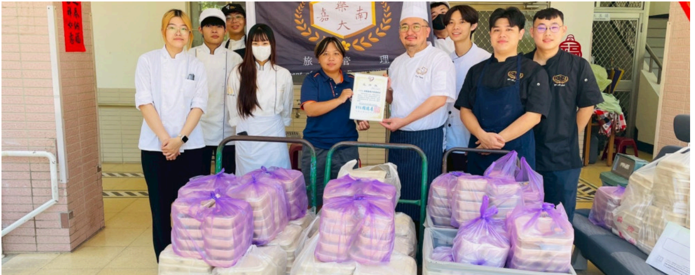
2026-05-06 勁報 勁報, 合作媒體