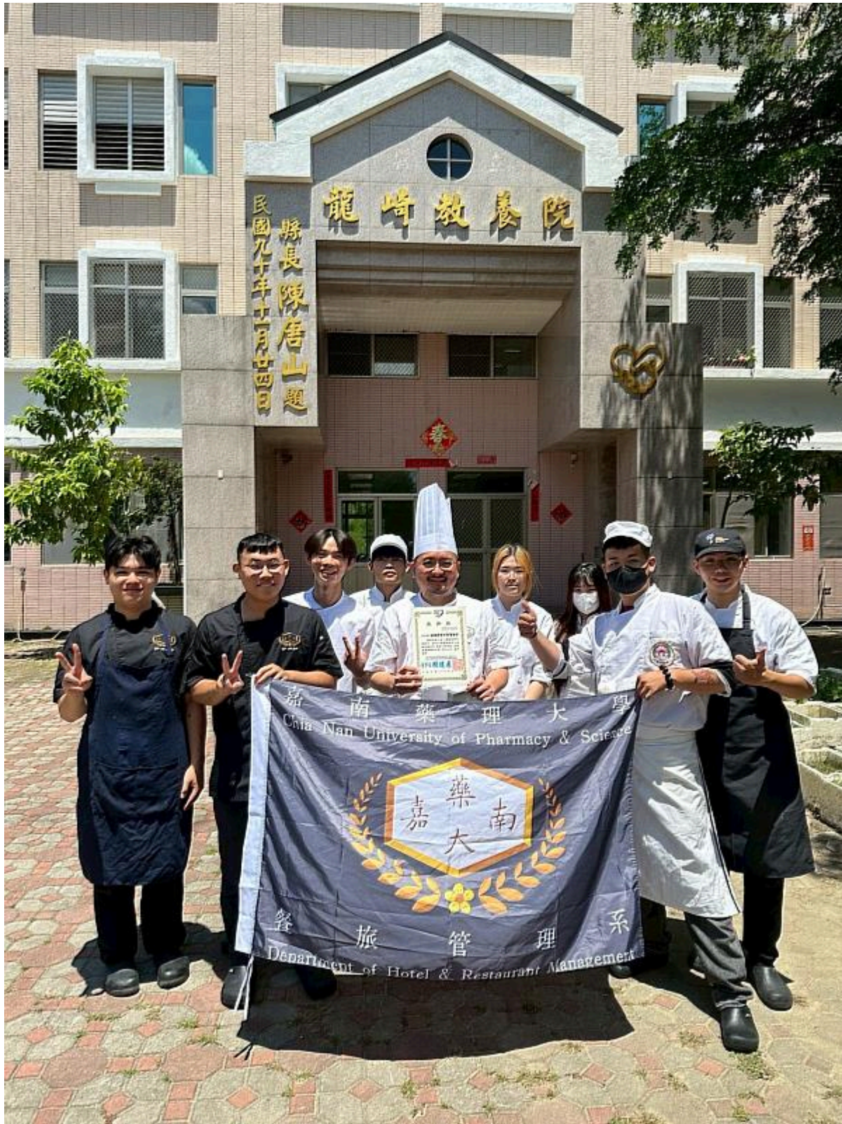
嘉藥餐旅系師生「嘉倍溫馨 餐旅傳愛」愛心送餐活動圓滿完成。