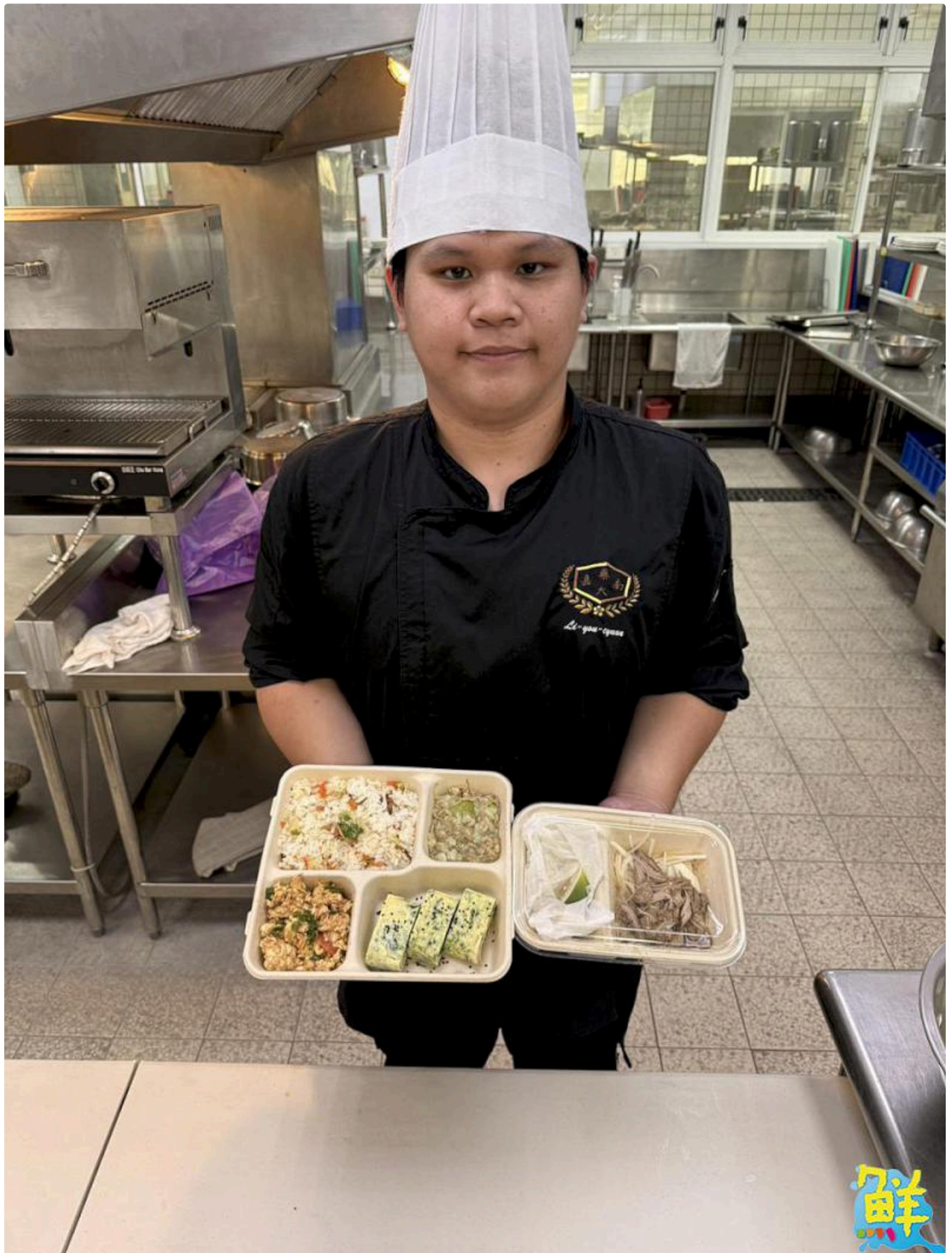
▲餐旅系學生為教養院院友們精心製作愛心營養便當