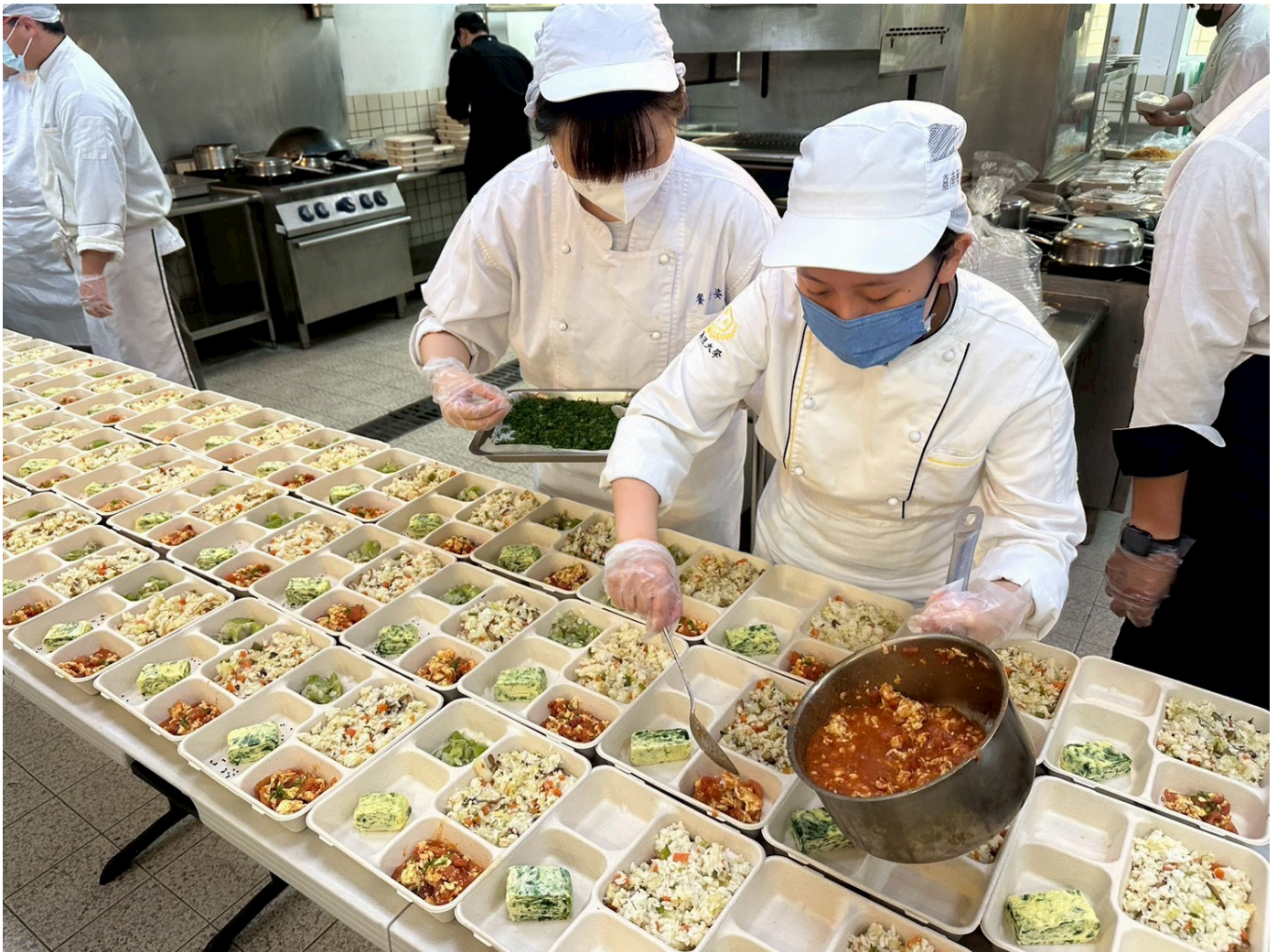
墨新聞 | 記者宋秉祥 / 台南報導