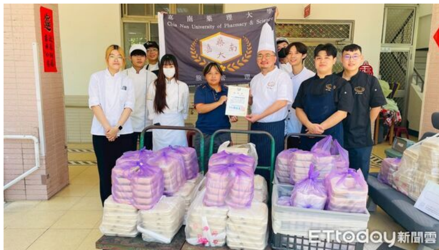
▲嘉南藥理大學餐旅系畢業生親手製作200份愛心便當，送往教養院關懷院友。