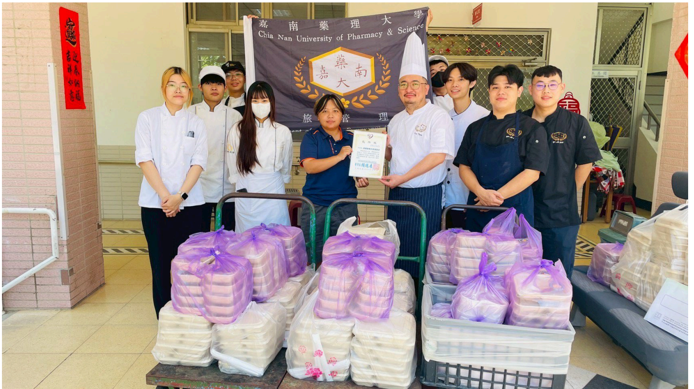
▲院方代表致贈感謝狀。