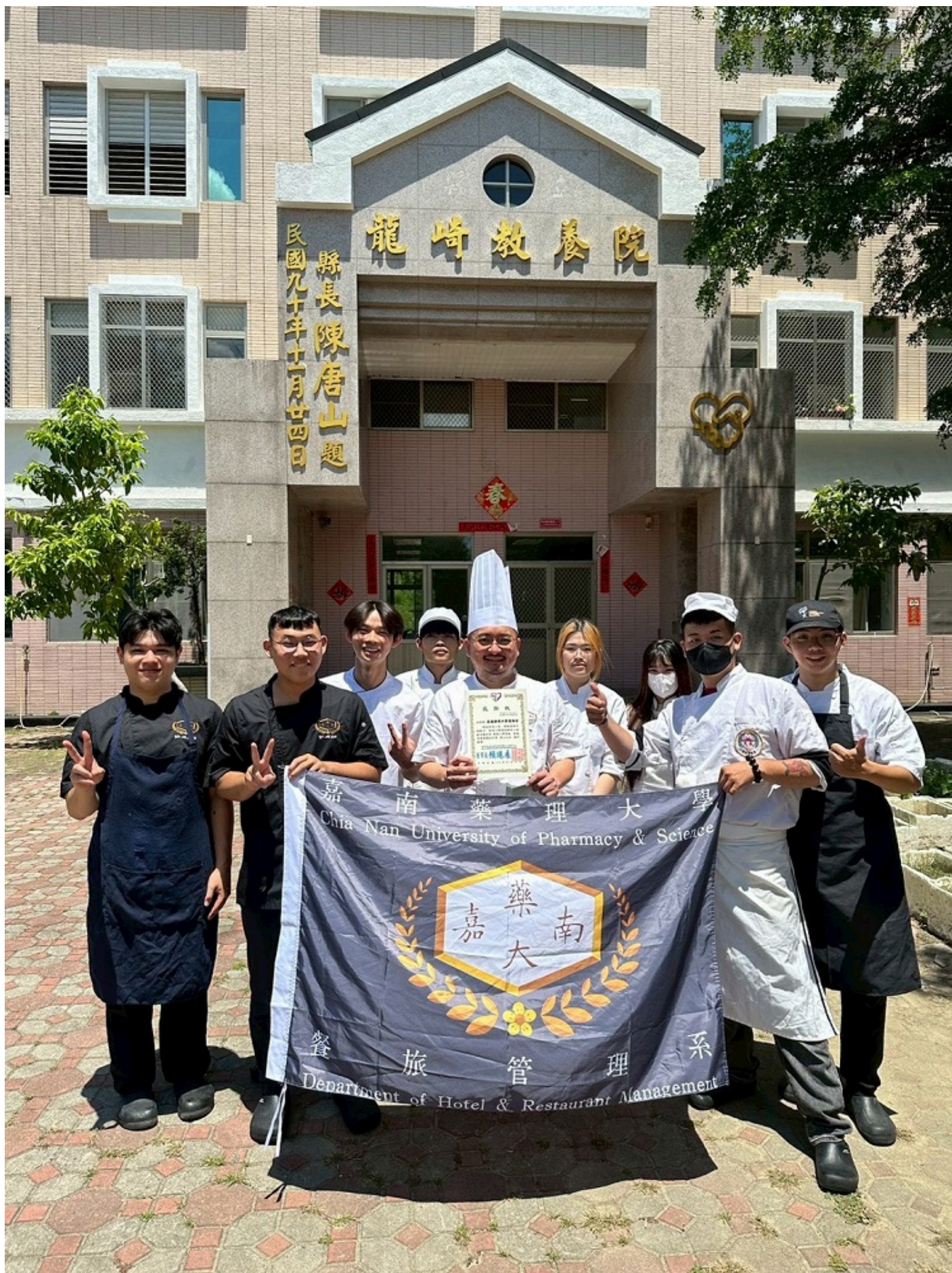
【快通新聞記者蔡文雄/台南報導】即將又到鳳凰花開的畢業季，嘉南藥理大學餐旅管理系應屆畢業生於6日舉辦「嘉倍溫馨 餐旅傳愛」愛心送餐活動，精心製作200份專為高齡及身心障礙者設計的營養便當，親自送往鄰近的龍崎教養院及五甲教養院，此次活動不