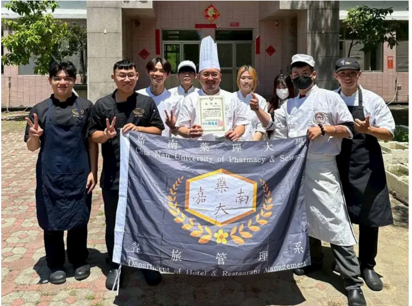
嘉藥餐旅系學生透過愛心送餐活動，將專業結合公益，實踐技職教育精神。