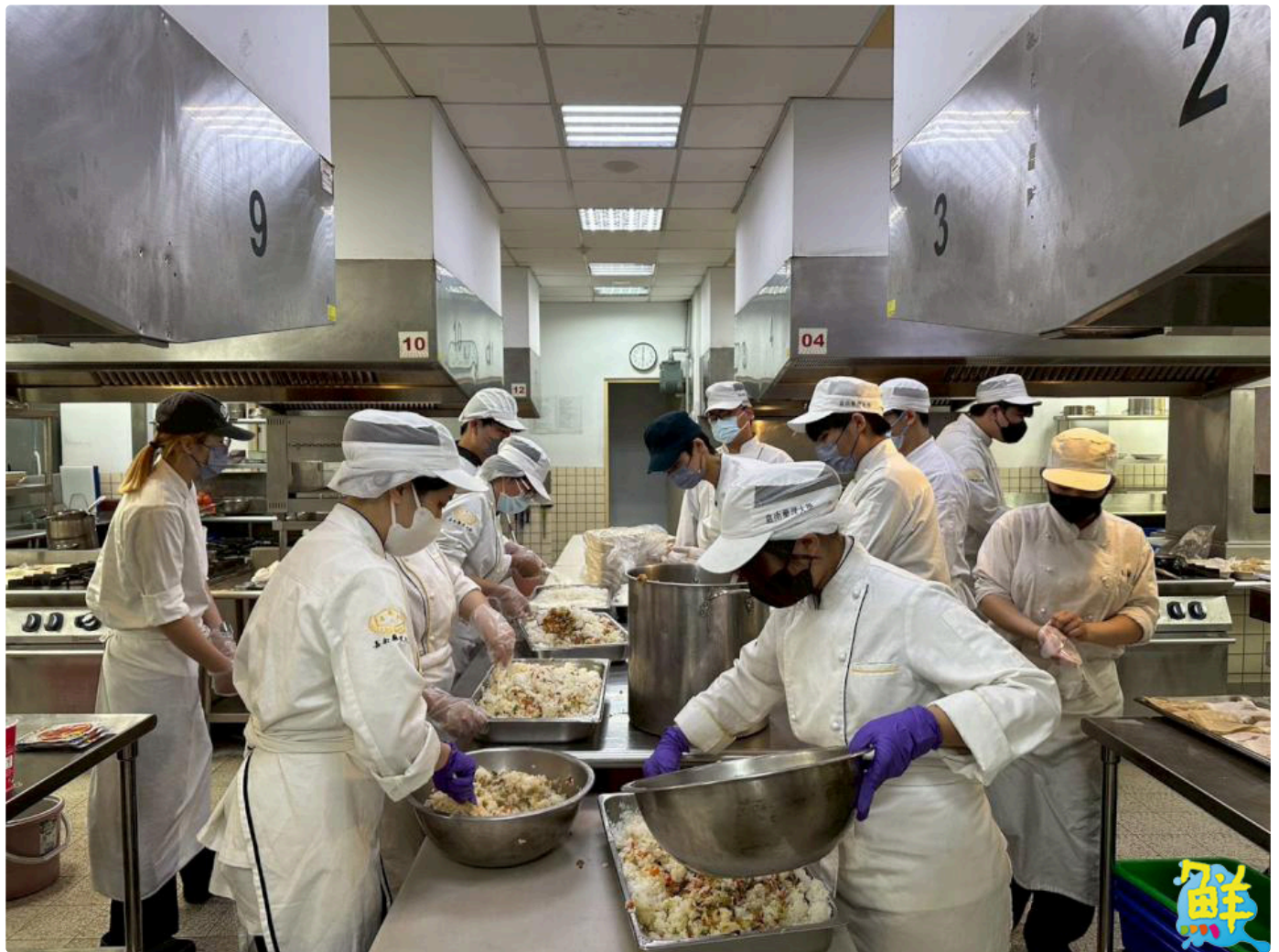
▲餐旅系學生於專業廚房分工製作愛心餐盒