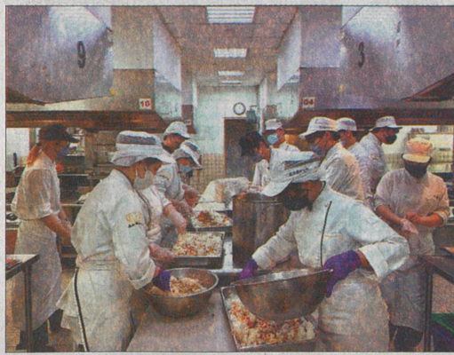
↑嘉藥餐旅系學生在專業廚房分工製作愛心餐盒。