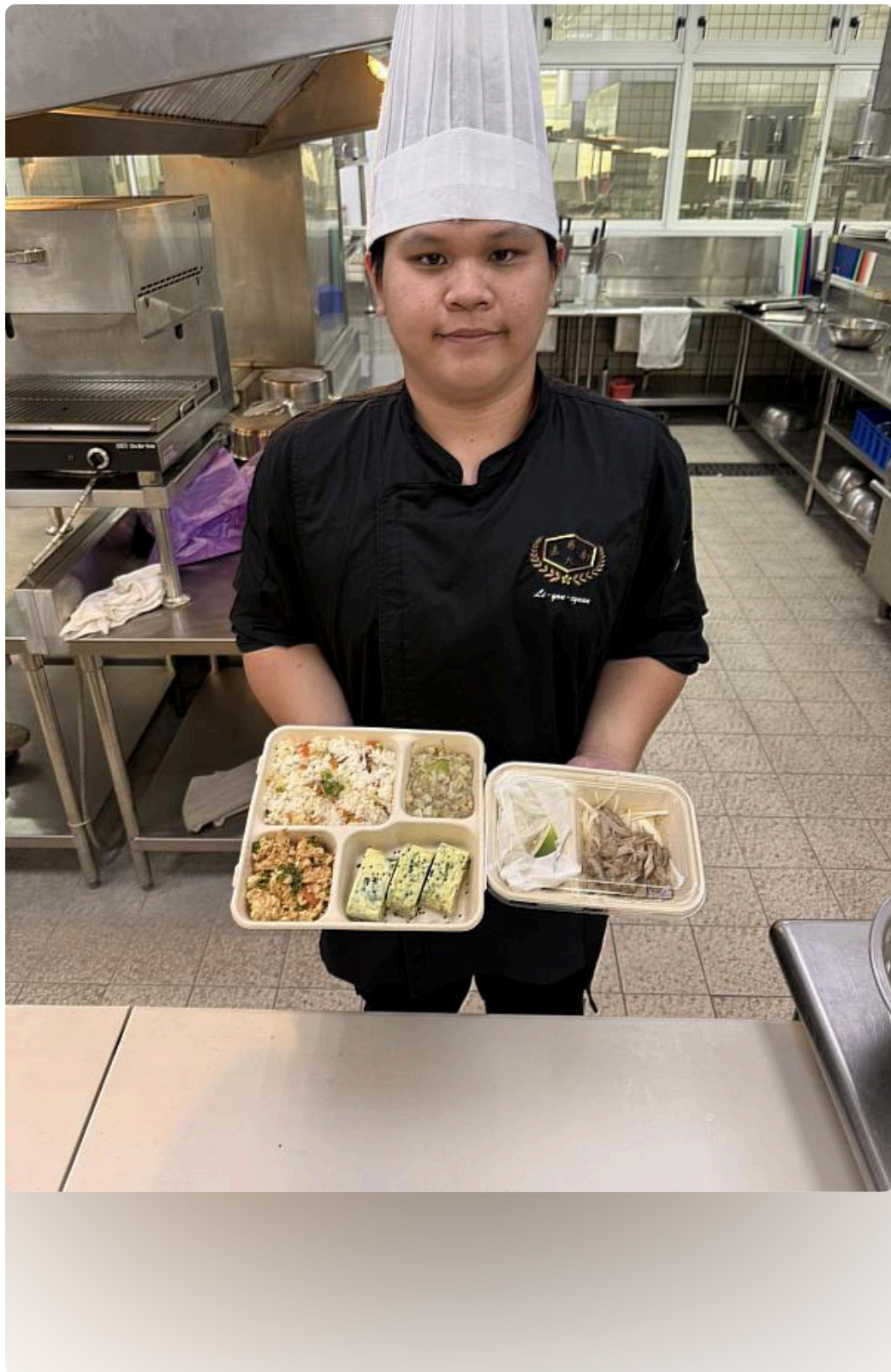
嘉藥餐旅系學生為教養院院友們精心製作愛心營養便當。