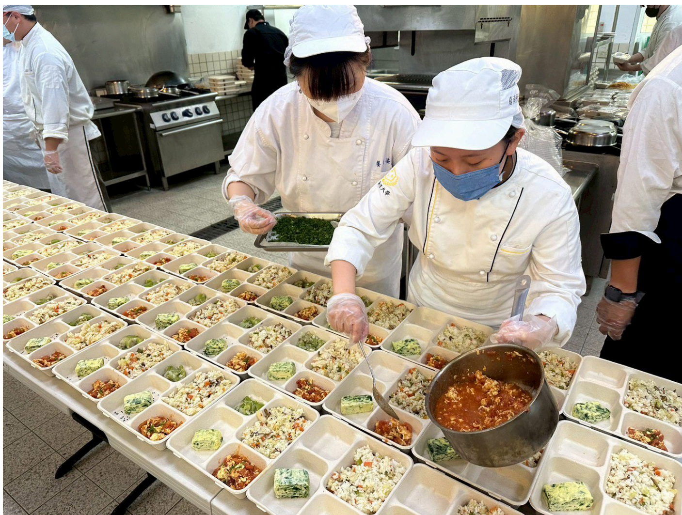
▲學生團隊深入瞭解院友需求 設計營養均衡軟嫩好入口的菜單。

為了讓餐點更貼近院友需求，學生團隊在規劃菜單前，特別深入了解教養院院友的需求，考慮到長者與特殊院友在咀嚼與吞嚥上的困難，以「軟嫩好入口、營養均衡」為核心理念設計餐食。菜色兼顧美味與健康，包含日式綜合炊飯、紙包檸香魚、軟爛入味滷排骨、黃金玉子燒、番茄炒蛋及絲瓜蛤蜊等，涵蓋蛋白質、膳食纖維與多種營養元素，讓院友享用不同於日常的精緻餐點。