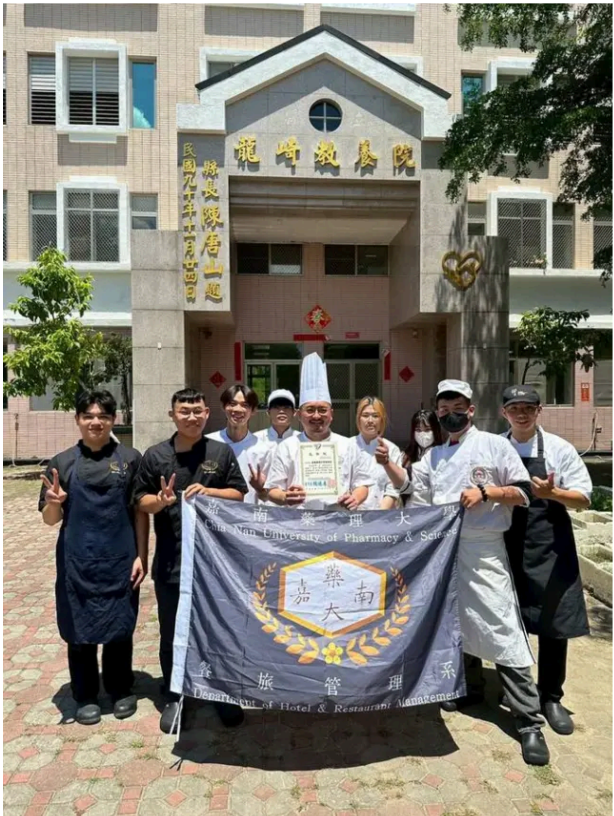
(圖說) 嘉藥餐旅系師生「嘉倍溫馨 餐旅傳愛」愛心送餐活動圓滿完成。(記者鄭德政攝)