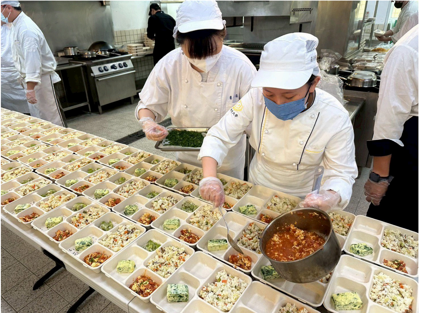
▲學生團隊深入瞭解院友需求 設計營養均衡軟嫩好入口的菜單。

為了讓餐點更貼近院友需求，學生團隊在規劃菜單前，特別深入了解教養院院友的需求，考慮到長者與特殊院友在咀嚼與吞嚥上的困難，以「軟嫩好入口、營養均衡」為核心理念設計餐食。菜色兼顧美味與健康，包含日式綜合炊飯、紙包檸香魚、軟爛入味滷排骨、黃金玉子燒、番茄炒蛋及絲瓜蛤蜊等，涵蓋蛋白質、膳食纖維與多種營養元素，讓院友享用不同於日常的精緻餐點。