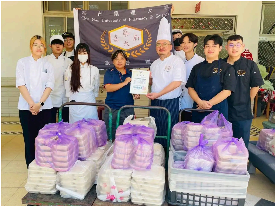
嘉藥餐旅系畢業生製作200份愛心便當，送往教養院關懷長者與身障院友。