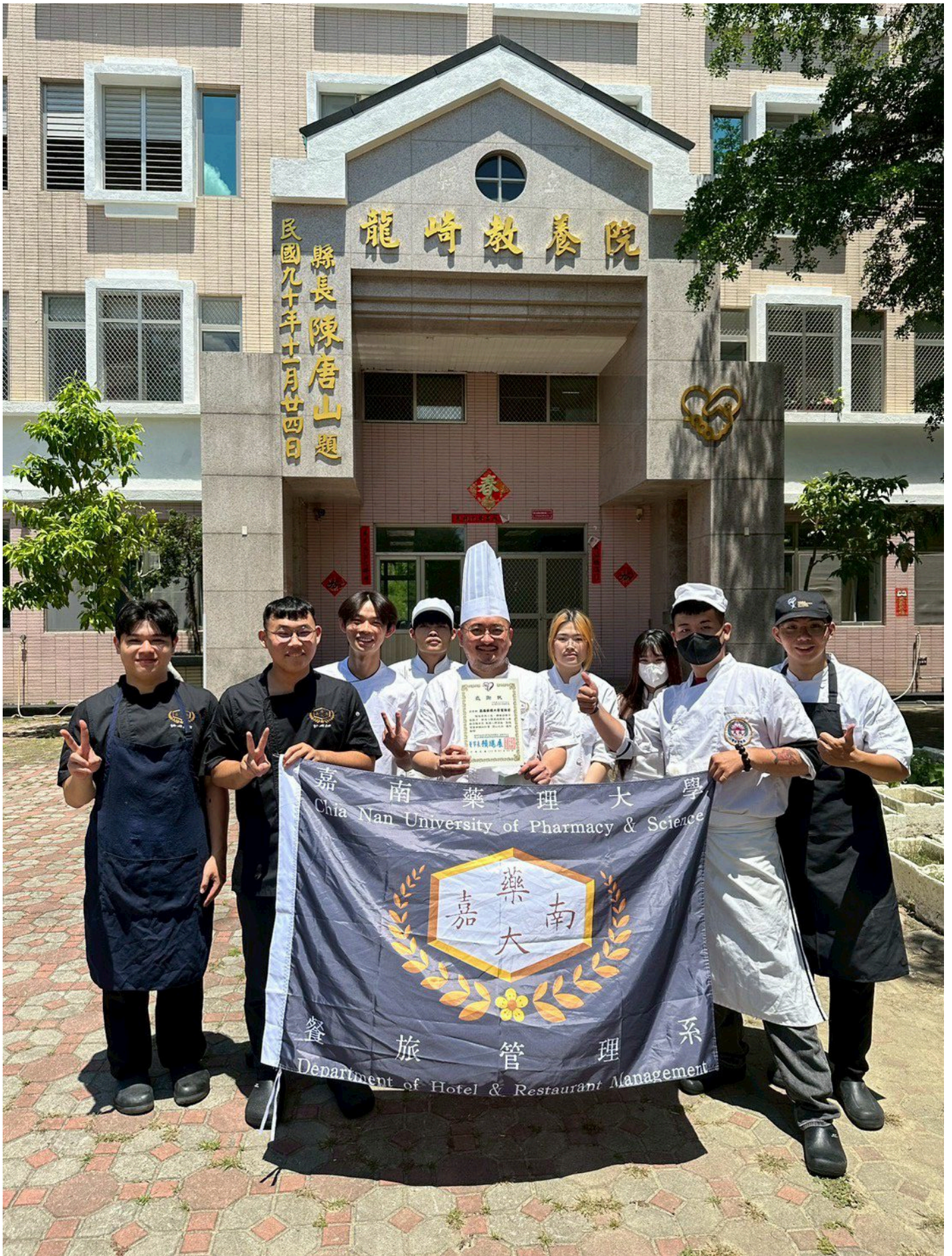
【記者郭忠淵／台南報導】即將又到鳳凰花開的畢業季，嘉南藥理大學餐旅管理系應屆畢業生於6日舉辦「嘉倍溫馨 餐旅傳愛」愛心送餐活動，精心製作200份專為高齡及身心障礙者設計的營養便