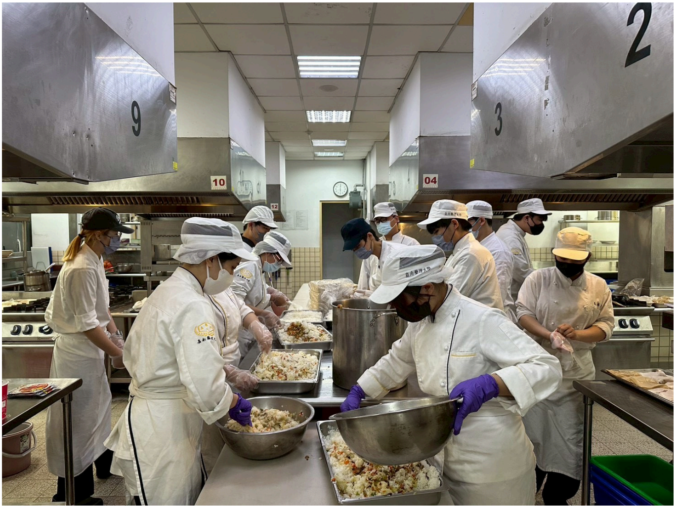
—— 餐旅系學生於專業廚房分工製作愛心餐盒

為了讓餐點更貼近院友需求，學生團隊在規劃菜單前，特別深入了解教養院院友的需求，考慮到長者與特殊院友在咀嚼與吞嚥上的困難，以「軟嫩好入口、營養均衡」為核心理念設計餐食。菜色兼顧美味與健康，包含日式綜合炊飯、紙包檸香魚、軟爛入味滷排骨、黃金玉子燒、番茄炒蛋及絲瓜蛤蜊等，涵蓋蛋白質、膳食纖維與多種營養元素，讓院友享用不同於日常的精緻餐點。