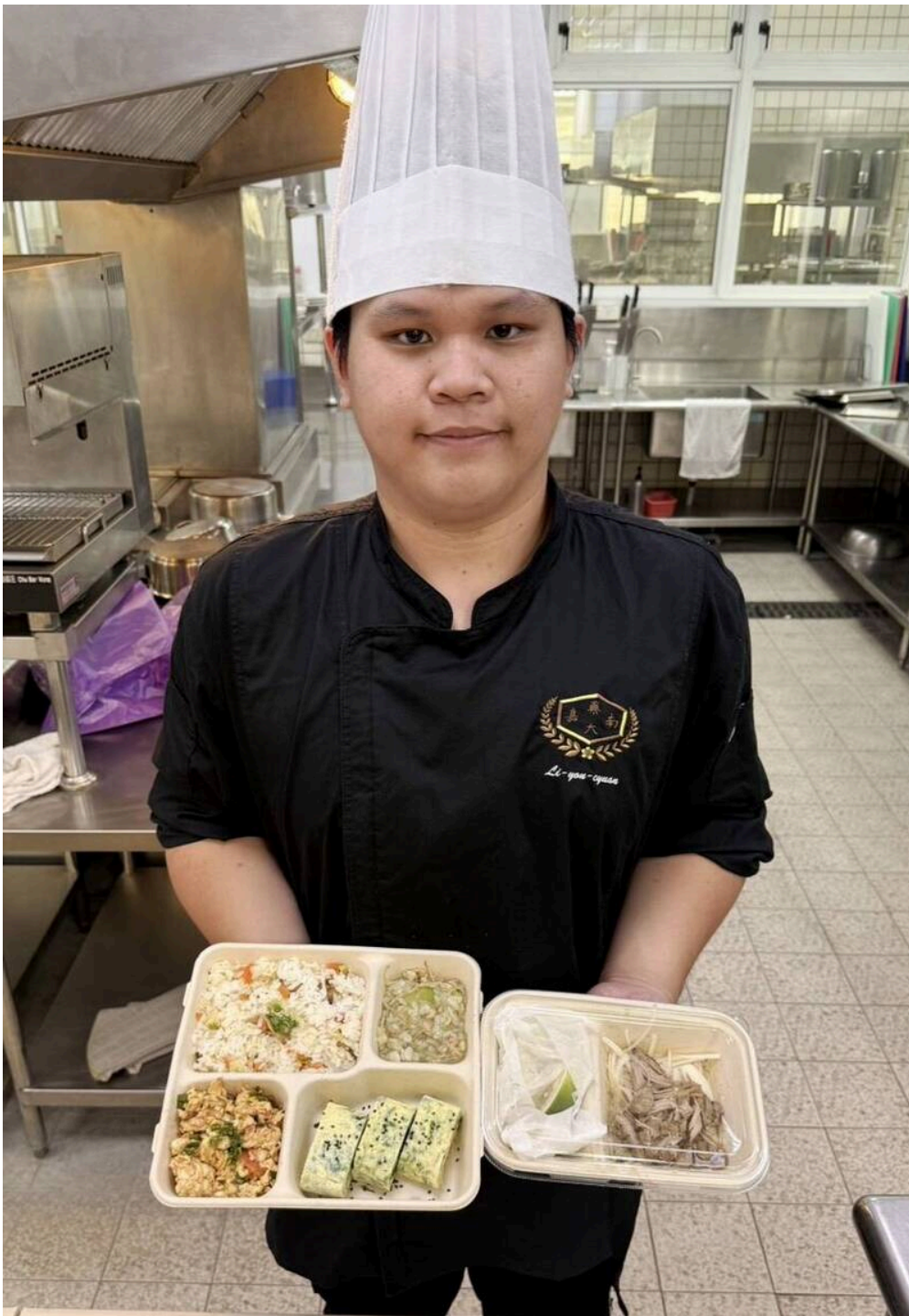
畢業生團隊針對高齡長輩與身心障礙者的需求，設計愛心便當的菜色。

自由時報版權所有不得轉載 © 2026 The Liberty Times. All Rights Reserved.