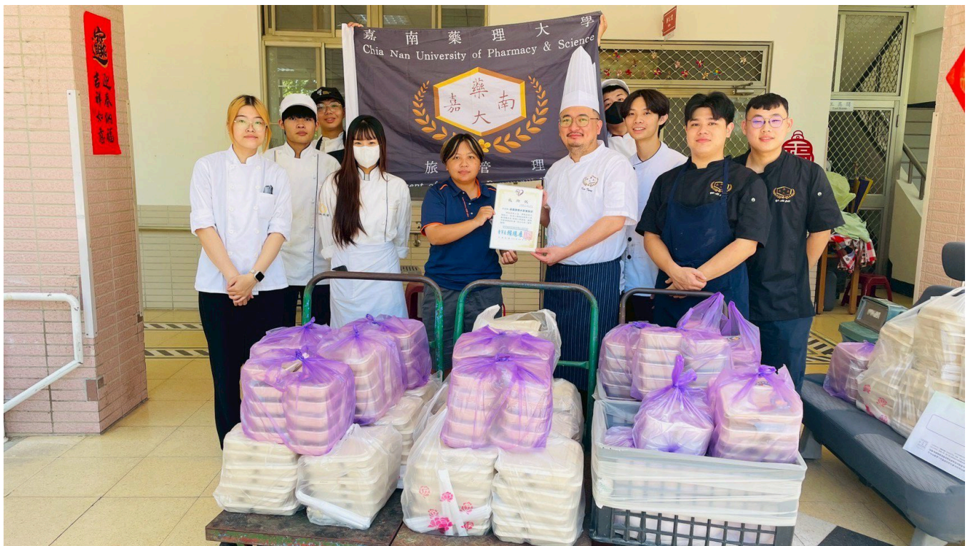
▲院方代表致贈感謝狀。