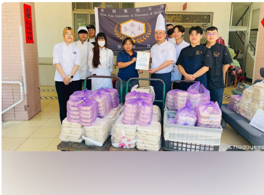
嘉藥餐旅生畢業前送暖 200份愛心便當送進教養院