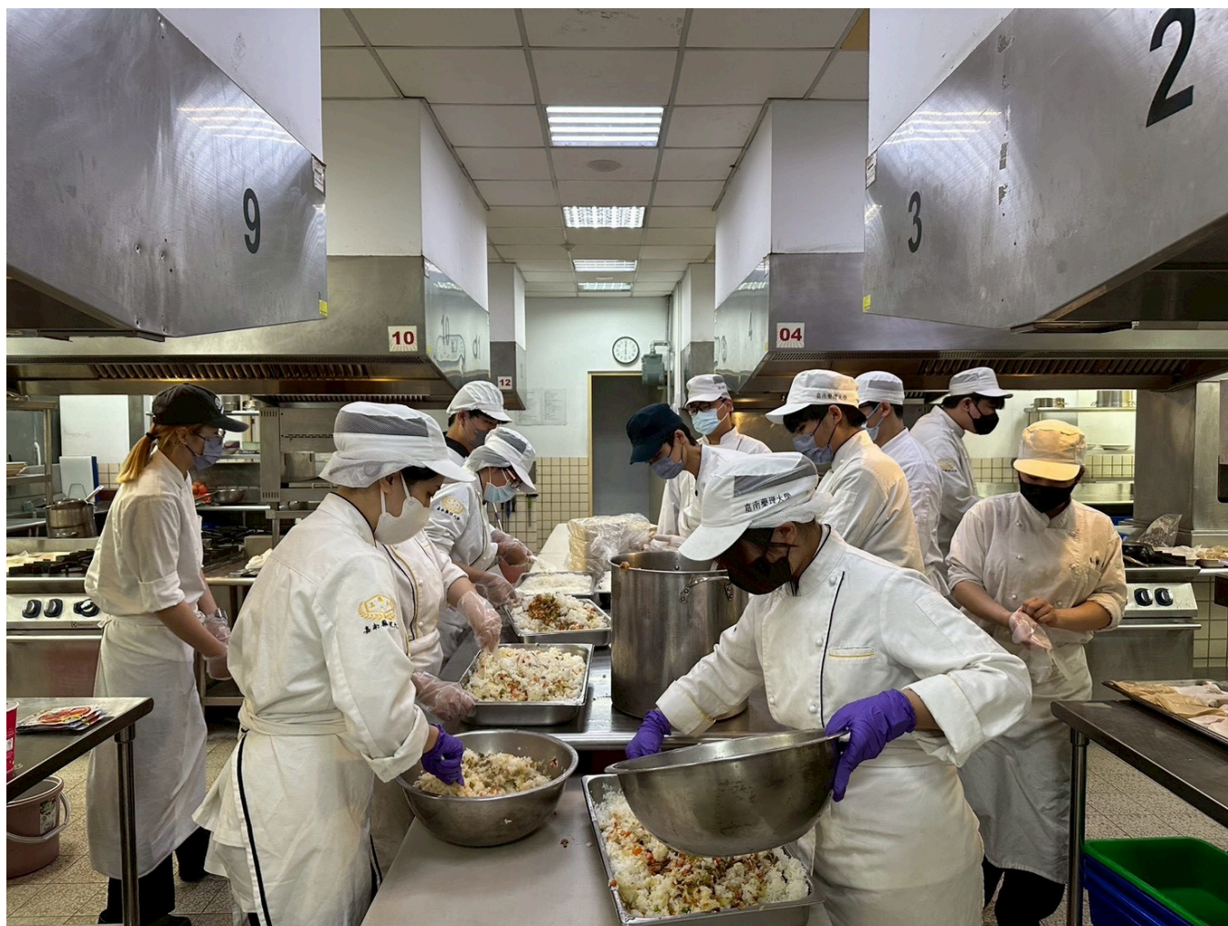
餐旅系學生於專業廚房分工製作愛心餐盒

為了讓餐點更貼近院友需求，學生團隊在規劃菜單前，特別深入了解教養院院友的需求，考慮到長者與特殊院友在咀嚼與吞嚥上的困難，以「軟嫩好入口、營養均衡」為核心理念設計餐食。菜色兼顧美味與健康，包含日式綜合炊飯、紙包檸香魚、軟爛入味滷排骨、黃金玉子燒、番茄炒蛋及絲瓜蛤蜊等，涵蓋蛋白質、膳食纖維與多種營養元素，讓院友享用不同於日常的精緻餐點。