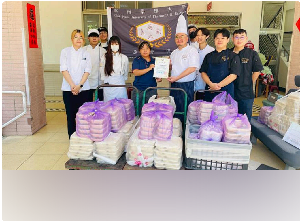
院方代表致贈感謝狀。