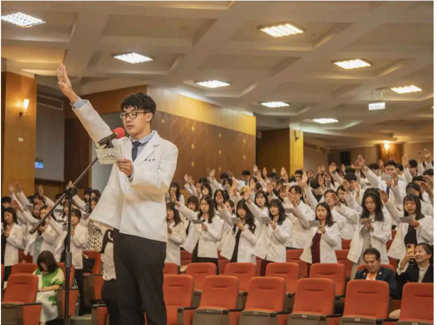
嘉南藥理大學藥學系舉辦授袍典禮，222位學生正式披上白袍，邁向藥師之路。