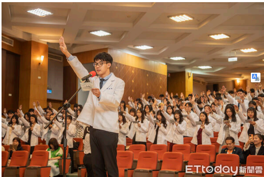
▲嘉南藥理大學藥學系舉行111級藥師授袍典禮，222名藥學生披上象徵責任與使命的藥師白袍。