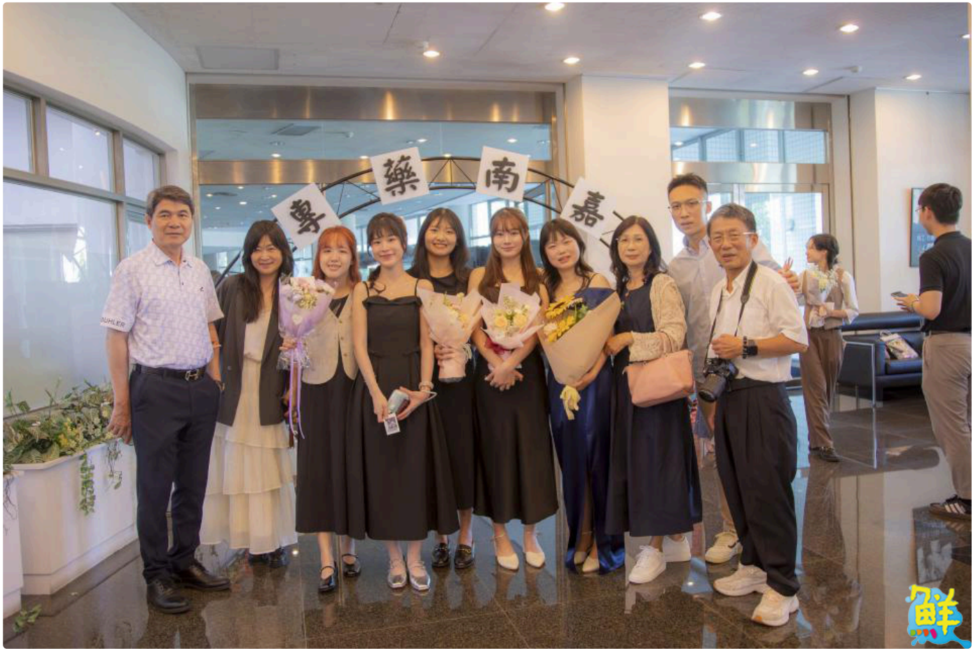
▲嘉藥藥學系授袍典禮每位受袍生精心打扮與師長及親友共同見證重要時刻