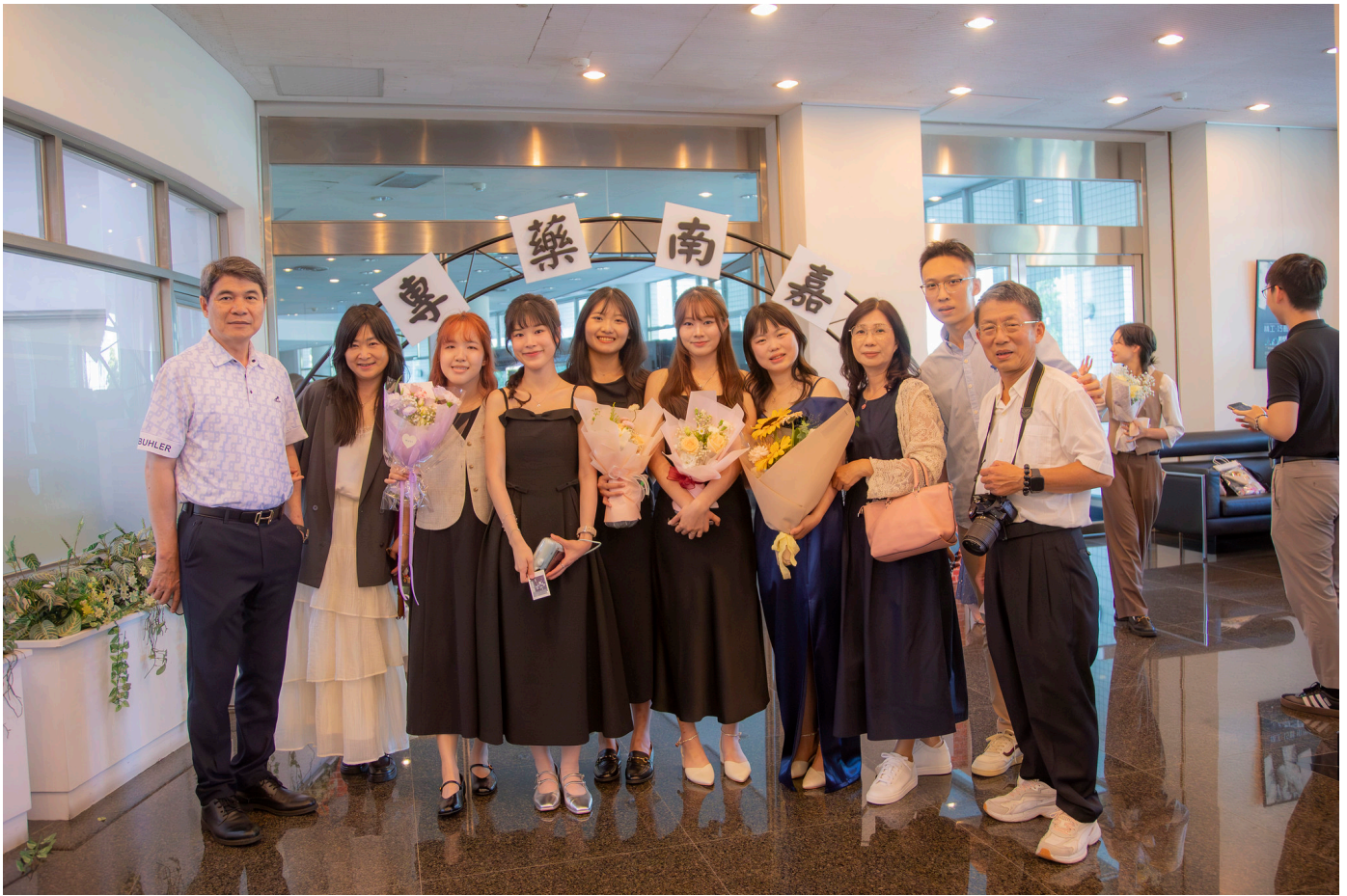
墨新聞 | 記者宋秉祥 / 台南報導