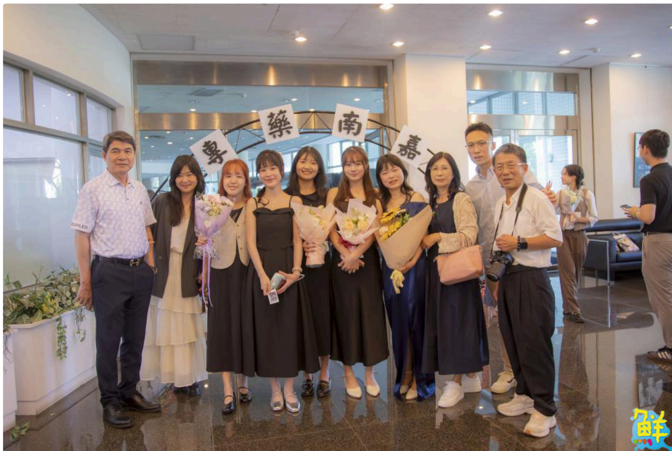
▲嘉藥藥學系授袍典禮每位受袍生精心打扮與師長及親友共同見證重要時刻