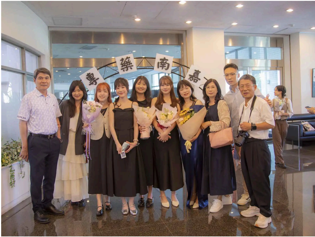
嘉南藥理大學藥學系舉辦授袍典禮，222位學生披上白袍，正式邁向藥師臨床實務。

嘉藥校長張翊峰表示，學校長期深耕藥學教育，培育眾多優秀藥事人才。面對AI科技快速發展，未來藥師除了具備扎實專業知識，也應善用科技提升藥事服務品質，成為智慧醫藥的重要推動者。他勉勵學生秉持「Pharmony」精神，在專業與關懷之間取得平衡，成為守護全民健康的重要力量。