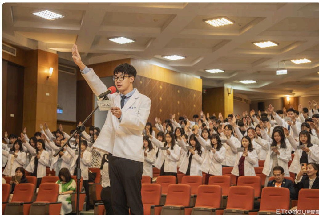
嘉藥藥學系授袍典禮隆重登場 222名藥學生披白袍邁向藥師實務