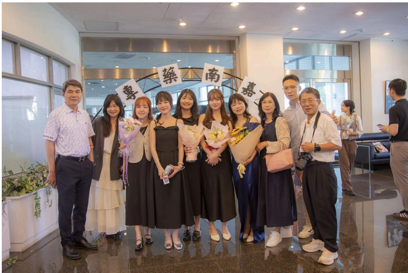
▲嘉藥藥學系授袍典禮每位受袍生精心打扮與師長及親友共同見證重要時刻。