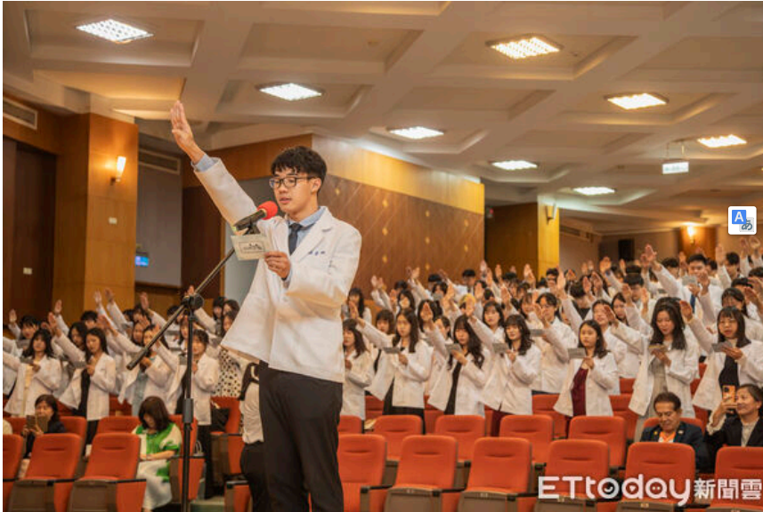
▲嘉南藥理大學藥學系舉行111級藥師授袍典禮，222名藥學生披上象徵責任與使命的藥師白袍。(記者林東良翻攝，下同)