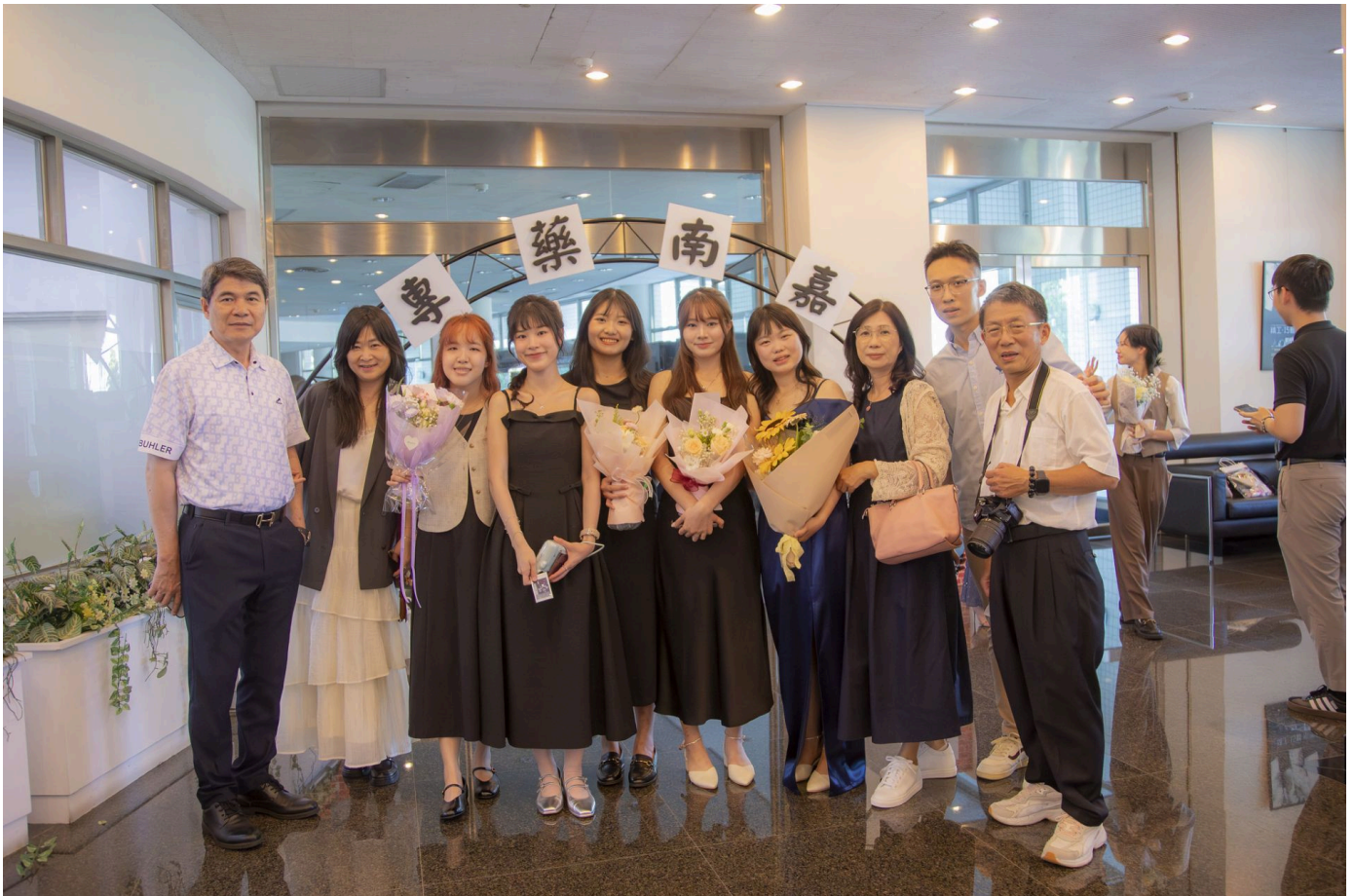
▲嘉藥藥學系授袍典禮每位受袍生精心打扮與師長及親友共同見證重要時刻。