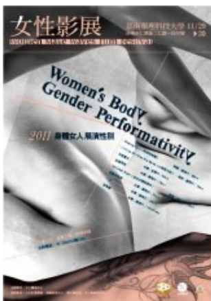
圖說：2011 女性影展海報。

2011 年女性影展於 11 月 29、30 日在嘉南藥理科技大學國際會議大樓 2 樓演藝廳舉辦巡迴影展。影片播放時段共有三個場次，第一場次於 11 月 29 日 15：20、第二場次為 11 月 30 日 10：20、第三場次則為當日 15：20，影片內容包含以成長的代價—家庭關係為主題的「搖滾泡泡糖」，以母職與學校教育為議題的「小孩說大話」、「天使農夫」跟「幻想男孩」，以玫瑰戰爭與家庭議題為題材的「金先生謀殺事件」、「烏龜和眼淚」及「一天」等七部影片。希望藉由女性影像的放映呈現另一種真實的聲音，進而就相關的多元議題深入進行討論，促使性別之間瞭解彼此，並造就其價值、態度與行為，進而引導參與者破除其性別歧視、偏見與刻板化印象，以達到族群間的和諧共處。並因此對傳統價值提出挑戰與質疑，並實踐女體自主、性靈自由的理想目標。