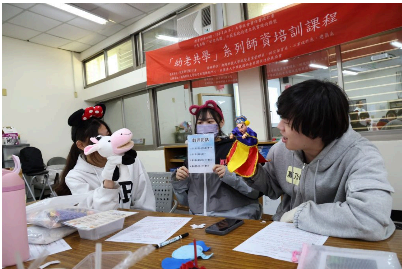
嘉藥「幼老共學中心」揭牌，師資培訓課程以乳牛手偶與傳統布袋戲偶進行「戲偶對話」的教案實作演練。