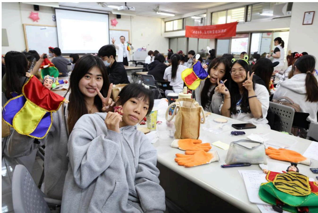
揭牌當日同步舉辦「幼老共學工作坊」，未來嘉藥幼保系教師都將成為「種子教師」，把幼老共學專業知能融入常規課程，培育具備跨世代照護能力專業人才。