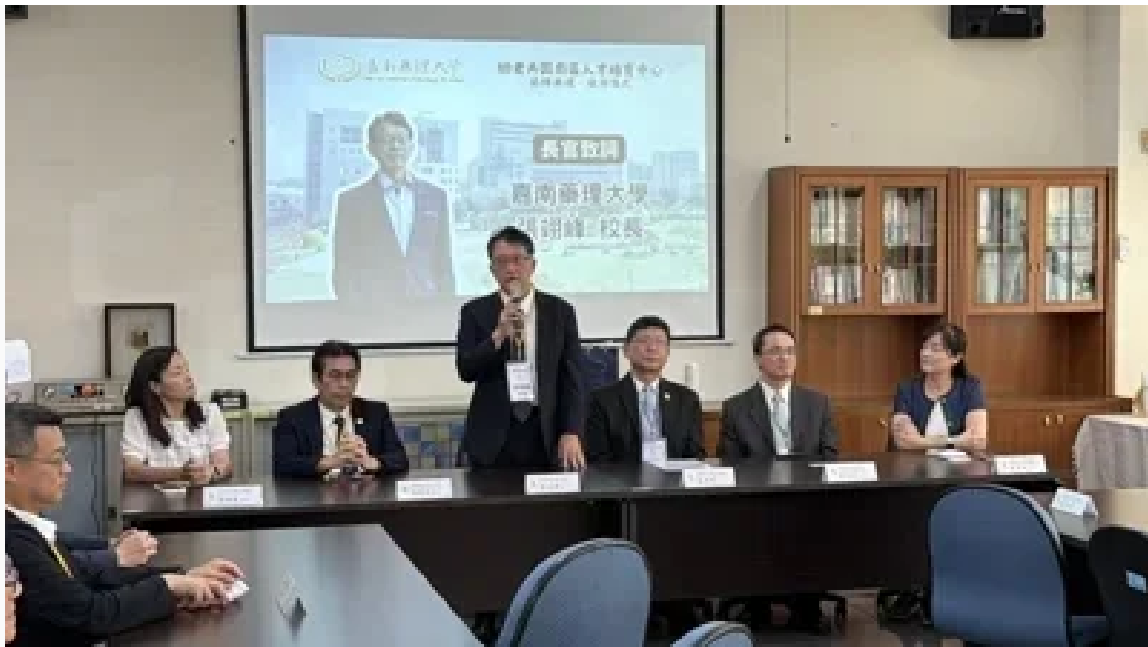
南部首座「幼老共學南區人才培育中心」今在嘉南藥大揭牌。