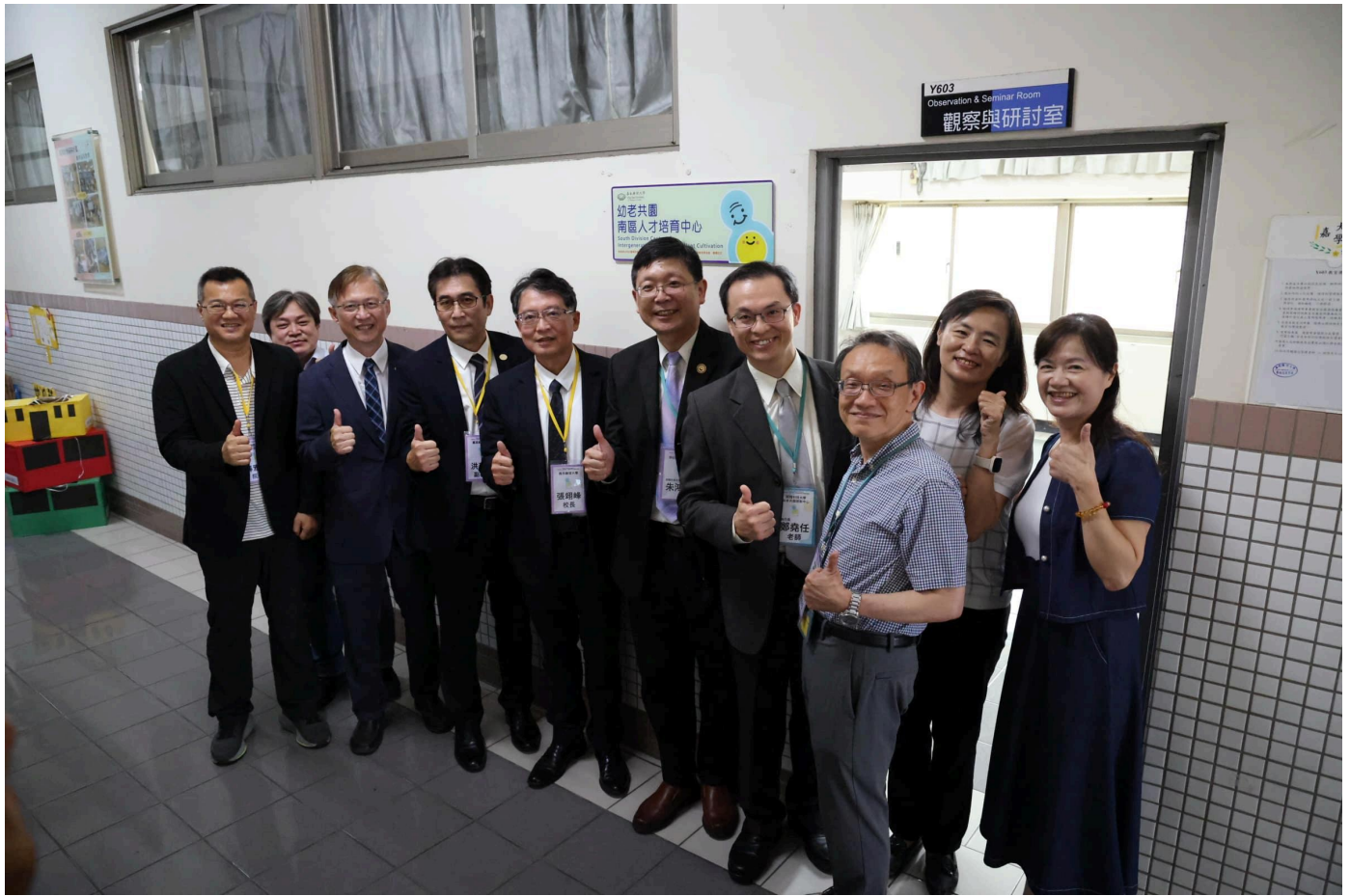
墨新聞 | 記者宋秉祥 / 台南報導