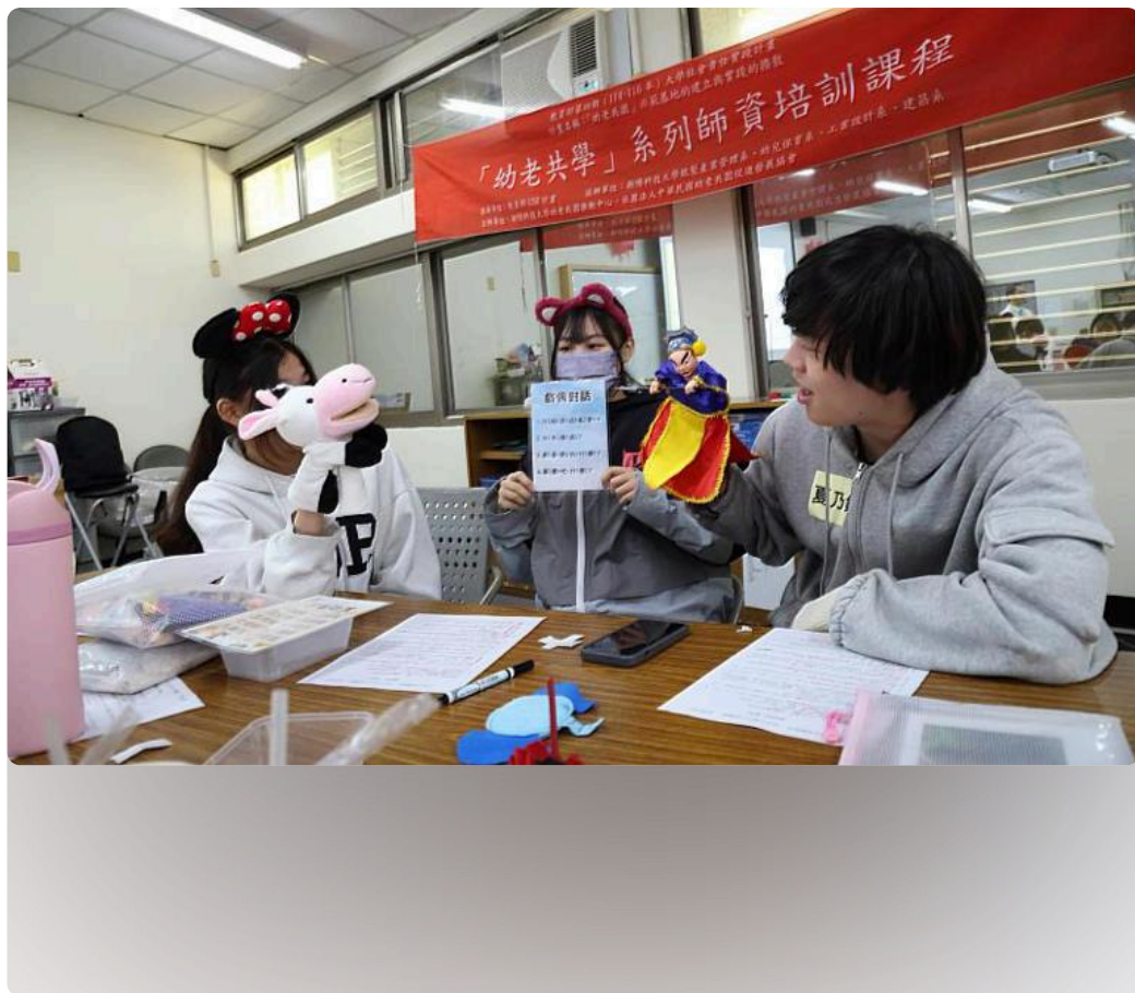
「幼老共學」師資培訓課程以乳牛手偶與傳統布袋戲偶進行「戲偶對話」的教案實作演練。