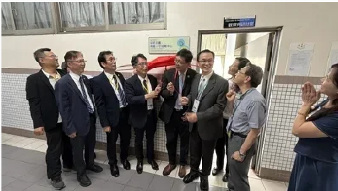
南部首座「幼老共學南區人才培育中心」今在嘉南藥大揭牌。