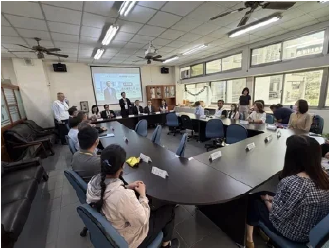
南部首座「幼老共學南區人才培育中心」今在嘉南藥大揭牌。