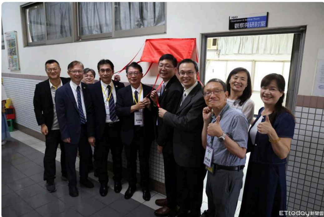
南部唯一！ 嘉藥「幼老共學南區人才培育中心」揭牌