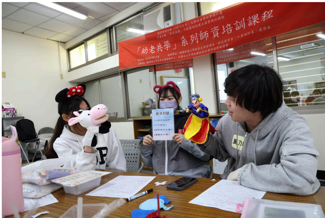
▲「幼老共學」師資培訓課程以乳牛手偶與傳統布袋戲偶進行「戲偶對話」的教案實作演練

「幼老共學」是一種打破世代隔閡的教育模式，不僅是場域的共享，更是心靈的連結。透過創新課程設計，讓活潑的幼童與智慧的長輩共處、共玩、共學。對長輩而言，透過與幼童互動能有效提升自尊感與社會參與度，重新找回「被需要」的生命價值；對幼兒來說，能在自然的互動中學習尊重長輩、培養同理心與耐受力，建立正確的生命觀與跨世代溝通能力。