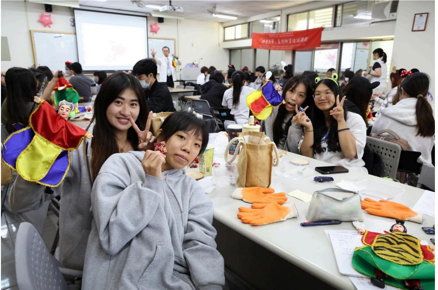
圖：幼老共學南區人才培育中心啟用，學子們體驗相關課程。

目前全台僅設有北、中、南、東四處「幼老共學人才培育中心」，而嘉藥是南部唯一獲選的高等教育機構。這不僅是對嘉藥長期耕耘健康永續創新服務領域的肯定，更代表校方在建構高齡化社會支援體系中扮演著關鍵角色。未來嘉藥幼保系教師都將成為「種子教師」，把幼老共學的專業知能融入常規課程，培育具備跨世代照護能力的專業人才。