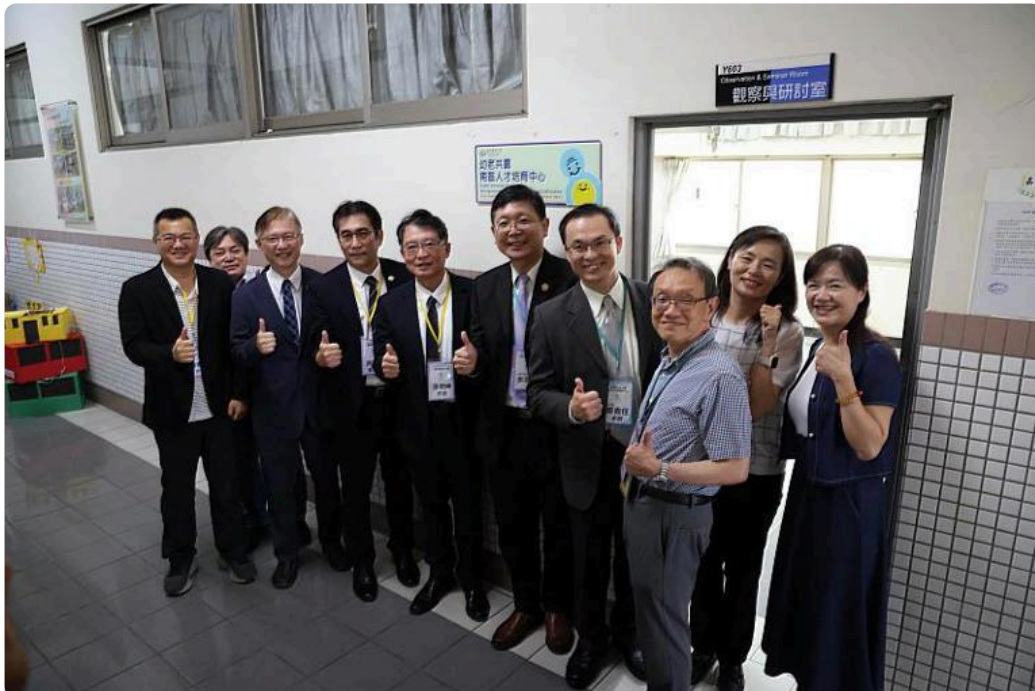
嘉藥是南部唯一「幼老共學南區人才培育中心」。

(中央社訊息服務20260519 15:36:19)面對超高齡社會與少子化雙重挑戰，教育轉型與社會共融已成為關鍵課題，嘉南藥理大學嬰幼兒保育系攜手教育部大學社會責任(USR)「幼老共學實踐計畫」團隊，成立南部唯一的「幼老共學南區人才培育中心」，並於19日在嘉藥幼保大樓舉行揭牌典禮，此中心的成立象徵著台灣代間教育發展邁入新里程。