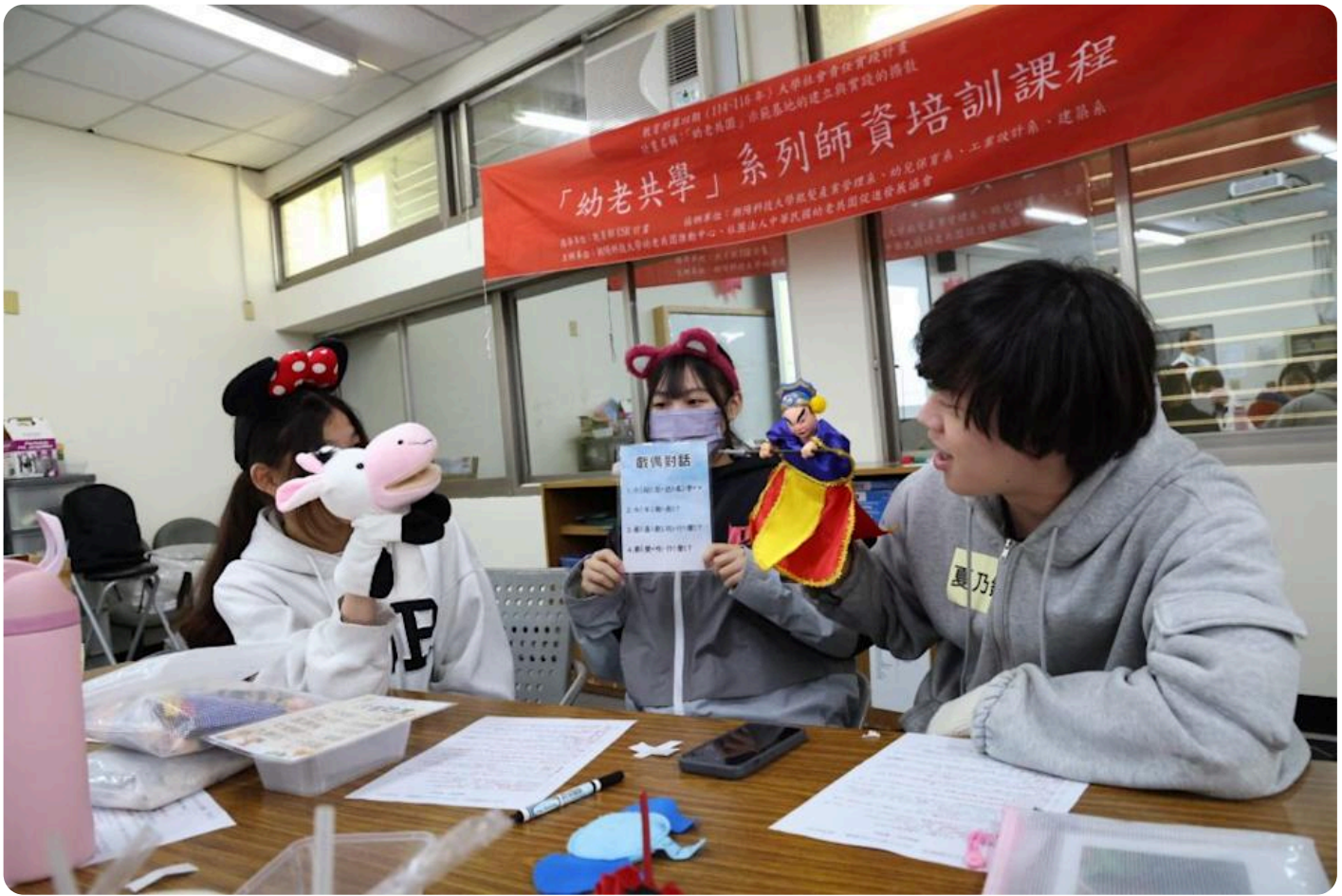
嘉藥「幼老共學中心」揭牌，師資培訓課程以乳牛手偶與傳統布袋戲偶進行「戲偶對話」的教案實作演練。