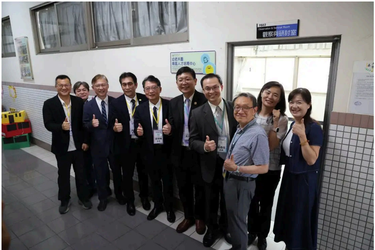
(圖說) 嘉藥是南部唯一「幼老共學南區人才培育中心」。