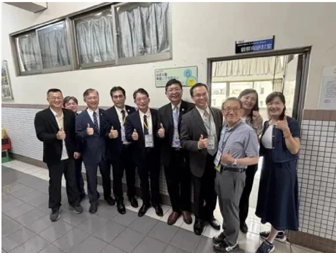
南部首座「幼老共學南區人才培育中心」今在嘉南藥大揭牌。