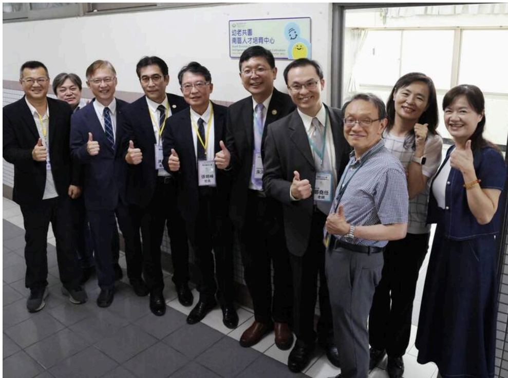
幼老共學南區人才培育中心設在嘉南藥理大學，正式揭牌。