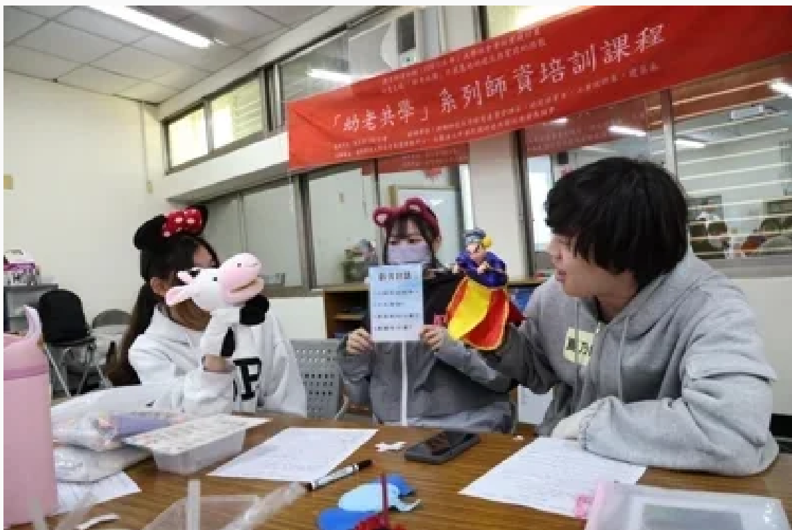
嘉藥大幼保系今天配合舉辦「幼老共學工作坊」，該系學生與幼保人員42人參與。圖／校方提供