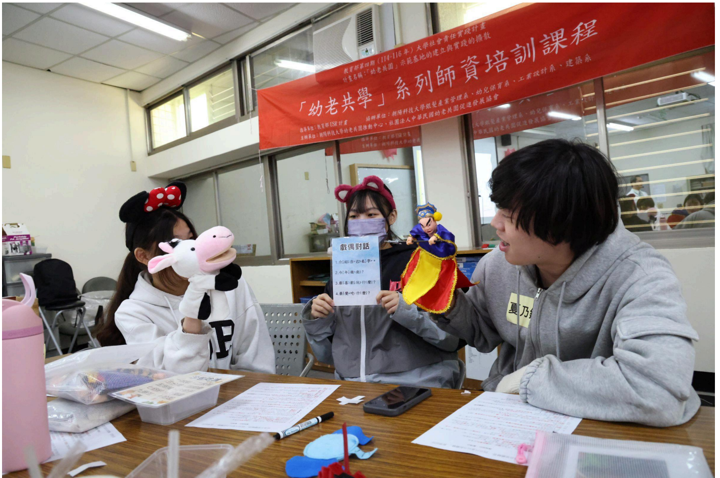
▲「幼老共學」師資培訓課程以乳牛手偶與傳統布袋戲偶進行「戲偶對話」的教案實作演練

「幼老共學」是一種打破世代隔閡的教育模式，不僅是場域的共享，更是心靈的連結。透過創新課程設計，讓活潑的幼童與智慧的長者共處、共玩、共學。對長輩而言，透過與幼童互動能有效提升自尊感與社會參與度，重新找回「被需要」的生命價值；對幼兒來說，能在自然的互動中學習尊重長輩、培養同理心與耐受力，建立正確的生命觀與跨世代溝通能力。