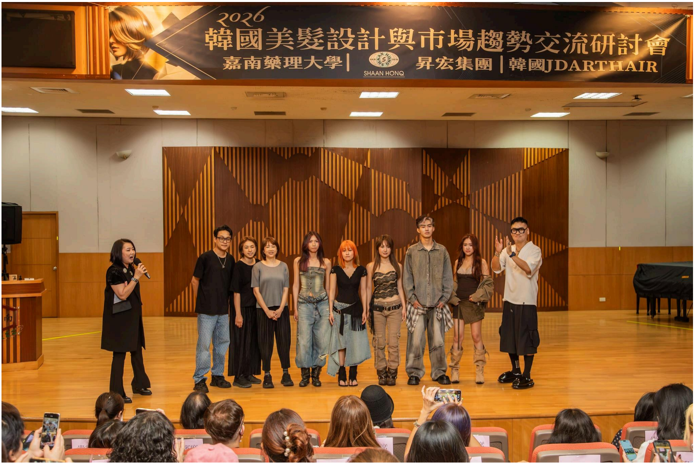
墨新聞 | 記者宋秉祥 / 台南報導