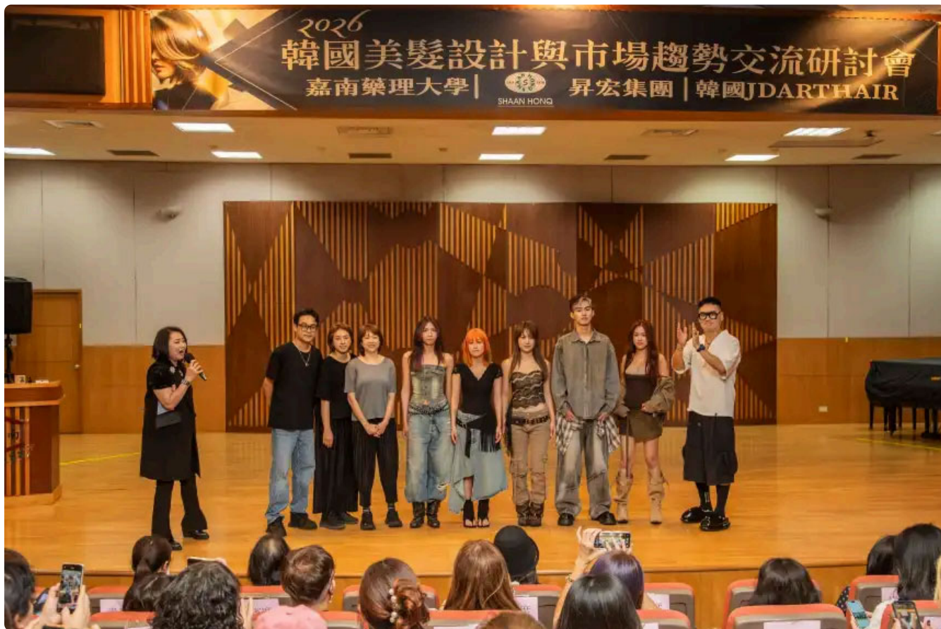
引領國際時尚！嘉藥粧品系辦韓國美髮趨勢研討會

韓國美粧與美髮時尚近年來席捲全球，已成為引領世界潮流的指標之一，嘉南藥理大學化粧品應用與管理系為讓校內師生與國際最前線接軌，於2日下午舉辦「韓國美髮設計與市場趨勢交流研討會」，邀請韓國知名品牌「JD ART HAIR」代表暨首席講師李在東，分享韓國最新髮型設計趨勢、美髮沙龍市場發展與產業實務經驗，吸引來自全台各地大專院校、技職及高中職專科學校超過200位時尚美容師生參與，現場交流氣氛熱烈。