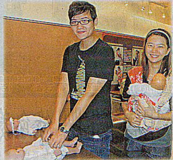
大學生體驗揹娃娃、替小嬰兒換尿布，感受父母照顧兒女的辛苦。

（記者劉婉君／仁德報導）「愛之禮讚首部曲——生命禮俗文物特展」昨起在嘉南藥理科大展出，內容涵蓋結婚、懷孕、出生至成年禮的禮俗。開幕典禮上學生舉行加冠、做十六歲儀式「轉大人」，體驗揹娃娃、換尿布等身為父母的辛勞。 嘉南藥理科大獲高雄市立歷史博物館出借六十四件文物，昨起至明年一月十五日，在校內嘉南文化藝術館舉辦「生命禮俗文物特展」，兩名學生穿著古裝、狀元帽，體驗加冠禮、成年禮，為活動揭開序幕。 展館分為四大主題，涵蓋婚嫁、祈子、懷孕、新生、抓週到成年禮的各種禮俗；互動區讓參觀民眾體驗古早味生活，不少大學生現場體驗早期婦女用傳統布巾揹娃娃、為小嬰兒換尿布的情形。學生們都說，「當爸媽真的很辛苦」。 高雄市立歷史博物館秘書黃錦綿表示，出借的文物數量是開館以來最多的一次，希望能讓台南地區民眾一飽眼福。校長許立人則希望透過展覽，能讓學生了解生命的可貴，尊重且珍惜生命。展覽開放時間為每週一至週五，上午九時至晚上九時，洽詢電話：2669760。