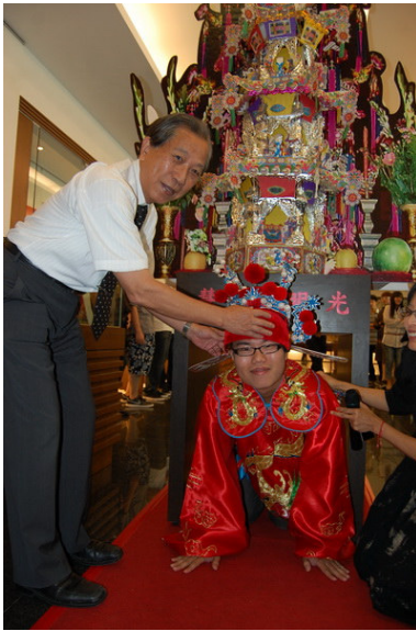
▲許校長迎接學生鑽七娘媽亭，並為戴上古代的狀元帽。