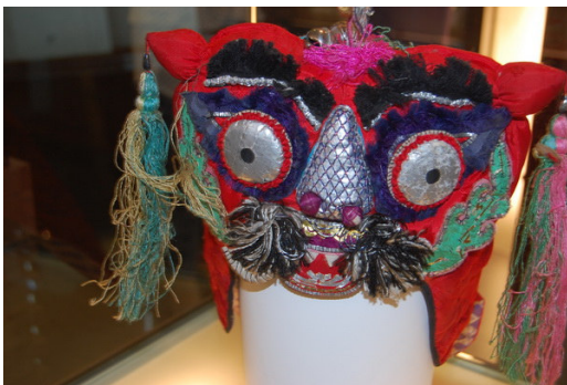
▲難得一見的虎頭鳳帽。