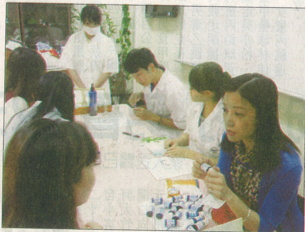
↑嘉藥首創正規芳療教育課程。

質參差不齊，正規芳療教育已普遍受到各界肯定，目前國內已有十餘所大專院校休閒或美容相關科系與該會依「嘉藥經驗」模式進行合作，將芳療教育融入正規課程中。在場的芳療業者肯定理論和技術結合，可和客戶分享並提供更好服務。