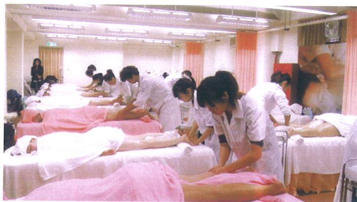
「芳香療法實務應用班」上課實作情形