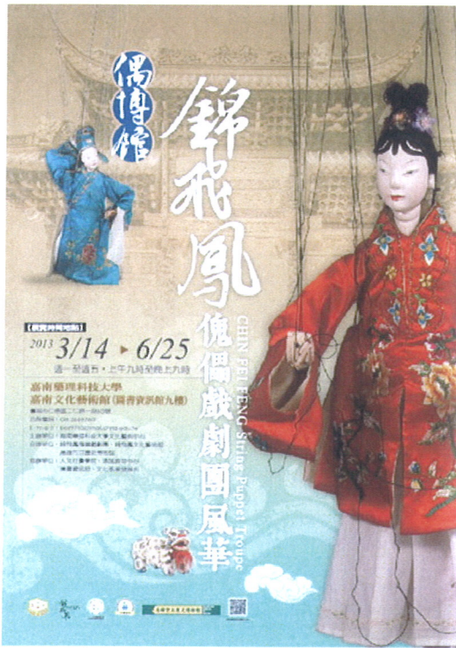
偶博館—錦飛鳳傀儡戲劇團風華海報