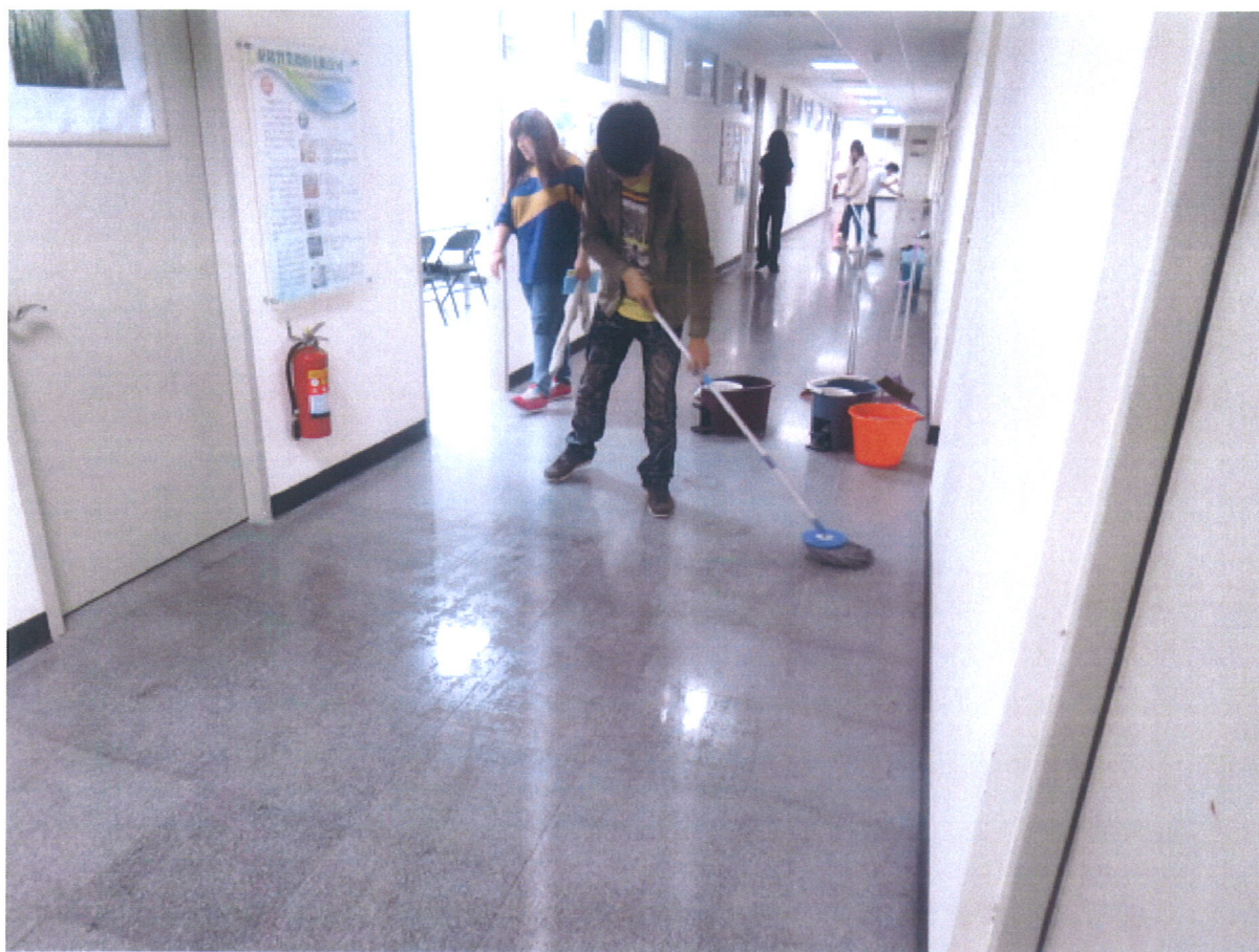
▲ 嘉藥育成志工展現青年熱情協助進駐企業年節掃除