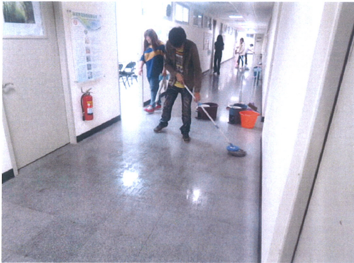
嘉藥育成志工展現青年熱情協助進駐企業年節掃除