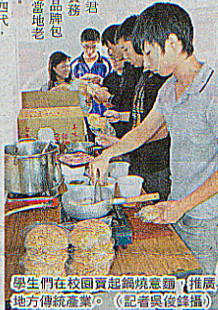
學生們在校園賣起鍋燒意麵，推廣地方傳統產業。

味，令人垂涎，同學還創造話題，與顧客互動，包含鍋燒意麵的起源、麵條炸過的用意，以及麵身為何是圓的等，成功炒熱買氣。