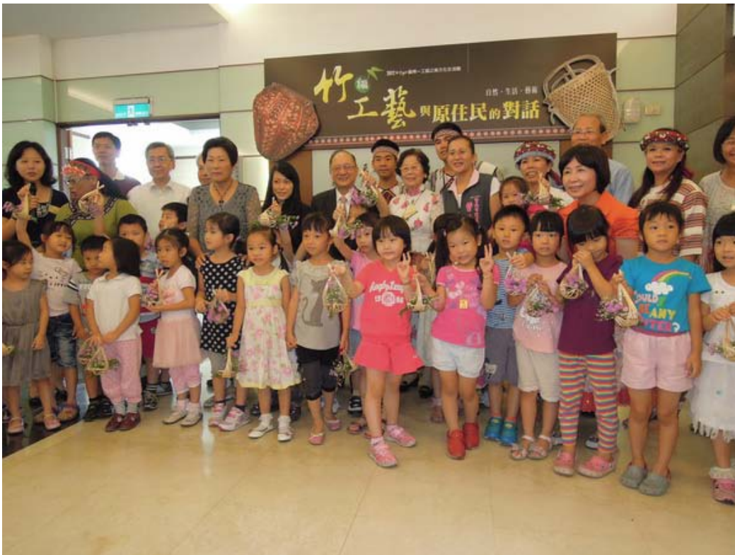
▲ 與會貴賓與小朋友合影。