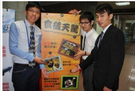
第二名『食破天驚』獲獎同學們合影