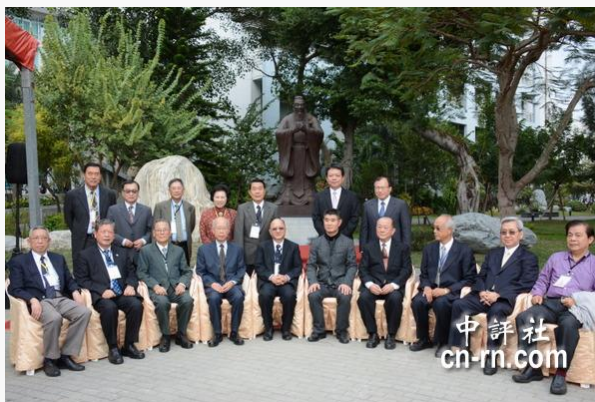
兩岸學者在嘉南藥理科技大學的孔子行教銅像前合影。