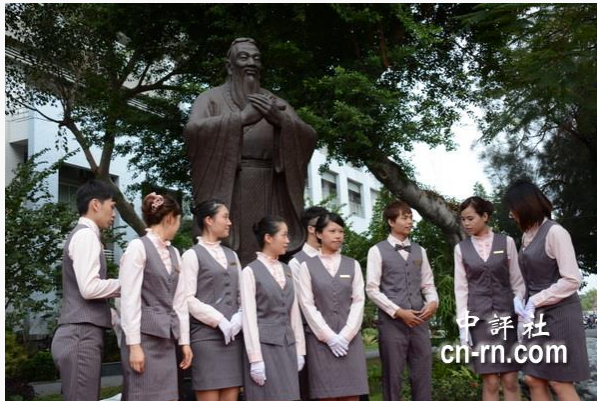
嘉南藥理科技大學禮儀小組的帥哥、美女在校園新立孔子銅像前準備合影。

中評社台南11月12日電（記者 趙家麟）中國孔子基金會副理事長、山東京博控股公司董事長馬韻升捐贈“至聖先師孔子行教像”給台南的嘉南藥理科技大學，12日下午在校園內舉行揭幕典禮。馬韻升表示，孔子是中華民族至聖先師，未來還捐贈孔子像到台灣的大學校園。