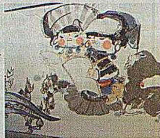
謝申的娃娃畫活潑生動，形態各異，深受喜愛。

王海頌生於上海，作品曾多次在全國及上海展出並獲獎。黃子曦福建福州人，擅長中國畫、舞台美術。