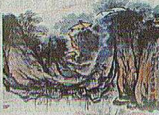
嘉南科大5日起推出「筆墨行吟」—水墨意象展。