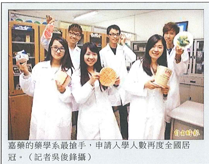
嘉藥的藥學系最搶手，申請入學人數再度全國居冠。

技專校院招生委員會聯合會昨天公布一○四學年度申請入學狀況，嘉藥的藥學系再次名列全國榜首，保健營養系今年也不錯，吸引一千四百七十人報名，都很熱門。