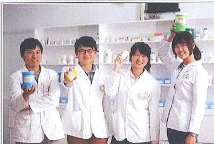
嘉藥藥學系學生於實習藥局體驗職場環境