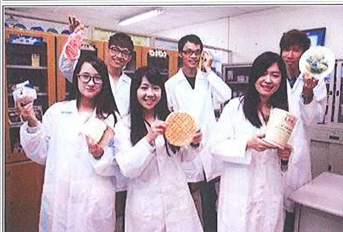
保營系營養諮詢課程讓學生對食物更加認識