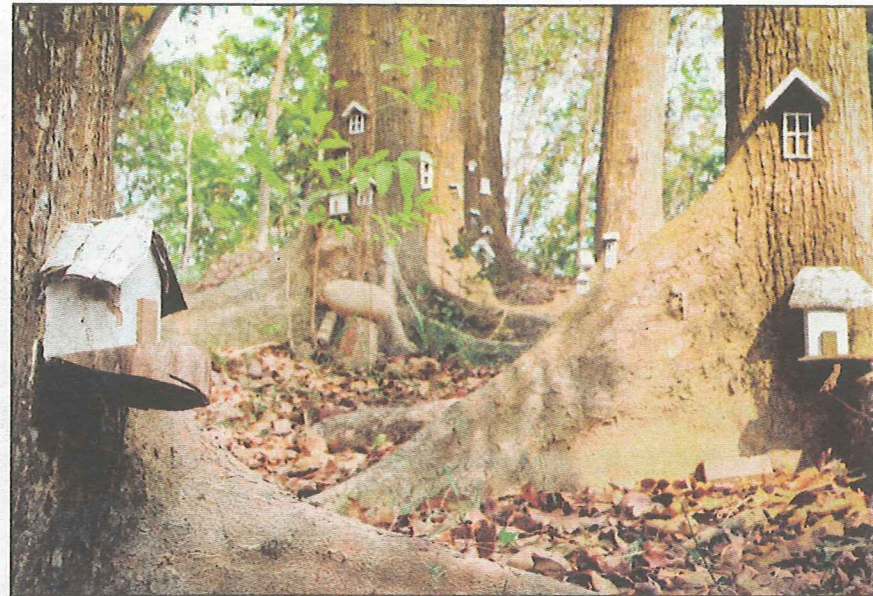
▲新化國家植物園內神秘小木屋。

此次賞螢活動內容含夜間生態體驗、DIY手製燈籠、賞螢餐等，並於當天日落前在新化國家植物園休閒會館廣場集合出發，由嘉藥休閒系學生帶領大家探索森林賞螢之旅，民衆不僅可沈浸在自然的芬多精，新化國家植物園也提供世外桃源般的美景讓民衆盡情享受美