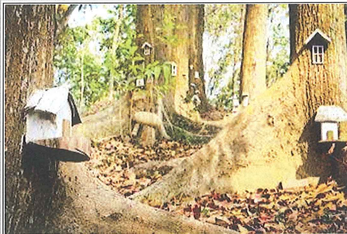
新化國家植物園內的神秘小樹屋