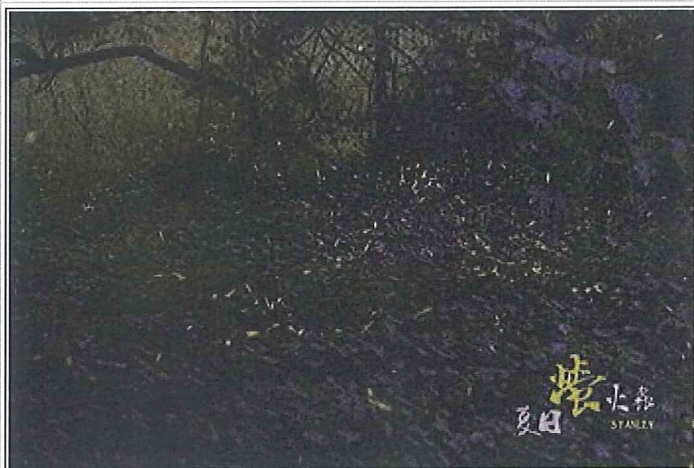
新化國家植物園的夏日螢火蟲即將炫麗登場