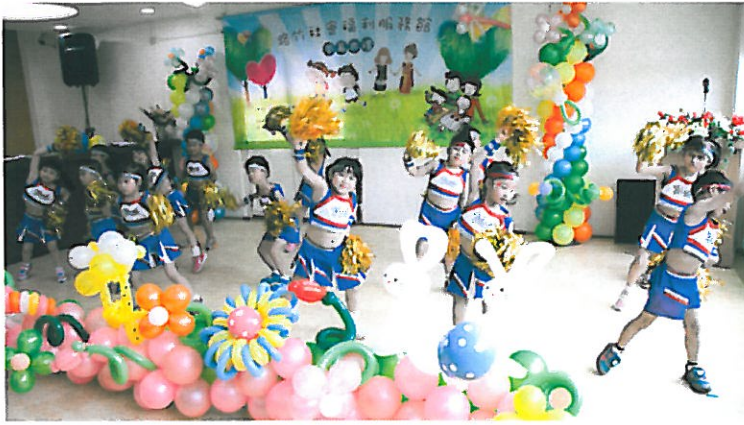
小朋友賣力表演為活動揭開序幕