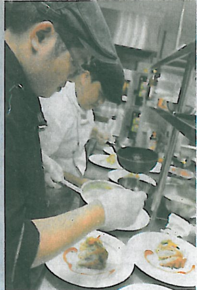
環球科技大學廚藝系學生在校園湖畔經營T.C餐館，由學生親自料理。