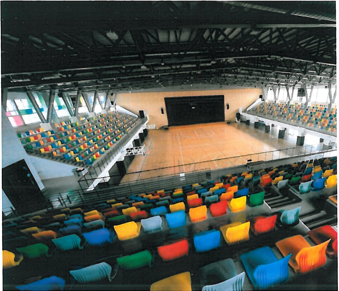
嘉藥紹宗體育館內部。