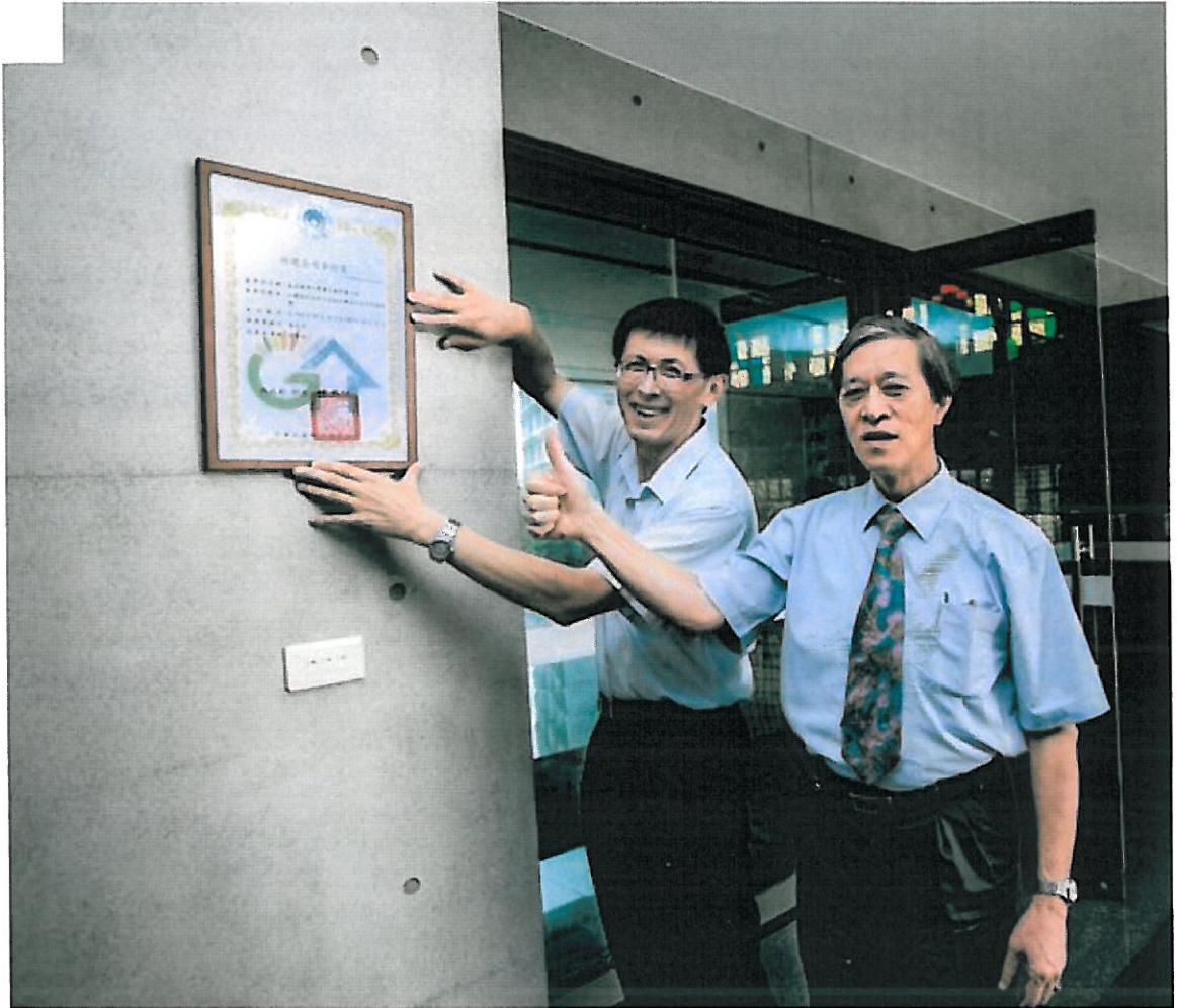
嘉藥紹宗體育館榮獲黃金級綠建築標章。