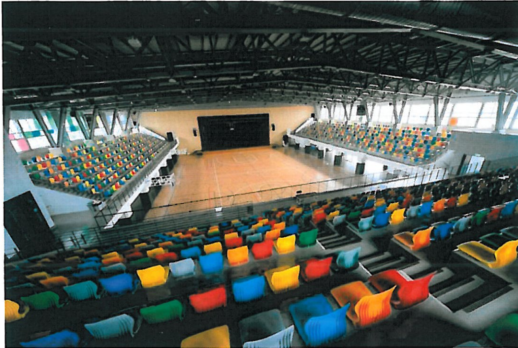
嘉南藥理大學紹宗體育館內部。