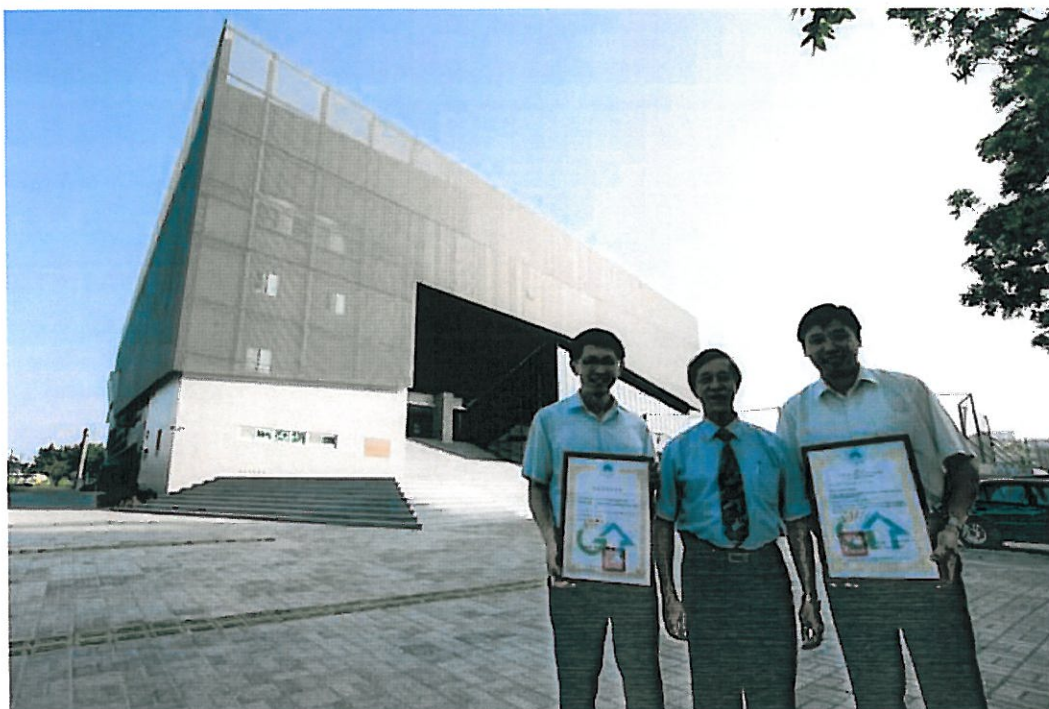
嘉藥紹宗體育館建築優美，也融入綠建築概念，獲得黃金綠建築