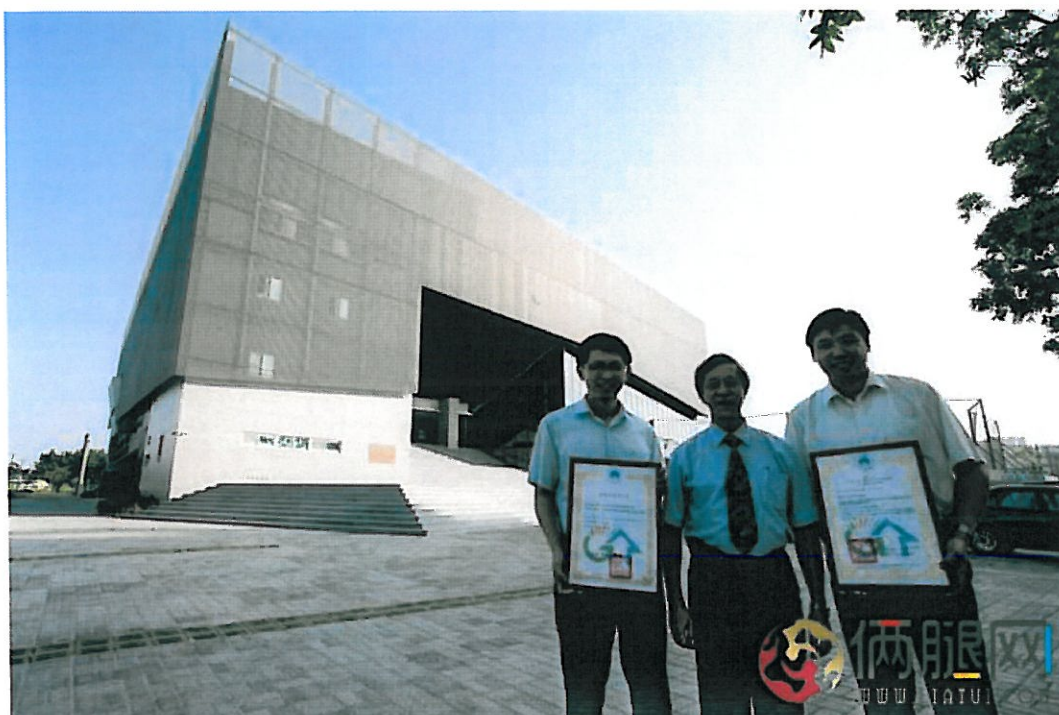
嘉药绍宗体育馆建筑优美，也融入绿建筑概念，获得黄金绿建筑标章。

嘉南药理大学去年刚落成启用一座4层楼高的「绍宗体育馆」，外型美观且兼具多功能用途，日前申请内政部绿建筑标章，列名为黄金级，成为全国第一所体育馆取得黄金级绿建筑标章的大学。