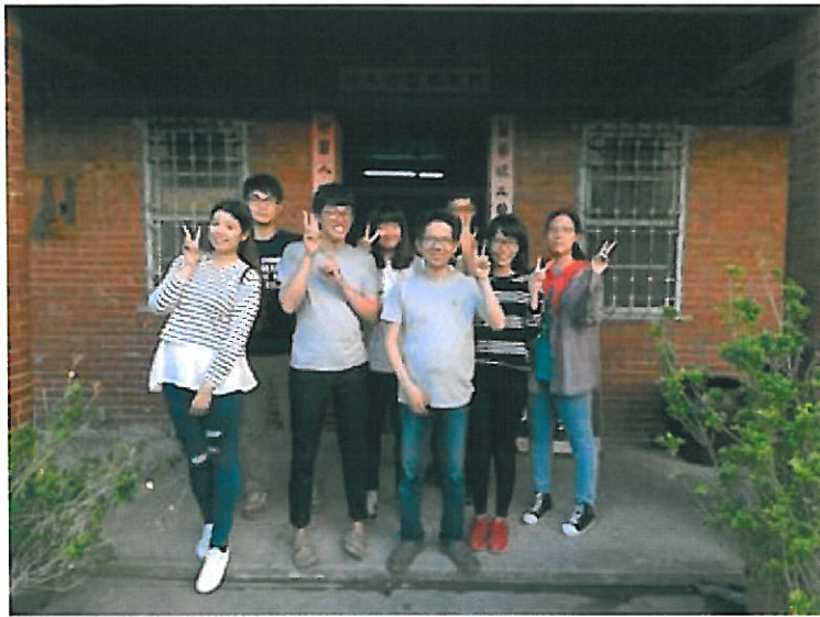
策展團隊與藝術家合照