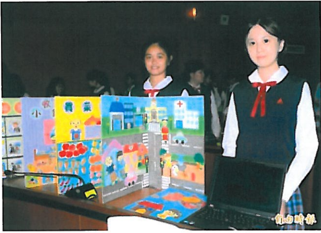
學子們除了實體教玩具之外，還結合電腦設計，讓遊戲可以帶著走。（記者吳俊鋒攝）

自由時報 版權所有 不得轉載 © 2015 The Liberty Times. All Rights Reserved.