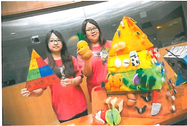
大專組第一名-南臺科大-營養金字塔大探索