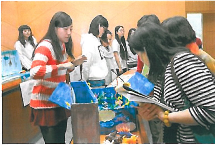
參加學員對評審委員說明作品製作概念

「教育性」的玩具，並且透過競賽相互觀摩交流與主題研習，以提升學生的實務專題能力。嘉藥舉辦教玩具競賽今年已邁入第七屆，高中職組計有58件作品參賽，大專組則有44件，共計超過300人同台競賽，共襄盛舉。最後，大會將各取高中職組及大專組前三名以及佳作數名，各獎項均頒發獎金