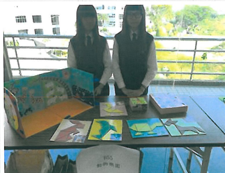
高中職第一名-嘉義家職「動物樂園」