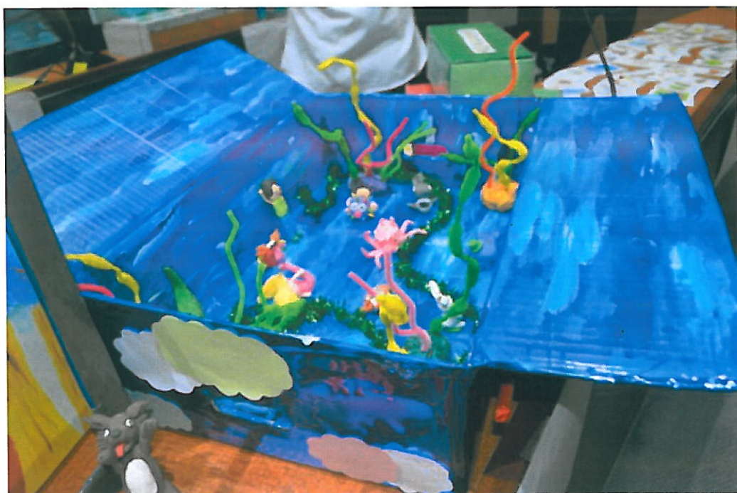
圖2：嘉南藥理大學的「天馬行空」，拿下第二名。