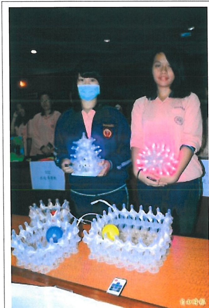
學子們回收奶嘴，結合LED燈設計教玩具，環保又有創意。

〔記者吳俊鋒／台南報導〕2015全國兒童教玩具競賽今天上午在嘉南藥理大學登場，上百支大專院校、高中職等相關科系的學生隊伍參加，競爭激烈，有的結合電腦、平板，讓遊戲可以「帶著走」，也有資源回收，運用奶嘴加LED燈飾，幫助小朋友探索學習，創意令人矚目。