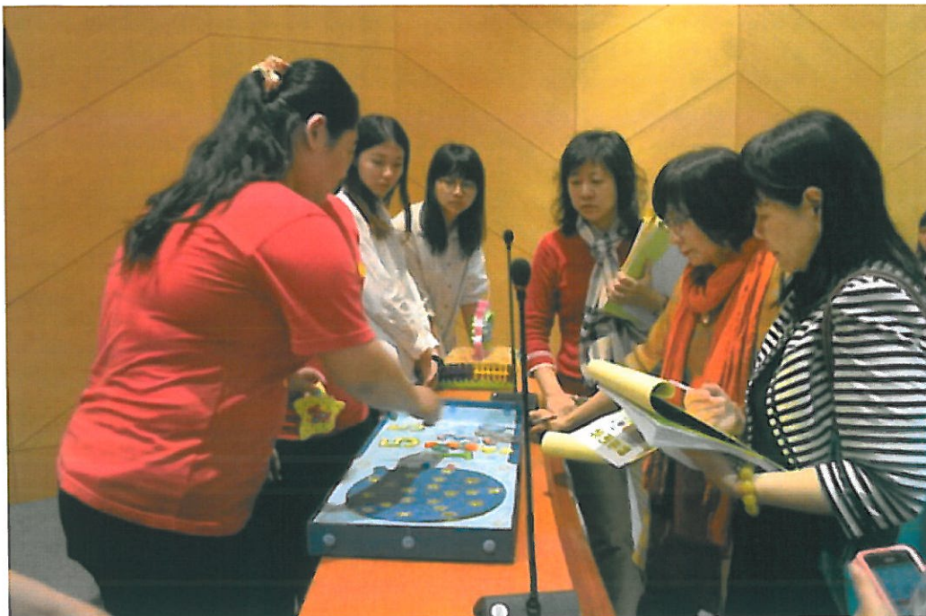
圖3：評審老師評審情形。工欲善其事，必先利其器；讓孩子在遊戲中學習！對一個從事嬰幼兒保育與教育工作的人來說，優良的教玩具就具有巨大的魔力，老師與小朋友兩皆受益。

由嘉南藥理大學嬰幼兒保育系主辦的2015全國兒童教玩具競賽暨應用研習活動，25日於該校國際會議廳登場，遠自宜蘭、臺北，設有嬰幼兒保育科系的學校共近百支隊伍參賽。經過嚴謹評選，大專組前三名依序是南臺科技大學、嘉南藥理大學、弘光科技大學；高中職組則由國立嘉義家職奪冠，屏榮高中亞軍，樹德家商第三。