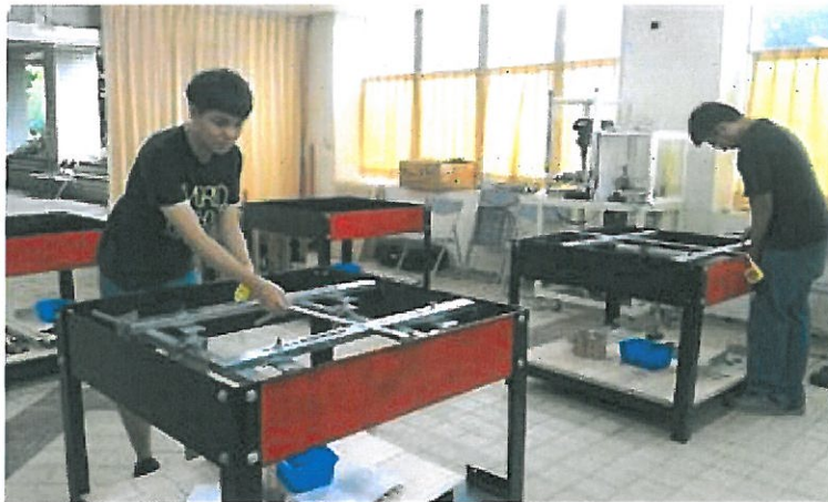
升降機裝修定芯桌實作場景