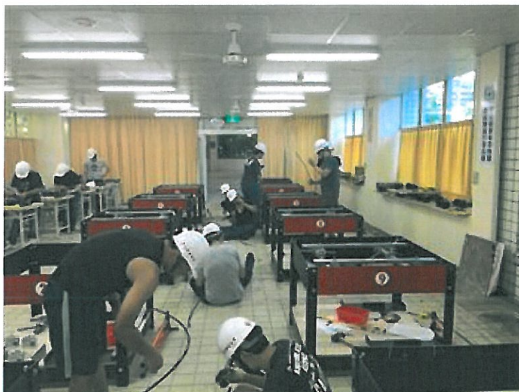
嘉藥擁有完善的升降機裝修實作場所