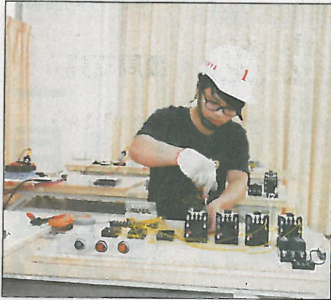
↑學生試用升降機裝修技能檢定術科場地，認為未來可就近考照很方便。