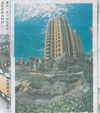
第一名以精緻建設在小港的建築「福慈鐵品」外觀為主體，不論在構圖及色彩掌握上，獲評審一致好評，獨得10萬元。