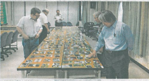
五位評審仔細的挑選構圖及色彩完美的作品。

獎現場領取分組組別，再依規定到指定的公共建設及建築攝影，晚上7點半繳件，對攝影者的體力是一大考驗。