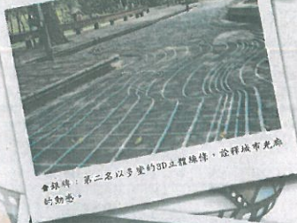
會銀牌：第二名以多變的3D立體線條，詮釋城市光線的動感。