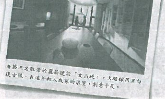
會銅牌：第三名取景於星島建設「文山莊」，大膽採用黑白鏡古風，表達年輕人成長的浪漫，創意十足。