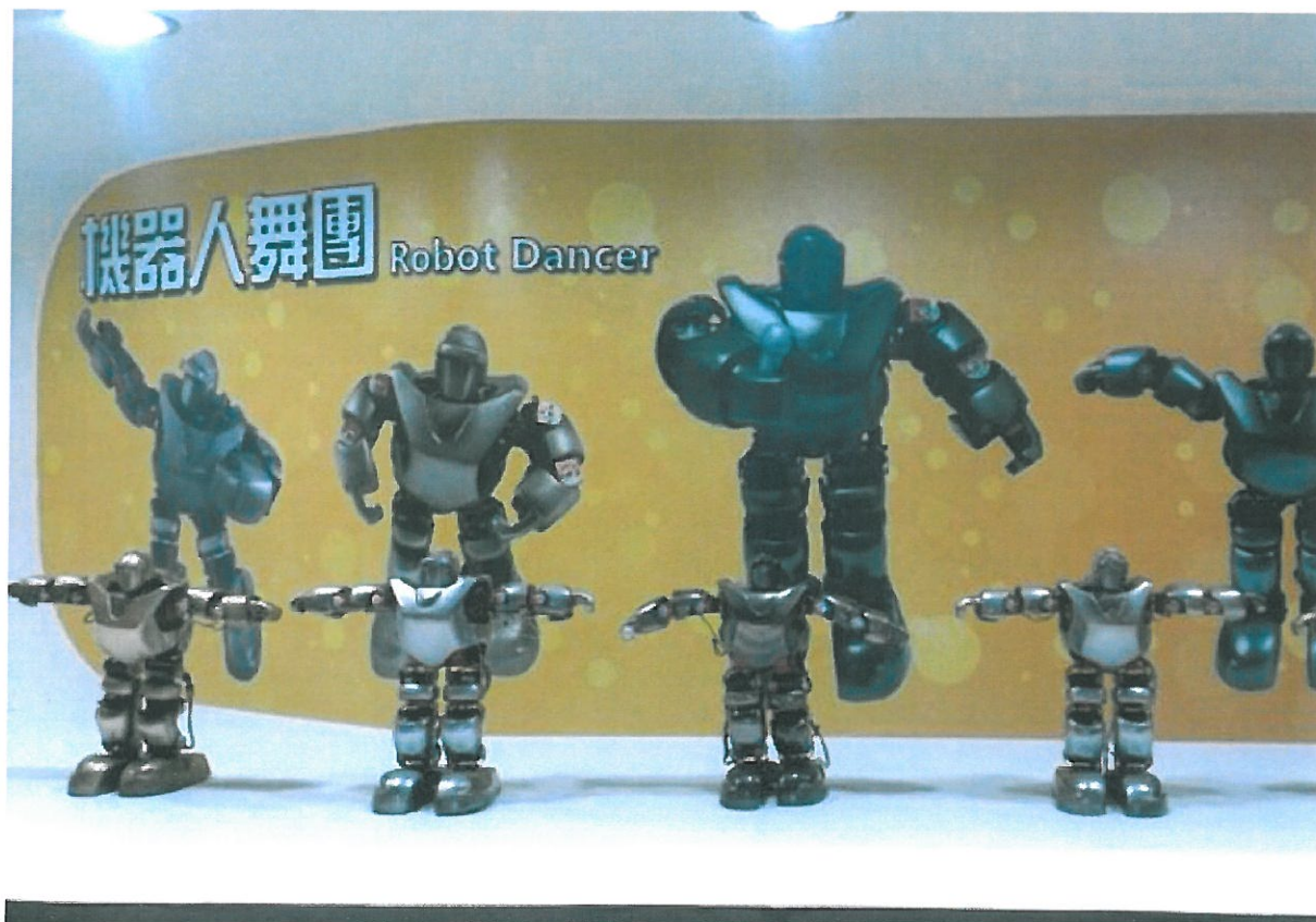
嘉藥機器人舞團入圍金點新秀特別獎。