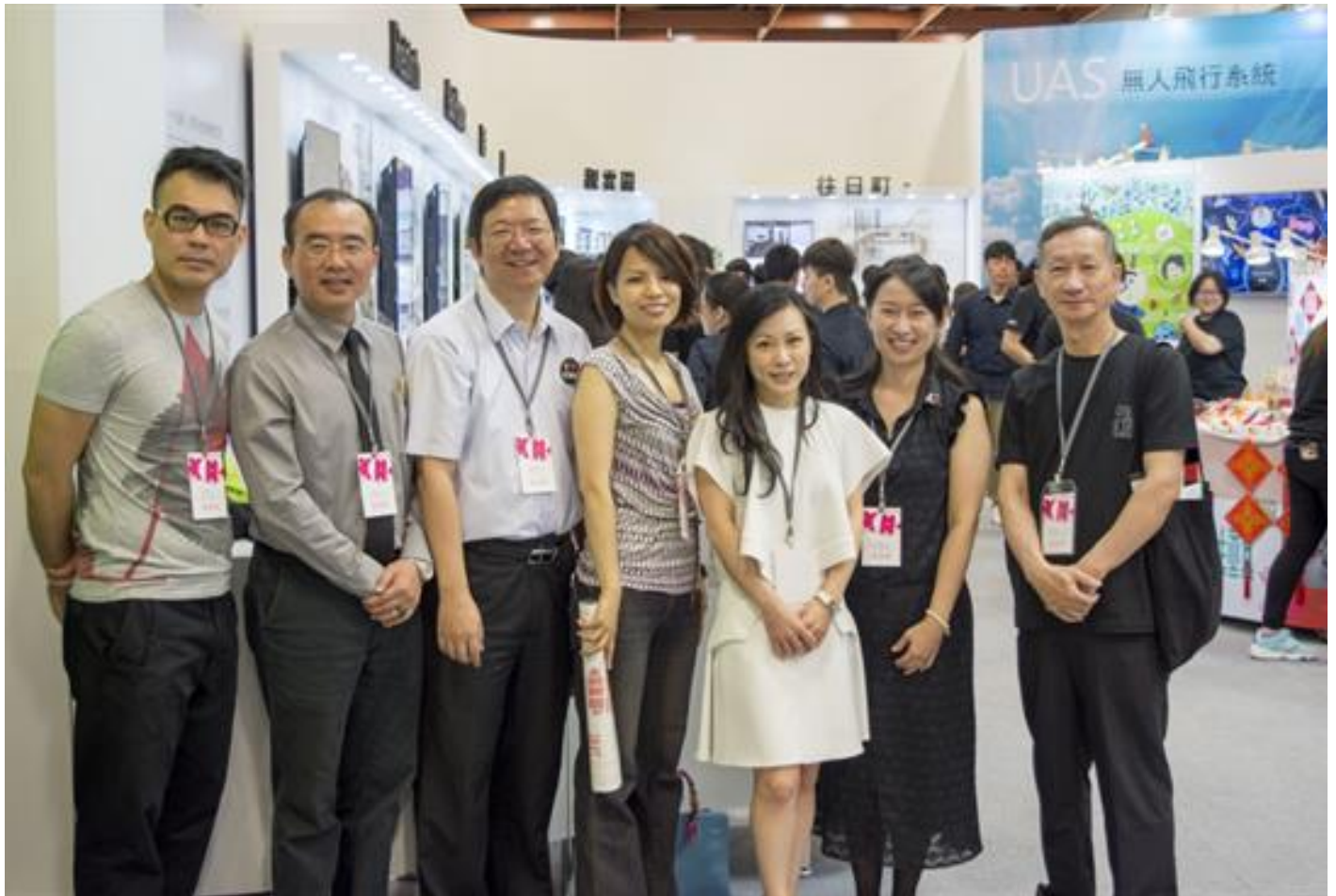
嘉藥參展新一代設計—機器人舞團與健康療癒建築搶盡鋒頭

(中央社訊息服務20160513 16:48:32)設計界年度大專學生重要盛會的「2016新一代設計展」，於今起至16日在台北世貿中心舉行。創校滿50年的台南嘉南藥理大學，雖非屬設計領域的專門學校，但第二年參加此設計盛會，就有兩項作品獲得評審人員的肯定與讚許，入圍「金點新秀贊助特別獎」，分別是產品設計類的「機器人舞者」，以及空間設計類的「往日町」，其他作品也吸引眾人目光，充分展現嘉藥學生亮麗的學習成果。