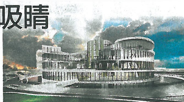
嘉南藥理大學參展的六項空間設計案之一旋影-圖書館。

該校系主任周玉端表示，此次的展演完整呈現學生在校所學的實務能力，包括：虛擬與3D模型設計製作技術、無人飛行系統基地航拍