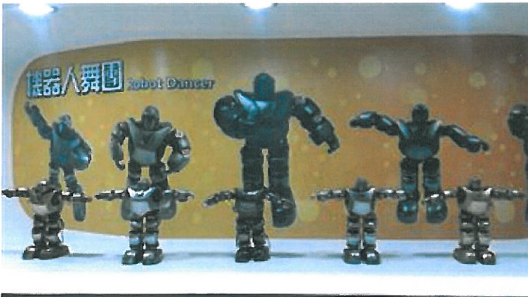
嘉藥「機器人舞團」入圍金點新秀特別獎