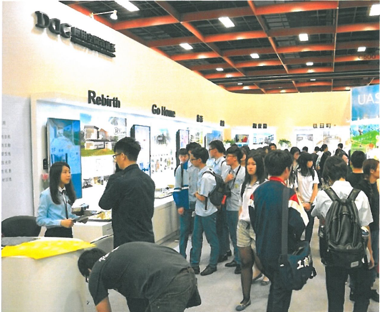
嘉藥創意作品吸引人潮參觀。