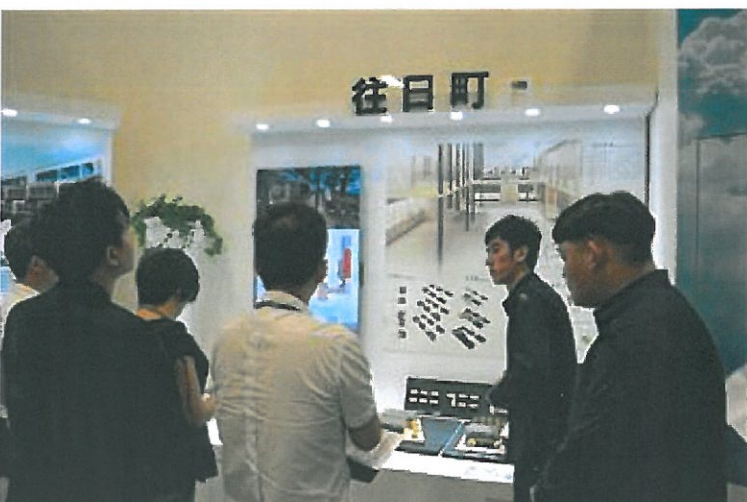
嘉藥「往日叮」入圍金點新秀特別獎