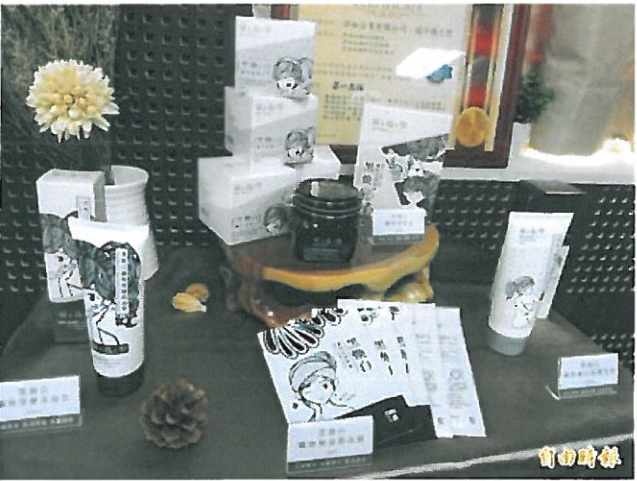
台南溫泉商品今天首發上市。(記者洪瑞琴攝)。