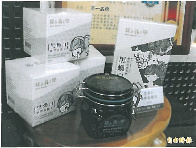
台南溫泉商品今天首發上市。