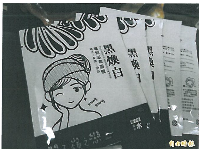
台南溫泉商品今天首發上市。

市府邀集嘉南藥理大學溫泉研究中心與業者共同建立平台，形塑關仔嶺溫泉旅遊在地品牌，由市府統籌供應溫泉及「台南溫泉」品牌授權，提供業者高值利用研發系列產品。