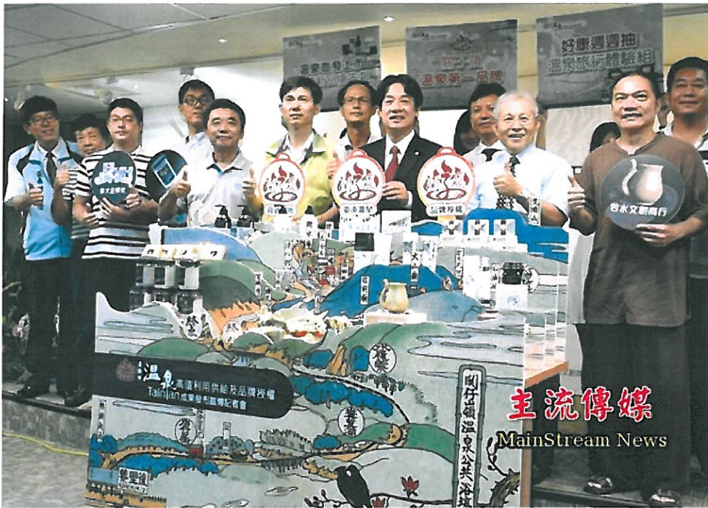
市長賴清德表示關子嶺溫泉歷史、泉質、認證都第一。

面膜及乳液等溫泉妝品，以上產品將於關子嶺統茂溫泉會館、新紅葉山莊與景大溫泉會館等溫泉旅館販售，也可透過網路行動商城購買。