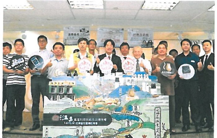
溫泉高值利用供給及品牌商標授權」成果發表會於昨天舉辦，由台南市長賴清德親自主持。

台南市長賴清德表示，觀光樂園是市府四大城市發展目標之一，有許多方向需要努力，最重要的是要善用台南市的資源和特色，才能事半功倍，以關子嶺溫泉為例，即是大力行銷關子嶺溫泉，關子嶺溫泉擁有三個全台第一，首先，它是台灣第一個溫泉，歷史最悠久；其次，它是台灣第一個泥漿溫泉，獨一無二，與西西里島、鹿兒島並列世界三大泥漿溫泉；最後，它是全台品質第一的溫泉。