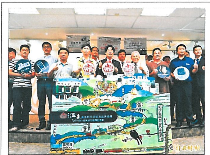
台南市長賴清德與研發業者聯合宣傳「台南溫泉」產品。

〔記者洪瑞琴／台南報導〕台南市首創全台，第一個官方授權「台南溫泉」產品昨天發表，市長賴清德成了最佳代言人，宣傳推薦「正港」關子嶺溫泉泥製成的面膜美妝品，還不忘邊講邊PO敷臉動作，「明星」架式十足，業者私下打趣說，省下找廣告模特兒的預算！