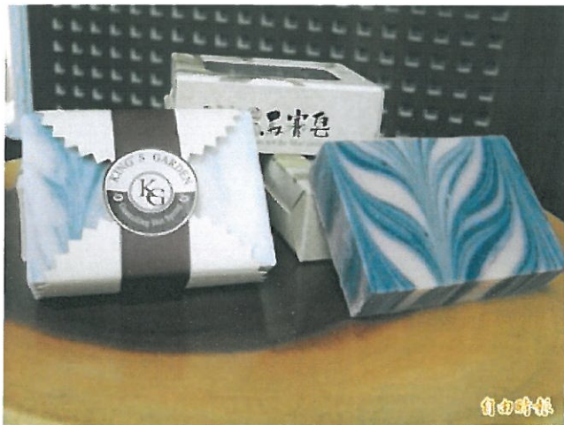
台南「關子嶺」溫泉商品。