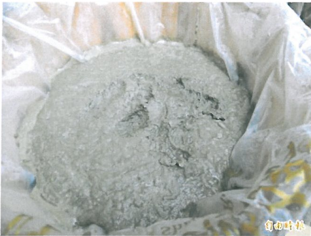
「關子嶺」溫泉商標產品，保證百分百純化原料。