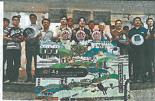
台南市長賴清德與研發業者聯合宣傳「台南溫泉」產品。