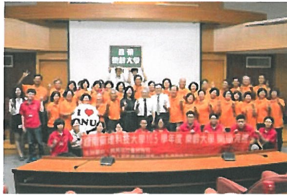
嘉藥樂齡大學舉辦熱鬧開學典禮。

【記者孫紹逸／南市報導】嘉南藥理大學於17日上午9：30，在該校國際會議廳3樓舉行105學年度「樂齡大學」開學典禮。現場邀請樂齡大學學員及該校老人服務事業管理系學生，一起為開學典禮帶來一連串充滿活力的精采表演，內容包含「爺奶響叮噹」、「竹味活蹦蹦亂跳」、「舞動吧！