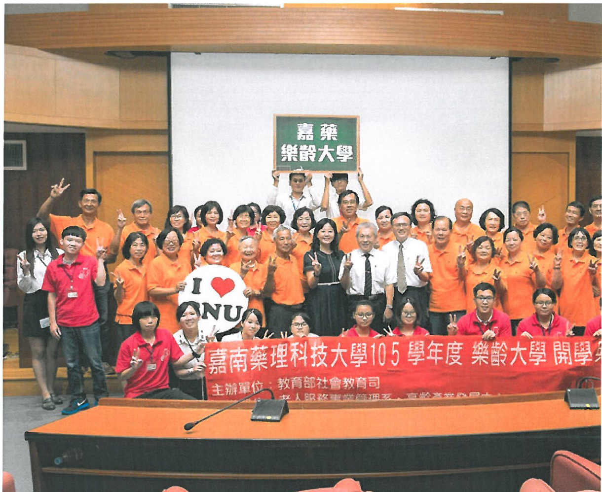
嘉藥樂齡大學舉辦熱鬧開學典禮。

例如上班前可將小孩子送至幼兒園，而年長父母則同時可參加樂齡大學，讓上班族的夫妻在無後顧之憂情況下，安心工作且方便接送；嘉藥的樂齡大學強調動靜交替、代間互動的多元課程，在進行過程中特別重視高齡者學員與年輕世代學生之間的互動學習，讓許久不曾走進校園的長者能以最舒服、最輕鬆的方式融入學校生活，進而在享受大學優質環境中汲取新知，樂於學習、勇於挑戰。