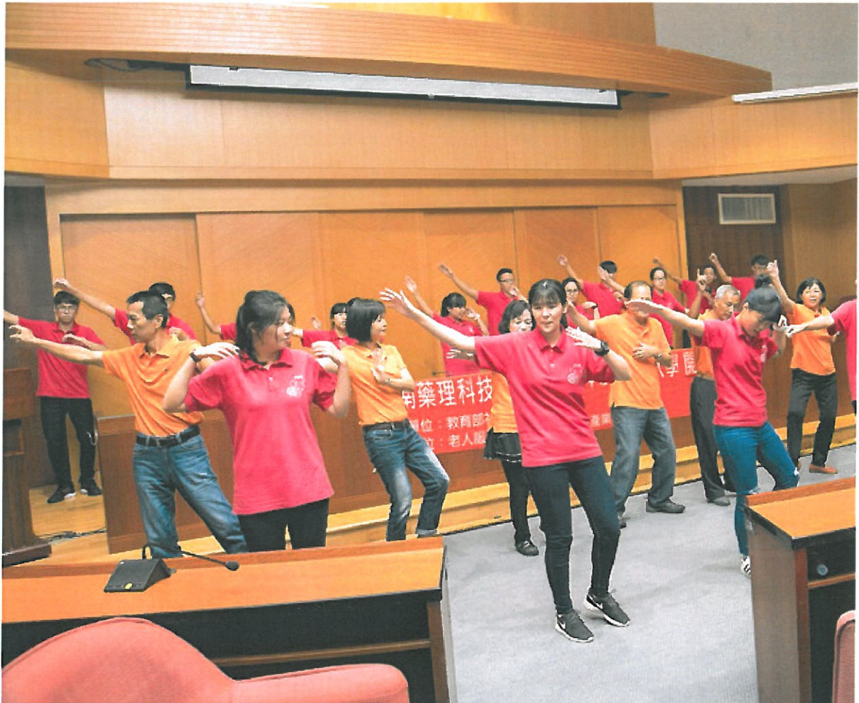
開學典禮在長輩們的熱舞下揭開序幕。