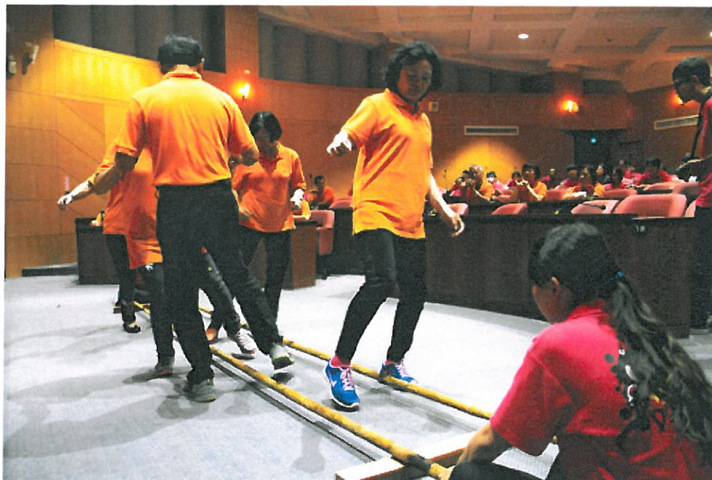
↑嘉藥樂齡大學學員以輕快的腳步跳著竹竿舞，動作俐落。

嘉南藥理大學樂齡大學昨天舉行開學典禮，卅名「老同學」共聚一堂，在學校老人服務事業管理系學生帶領下一起表演充滿活力的表演，熱鬧迎接長者們一起展開嶄新活躍的學習之旅。