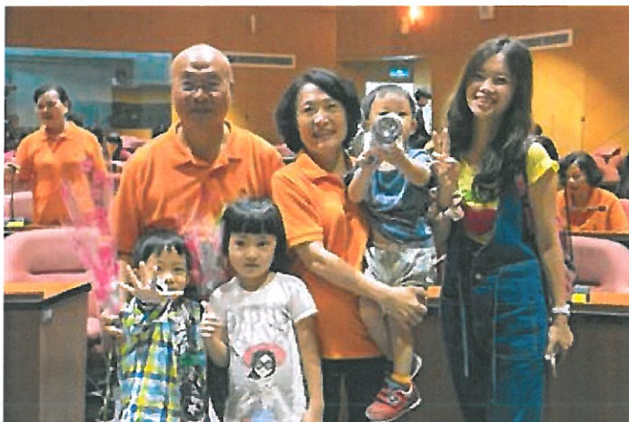
祖孫同念嘉藥大學