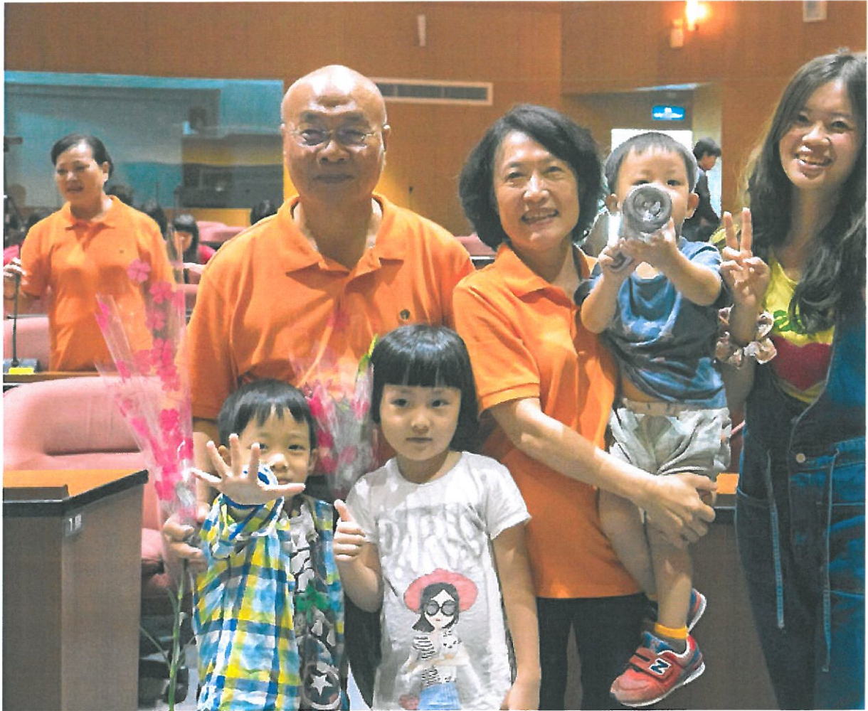
祖孫同念嘉南藥理大學。