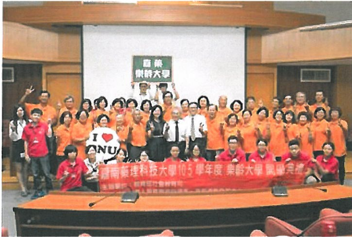
嘉藥樂齡大學舉辦熱鬧開學典禮