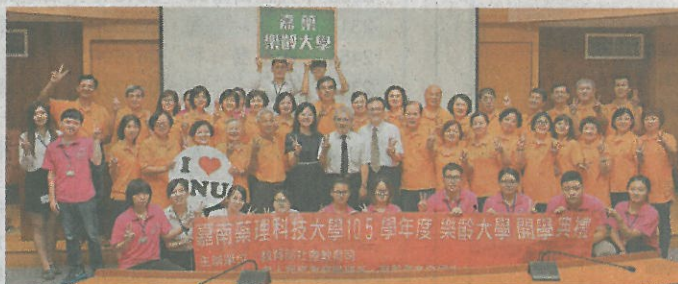
嘉藥樂齡大學舉辦開學典禮。