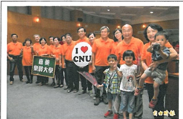
嘉藥樂齡大學開學，7對夫婦學習路上「愛相隨」。

〔記者吳俊鋒／台南報導〕在教育部的補助下，嘉南藥理大學連續第9年開辦樂齡大學，105學年度的開學典禮今天登場，這1期共30位長輩參加，其中有7對夫婦，當起同窗好友，學習路上愛相隨，令人稱羨。