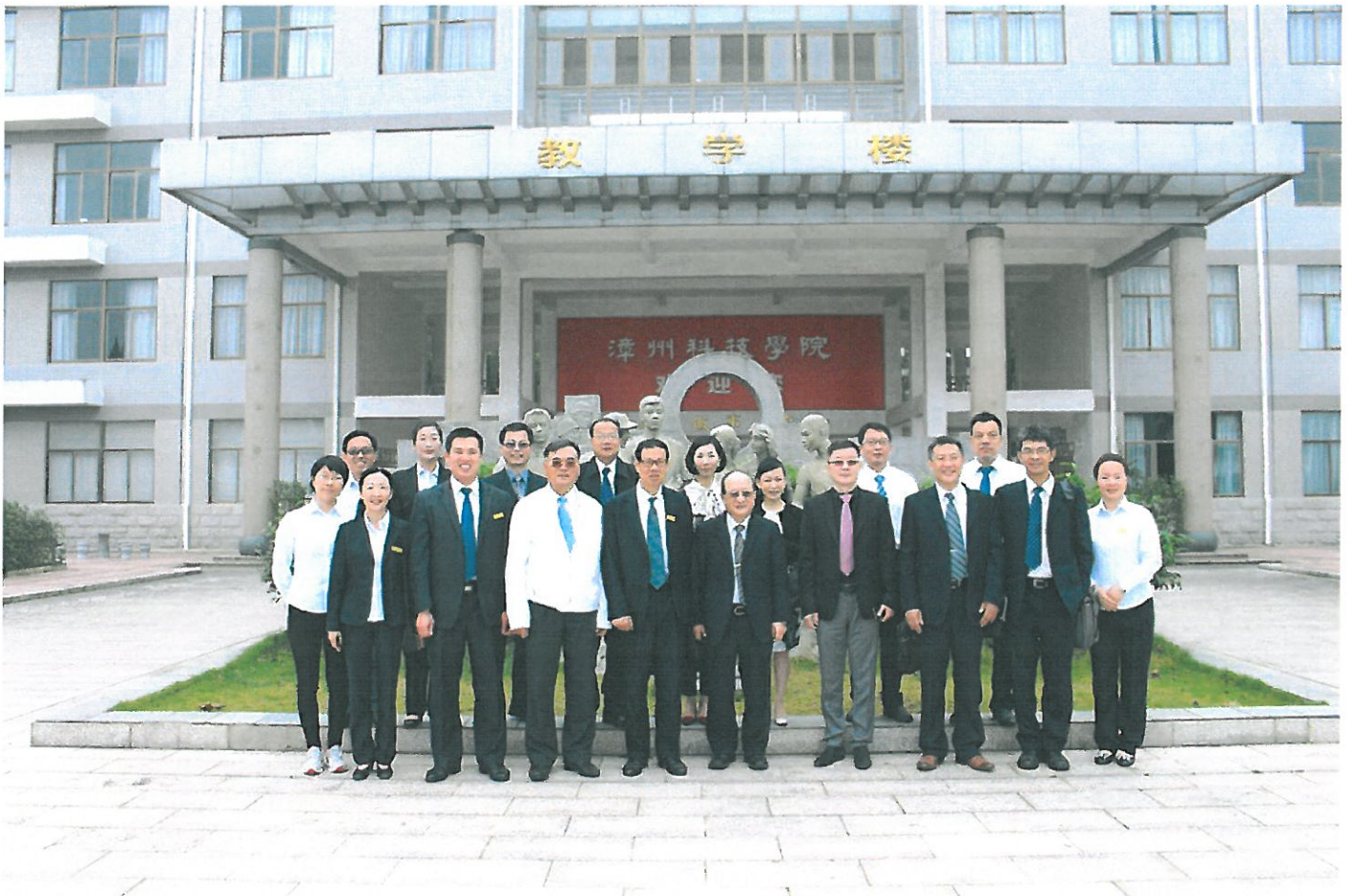
嘉南大學組團到大陸福建漳州科技學院為雙方合作成立實訓室揭牌。

大陸福建省漳州科技學院邀請嘉南藥理大學前往該校，共同為兩校合作設立的實驗訓練室揭牌。