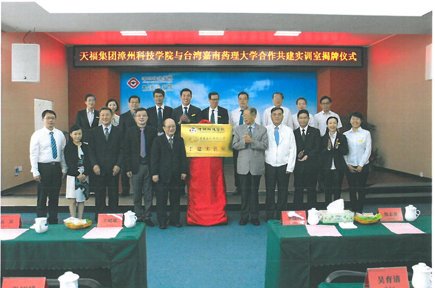
福建省漳州科技學院與嘉南大學合作成立實訓室揭牌。