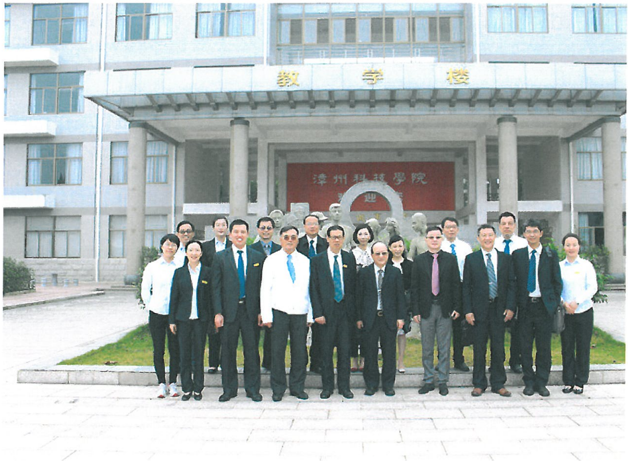
嘉藥一行人參觀漳州科技學院。