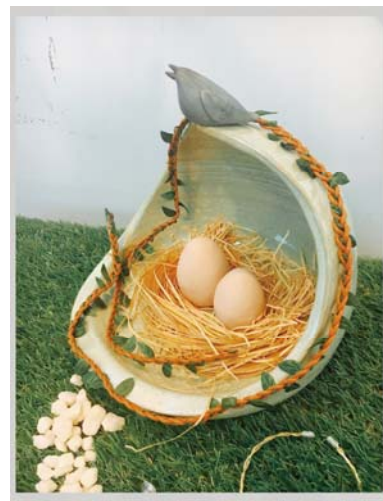
生活三甲學生作品「新生地」