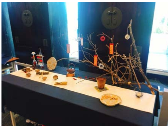
生活三乙學生作品 精緻茶席 「秋」

成果發表會當天另設有精緻茶席與芳香舒療體驗活動，歡迎大家一同分享師生豐碩成果的喜悅，也體驗一場解放壓力的「茶·芳·巧藝」。