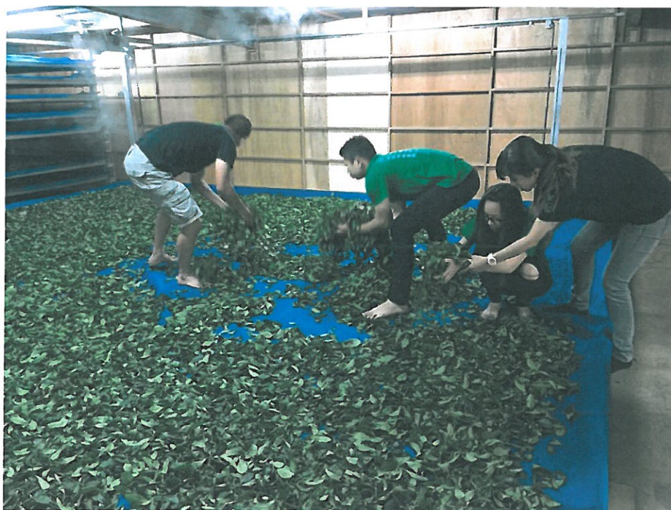
亞太創意學院茶業技術應用系學生在校內的茶園觀察、辨別茶樹品種。