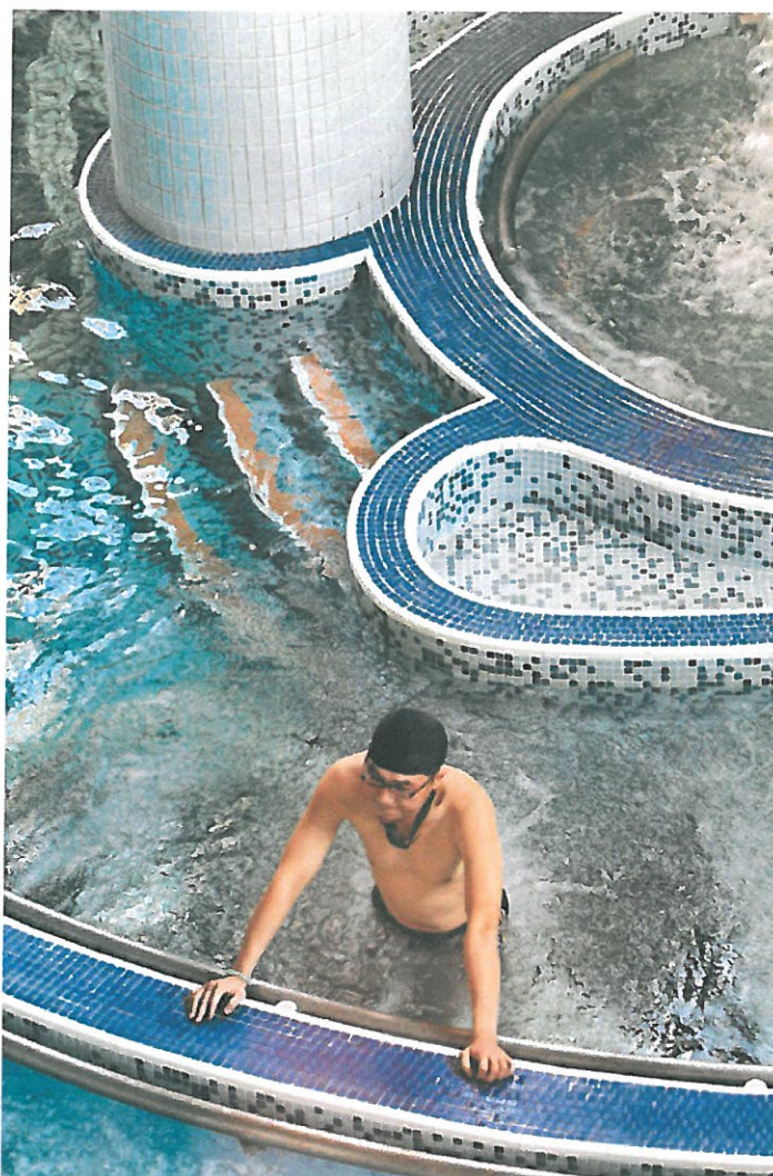
嘉南藥理大學成立台灣唯一一個「溫泉研究所」，校內打造五星級溫泉SPA，做為學生學習溫泉水療的實習場所。