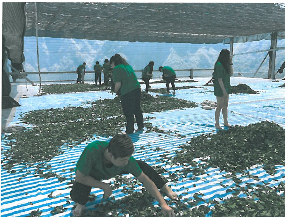
亞太創意學院茶業技術應用系學生在校內的茶園觀察、辨別茶樹品種。

觀光產值很大，未來學生若通過溫泉經理管理師、溫泉遊程規畫師等，替台灣溫泉產業培養人才。