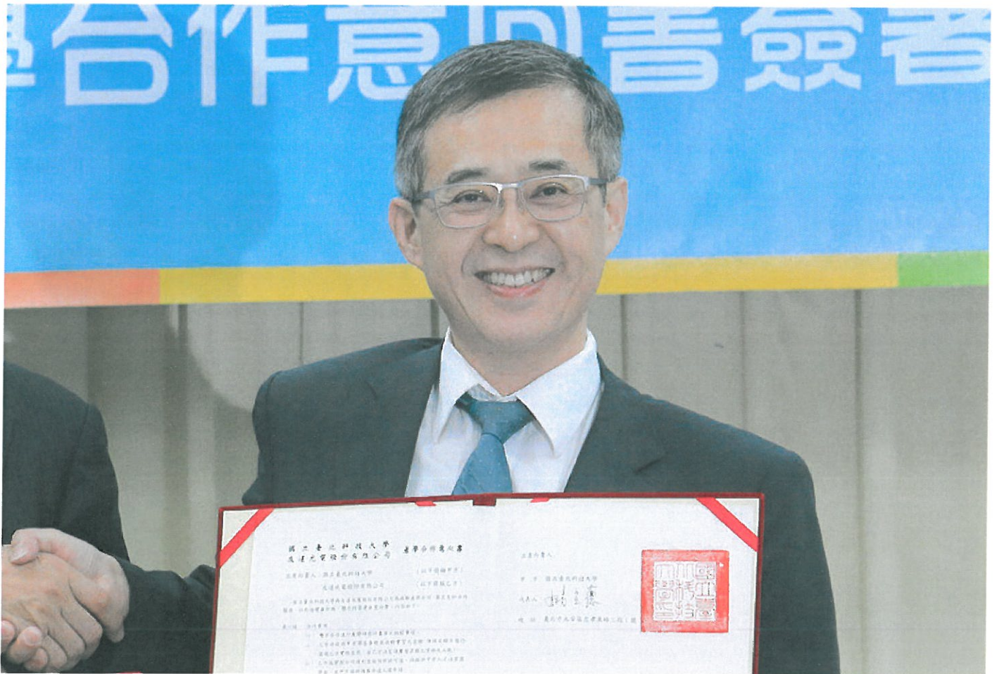
國立台北科技大學校長姚立德。

教育部105學年度新設科系多隨產業發展脈動成立，北科大校長姚立德表示，大學不能只投年輕人所好而成立新設系所，教育部、經濟部應盤點產業實際的人力需求，否則恐重演餐飲、設計科系因一時熱門成立太快，造成的人才過剩危機。