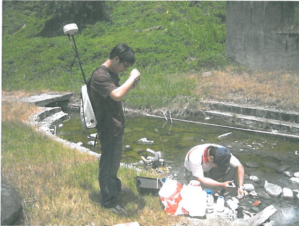
嘉南藥理大學成立台灣唯一一個「溫泉研究所」，學生必須到戶外學習溫泉地質、水質檢測。

不怕少子化衝擊，今年大學隨產業發展創立新科系搶招學生，教育部公布105 學年度新設科系，有別於過去多設計、餐飲熱門科系，技專校院新增近90的系所，其中以老人長照等相關最多，包含吳鳳科大長期照護系、元培醫事科技大學高齡福祉事業管理學士學位學程、聖約翰科大老人服務事業系等。此外寵物相關、影視互動娛樂等也都是過去較少見的。