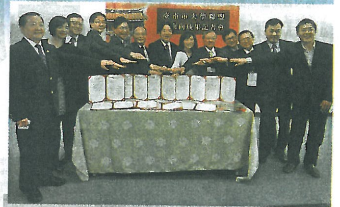
台南市長賴清德（中）3月4日至11日率《台南市大學聯盟》12所大學前往東南亞招生，13日發表南向成果。

扮演搭橋角色的賴清德，6天行程拜訪了馬來西亞官方、印尼教育部、印尼工業部，首次接觸到回教穆斯林學校，開啟未來交換學生契機。他並號召台南上市櫃公司負責人組成的億載會成立「台南獎學金」與企業實習機會，給成績優異的海外人才，吸引更多學生到台南的學校就讀。