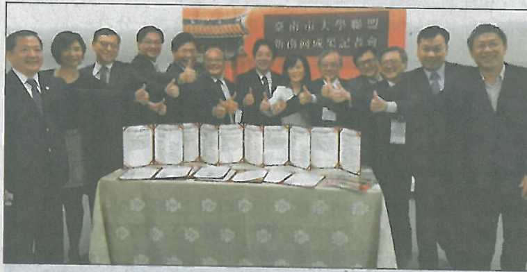
台南市長賴清德（中）率12所大專院校校長前往東南亞，簽署多項合作備忘錄，昨公布成果。

【記者修瑞瑩／台南報導】響應總統蔡英文南向政策，台南市長賴清德與12所大專院校合作，