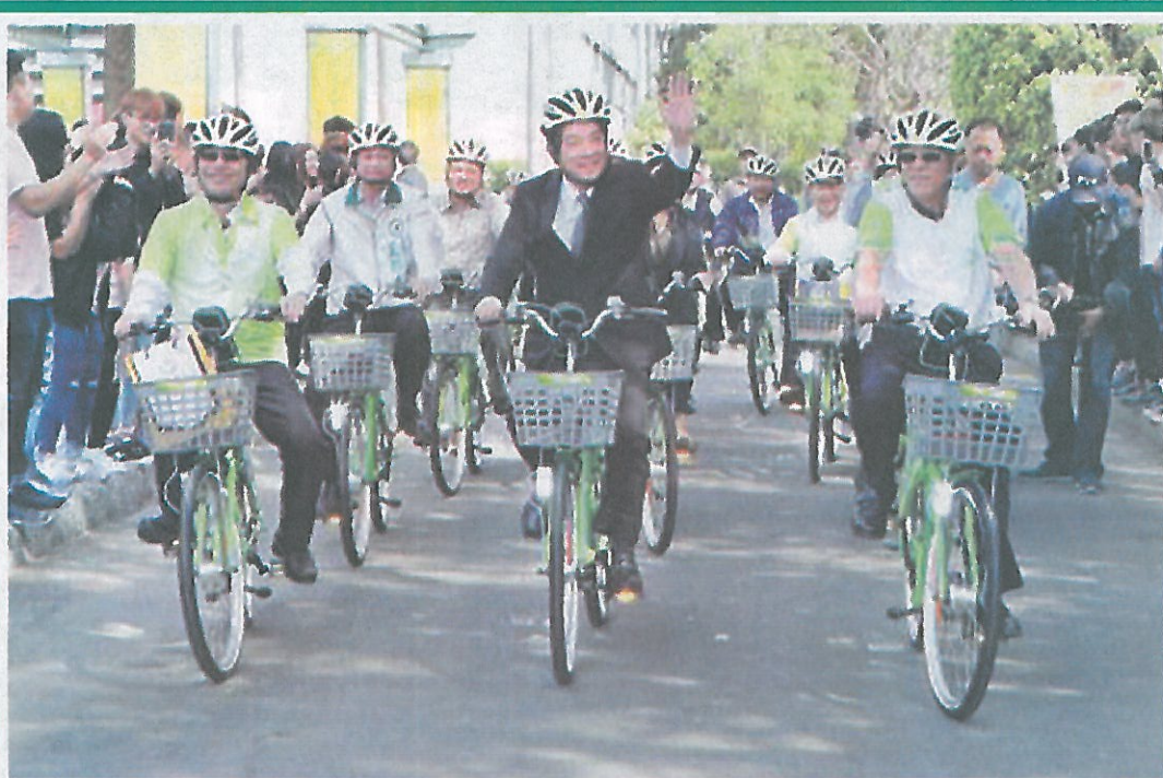
首座T-Bike捐贈租賃站，嘉南藥理大學站啟用。