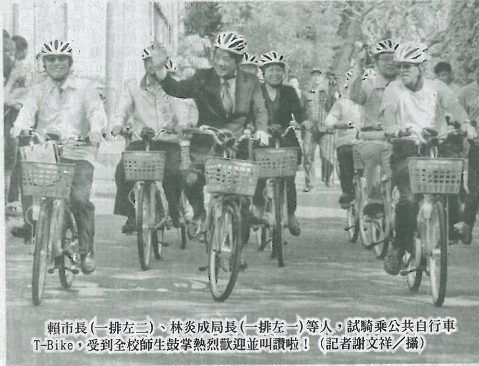
賴市長(一排左二)、林炎成局長(一排左一)等人，試騎乘公共自行車 T-Bike，受到全校師生鼓掌熱烈歡迎並叫讚啦！

【記者謝文祥、黃鐘毅／台南報導】台南市首座由民間捐贈的公共自行車租賃站(T-Bike)，特於昨天下午十四時在嘉南藥理大學落成啟用，新設嘉南藥理大學站是由校方出資捐贈，市長賴清德出席捐贈啟用儀式，並感謝該校積極配合公共自行車的 policy 推動，同時也推廣企業捐贈公共自行車站點的活動，讓台南成為一個適合低碳慢遊的觀光樂園。 賴市長表示，T-Bike 為台南市推出公共運輸的最後一哩路設施，可供市民利用大眾運輸工具轉騎 T-Bike 的方便性，達到降低私人運具的使用率目標。 賴市長指出，嘉南藥理大學位於省道旁，許多學生使用台鐵及機車做為上下學的通勤工具，自從交通局於保安轉運站設置 T-Bike 站點後，嘉南藥理大學即積極推動公共自行車入校建設，希望能藉此提升學生搭乘大眾運輸工具的意願，減少機車的使用率，降低意外事故的發生和溫室氣體的排放。 五月擴充至五十租賃站 交通局局長林炎成表襲，公共自行車(T-Bike)為交通局積極推動的運輸政策，一〇五年已建置十個示範站點，一〇六年春節前也開通了十二個市區新站，廣受市民和遊客喜愛，今年五月底將擴充至五十座公共自行車租賃站，加上民間捐贈的嘉南藥理大學站，大大提升 T-Bike 的使用方便性。 林局長指出，交通局特別制定公共自行車(T-Bike)捐贈辦法，歡迎認同此一綠色運輸理念的企業共襄盛舉，讓 T-Bike 可以進入所有的校園、工業區、景點、和大樓社區等用路人聚集的區域，藉此減少私人運具的使用，降低空氣汙染和交通事故，讓台南成為更美好的宜居城市。