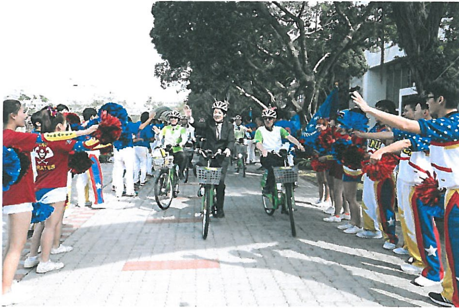
嘉藥校長陳銘田（右）陪同市長賴清德（中）及來賓一起騎乘T-Bike巡禮校園。