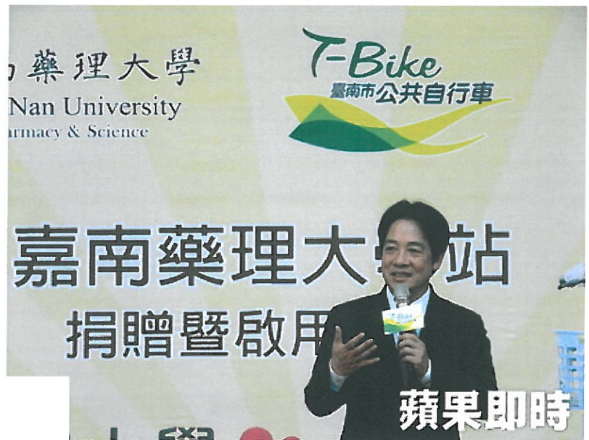
賴清德感謝嘉南藥理大學積極配合T-Bike政策。