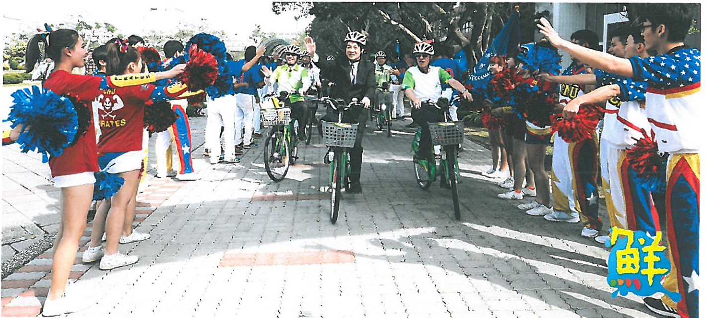
▲嘉南藥大校長陳銘田、台南市長賴清德等人騎T-Bike巡禮校園。