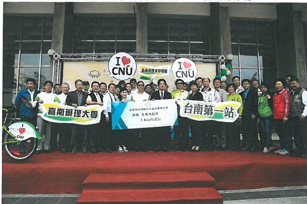
賴清德市長與出席捐贈暨啟用典禮嘉賓合影。