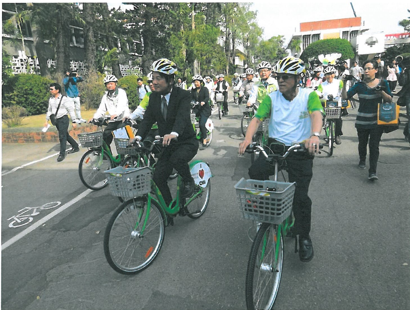
T-Bike首進校園，市長賴清德（前左）率先試騎。

陳銘田說，學校緊鄰保安車站，全校1萬6千多名學生、近660位教職員中，平日搭火車通勤通學者甚多，主動提出贊助設站計畫，獲市府支持啟用，通勤通學師生受惠。