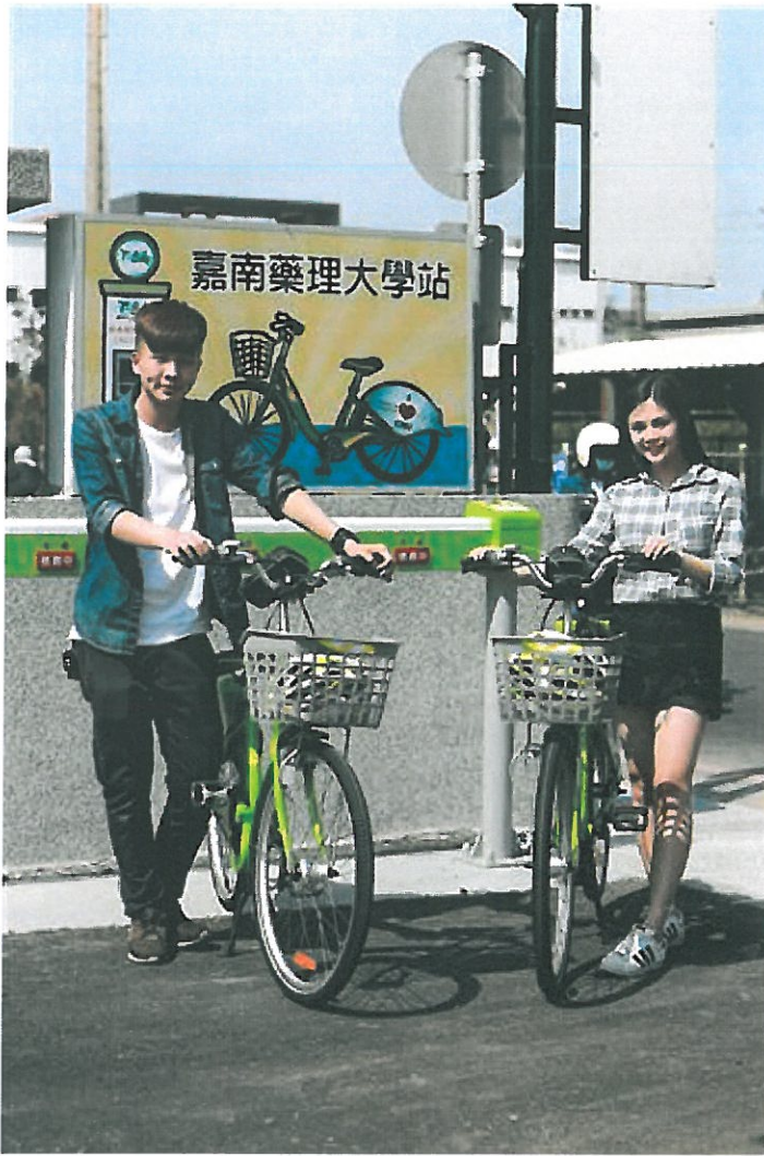
嘉藥學生開心迎接嘉藥T-Bike站正式啟用