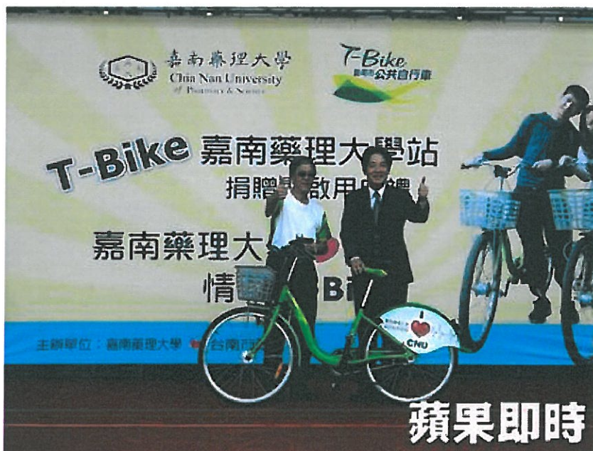
嘉南藥理大學出資捐贈T-Bike租賃站。