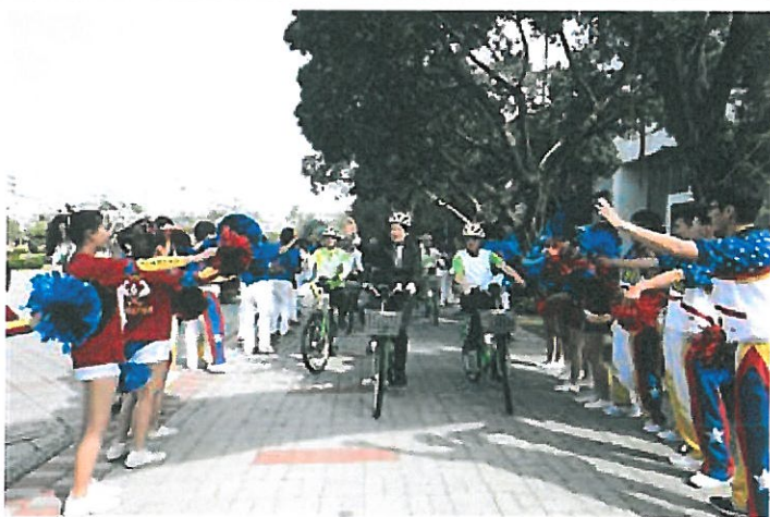
嘉藥校長陳銘田(右)陪同賴清德市長及貴賓一起騎乘T-Bike巡禮校園