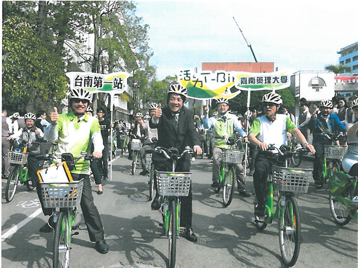
T-Bike嘉南藥理大學站啟用，賴清德開心帶頭騎自行車。