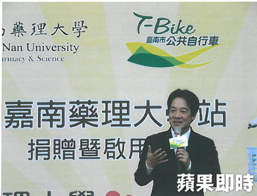
賴清德感謝嘉南藥理大學積極配合T-Bike政策。