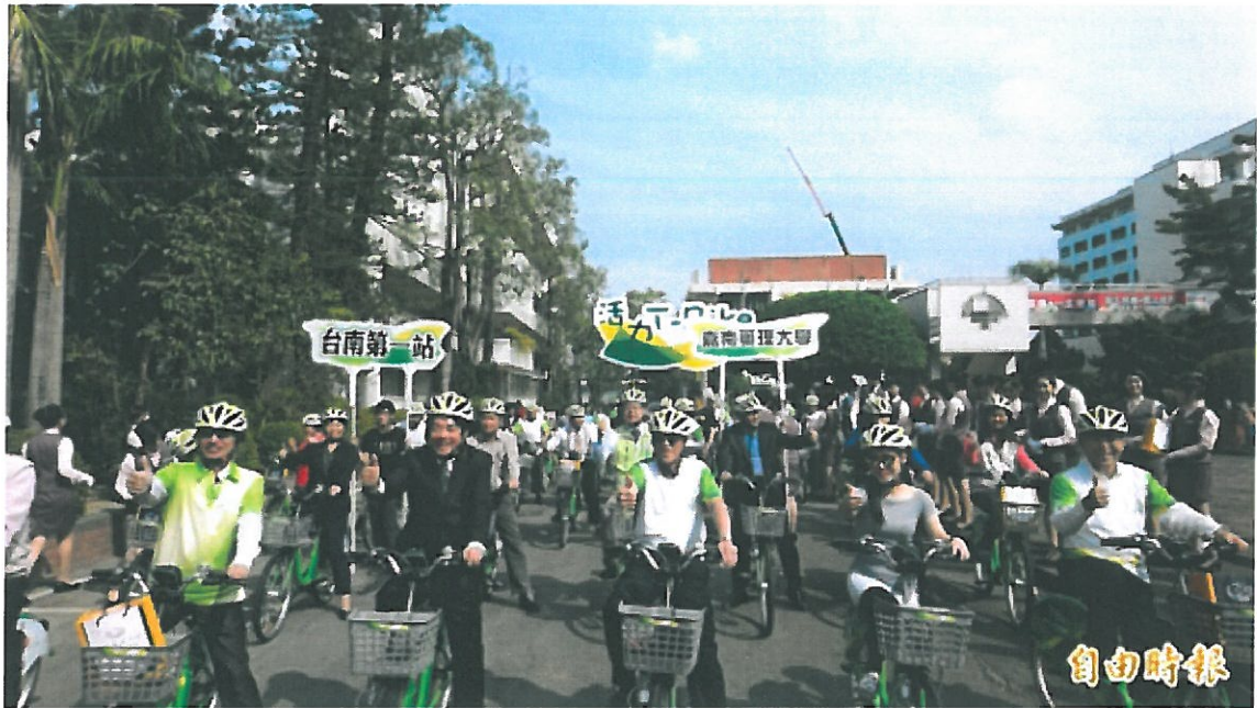
嘉南藥理大學捐贈T-Bike租賃站-嘉藥大學站落成啟用。