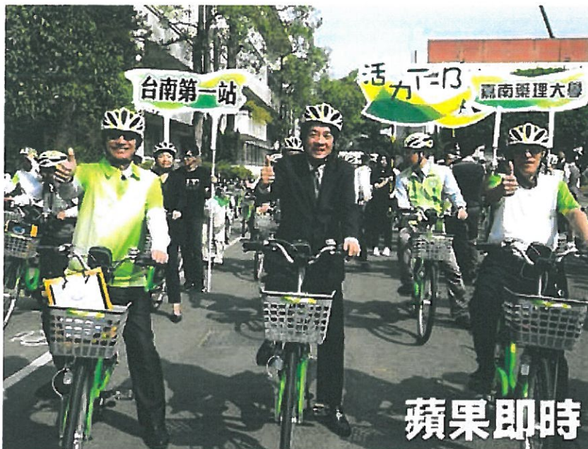
賴清德在嘉南藥理大學站騎乘T-Bike。