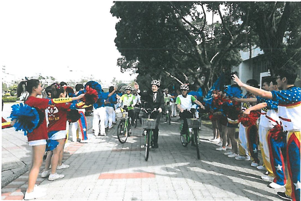
嘉藥校長陳銘田(右)陪同賴清德市長及貴賓一起騎乘T-Bike巡禮校園。