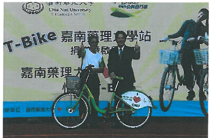
台南市首座由民間捐贈的公共自行車租賃站 (T-Bike)，昨天在嘉南藥理大學落成啟用，台南市長賴清德主持嘉南藥理大學站的捐贈啟用儀式。

台南市長賴清德指出，嘉南藥理大學位於省道旁，許多學生使用台鐵及機車做為上下學的通勤工具，自從交通局於保安轉運站設置 T-Bike 站點後，嘉南藥理大學即積極推動公共自行車入校的建設，希望能藉此提升學生搭乘大眾運輸工具的意願，減少機車的使用率，降低意外事故的發生和溫室氣體的排放。