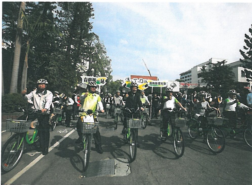
賴清德市長(左三)和與會貴賓、嘉藥師生共同見證嘉藥新站點啟用。