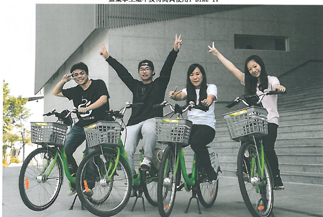
嘉藥學生迫不及待高興使用T-Bike-1。