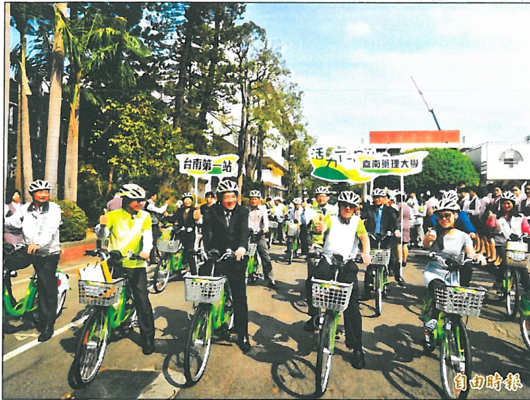
T-Bike嘉南藥理大學租賃站熱鬧啟用，與會者與師生一同在校內體驗。