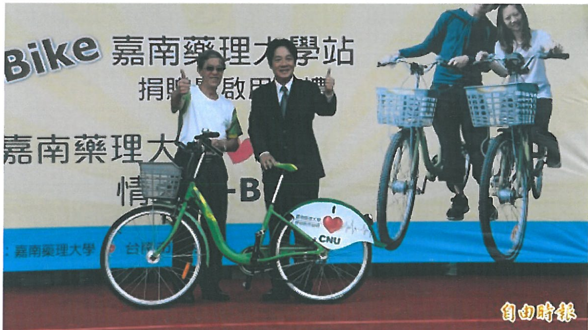
嘉南藥理大學捐贈T-Bike租賃站-嘉藥大學站落成啟用。