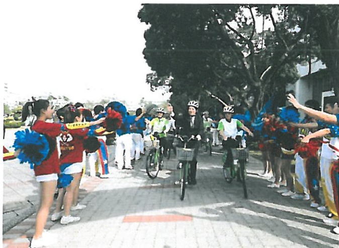
嘉藥校長陳銘田(右)陪同賴清德市長及貴賓一起騎乘T-Bike巡禮校園。