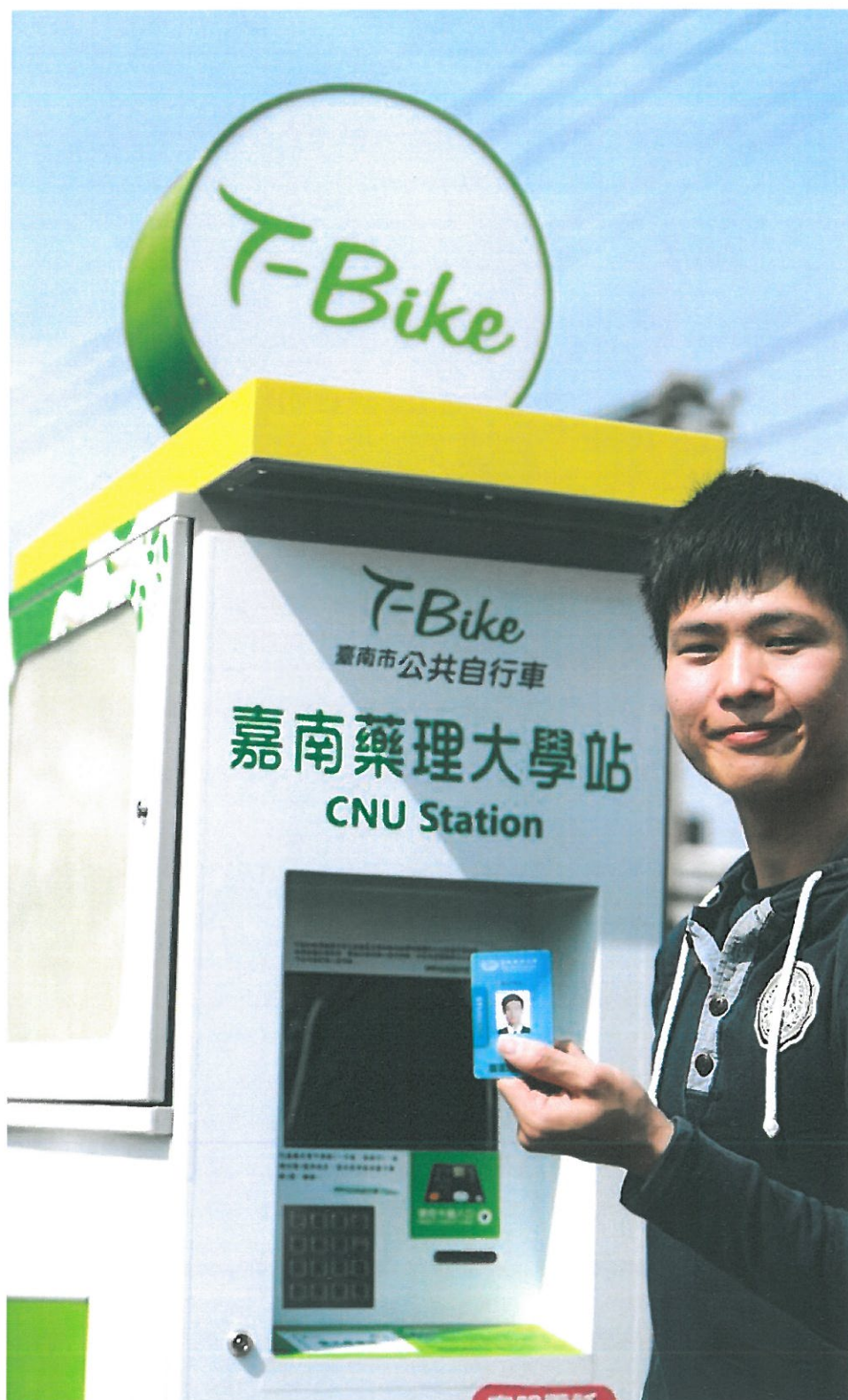
嘉藥學生使用學生證就可借用T-Bike。