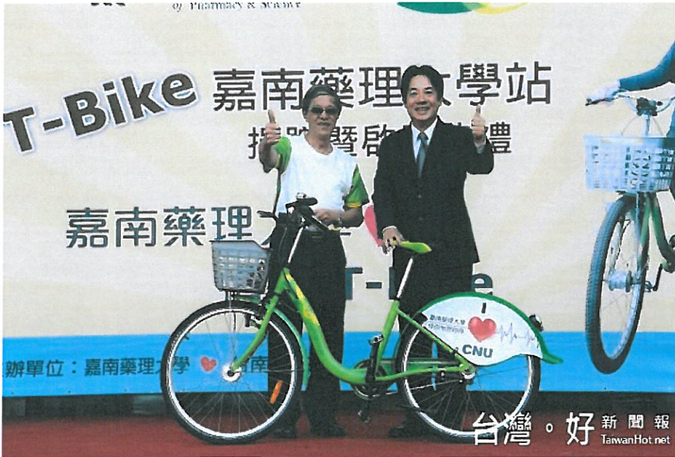
台南首座T-Bike捐贈租賃站 嘉南藥理大學站啟用