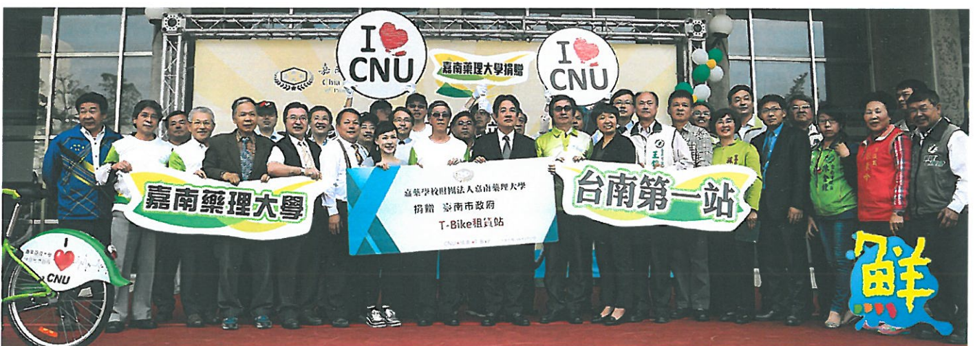
▲台南市公共自行車T-Bike全國首創進駐嘉南藥理大學設站，與會來賓在啟用典禮上開心合影。