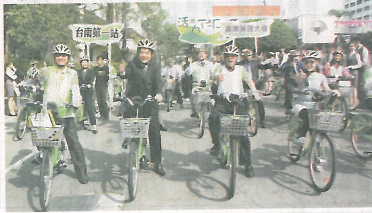
←市長賴清德(左二)等人共同騎T-Bike進行校園巡禮。

記者林偉民／仁德報導 嘉南藥理大學出資捐贈的公共自行車租賃站(T-Bike)，昨天在嘉藥大學舉行捐贈啓用儀式，這是台南市各大學第一個設置的租賃站，也是台南市第廿三個租賃站，市府計劃全市在五月底前擴充至五十座公共自行車租賃站，讓台南成爲適合低碳慢遊的觀光樂園。 啓用儀式由市長賴清德和嘉藥校長陳銘田共同主持，並在衆多學生夾道歡迎下，一起騎T-Bike巡禮校園嘉南大道，賴清德表示，T-Bike爲台南市推出公共運輸的「最後一哩路」設施，可達到降低私人運具使用率的目标。 市府於去年八月建置T-Bike系統，在奇美博物館文化園區與南科園區各設五個租賃站，今年春節前於市區重要景點再增設十二站，新設的嘉藥站爲第廿三個租賃站。 交通局分析T-Bike使用情形，發現通勤、通學使用並不輸觀光騎乘，嘉藥也發現有不少學生搭火車在保安站下車後會騎T-Bike上學，因此主動聯繫市府，贊助一百八十二萬元在校區設站，並配合提供卅二部車輛及系統架設備，方便學生騎T-Bike往來保安車站上下學或到附近奇美博物館參觀。 交通局長林炎成指出，交通局制訂T-Bike捐贈辦法，歡迎企業、學校共襄盛舉，讓T-Bike進入校園、工業區、景點和大樓社區等用路人聚集的區域，降低空氣汙染和交通事故，讓台南成爲更美好的宜居城市。