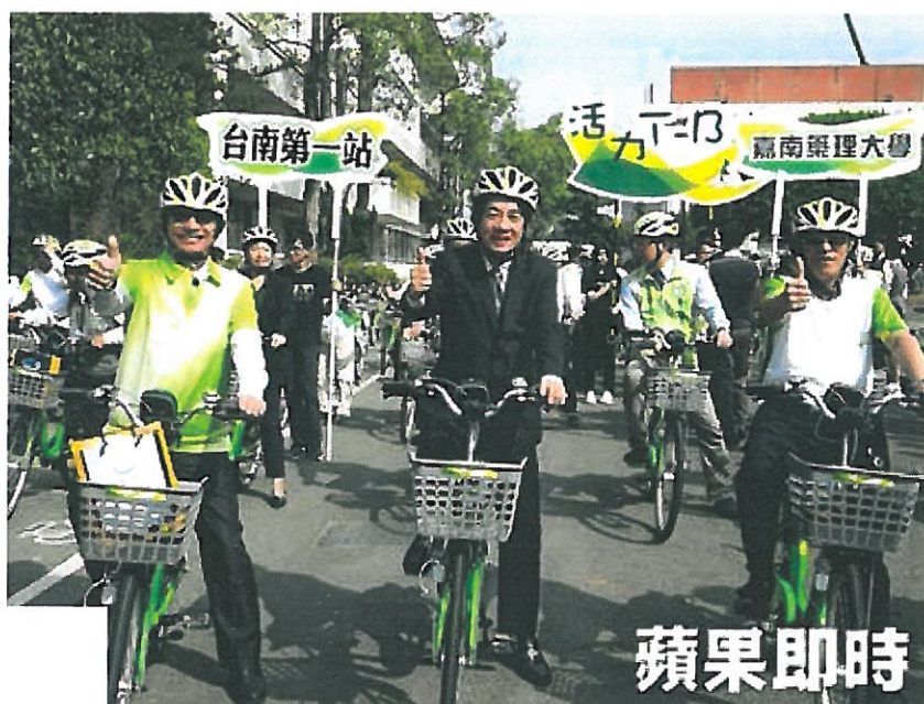
賴清德在嘉南藥理大學站騎乘T-Bike。

賴清德認為，「先進運輸系統」是每個進步城市所必需，但建置時須按部就班，台南從公車開始，計程車、腳踏車等按部就班一步步做，而鐵路地下化動工後，也爭取鐵路地下化延伸，從市區到永康、新市、善化路續推動，目前初步構想獲得中央支持，但後續還需審議和花很多功夫推動，「並非明天或明年就會好，按部就班推動台南的公共運輸建設，對這城市未來長遠的發展是必要的」。（李恩慈／台南報導）