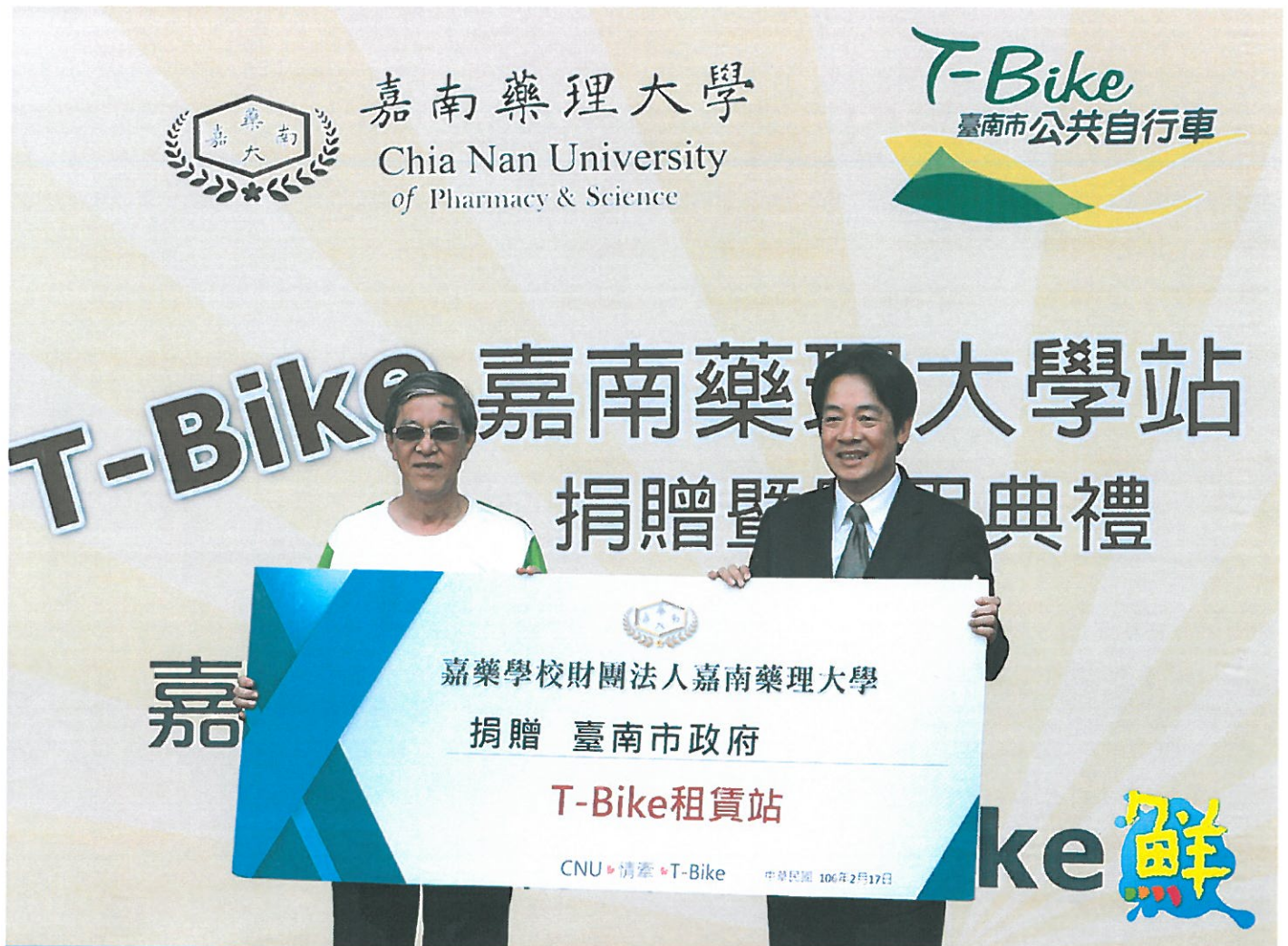
▲嘉南藥大校長陳銘田代表董事會捐資協助T-Bike進駐校園設站，台南市長賴清德歡喜受贈。