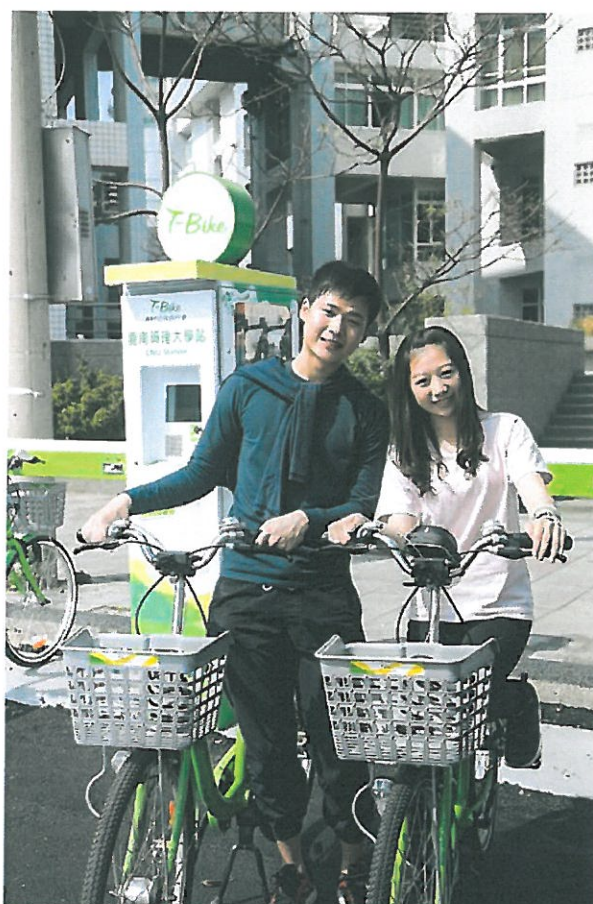
嘉藥學生迫不及待高興使用T-Bike-1。

http://www.cdnews.com.tw 2017-02-16 23:05:18