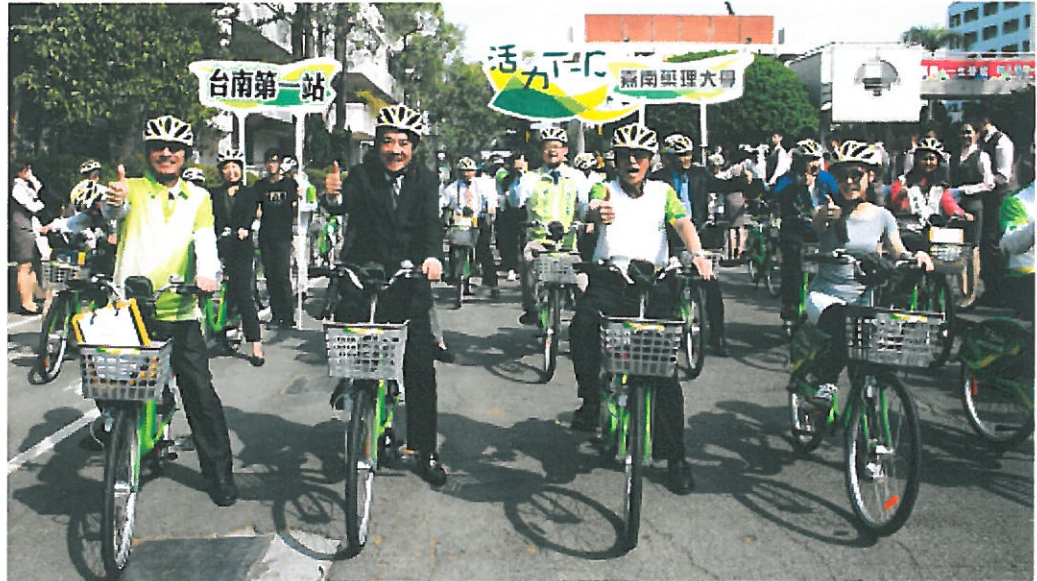
市長賴清德（左二）等人共同騎T-Bike進行校園巡禮。

嘉南藥理大學出資捐贈的公共自行車租賃站（T-Bike），昨天在嘉藥大學站舉行捐贈啟用儀式，這是台南市各大學第一個設置的租賃站，也是台南市第廿三個租賃站，市府計畫全市在五月底前擴充至五十座公共自行車租賃站，讓台南成為適合低碳慢遊的觀光樂園。