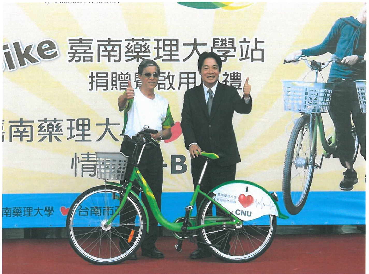
市長賴清德（右）感謝校方捐車設站。