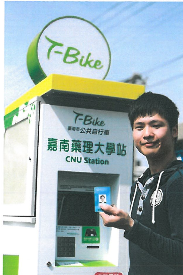
嘉藥學生使用學生證就可借用T-Bike。

台南市首座由民間捐贈的公共自行車租賃站(T-Bike)，今(17)日在嘉南藥理大學落成啟用，嘉南藥理大學站係由嘉南藥理大學出資捐贈，市長賴清德主持嘉南藥理大學站的捐贈啟用儀式，並感謝嘉南藥理大學積極配合公共自行車的 policy 推動，同時也推廣企業捐贈公共自行車站點的活動，讓台南成為一個適合低碳慢遊的觀光樂園。