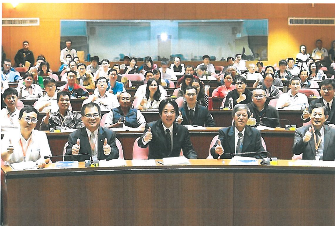
再創勞動和諧友善職場安全高階主管論壇合影(由左至右：職安署南區職業安全衛生中心主任李柏昌、台南市勞工局長王鑫基、台南市長賴清德、嘉藥校長陳銘田、工安衛生協理理事長藍福良)。

http://www.cdnews.com.tw 2017-03-23 18:36:24