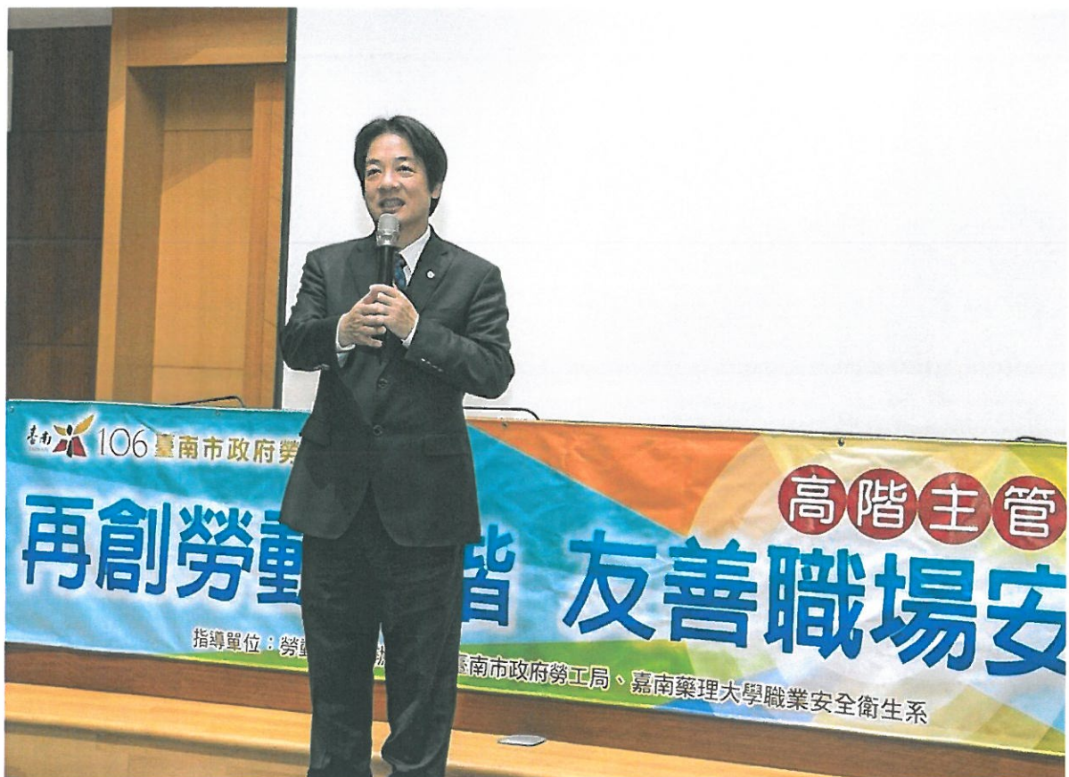
台南市長賴清德親臨論壇會場勉勵。