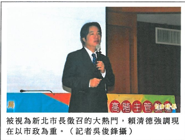
被視為新北市長徵召的大熱門，賴清德強調現在以市政為重。

〔記者吳俊鋒／台南報導〕2018年百里侯之爭，民進黨選舉對策委員會決議非執政的新北市將以徵召方式提名，台南市長被視為大熱門，對此，他今天仍表示，現在地方有很多的重要政策、建設都進入關鍵期，目前帶領市政團隊全力去做好，比規劃個人未來動向更重要。