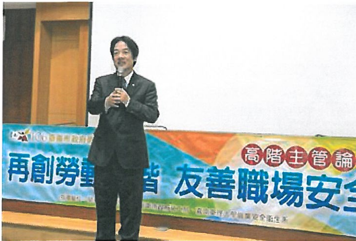
台南市長賴清德親臨論壇會場勉勵