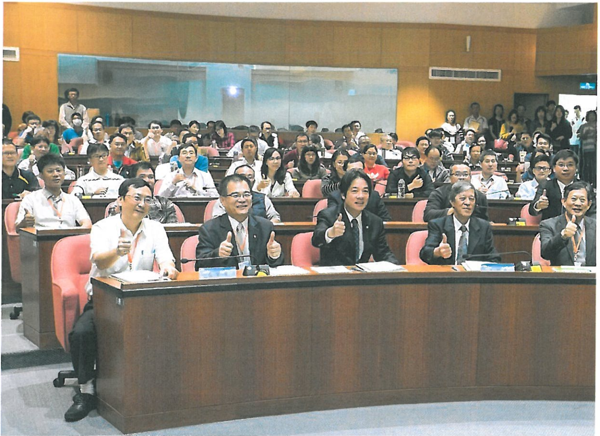
與會貴賓(前排左起)職安署南區職業安全衛生中心主任李柏昌、台南市政府勞工局長王鑫基、台南市長賴清德、嘉藥校長|業安全衛生協理事長藍福良。