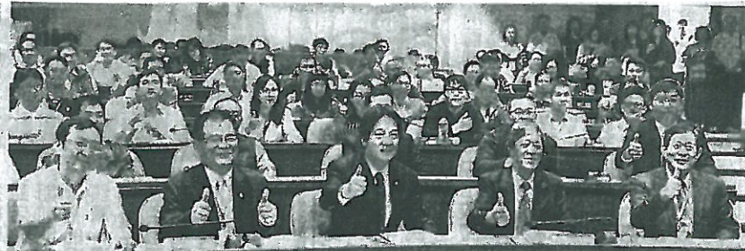
市長賴清德（中）參加高階主管論壇，與職安署南區職業安全衛生中心主任李柏昌、嘉藥校長陳銘田等人合影（記者黃鐘毅／攝）