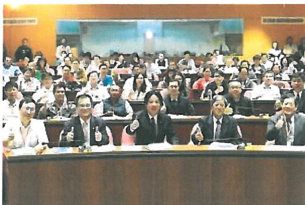
賴清德出席再創勞動和諧友善職場安全高階主管論壇合影。