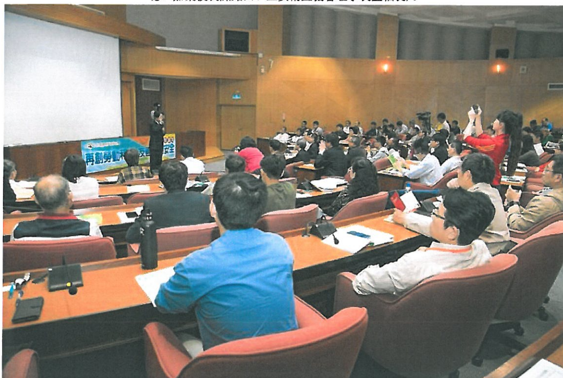
嘉藥舉辦「再創勞動和諧，友善職場安全」高階主管論壇吸引產官學各界專家參加。