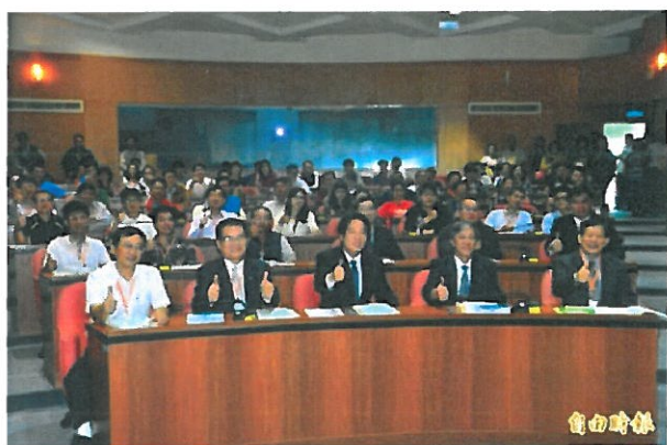
市政府與嘉藥合辦友善職場安全高階主管論壇，場面熱烈。

賴清德說，將獲行政院核定的有3案，包括鐵路地下化北延至永康，新市至善化為高架化的計畫，以及先進運輸系統府城橫貫線的綠線與中華環線的藍線第1期，對台南的發展是大利多。