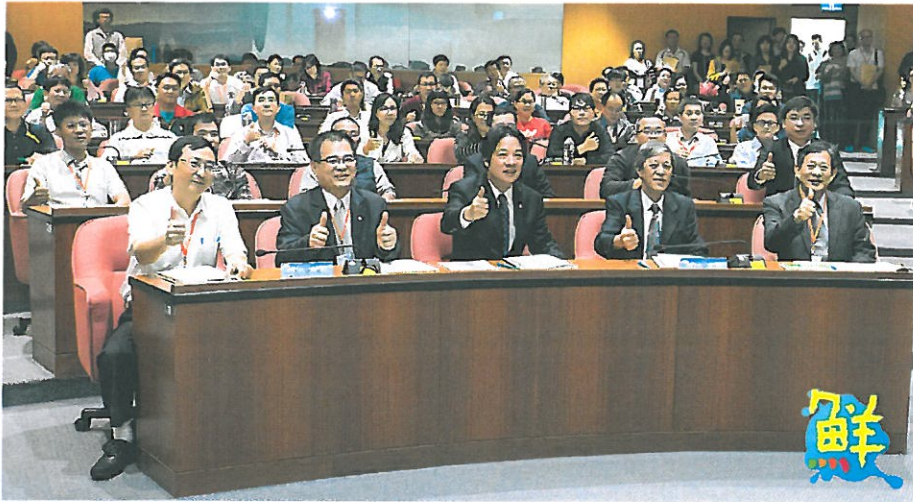
▲ 職安署南區職業安全衛生中心主任李柏昌、台南市勞工局長王鑫基、台南市長賴清德、嘉南藥大校長陳銘田、台南市工業安全衛生協會理事長藍福良(由左至右)等人合影留念。