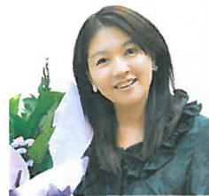
樂活城市新聞焦點

市政要聞 議政時事 綜合時事 醫學樂活 觀光樂活 產業樂活 文創樂活 消費樂活 校園樂活 慈善樂活