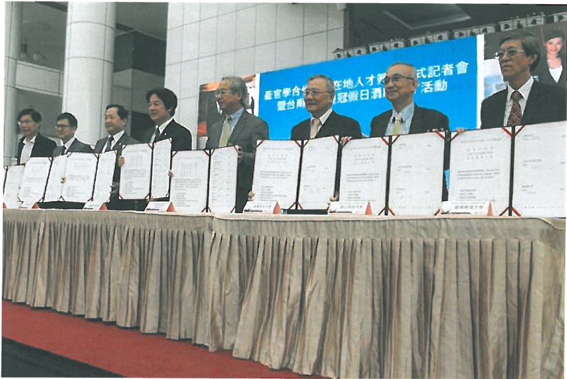
台南市長賴清德（左4）與6家大學、飯店業者簽署合作備忘錄。