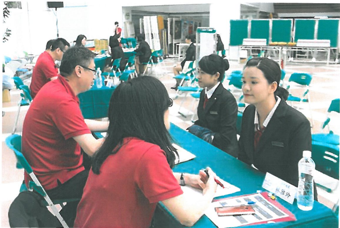
飯店業者現場徵才，立刻有民眾報名。