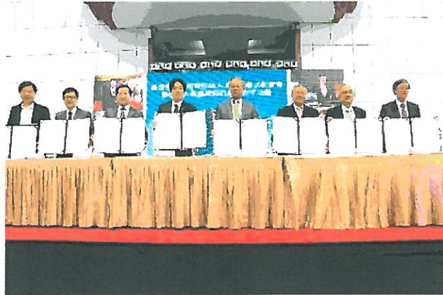
大員皇冠假日酒店與台南6所大專院校合作提供200個職缺於台南市政府現場徵才。

【記者杜龍一／南市報導】台南大員皇冠假日酒店即將於106年暑假開幕，為縮短學用落差、培育在地人才並促進青年就業，由台南市政府促成大員皇冠酒店與6所台南大專院校進行產官學合作，昨天於台南市永華市政中心2樓舉辦「培育在地人才簽署儀式暨徵才活動」，台南市長賴清德出席簽署產官學三方合作備忘錄。