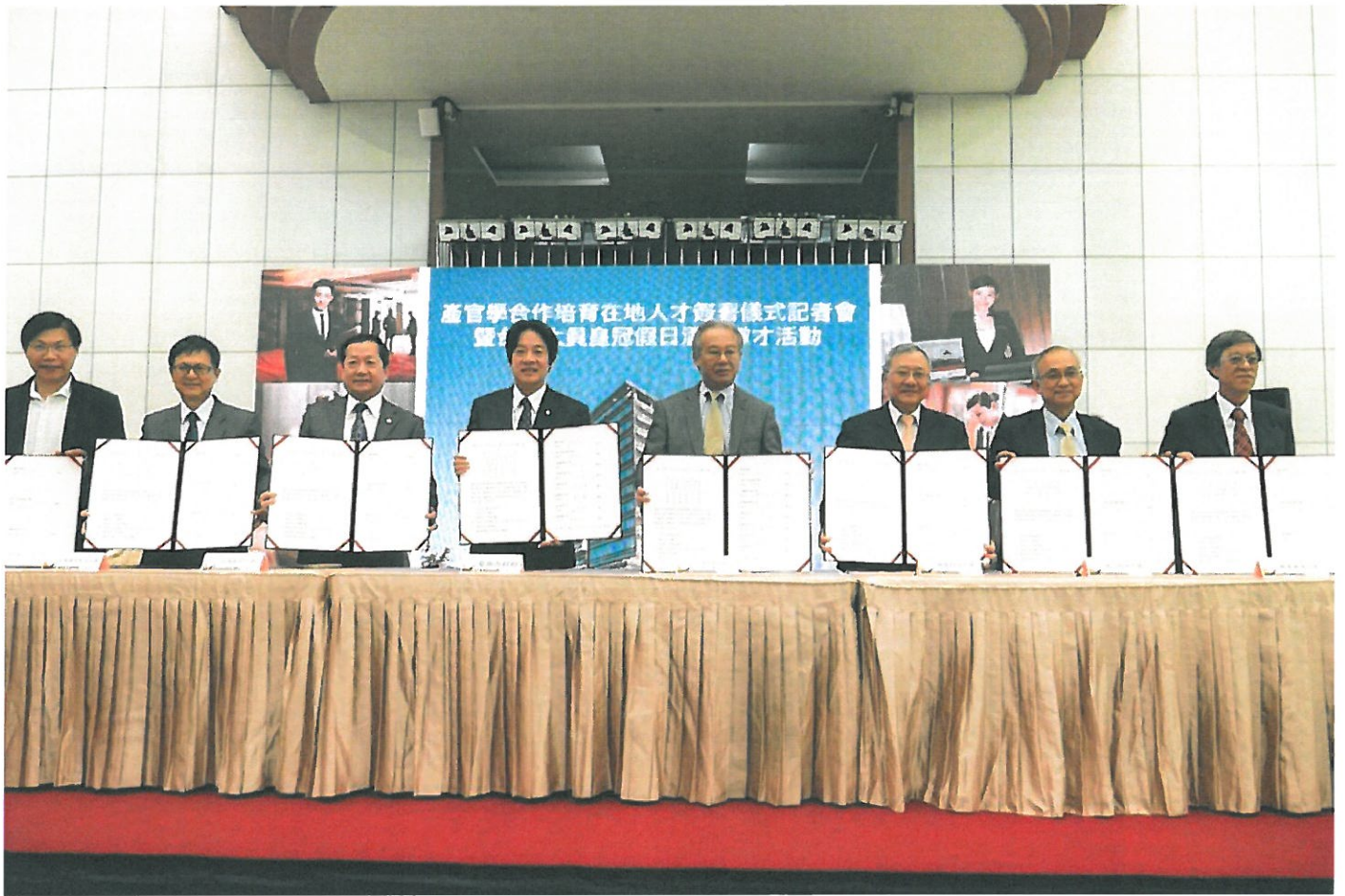
今天台南市長賴清德（左四）、台南大員皇冠假日酒店董事長李錫淇（右四）及6所大學簽署產官學合作培育在地人才契約。