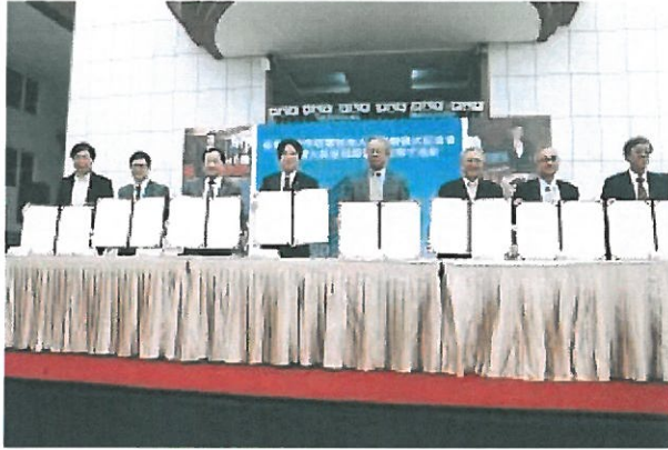
台南大員皇冠假日酒店產官學合作培育在地人才簽署儀式記者會。