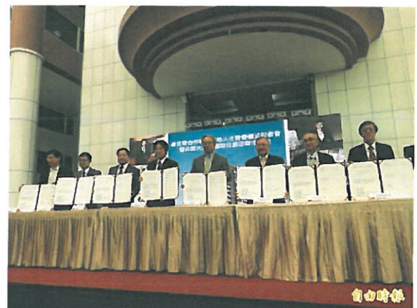
市府、台南大員皇冠假日酒店與大台南院校產官學合作培育在地人才簽署儀式，由市長賴清德（左4）主持。

市長賴清德表示，去年台南旅遊高達2千多萬人次，住宿3百萬人次，逐年上升，雖然國內大環境政治因素中國客減少，但台南旅遊不受影響，「台南」已成為國際旅遊品牌，從大員皇冠假日酒店進駐，顯見一斑。