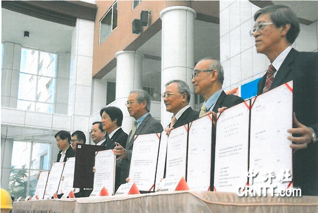
今年暑假要開幕的台南大員皇冠酒店位於台南安平，今與台南大六所大學簽訂產官學合作備忘錄。

中評社台北3月24日電（記者 趙家麟）在兩岸關係急凍、陸客赴台旅遊驟減的情形下，仍有業者在台南逆勢而行，擁有231房間、標榜五星級的台南大員皇冠假日酒店將在今年的第三季開幕，24日在市長賴清德主持下，與台南地區六所大學校長簽訂產官學合作備忘錄，並提供200職缺於市場現場徵才。