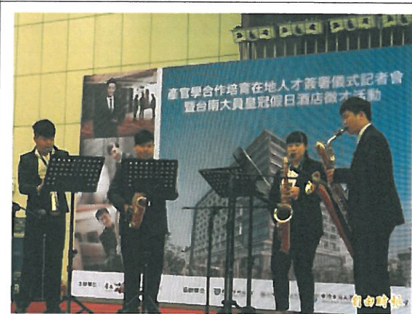
台南應用科技大學學生表演音樂長才。

〔記者洪瑞琴／台南報導〕台南安平首家國際級「IHG洲際酒店集團」「大員皇冠假日酒店」，預於7月開幕，市府主動媒合牽線，業者與大台南院校產官學合作培育在地人才，今日簽署儀式。