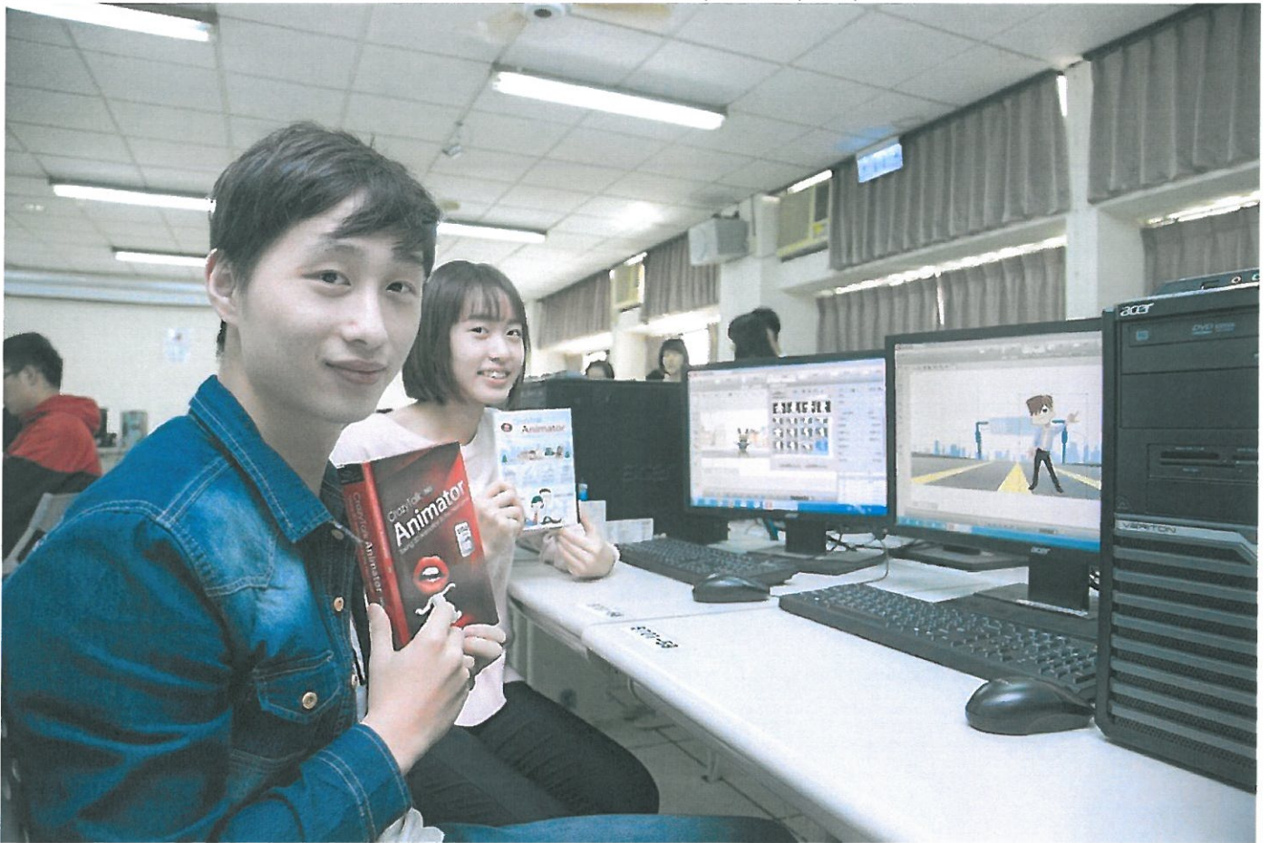
神奕科技公司捐贈軟體設備嘉惠嘉藥學子。