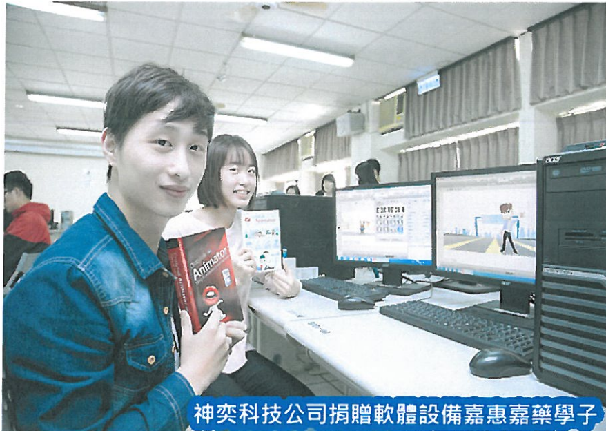
神奕科技公司捐贈軟體設備嘉惠嘉藥學子