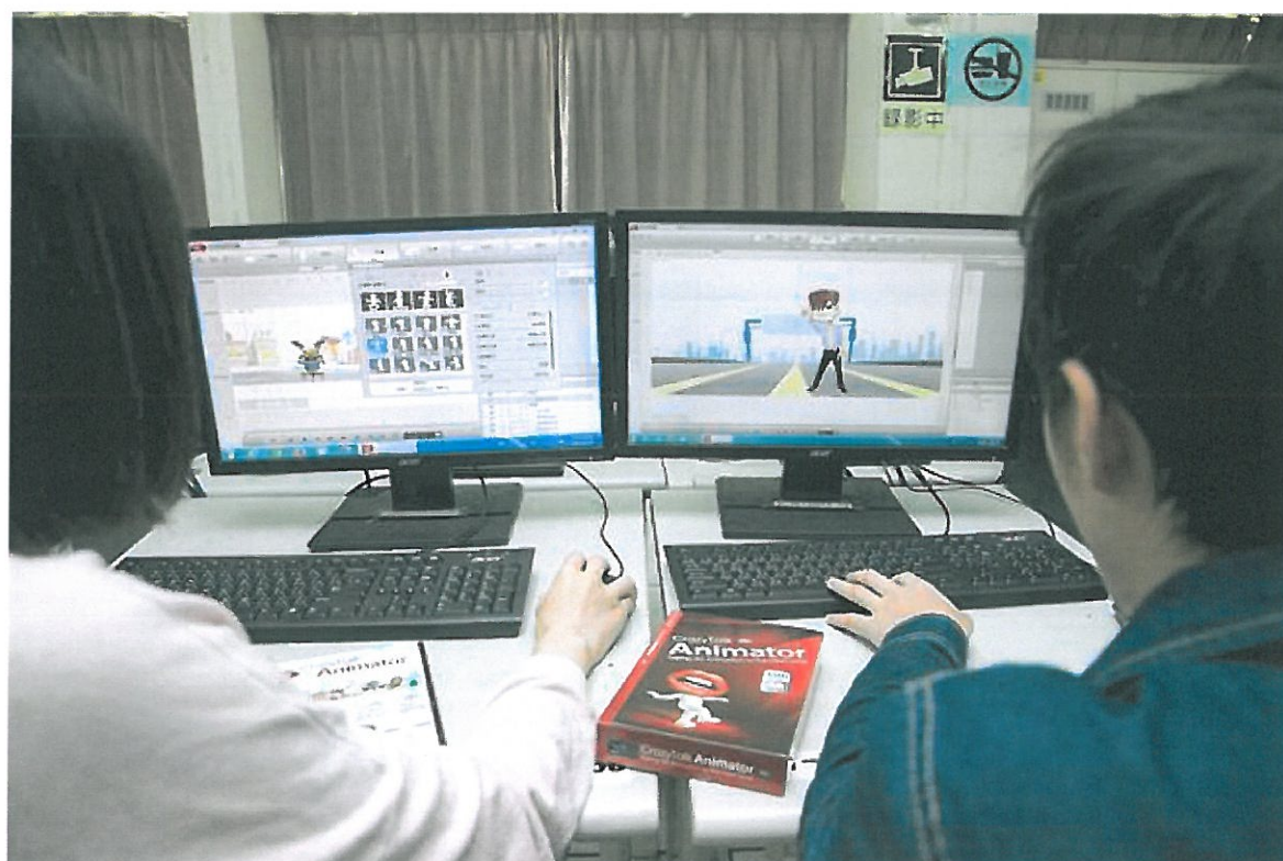
學生立刻實際操作。