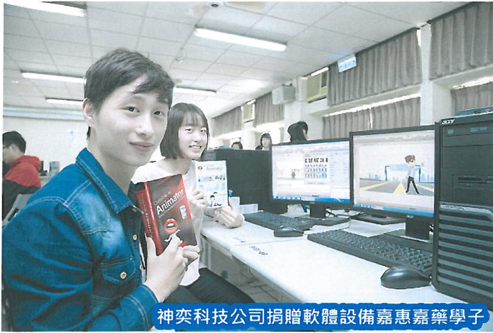
神奕科技公司捐贈軟體設備嘉惠嘉藥學子