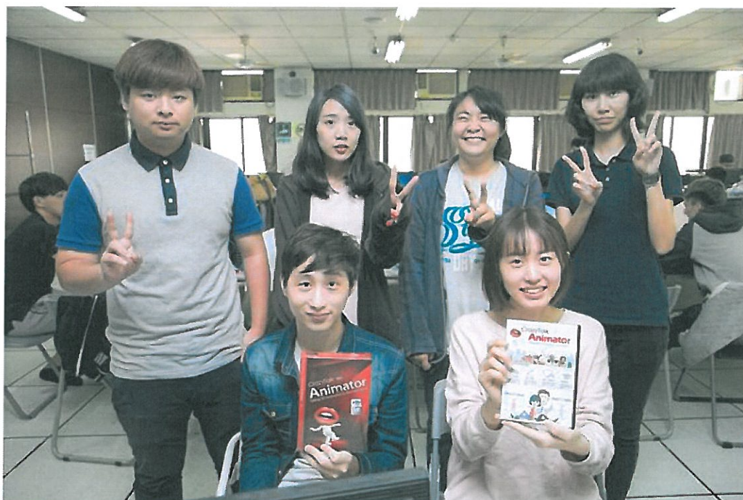
嘉南藥理大學資訊多媒體應用系學子欣喜獲贈設備。