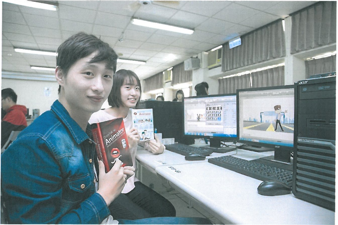
嘉大學生獲贈動畫開發軟體，學生實際應用。