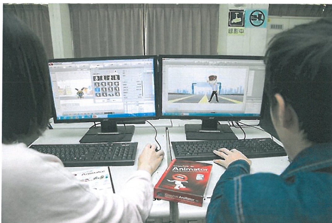
學生立刻實際操作。(曹婷婷翻攝)