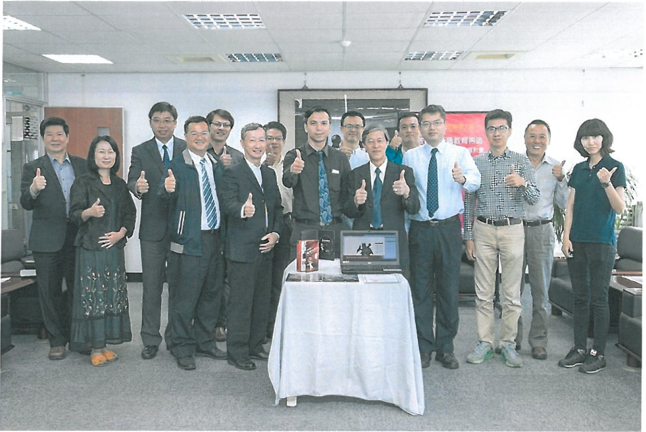
神奕科技捐贈市價百萬元動畫特效軟體設備，嘉大感謝。