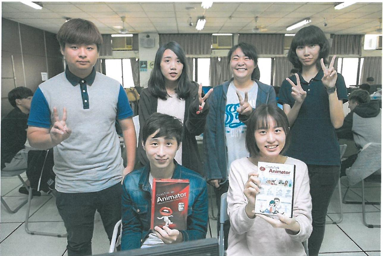
嘉藥獲贈動畫開發軟體，多媒體應用系學生很開心。