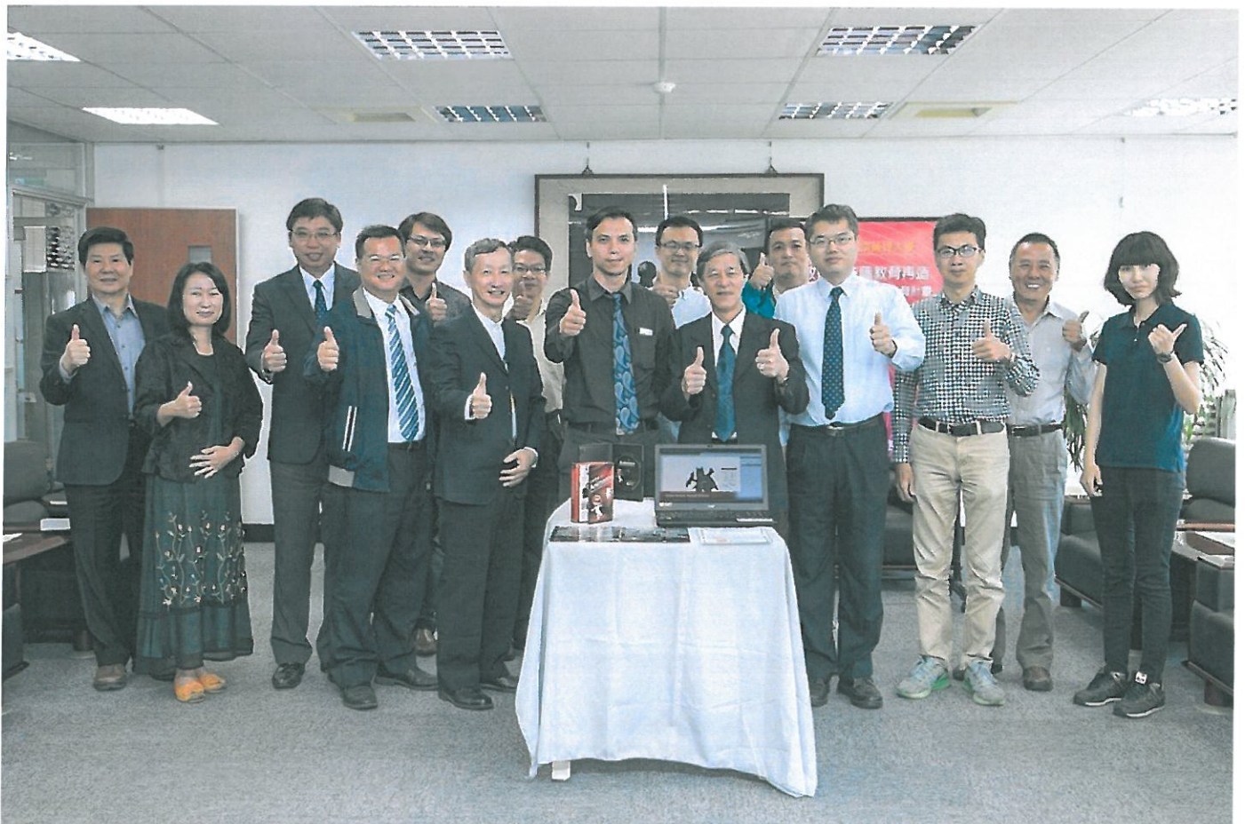
捐贈儀式大合照。