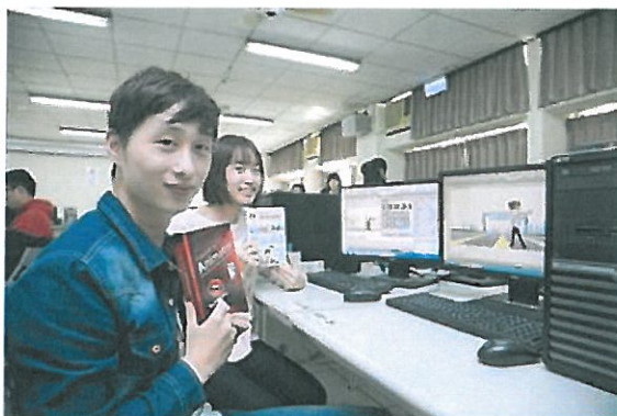
神奕科技公司捐贈軟體設備嘉惠嘉藥學子