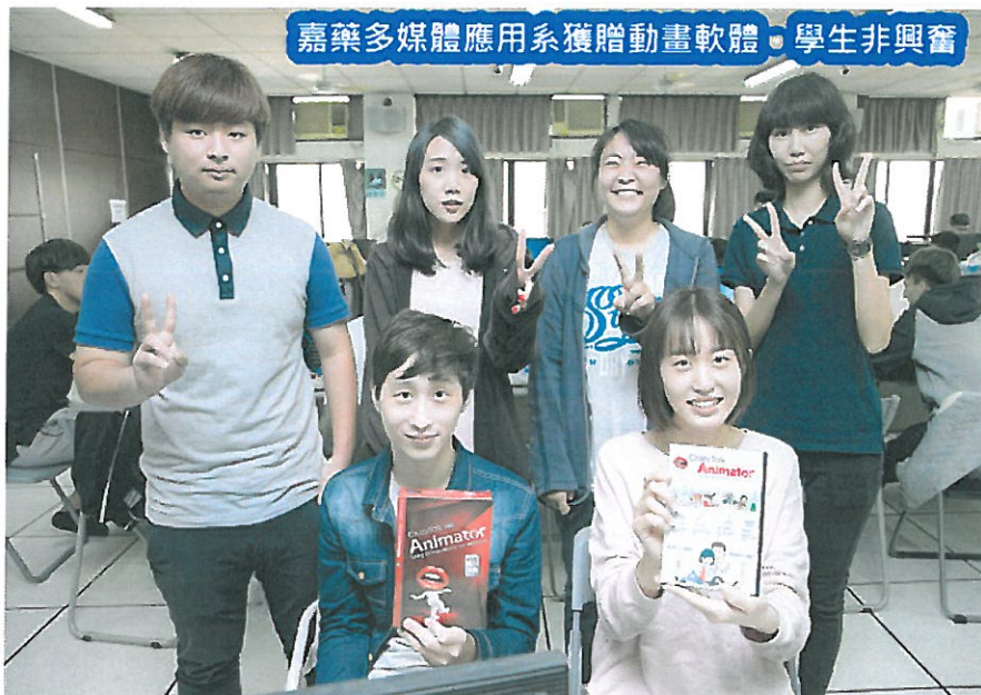
嘉藥多媒體應用系獲贈動畫軟體 學生非興奮