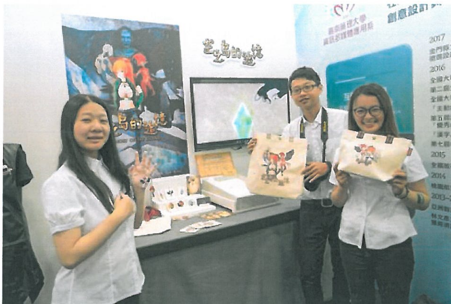
嘉藥學生開心秀出四年所學成果。