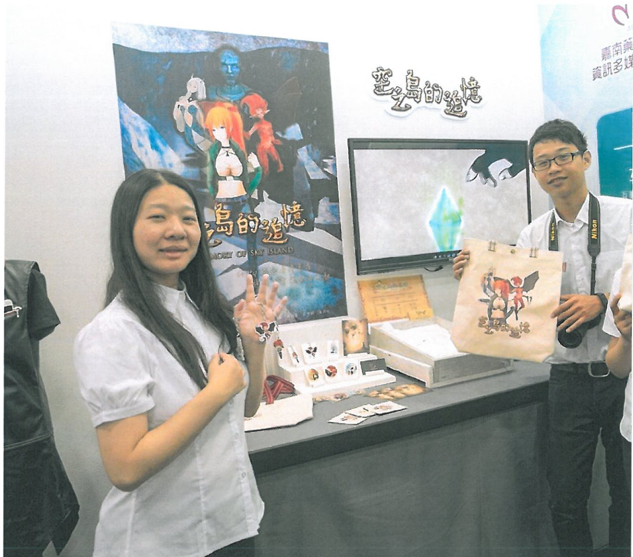
嘉藥學生開心秀出四年所學成果。

藝文資源，辦理各類展覽、演奏會、舞臺劇、舞蹈表演與影展等藝術欣賞活動，也舉辦演講、研習、工作坊及體驗營等教育性活動，鼓勵學生發揮創意、跨界多元學習。