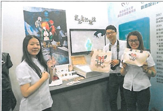
嘉藥學生開心秀出四年所學成果