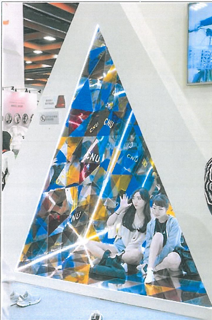
巨型萬花筒提供民眾自拍留念