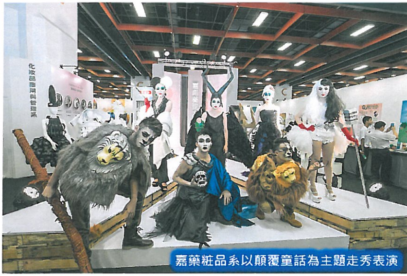
嘉藥粧品系以顛覆童話為主題走秀表演