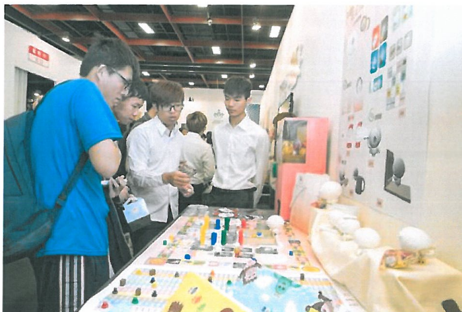
學生向參觀民眾說明創作理念。