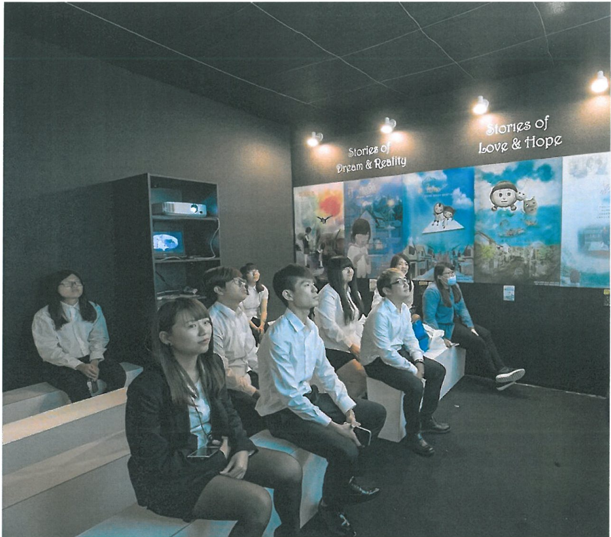
展場設有播放室，提供民眾觀賞學生創作的動畫影片。