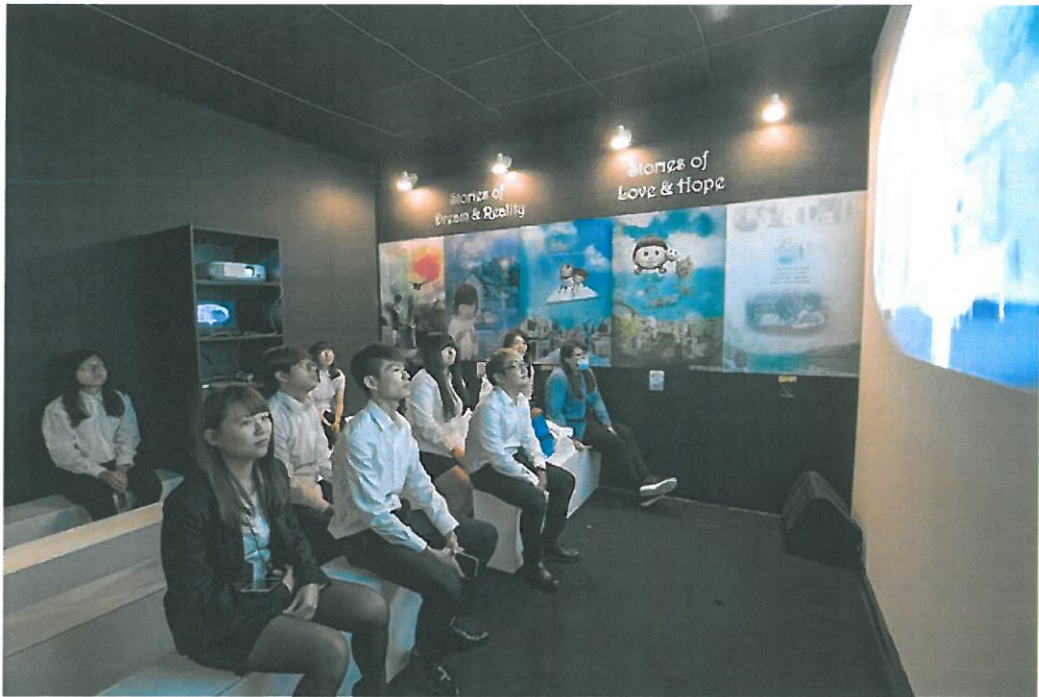
展場設有播放室，提供民眾觀賞學生創作的動畫影片。

設計界年度重要盛會「2017新一代設計展」，5月19日至22日於台北世貿中心1館及3館熱鬧登場。此展覽已邁入第36屆，今年邀集國內外74校、145系設計新秀，展出近4千件創意作品。台南的嘉南藥理大學，雖非屬設計類的專門學校，但已連續參展三年，繼去年有兩項作品入圍「金點新秀贊助特別獎」後，今年更在推廣環保概念的「綠色攤位裝潢競賽」也入選，表現令人驚艷。