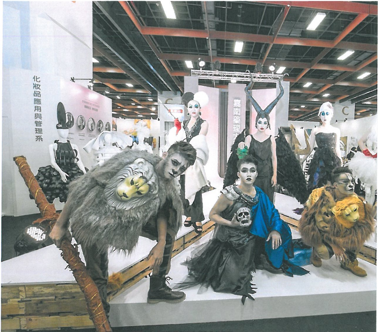
嘉藥粧品系以顛覆童話為主題走秀表演。