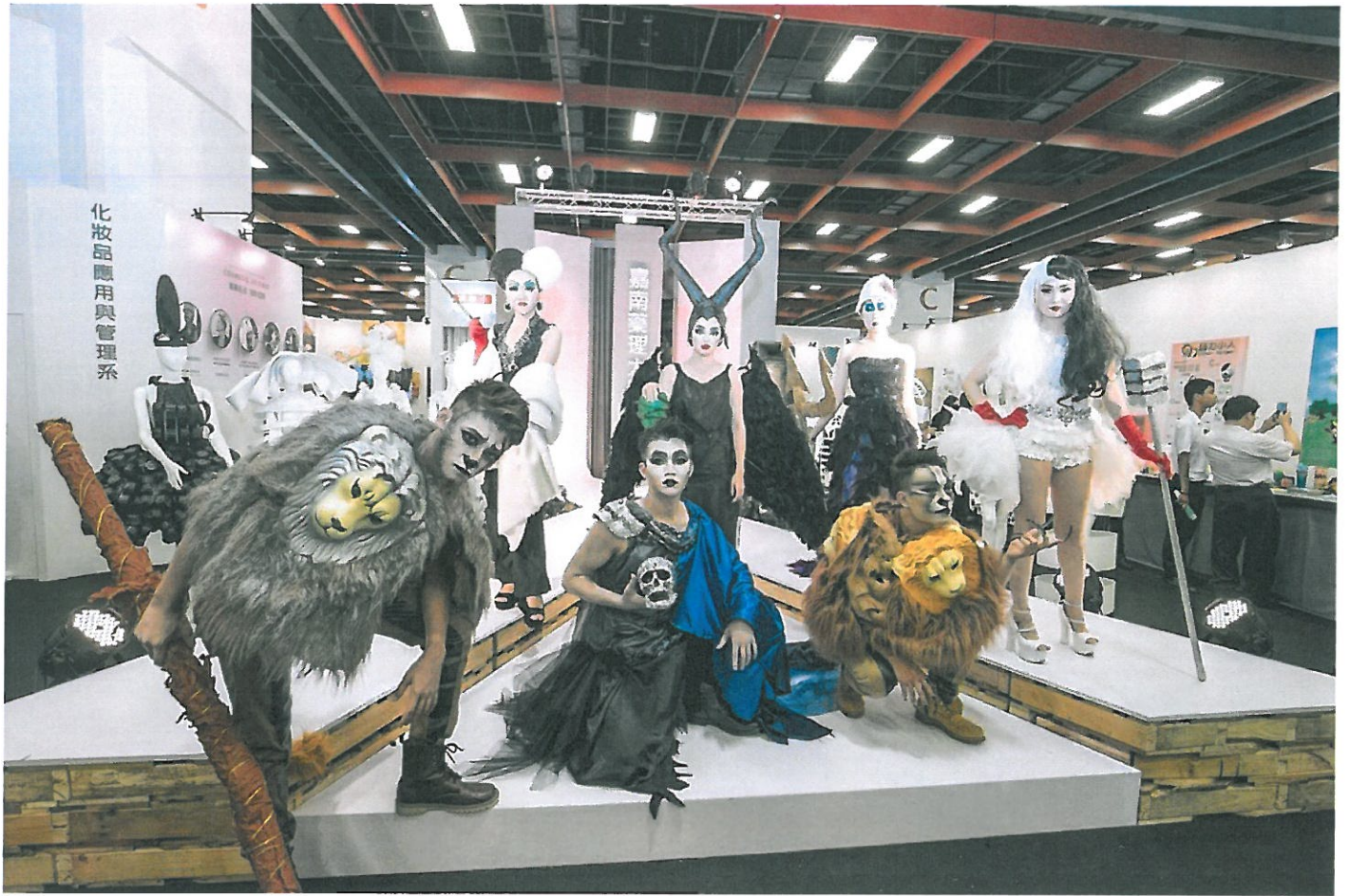
嘉藥粧品系以顛覆童話為主題走秀表演。