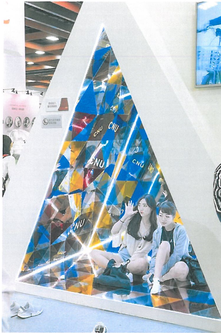
巨型萬花筒提供民眾自拍留念。