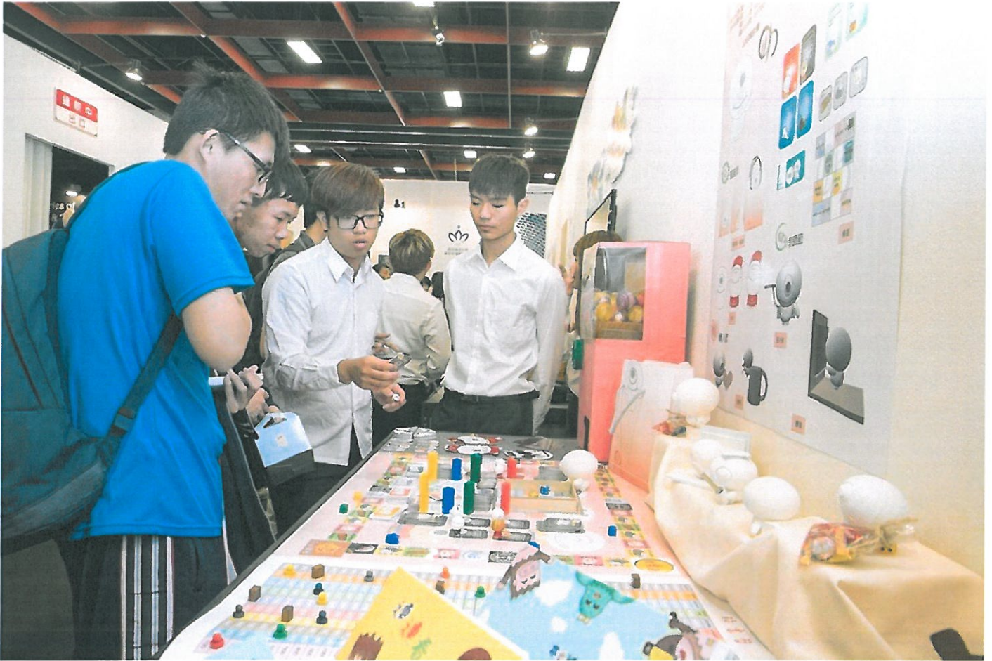
學生向參觀民眾說明創作理念。