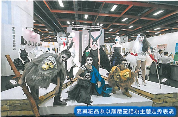
嘉藥粧品系以顛覆童話為主題走秀表演

【記者于郁金/台南報導】已邁入第36屆的設計界年度重要盛會「2017新一代設計展」，5月19日至22日於臺北世貿中心1館及3館熱鬧登場；今年邀集國內外74校、145系設計新秀，展出近4千件創意作品；臺南的嘉南藥理大學，雖非屬設計類的專門學校，但已連續參展3年，繼去年有兩項作品入圍「金點新秀贊助特別獎」後，今年更在推廣環保概念的「綠色攤位裝潢競賽」也入選，表現令人驚詭！