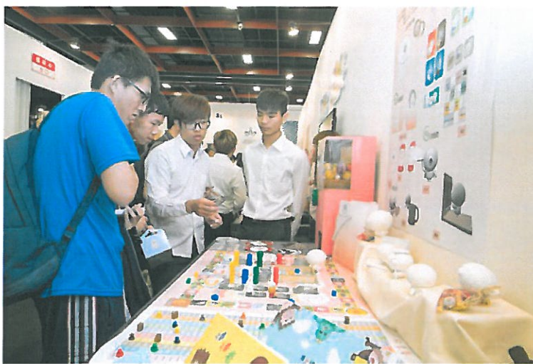
學生向參觀民眾說明創作理念