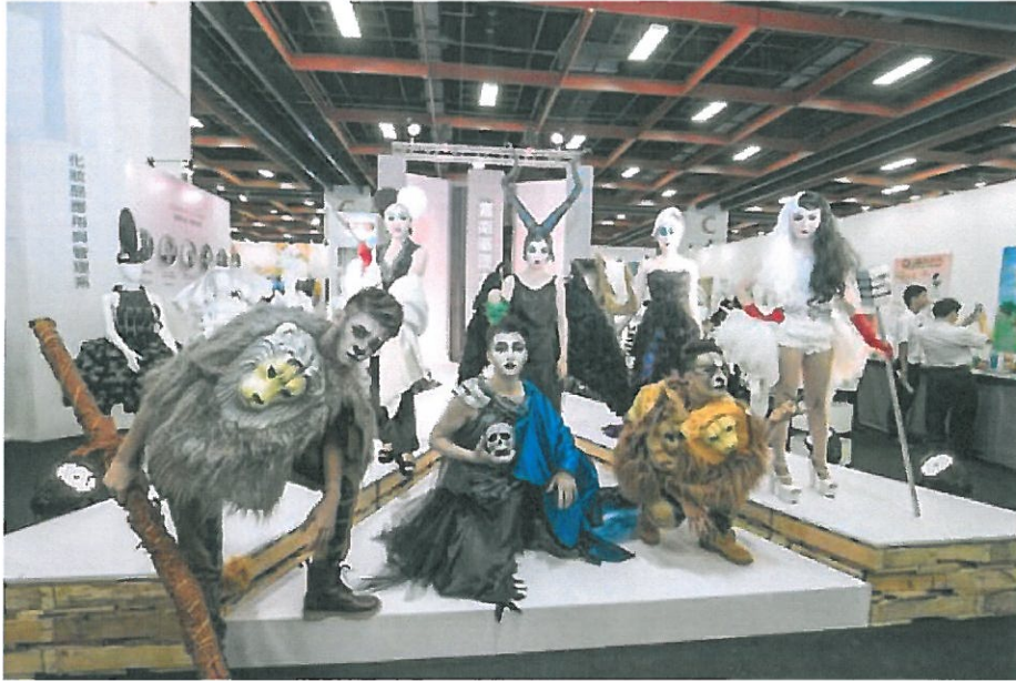
嘉藥粧品系以顛覆童話為主題走秀表演。