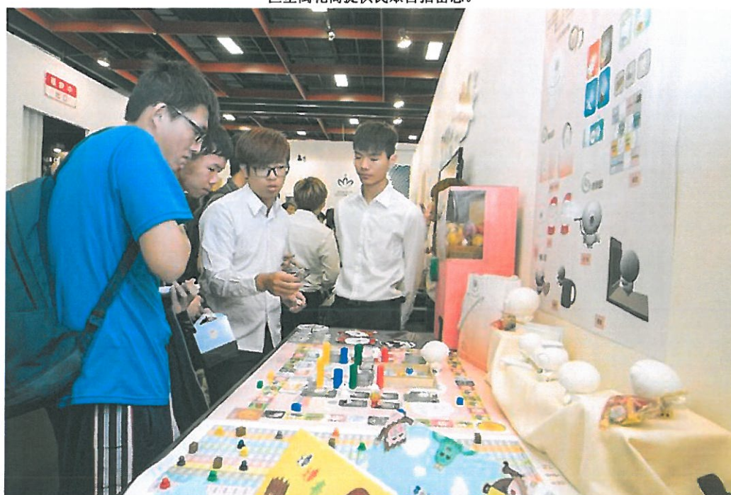
學生向參觀民眾說明創作理念。