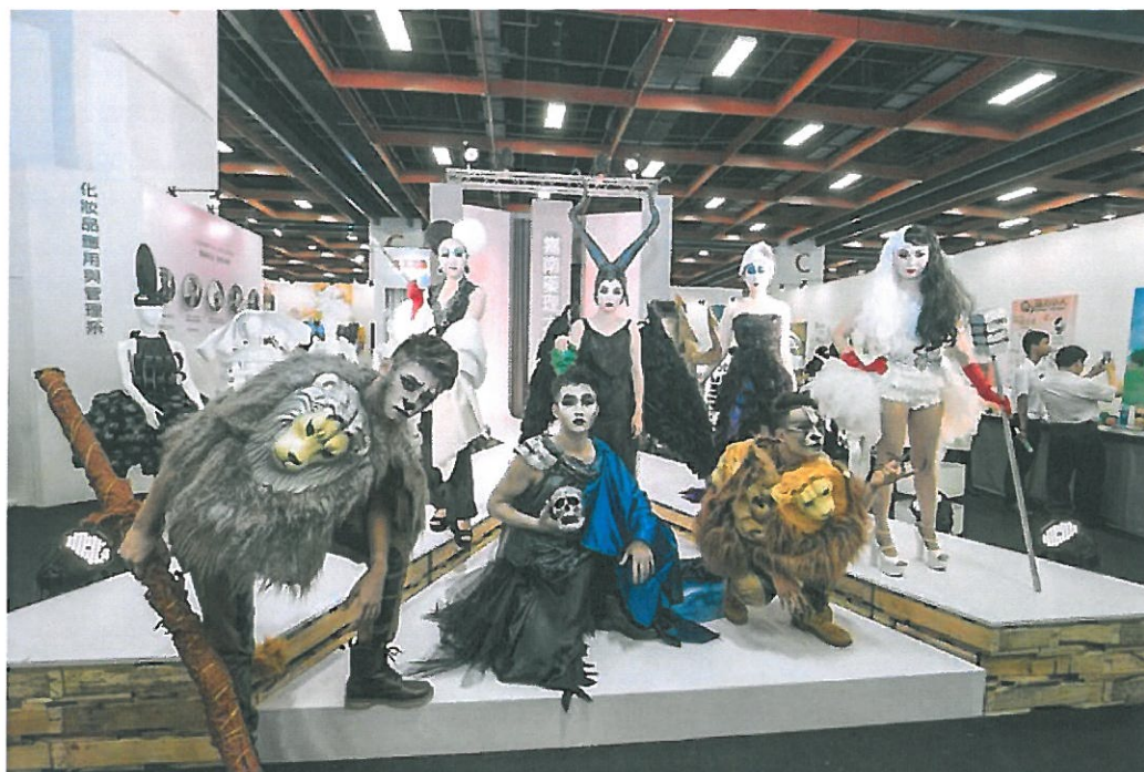
嘉藥粧品系以顛覆童話為主題走秀表演。

http://www.cdnews.com.tw 2017-05-20 18:31:31