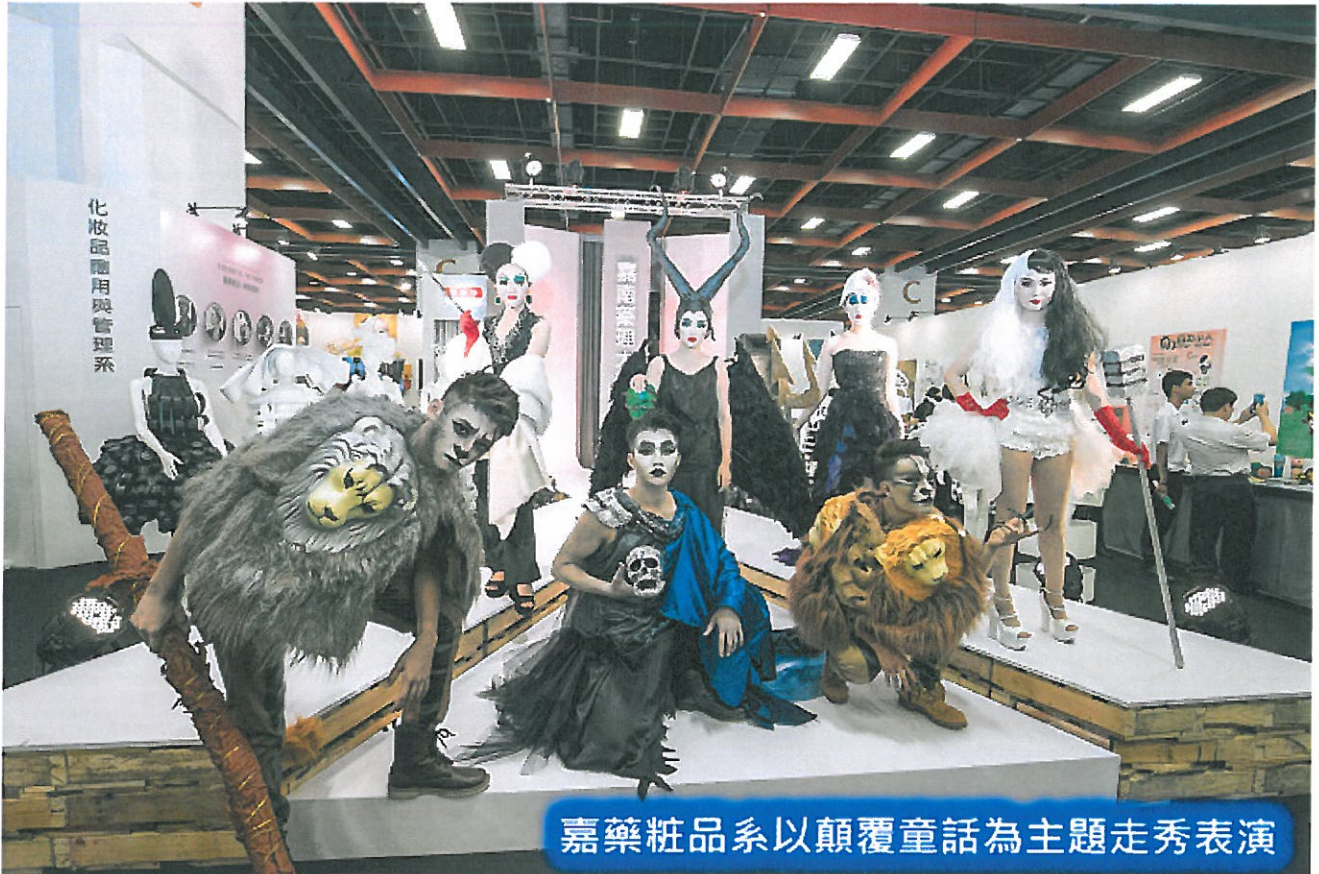
嘉藥粧品系以顛覆童話為主題走秀表演