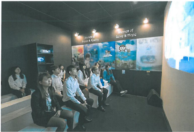
展場設有播放室，提供民眾觀賞學生創作的動畫影片