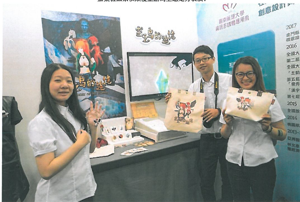
嘉藥學生開心秀出四年所學成果。