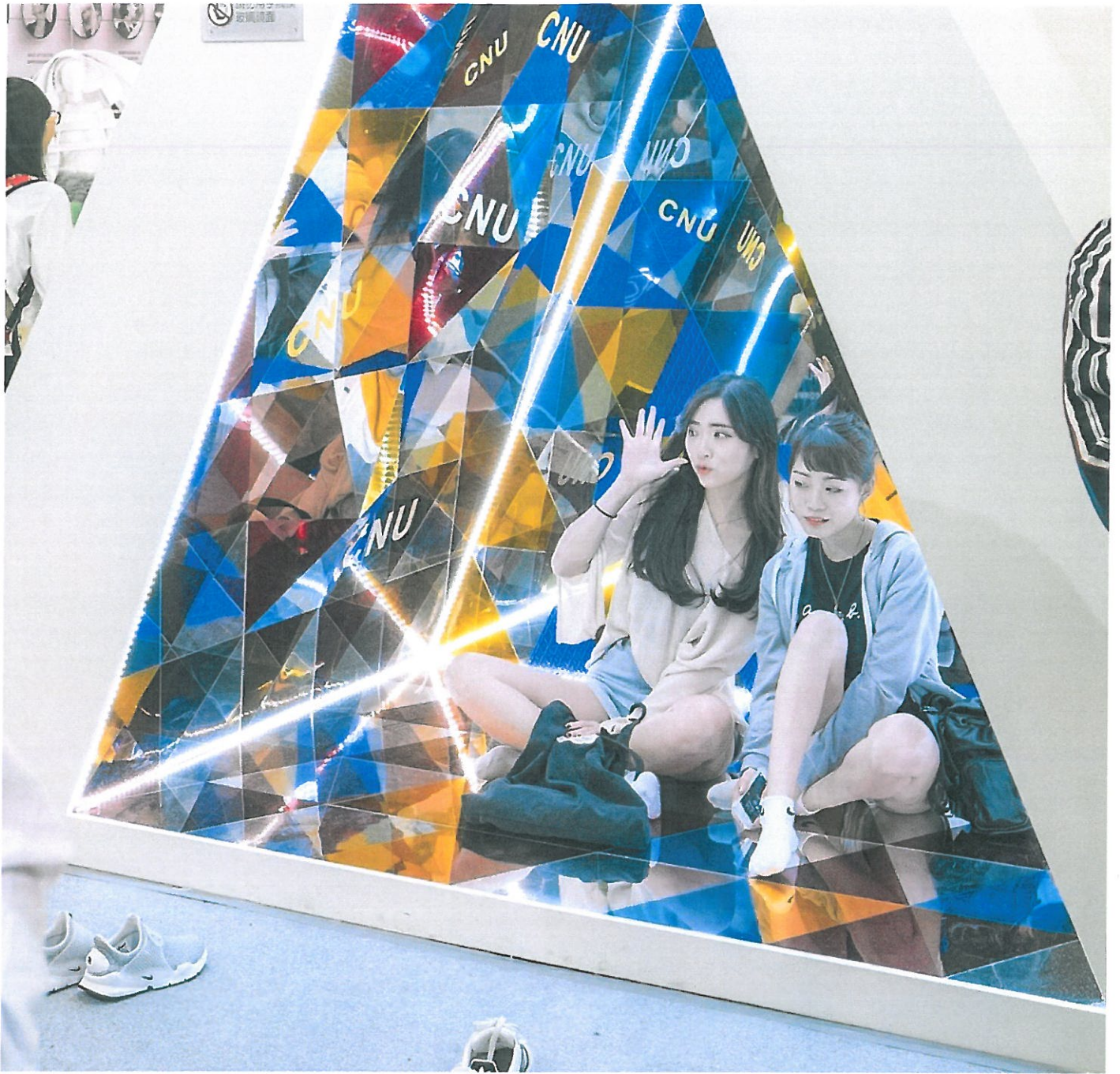
展場巨型萬花筒提供民眾自拍留念。