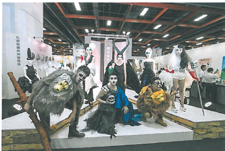
嘉藥禮品系以童話童話為主題走秀表演。