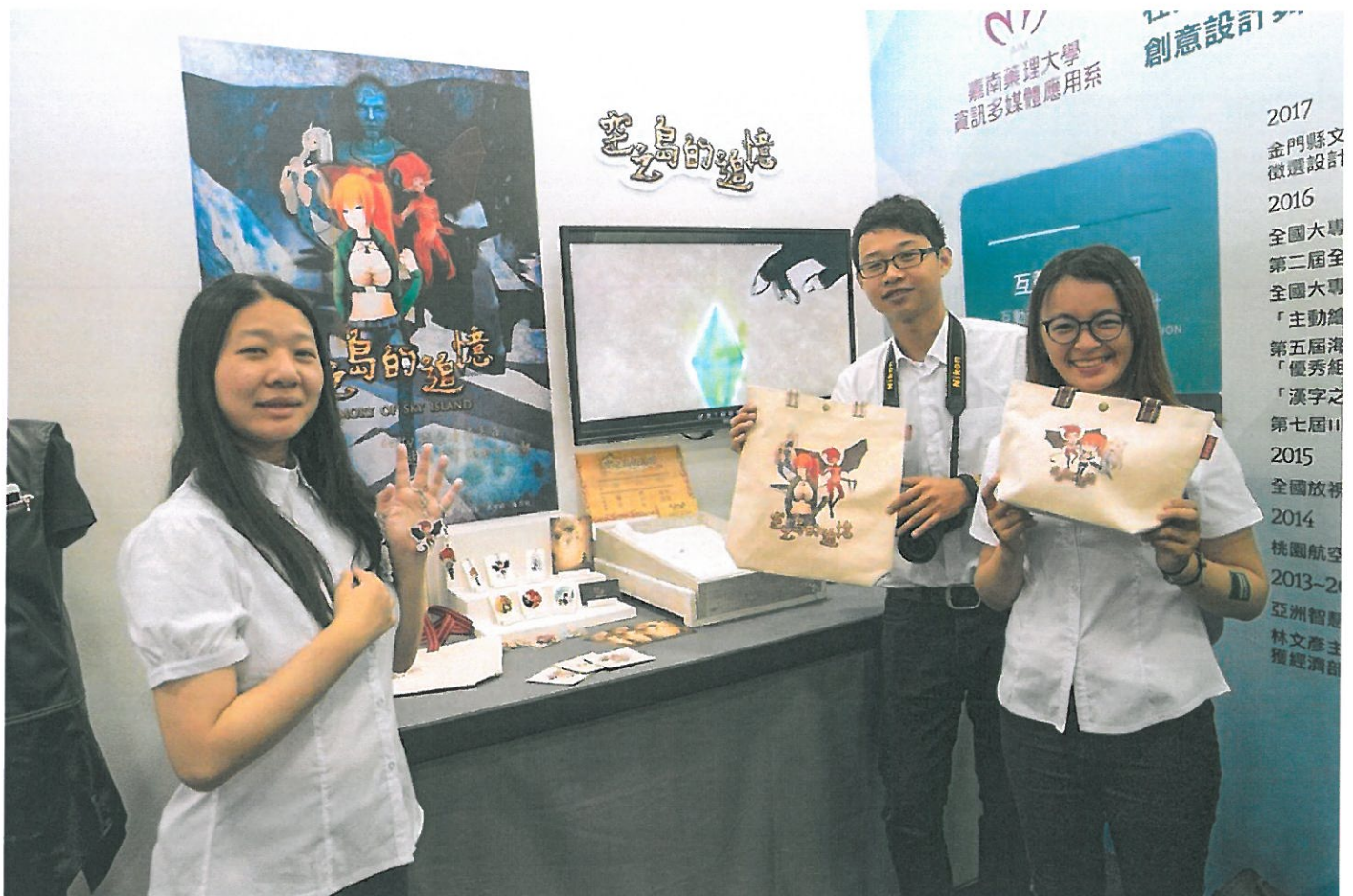
嘉藥學生開心秀出4年所學成果。