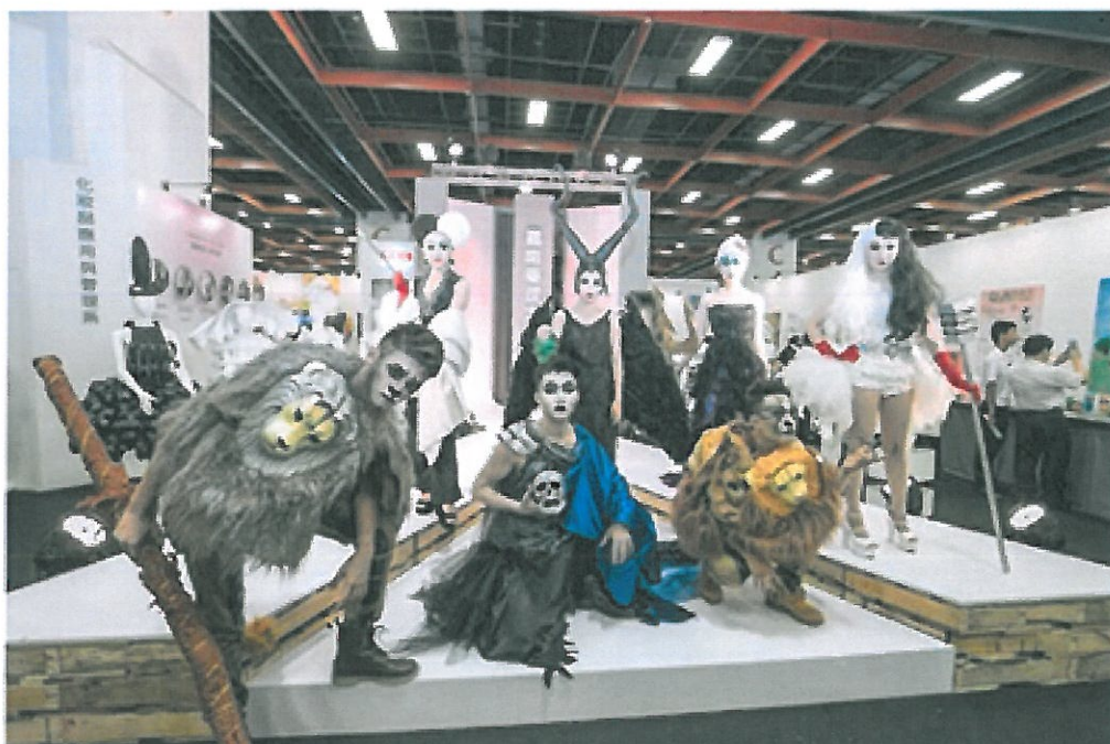
2017新一代設計展中，嘉南藥理大學化粧品應用與管理系以「顛覆童話-刀疤獅子」主題走秀展演。

資訊多媒體應用系規劃遊戲創製、動畫創作及文創開發設計商品三項參展。應用空間資訊系以「找聚點」及「閻超效應」為主題兩項作品皆希望透過建築設計概念，展現環境、建築與人類整合功能性風格，營造嶄新的空間規劃思維。