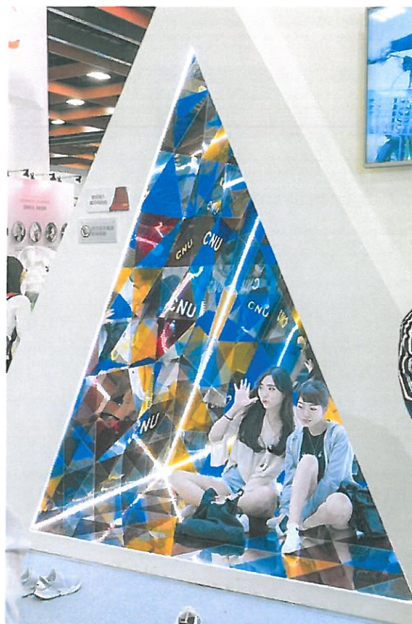
巨型萬花筒提供民眾自拍留念。