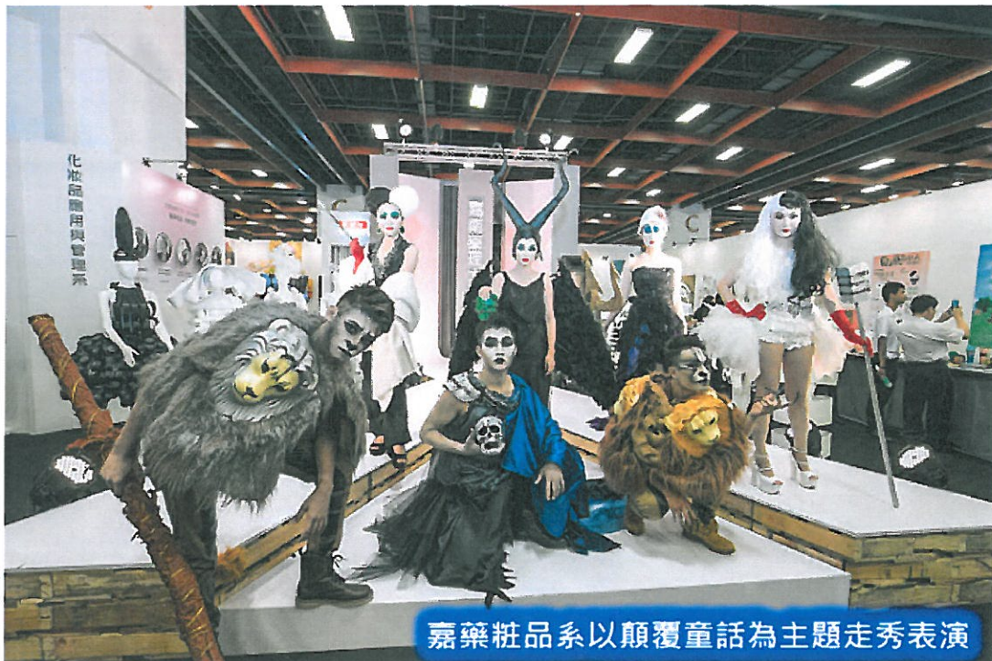
嘉藥粧品系以顛覆童話為主題走秀表演

【記者于郁金/臺北報導】已邁入第36屆的設計界年度重要盛會「2017新一代設計展」，5月19日至22日於臺北世貿中心1館及3館熱鬧登場；今年邀集國內外74校、145系設計新秀，展出近4千件創意作品；臺南的嘉南藥理大學，雖非屬設計類的專門學校，但已連續參展3年，繼去年有兩項作品入圍「金點新秀贊助特別獎」後，今年更在推廣環保概念的「綠色攤位裝潢競賽」也入選，表現令人驚艷！嘉南藥理大學表示，今年參展的有資訊多媒體應用系、資訊管理系、應用空間資訊系，以及化粧品應用與管理系等系共襄盛舉，以「虛&實」為主題，展示共23組作品，參展系所與展品數量為歷年之最，琳瑯滿目，吸睛十足！每件作品實用兼具創新，充分展現學生亮麗的學習成果。