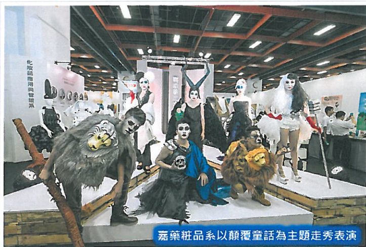
嘉樂粧品系以顛覆童話為主題走秀表演