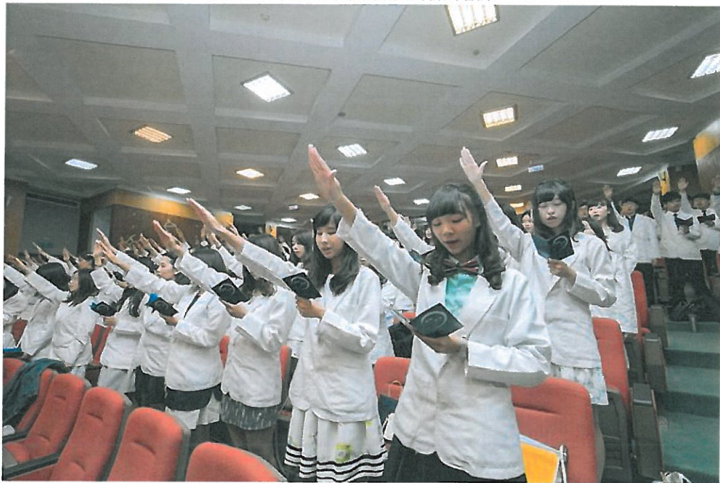
嘉藥藥學生在授袍典禮上宣讀藥師誓詞。

素以藥師搖籃著稱的嘉南藥理大學，創校51年來培育無數藥事人才。5月23日下午，該校藥學系為即將前往醫院實習的藥學生，舉行隆重的授袍典禮，240位學生在眾多貴賓與家長觀禮下，接受師長親自穿上藥師袍，象徵藥學典範的傳承以及任重道遠的期許，勉勵學生都能謹記師長諄諄教誨，並在實習過程中勤奮不懈，虛心學習。