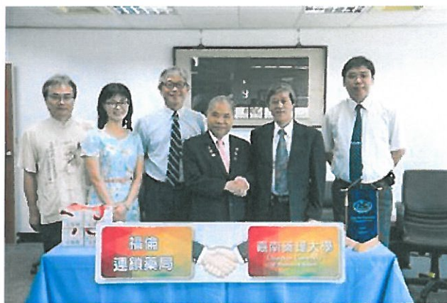
參與「合作意向書」簽署儀式人員合影