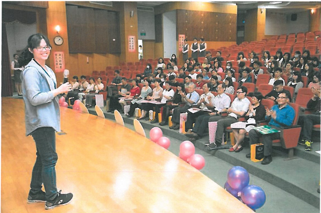
學生代表上台向老師表達感謝之意。

畢業季即將來臨，嘉南藥理大學為了讓畢業生表達對老師濃濃的謝意，特別選在充滿感恩的教孝月，於5月4日中午在該校演藝廳舉辦「感恩奉茶、敬謝師恩」活動，藉此發揚學生敬愛老師、老師關愛學生的倫理精神，培養學子尊師重道的校園文化。