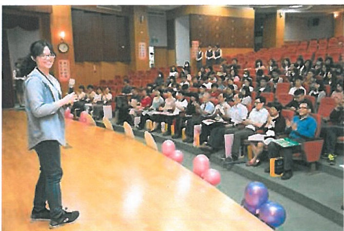
學生代表上台向老師表達感謝之意