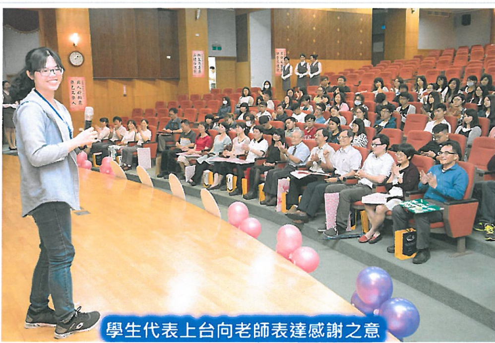
學生代表上台向老師表達感謝之意