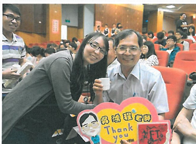
學生奉上「感恩茶」感謝老師辛勞的教導。