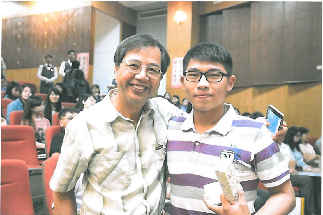
師生感情融洽有如摯友。