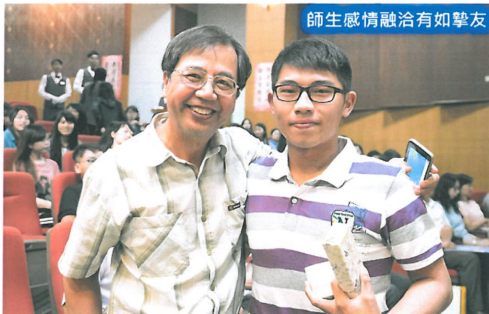
師生感情融洽有如摯友