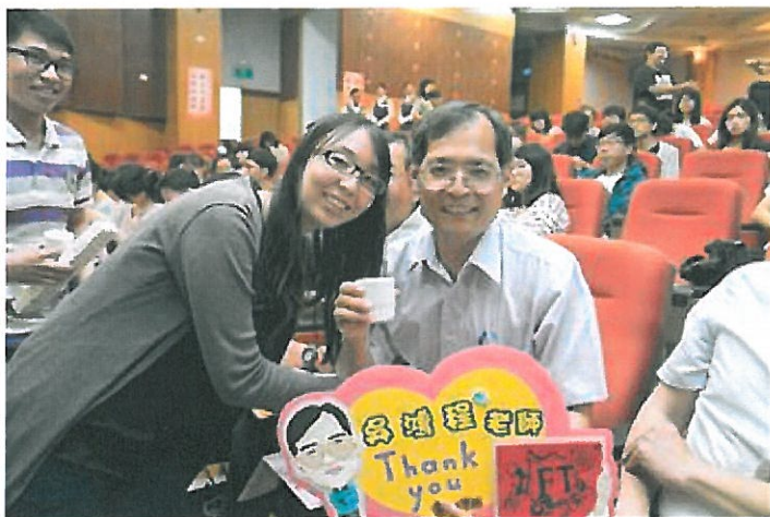
學生奉上「感恩茶」感謝老師辛勞的教導