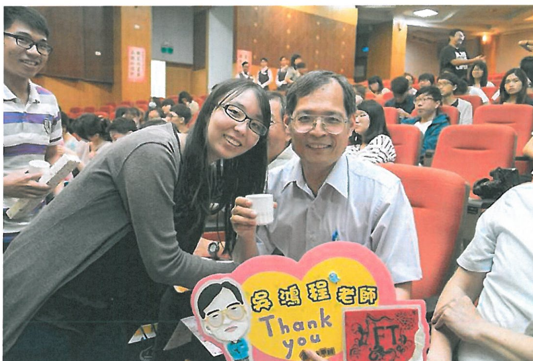
嘉南藥理大學今天舉辦「感恩奉茶」活動。

感謝師恩！嘉南藥理大學為了讓畢業生表達對老師的謝意，選在充滿感恩的教孝月，今天中午舉辦「感恩奉茶、敬謝師恩」，發揚學生敬愛老師、老師關愛學生的倫理精神，培養學子尊師重道的校園文化。