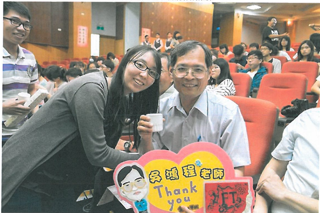
學生奉上「感恩茶」感謝老師辛勞的教導。