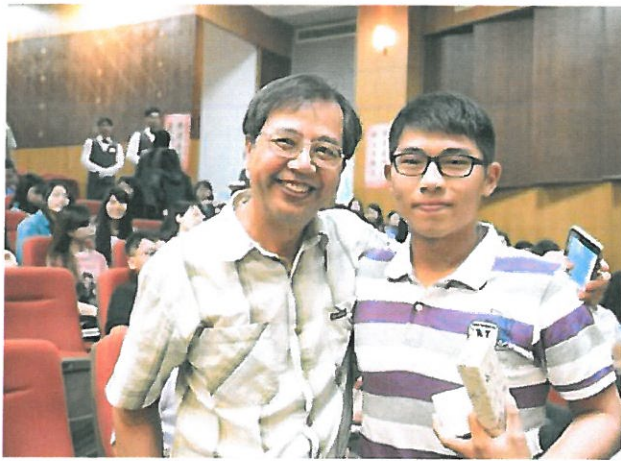
師生感情融洽有如摯友。