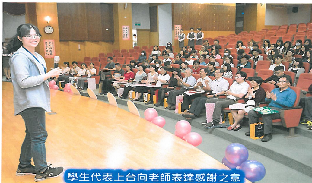
學生代表上台向老師表達感謝之意

【記者于郁金/臺南報導】畢業季即將到來，嘉南藥理大學為感謝師長悉心的指導，精心籌備一場美好的謝師禮，特別選在充滿感恩的教孝月，於5月4日中午在該校演藝廳舉辦「感恩奉茶、敬謝師恩」活動，藉此發揚學生敬愛老師、老師關愛學生的倫理精神，培養學子尊師重道的校園文化。