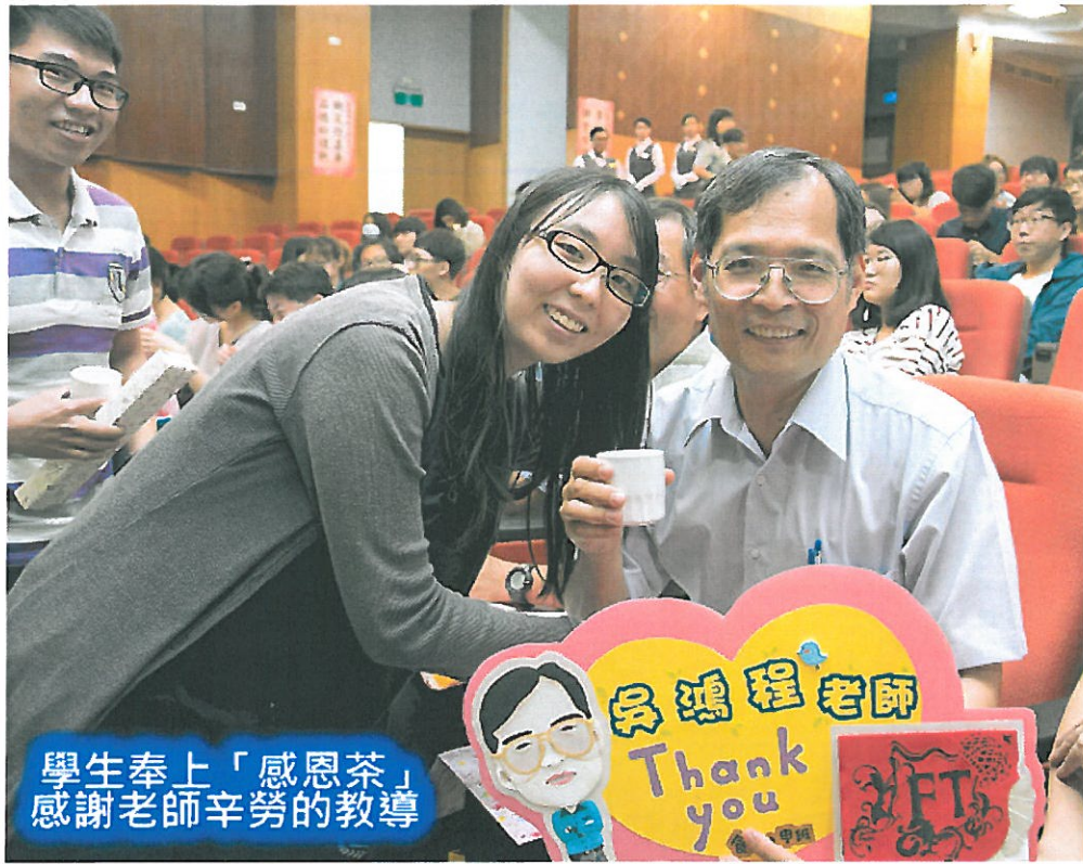
學生奉上「感恩茶」 感謝老師辛勞的教導