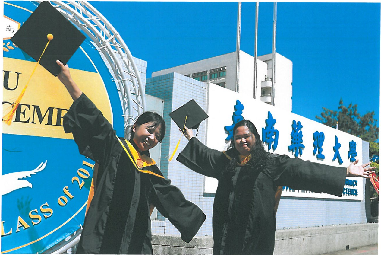
菲籍境外生高興取得碩士雙學位