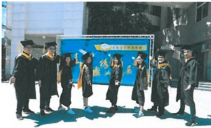
8位泰籍境外生順利取得碩士雙學位