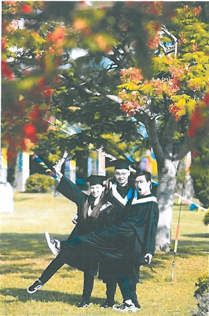
嘉藥應屆畢業生在校園開心留念

段璀璨的旅程；其中有22人為境外生，分別是大學部陸生2位、港澳生2位、印尼與馬來西亞僑生3位，以及來自泰國、菲律賓的碩士生15人，讓今年畢業典禮增添兩岸國際氛圍，也很有新南向的fu。