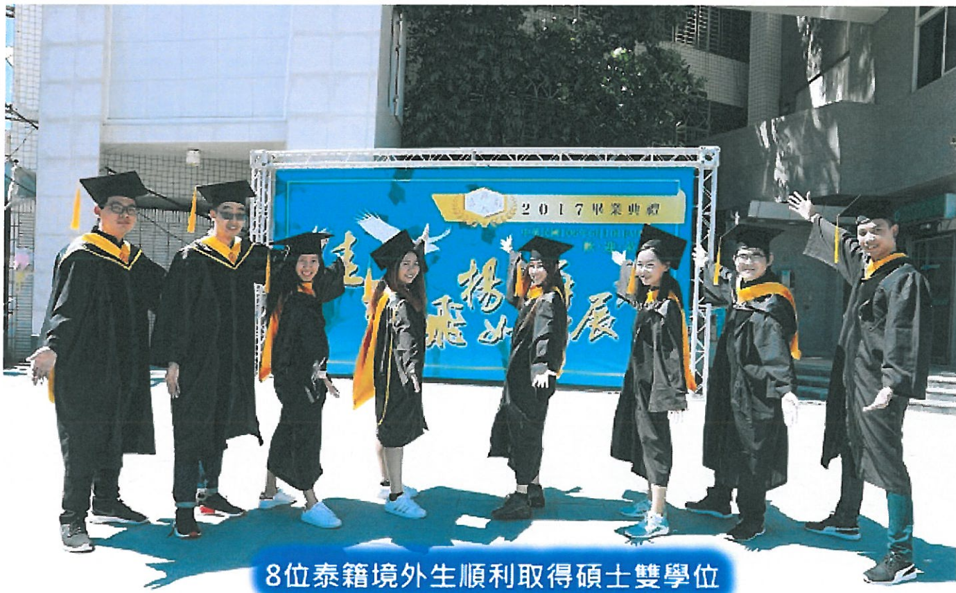
8位泰籍境外生順利取得碩士雙學位