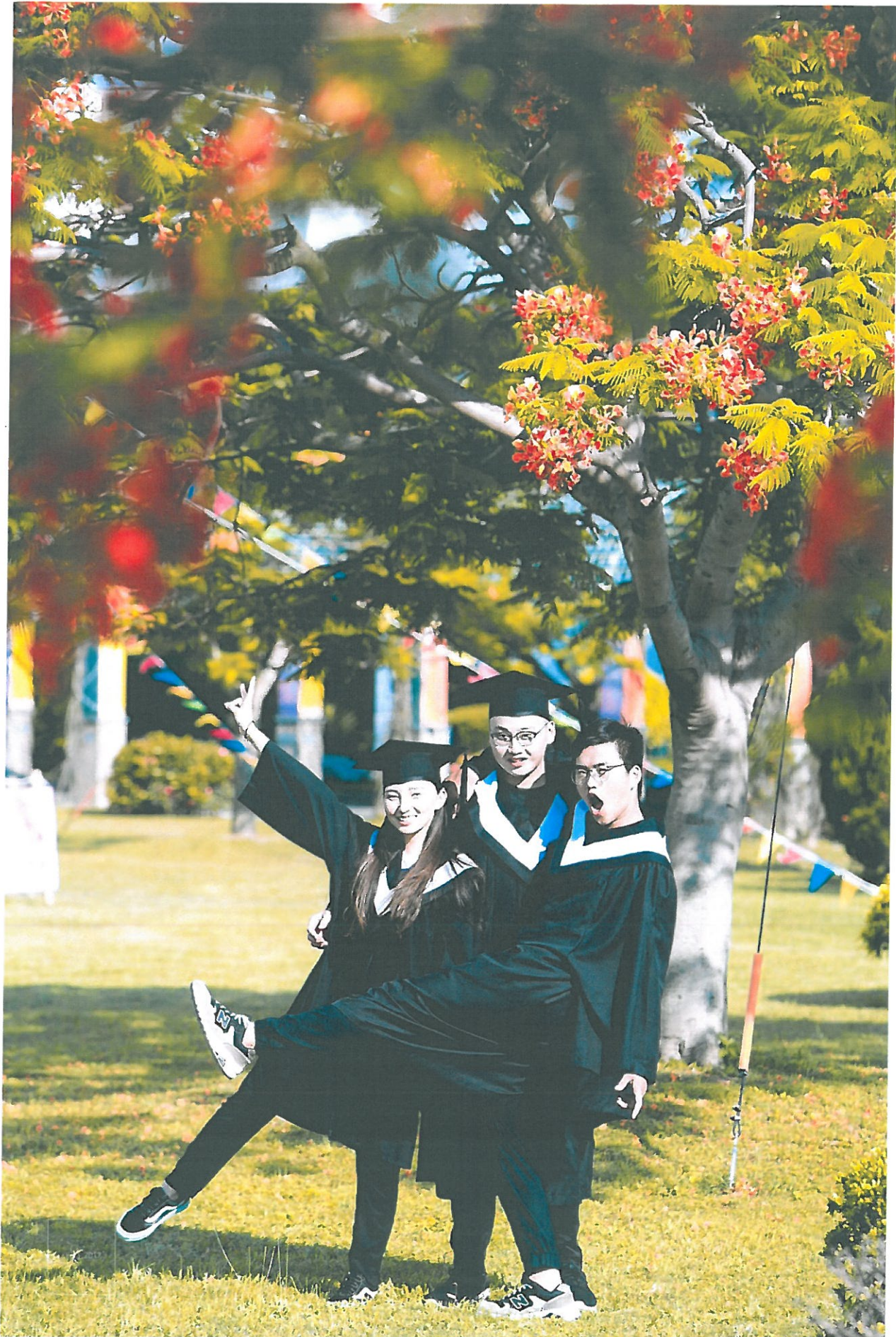
嘉藥應屆畢業生在校園開心留念