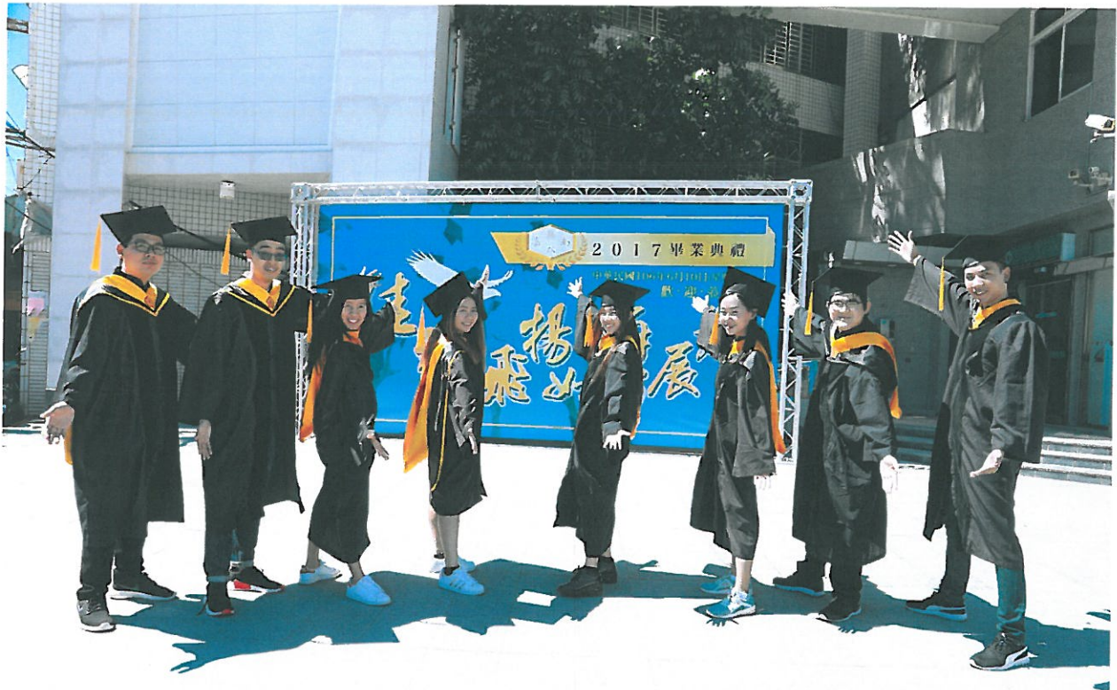
8位泰籍境外生順利取得碩士雙學位