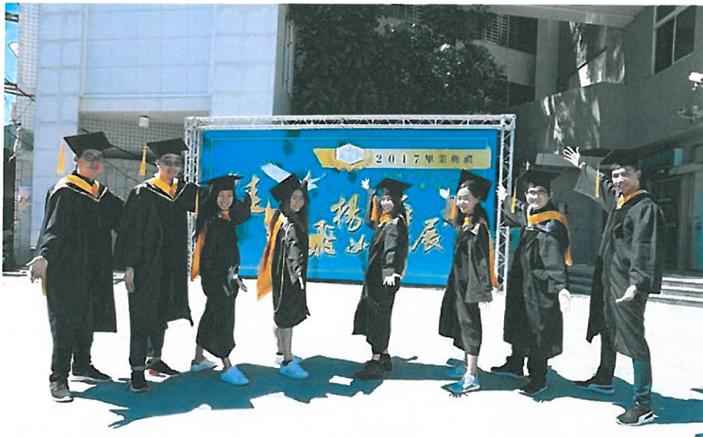
8位泰籍境外生順利取得碩士雙學位。