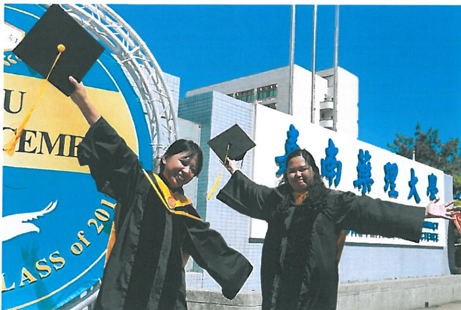
菲籍境外生高興取得碩士學位

校長陳銘田在典禮上致詞勉勵所有畢業生「佳耀飛揚，如鷹展翅」，並本著校訓「真實」精神，凡事力求崇真務實、腳踏實地，不僅擁有專業知能，更要具備未來職場上的軟實力，積極發揮所長，服務社會、貢獻國家。今年包括7對夫妻檔共30位樂齡大學長者畢業之外，總計約有4400位畢業生即將展開人生璀璨旅程，其中，有22人為境外生，分別是大學部陸生2位、港澳生2位、印尼與馬來西亞僑生3位，以及來自泰國、菲律賓的碩士生15人，讓今年畢典增添國際氛圍，讓今年畢典增添兩岸國際氛圍，也很有新南向的fu。