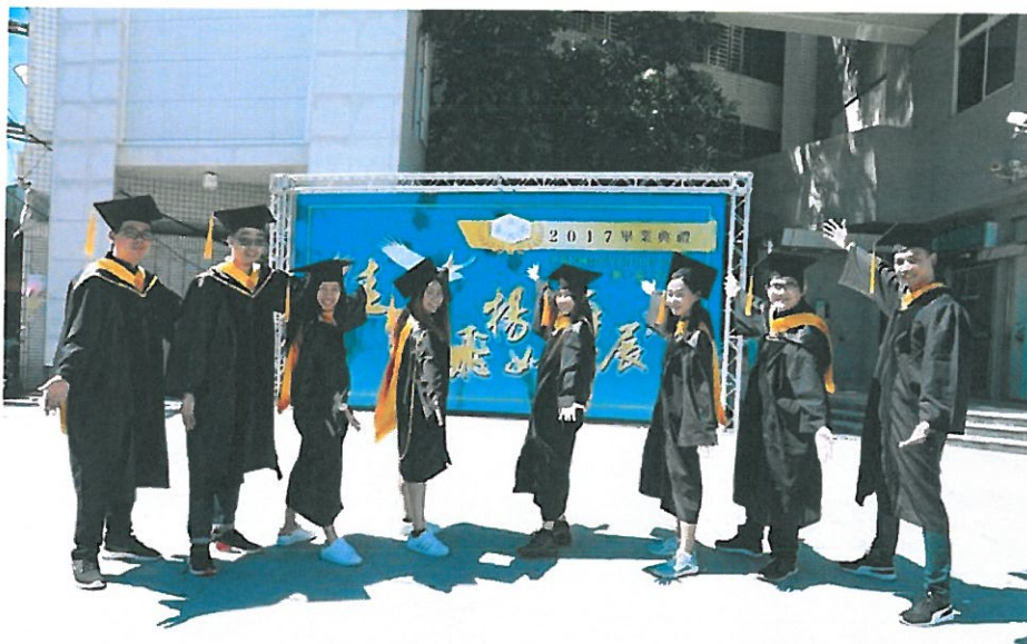
8位泰籍境外生順利取得碩士學位。

http://www.cdnews.com.tw 2017-06-10 20:28:43