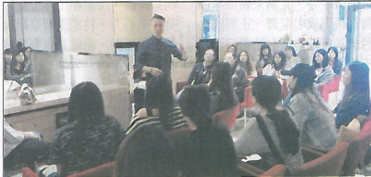
嘉南藥理大學開辦產業學院學程，圖為粧品系學生至企業參訪情形。