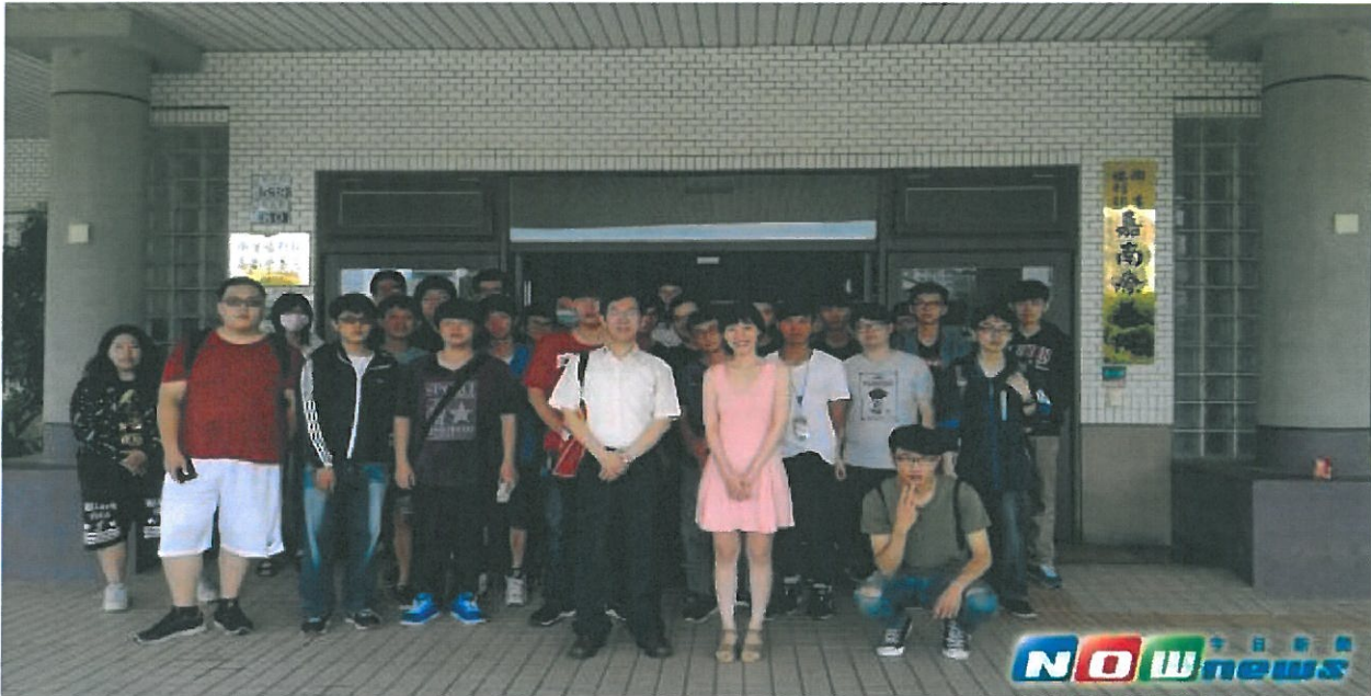
▲嘉南藥理大學就有開辦的產業學院學程專班，提供學生產學連貫的育才課程。

正處畢業熱季，誰說畢業就失業？假如在校做足準備，有機會向業師學習，多參與企業體驗、接觸職場實務，不愁畢業後找不到頭路，甚至在學期間就已被廠商優先錄用，直接就業無縫接軌。