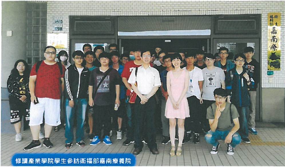
修讀產業學院學生參訪衛福部嘉南療養院