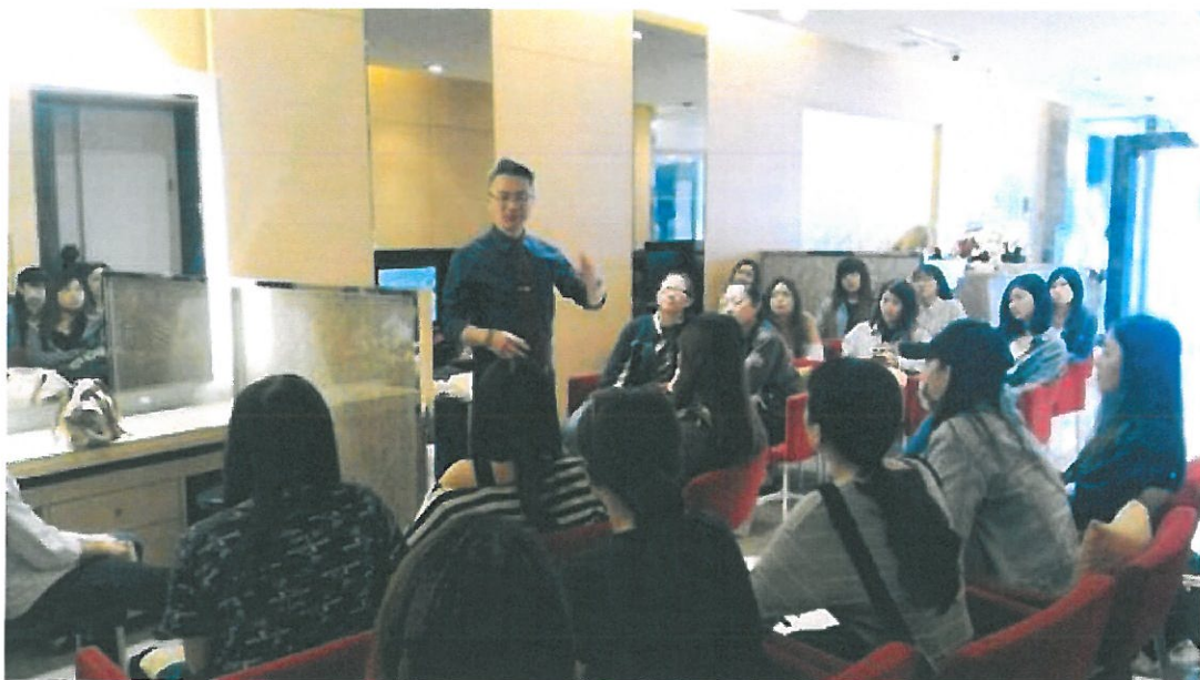
粧品系學生修讀產業學院至企業參訪。