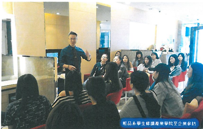
瓶品永學生修讀產業學院至企業參訪

【大成報記者于郁金/臺南報導】正處畢業熱季，誰說畢業就失業？假如在校做足準備，有機會向業師學習，多參與企業體驗、接觸職場實務，不愁畢業後找不到頭路，甚至在學期間就已被廠商優先錄用，直接就業無縫接軌；位於臺南嘉南藥理大學就有開辦這樣的產業學院學程專班，提供學生產學連貫的育才課程，可說是就業保證的金字招牌；日前教育部公佈106新學年度各校申請產業學院結果，該校申請10案學程均全數獲得通過，高居全國之冠。