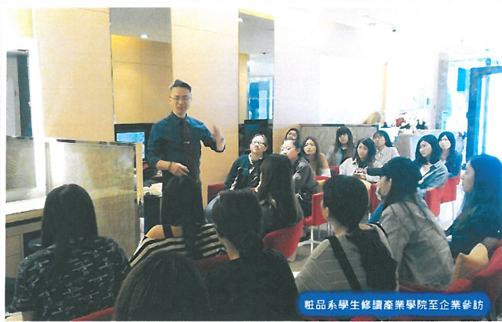
粧品系學生修讀產業學院至企業參訪