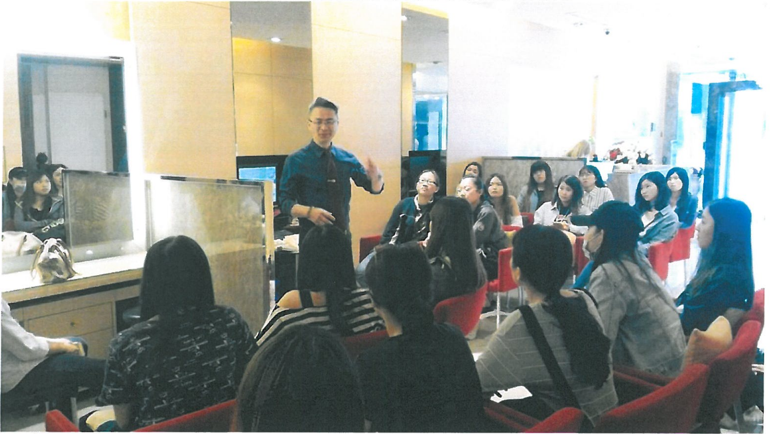
粧品系學生修讀產業學院至企業參訪。