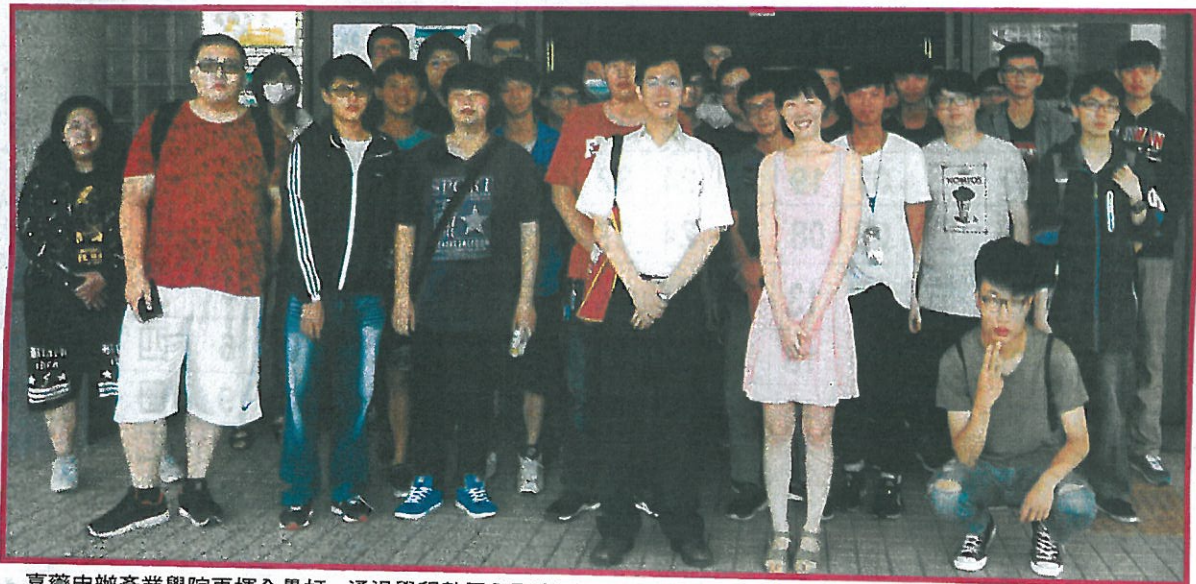
嘉藥申辦產業學院再揮全壘打，通過學程數居全國之冠。

子商務整合」學程專班，他說，一年學習下來讓他大開眼界，對物聯網運用也有更深入的瞭解，這對今年暑期實習將助益甚多；感謝學校提供可學以致用的專班課程，不僅讓他考取證照，也對未來就業更充滿信心。