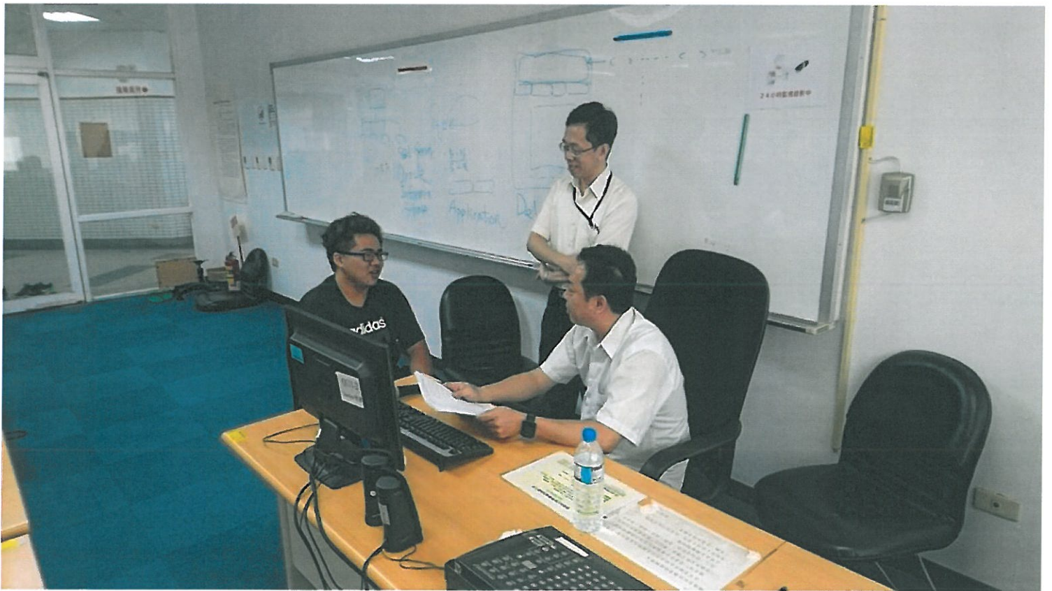
早陽電腦公司工程師面試嘉藥大學資管系學生。