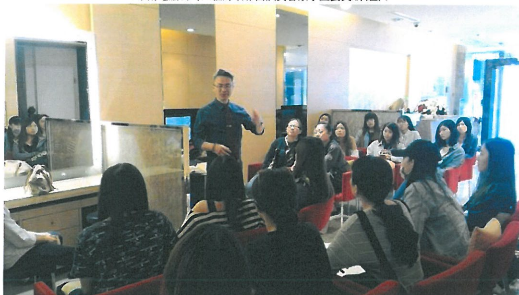
粧品系學生修讀產業學院至企業參訪。