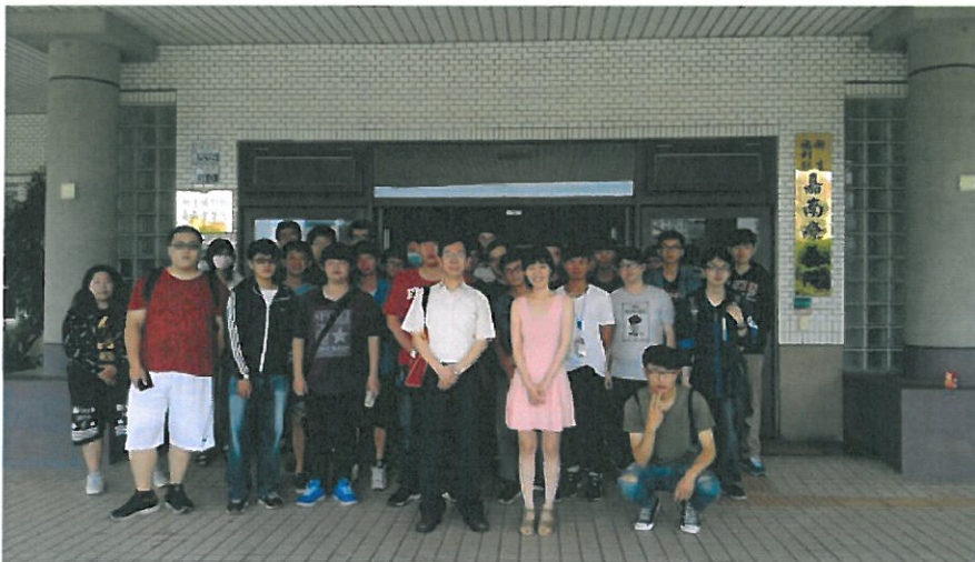
修讀產業學院學生參訪衛福部嘉南藥院

該校106新學年度申辦通過的學程專班，包括：資訊管理系的「智慧生活科技應用」、應用外語系「電子商務與數媒行銷」、環境工程與科學系「環境檢測業技術人才培育」、環境資源管理系「新南向綠色規劃管理專責人員」、保健營養系「營養生技行銷與健康諮詢」、社會工作系「身心障礙服務暨長期照顧督導人才培育」、資訊多媒體應用系「3D原創動畫製片」、化粧品應用與管理系「醫美芳療SPA人才培育」、老人服務事業管理系「專業喪禮服務」，以及醫務管理系的「全人健康產業企劃經營管理人才培育」。