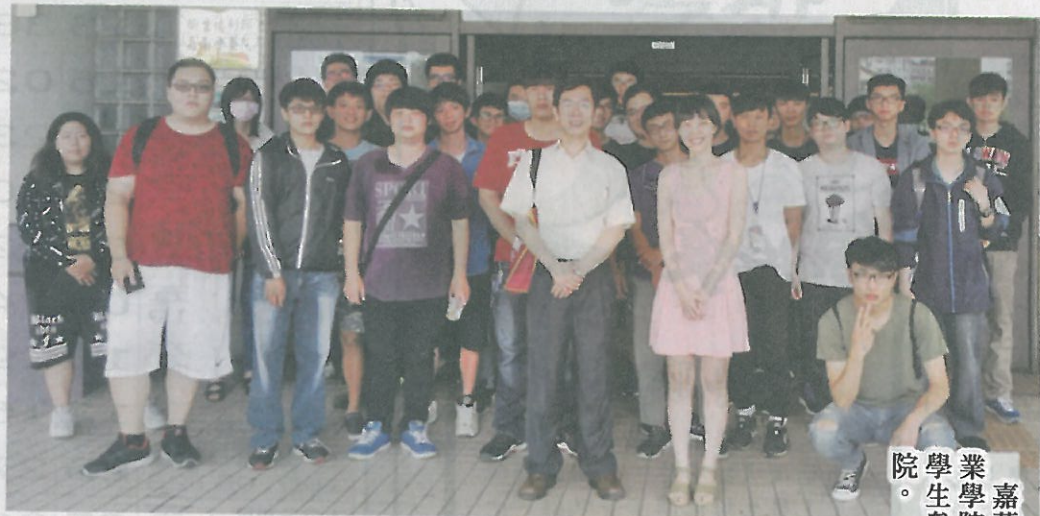
嘉藥率先全國開辦「產業學院學程專班」，學院學生參訪衛福部嘉南療養院。

【記者黃鐘毅／台南報導】教育部推動「產業學院產學共同連貫式培育計畫」，將產學建構一條龍式的培育人才制度，嘉南藥理大學率全國開辦「產業學院學程專班」，提供學生產學連貫的育才課程，日前教育部公佈一〇六新學年度各校申請產業學院結果，嘉藥申請十案學程均全數獲得通過，高居全國之冠。