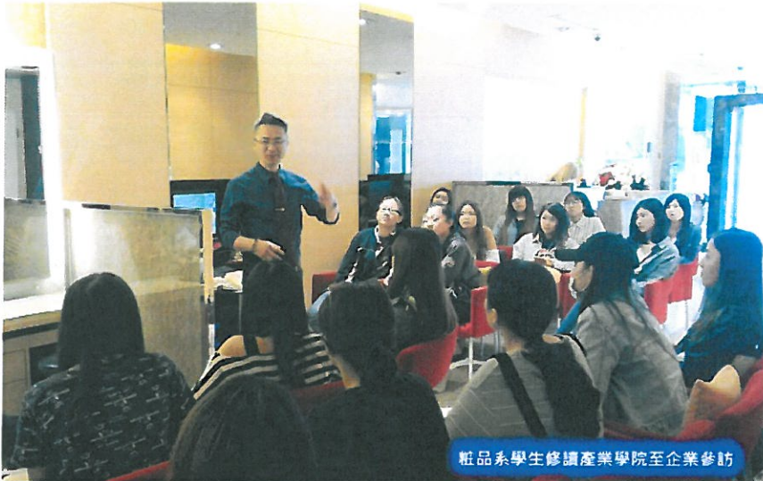
粧品系學生修讀產業學院至企業參訪