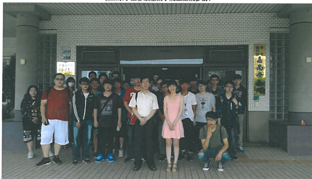
修讀產業學院學生參訪衛福部嘉南療養院。