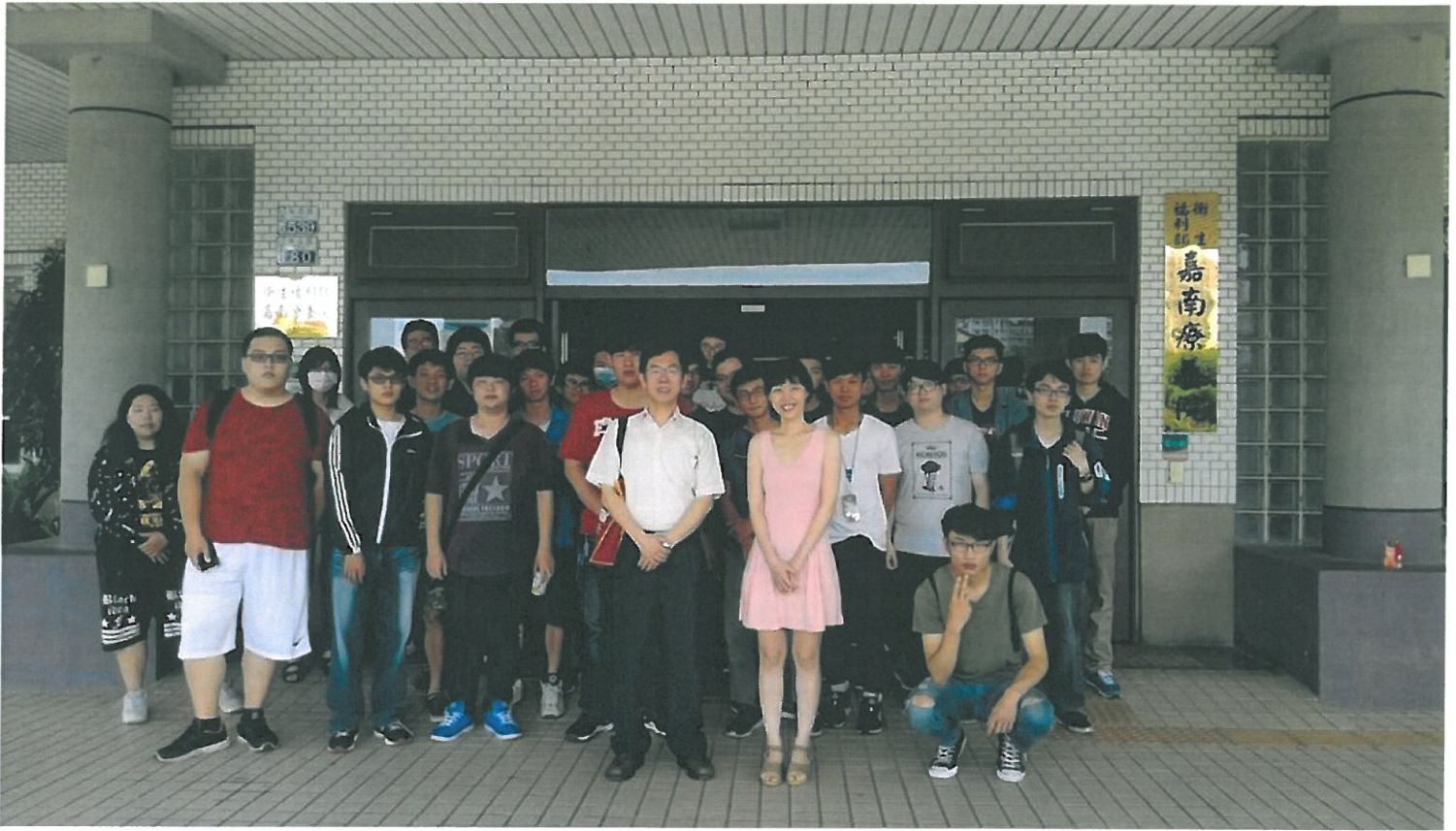
修讀產業學院學生參訪衛福部嘉南療養院。